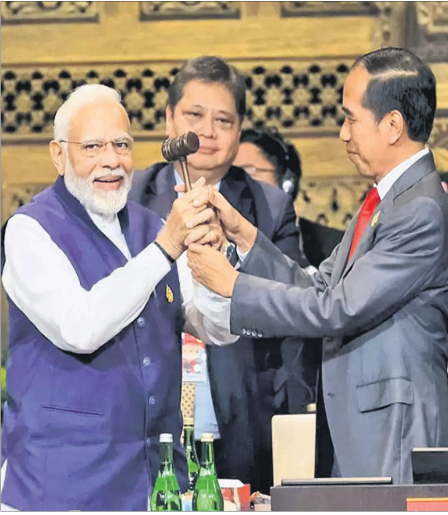
ବାଲିରେ ଲିମ୍ବୁ ଅବସରରେ ରୁଧିରୀର ଅଧ୍ୟକ୍ଷତା ହସ୍ତାନ୍ତର ଉତ୍ସବରେ ପ୍ରଧାନମନ୍ତ୍ରୀ ନରେନ୍ଦ୍ର ମୋଦି ଲକ୍ଷ୍ମଣେସିଆ ରାଷ୍ଟ୍ରପତି ଲୋକେ ଡିଡ଼ୋଡ଼ୋକାଠାରୁ ଅଧ୍ୟକ୍ଷତା ଗ୍ରହଣ କରୁଛନ୍ତି।