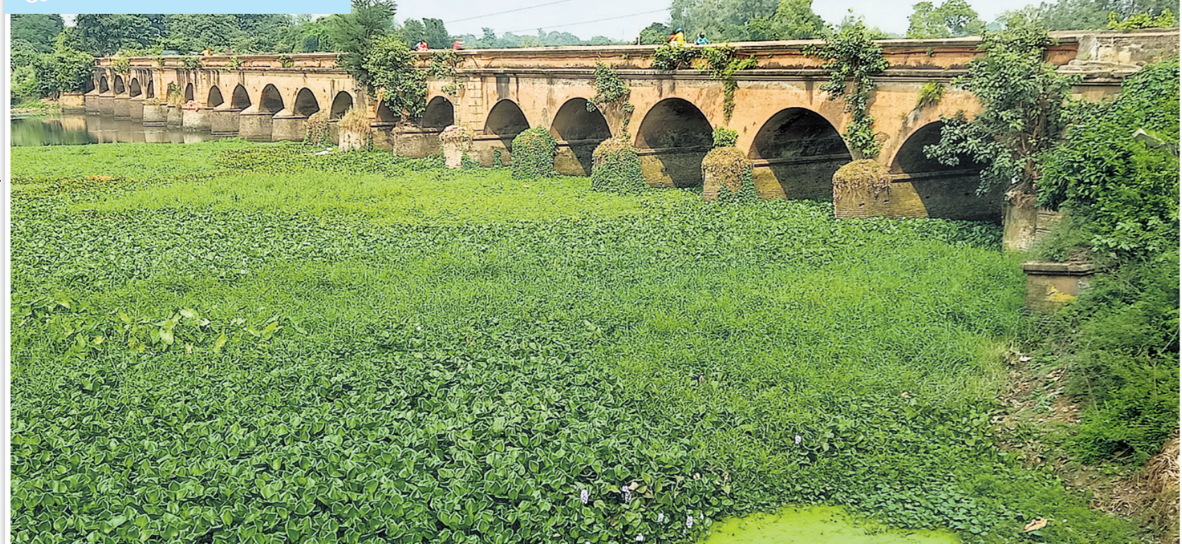
ବାଲେଶ୍ୱର ପୌରାଞ୍ଚଳର ୩୧ନଂ. ଖାଡ଼ି ଛୁଟ ଅରଡ଼କଦାର ନିକଟସ୍ଥ ନୁଣିଆଯୋଡ଼ି ପୋଲ ହରିପୁର ଛକଠାରୁ ମୁକ୍ତିଦ୍ୱାର ପର୍ଯ୍ୟନ୍ତ ଲମ୍ବିଛି। ବ୍ରିଟିଶ୍ ଅମଳରୁ ତିଆରି ହୋଇଥିବା ଏହି ପୋଲର ଉଭୟ ପାର୍ଶ୍ୱରେ ଗଛ ଭଳିବା ସହ ଫାଟ ସୃଷ୍ଟି ହୋଇଛି। ବିପଦ ସଙ୍କୁଳ ଅବସ୍ଥାରେ ପ୍ରତିଦିନ ହଜାର ହଜାର ଲୋକ ତଥା ଭାରିଯାନ ଏହି ପୋଲ ଦେଇ ଯା' ଆସ କରୁଛନ୍ତି।

ନଦୀ ଉପରେ ତିଆରି ହୋଇଛି ସେତୁ। ହରିଛି ବିପଦପୂର୍ଣ୍ଣ ନୌଯାତ୍ରାର ଯନ୍ତ୍ରଣା। ସହରରେ ନିର୍ମିତ ଫ୍ଲାଏ ଓଭର ପାଇଁ କମିଛି ଭିଡ଼। ବର୍ଷ ବର୍ଷ ଧରି ବ୍ୟବହୃତ ବ୍ୟସ୍ତବହୁଳ ଟ୍ରିକଗୁଡ଼ିକ କିଛି ଏବେ ଆଉ ସୁରକ୍ଷିତ ହୋଇ ରହିନାହିଁ। ବ୍ରିଟିଶ୍ ଅମଳର ପୋଲଗୁଡ଼ିକ କରାକାର୍ଯ୍ୟ ଅବସ୍ଥାରେ। ୩୦-୪୦ ବର୍ଷ ପୁରୁଣା ସେତୁର ସୁରକ୍ଷା ବାଡ଼ି ଭାଙ୍ଗି ମୁକୁଳା ପଡ଼ିଛି। ଦୁର୍ବଳ ସାନ୍ ପାଇଁ ମାଲବାହୀ ଗାଡ଼ି ଯିବା ବେଳେ ଦୋହଲୁଛି। ରକ୍ଷଣାବେକ୍ଷଣ ଅଭାବରୁ ବଡ଼ ବଡ଼ ଗଛରେ ପରିପୂର୍ଣ୍ଣ ହୋଇ ଫ୍ଲାଏ ଓଭର ଫାଟି ଥା' କଲାଣି। ଆଗ୍ରୋୱ ରୋଡ଼ରେ ବିରାଟକାୟ ଗର୍ଭ ପାଇଁ ବଡ଼ ଧରଣର ଦୁର୍ଘଟଣା ଆଶଙ୍କାକୁ ଏଡ଼ାଇ ଦିଆଯାଇପାରୁନାହିଁ। ଓଡ଼ିଶାରେ ଏବେ ଏଭଳି ଦୃଶ୍ୟ ସଡ଼କପଥରେ ସୁରକ୍ଷିତ ଯାତ୍ରା ଓ ପରିବହନ ବ୍ୟବସ୍ଥା ପ୍ରତି ଅକ୍ଳାନ୍ତି ନିର୍ଦ୍ଦେଶ କରୁଛି। ଏଠାରେ ବିପଦସଙ୍କୁଳ ଅବସ୍ଥାରେ ଥିବା କେତେକ ପୋଲ ଓ ଫ୍ଲାଏଓଭରର ଚିତ୍ର ପ୍ରଦର୍ଶନ କରାଗଲା।