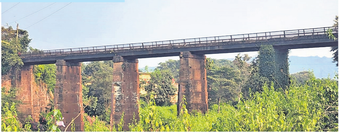
ବଡ଼ ପୋଲିଆ ପୋଲ କେନ୍ଦୁଝର ଜିଲ୍ଲା ପଶ୍ଚିମ ଯୋଡ଼ାରୁ କୁନ୍ଦୁର ନାଳାକୁ ସଂଯୋଗ କରୁଛି। ୧୯୪୮ ପୂର୍ବରୁ ଖଣିକ ପରିବହନ ନିମନ୍ତେ ତା'ର କମ୍ପାନୀ ଏହାକୁ ନିର୍ମାଣ କରିଥିଲା। ପରବର୍ତ୍ତୀ ସମୟରେ ଏଥିରେ ଜନସାଧାରଣ ଯାତାୟାତ କରିଆସୁଛନ୍ତି। ଏହା ଉପରେ ନିର୍ମିତ ହୋଇଥିଲା। ଯୋଡ଼ା ଅଞ୍ଚଳର ସର୍ବପୁରାତନ ପୋଲ ହୋଇଥିବା ବେଳେ ବର୍ତ୍ତମାନ ଏଥିରେ ଗଛକଟା ଭଳି କରାକାର୍ଯ୍ୟ ଅବସ୍ଥାରେ ରହିଛି।