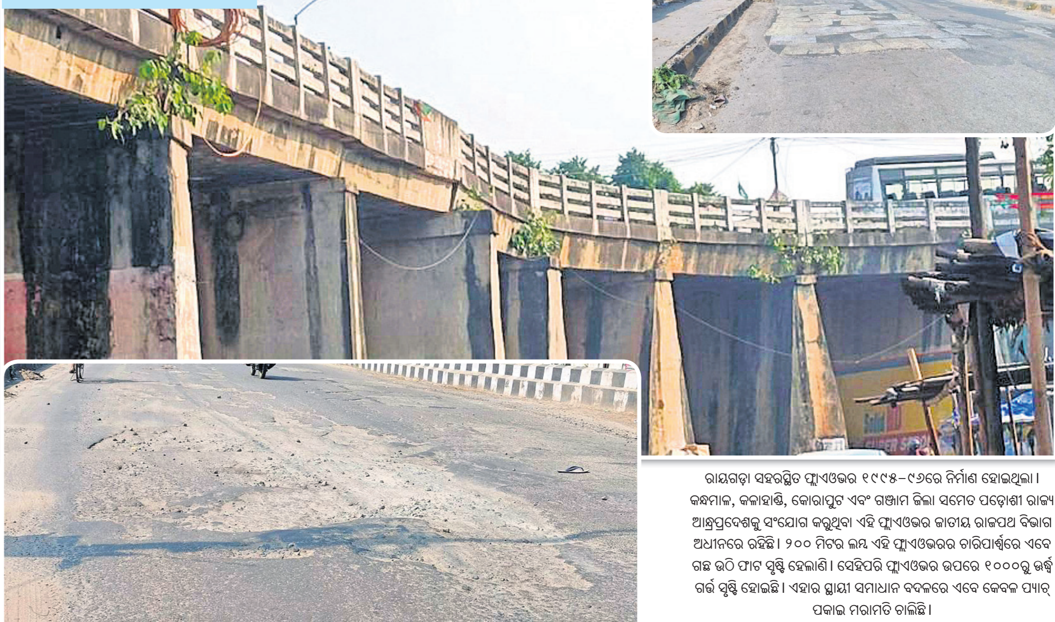
ରାୟଗଡ଼ା ସହରସ୍ଥିତ ଫ୍ଲାଏଓଭର ୧୯୯୫-୯୬ରେ ନିର୍ମାଣ ହୋଇଥିଲା। କନ୍ସଟ୍ରକ୍ସନ, କଳାହାଣ୍ଡି, ଭୋରାପୁଟ ଏବଂ ଗଞ୍ଜାମ ଜିଲ୍ଲା ସମେତ ପଡ଼ୋଶୀ ରାଜ୍ୟ ଆନ୍ତର୍ଗ୍ରାହ୍ୟକୁ ସଂଯୋଗ କରୁଥିବା ଏହି ଫ୍ଲାଏଓଭର ଜାତୀୟ ରାଜପଥ ବିଭାଗ ଅଧୀନରେ ରହିଛି। ୨୦୦ ମିଟର ଲମ୍ବ ଏହି ଫ୍ଲାଏଓଭରର ଚାରିପାର୍ଶ୍ୱରେ ଏବେ ଗଛ ଭଳି ଫାଟ ସୃଷ୍ଟି ହେଲାଣି। ସେହିପରି ଫ୍ଲାଏଓଭର ଉପରେ ୧୦୦୦ରୁ ଊର୍ଦ୍ଧ୍ୱ ଗର୍ଭ ସୃଷ୍ଟି ହୋଇଛି। ଏହାର ସ୍ଥାୟୀ ସମାଧାନ ବଦଳରେ ଏବେ କେବଳ ପ୍ୟାଟ୍ ପକାଇ ମରାମତି ଚାଲିଛି।