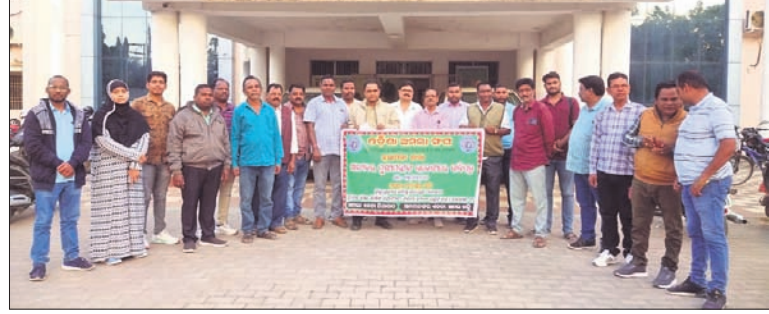
ଜିଲ୍ଲାପାଳଙ୍କୁ ଦାବିପତ୍ର ଦେବାକୁ ଆସିଥିବା ଅମଳା ସଂଘ ।

ନୂଆପଡ଼ା ଜିଲ୍ଲା ଶାଖା ଅମଳା ପକ୍ଷରୁ ଜିଲ୍ଲାପାଳଙ୍କୁ ପୁଣ୍ୟମନ୍ତ୍ରାଳୟ ଉଦ୍ଦେଶ୍ୟରେ ଦାବିପତ୍ର ପ୍ରଦାନ କରାଯାଇଛି ।