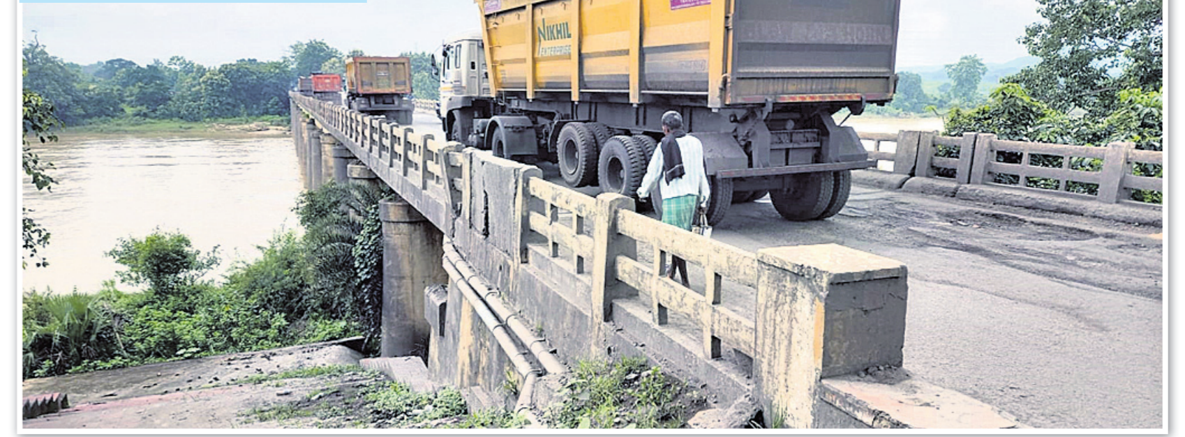
ସୁନ୍ଦରଗଡ଼-ହେମବିରି ଏମ୍ପାୟିଏଲ୍ ବସ୍ତୁଜବା ପୂର୍ବ ବିଭାଗ ରାସ୍ତାର ସୁନ୍ଦରଗଡ଼ ନିକଟ ଉପ ନଦୀର ବନ୍ଧପାଲି ପୋଲ ୧୯୫୨ ମସିହାରେ ନିର୍ମିତ ହୋଇଥିବାବେଳେ ବର୍ତ୍ତମାନ ବିପଦସଙ୍କୁଳ ଅବସ୍ଥାରେ ଅଛି।