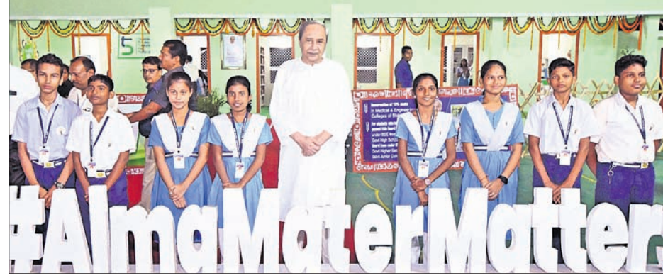
ରାଜ୍ୟସ୍ତରୀୟ ଶିଶୁ ମହୋତ୍ସବ 'ପୁରତି'ର ଉଦ୍‌ଘାଟନା ଉତ୍ସବରେ ଛାତ୍ରାଛାତ୍ରୀଙ୍କ ସମ୍ମୁଖରେ ଯୁଷ୍ୟମନ୍ତ୍ରୀ ନବୀନ ପଟ୍ଟନାୟକ।

୫-ଟି ରୂପାକରିତ ସ୍କୁଲ ତଥା ଅନ୍ୟ ସ୍କୁଲଗୁଡ଼ିକ ପାଇଁ ଯୁଷ୍ୟମନ୍ତ୍ରୀ ନବୀନ ପଟ୍ଟନାୟକ ରୂପାବାର 'ଯୁଷ୍ୟମନ୍ତ୍ରୀ ଶିକ୍ଷା ପୁରସ୍କାର' ଯୋଜନାର ଶୁଭାରମ୍ଭ କରିଛନ୍ତି। ଶିକ୍ଷା କ୍ଷେତ୍ରରେ ଉତ୍କର୍ଷ ଲାଭି ପ୍ରତିବର୍ଷ ୧୦୦ କୋଟି ଟଙ୍କାର ପୁରସ୍କାର ମିଳିବ। ୫୦ ହଜାର ଛାତ୍ରାଛାତ୍ରୀ, ୧୫୦୦ ପ୍ରଧାନ ଶିକ୍ଷକ, ଶିକ୍ଷୟିତ୍ରୀଶିକ୍ଷକ, ସ୍କୁଲ ପରିଚାଳନା କମିଟି, ସରପଞ୍ଚ ଏବଂ ପୁରାତନ ଛାତ୍ରଙ୍କୁ କୁଳ, ଜିଲା ଓ ରାଜ୍ୟସ୍ତରରେ ଏହି ପୁରସ୍କାର ପ୍ରଦାନ କରାଯିବ।