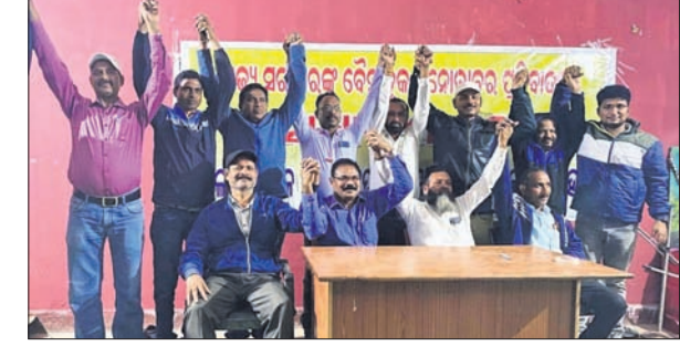
କାର୍ଯ୍ୟକାରିଣୀ ବୈଠକରେ ଏନ୍‌ପିଏସ୍ ଶିକ୍ଷକ ସଂଘ ସଭାସଭ୍ୟ ।

କଳାହାଣ୍ଡି ଜିଲ୍ଲା ଏନ୍‌ପିଏସ୍ ପ୍ରାଥମିକ ଶିକ୍ଷକ ସଂଘ କାର୍ଯ୍ୟକାରିଣୀ ବୈଠକ ଅନୁଷ୍ଠିତ ହୋଇଯାଇଛି ।