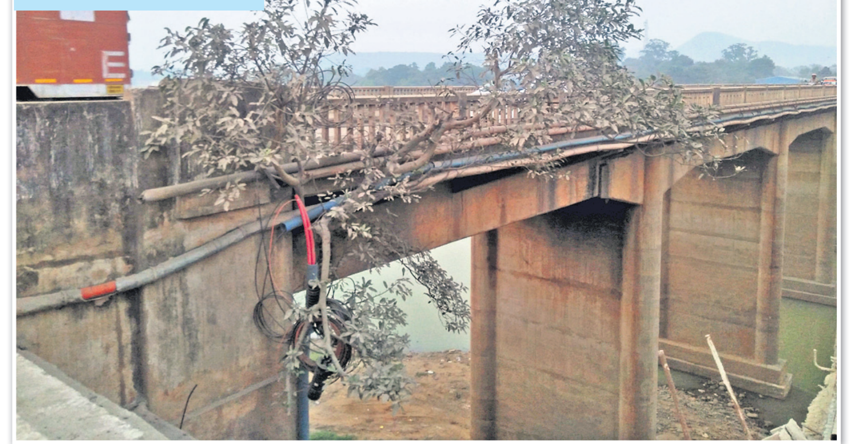
ରାଉରକେଲା-ରାଞ୍ଚି ୧୪୩ ନଂ. ଜାତୀୟ ରାଜପଥର ସୁନ୍ଦରଗଡ଼ ଜିଲ୍ଲା କୁଆଁରମୁଣ୍ଡା ବ୍ଲକ୍ ସମୁଦାୟନାଳି ନିକଟସ୍ଥ ଶଙ୍ଖନଦୀ ଉପରେ ଥିବା ବ୍ରିଟିଶ୍ ଅମଳର ପୋଲର ଶୋଚନୀୟ ଅବସ୍ଥା।