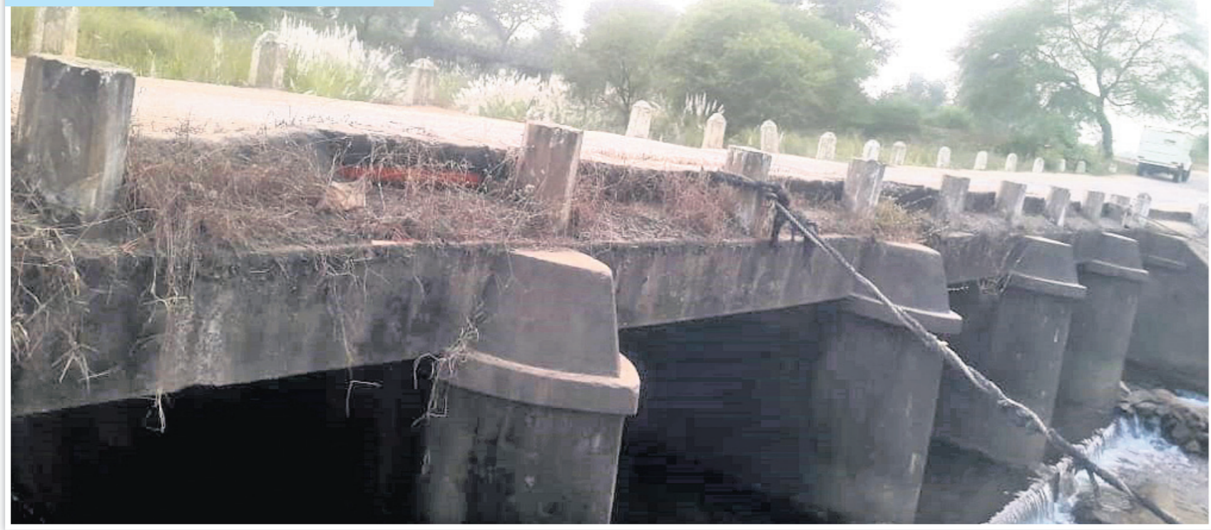
ବଲାଙ୍ଗୀର ଜିଲ୍ଲା ସାଲେଇଗା-ଆଗଲପୁର ଗ୍ରାମ୍ୟ ଉନ୍ନୟନ ବିଭାଗ ରାସ୍ତାର ରୁନ୍ଦୁକା ନିକଟ ରୁଣ୍ଡିମୁହାଣ ଯୋର ଉପରେ କରାକାର୍ଯ୍ୟ ଅବସ୍ଥାରେ ଥିବା ବ୍ରିଟିଶ୍ ଅମଳର ପୋଲ।