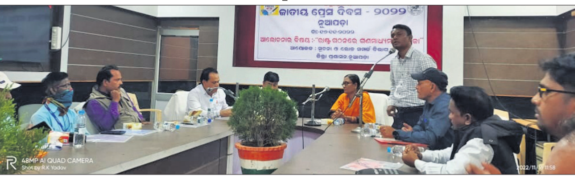
ଉପସ୍ଥିତ ଖବରଦାତା ଓ ଅତିଥିମାନଙ୍କୁ ।