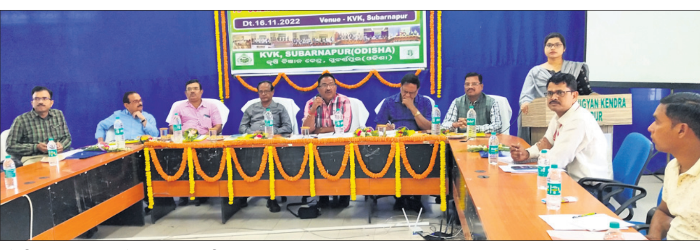
ବୈଜ୍ଞାନିକ ଉପଦେଷ୍ଟା ମଣ୍ଡଳୀ ବୈଠକରେ ମଞ୍ଚାସୀନ ଅତିଥି ବୃନ୍ଦ।