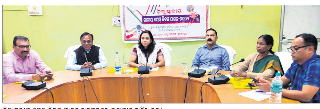
ଜିଲ୍ଲାସ୍ତରୀୟ ପ୍ରେସ ଦିବସ ପାଳନ ଅବସରରେ ମଞ୍ଚାସୀନ ଅତିଥି ବୃନ୍ଦ।

ରାଷ୍ଟ୍ର ଗଠନରେ ଗଣମାଧ୍ୟମର ଭୂମିକା ଗୁରୁତ୍ୱପୂର୍ଣ୍ଣ ବୋଲି ପରିଷଦ ସମ୍ମିଳନୀ କକ୍ଷରେ ରୂପାବାର ସମ୍ପାଦକ ଅନୁଷ୍ଠିତ ହୋଇଯାଇଛି।