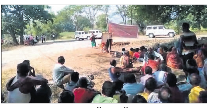
ପ୍ରଶାସନ ପକ୍ଷରୁ କ୍ରମେ ଭିତରକୁ ଗାଡ଼ି ନେବାକୁ ପ୍ରୟାସ କରୁଥିବା ବେଳେ ଗ୍ରାମବାସୀ ବିରୋଧ କରୁଛନ୍ତି।

ବୌଦ୍ଧ ଜିଲ୍ଲା ହରଭଙ୍ଗା ବ୍ଲକର ଖରଭୁଇ ଠାରେ କ୍ରମେ ଓ ପଥରକାରୀ ଚାଲିବାକୁ ପ୍ରଶାସନର ପୁନଃ ନିଷ୍ପତ୍ତିକୁ ଗ୍ରାମବାସୀ ଯୋର ବିରୋଧ କରିବା ସହ ବର୍ଷ ୧୬ ଦିନ ସରାଡ଼ିଖୋଳ ରାସ୍ତାରେ ଧାରଣାରେ ବସିଛନ୍ତି।