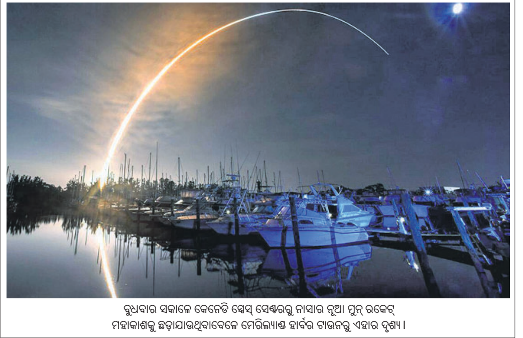
ବୁଧବାର ସକାଳେ କେନେଡି ସେକ୍ସ ସେକ୍ସରୁ ନାସାର ନୂଆ ମୁନ୍ଦ୍ର ରକେଟ୍ ମହାକାଶକୁ ଛଡ଼ାଯାଇଥିବାବେଳେ ମେରିଲ୍ୟାଣ୍ଡ ହାର୍ବର ଗାଉନକୁ ଏହାର ଦୃଶ୍ୟ ।

ଜି୨୦ ସମ୍ପର୍କ ଅବସରରେ ପ୍ରଧାନମନ୍ତ୍ରୀ ନରେନ୍ଦ୍ର ମୋଦି ବୁଧବାର ବ୍ରିଟିଶ ପ୍ରତିପକ୍ଷ ରଷି ଯୁନକଙ୍କୁ ଭେଟି ବିଭିନ୍ନ ପ୍ରସଙ୍ଗରେ ଆଲୋଚନା କରିଛନ୍ତି । ଭାରତ-ବ୍ରିଟେନ ବିସ୍ତୃତ ରାଜନୀତିକ ସହଯୋଗିତା ଏବଂ ଭବିଷ୍ୟତ ସମ୍ପର୍କ ଲାଗି କମନୱେଲଥ ସମେତ ସମସ୍ତ ଦ୍ୱିପାକ୍ଷିକ କମିଟି/କୋର୍ଡ୍ ଅଫ୍ ଗଭର୍ଣ୍ଣମେଣ୍ଟ ସମେତ ଏକାଠି କାର୍ଯ୍ୟ କରିବାର ଗୁରୁତ୍ୱ ଉଭୟ ପ୍ରଶଂସା କରିଥିଲେ । ଗତ ମାସରେ ଯୁନକ ବ୍ରିଟେନ ପ୍ରଧାନମନ୍ତ୍ରୀ ରିସି ସୁନକ ପରେ ମୋଦିଙ୍କ ସହ ଏହା ପ୍ରଥମ ସାକ୍ଷାତ୍ । ମୋଦି ଯୁନକଙ୍କୁ ଅଭିନନ୍ଦନ ଜଣାଇଥିଲେ । ବାଣିଜ୍ୟ, ଗମନାଗମନ, ପ୍ରତିରକ୍ଷା ଓ ସୁରକ୍ଷା ଆଦି ସେକ୍ଟରରେ ସହଯୋଗ ଲାଗି ସମୋଦାନ ମଧ୍ୟରେ ଆଲୋଚନା ହୋଇଥିଲା । ପ୍ରତିବର୍ଷ ବ୍ରିଟେନର କାର୍ଯ୍ୟ କରିବା ଲାଗି ଭାରତୀୟ ଯୁବ ପେସାଦାରମାନଙ୍କ ନିମନ୍ତେ ବ୍ରିଟିଶ ପ୍ରଧାନମନ୍ତ୍ରୀ ରଷି ସୁନକ ୩,୦୦୦ ଭିକା ପ୍ରଦାନ ଲାଗି ମଞ୍ଜୁରୀ ଦେଇଛନ୍ତି । ଏହି ଯୋଜନାରୁ ଉପକୃତ ପ୍ରଧାନମନ୍ତ୍ରୀ ରିସି ସୁନକ ପରେ ମୋଦିଙ୍କ ସହ ଏହା ପ୍ରଥମ ସାକ୍ଷାତ୍ । ମୋଦି ଯୁନକଙ୍କୁ