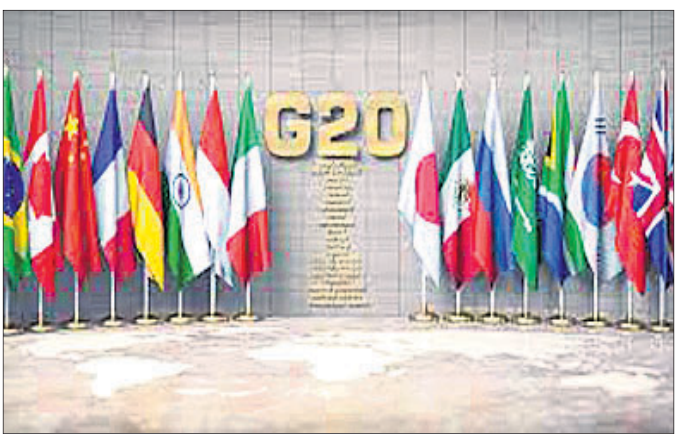
ବାଲି, ୧୬୧୧ (ପି.ଟି.)

ଇଣ୍ଡୋନେସିଆର ବାଲିଠାରେ ଜି୨୦ ବୈଠକ ବୁଧବାର ଶେଷ ହୋଇଛି । ଏହି ଅବସରରେ ଜି୨୦ ବାଲି ଘୋଷଣାନାମାରେ ରୁଷିଆ-ୟୁକ୍ରେନ୍ ମୁକ୍ତକୁ ନେଇ ସଦସ୍ୟ ରାଷ୍ଟ୍ରଗୁଡ଼ିକ ମଧ୍ୟରେ ମତପାର୍ଥକ୍ୟ ଥିବା ସ୍ୱୀକାର କରାଯାଇଛି । ତେବେ ମୁକ୍ତକୁ ନେଇ ବନ୍ଦୀ ଥିବା ସାଧାରଣ ନାଗରିକମାନଙ୍କୁ ସୁରକ୍ଷା ଦେବାର ଅନ୍ତର୍ଜାତୀୟ ଆଇନକୁ ମାନିବା ଲାଗି ଘୋଷଣାନାମାରେ ଗୁରୁତ୍ୱ ଦିଆଯାଇଛି । ଆଣିବକ ଅସ୍ତ୍ର ବ୍ୟବହାର କିମ୍ବା ଏଭଳି ଧମକପୂର୍ଣ୍ଣ ସମସ୍ତ ସଦସ୍ୟ ବିରୋଧ କରୁଥିବା ସ୍ପଷ୍ଟ କରିଦେଇଛନ୍ତି । ଶାନ୍ତିପୂର୍ଣ୍ଣ ଉପାୟରେ ମୁକ୍ତକୁ ଅବସାନ କରିବା ସେମାନେ ଆହ୍ୱାନ ଦେଇଛନ୍ତି । ତେବେ ଜି୨୦ ବାଲି ନେତୃତ୍ୱକୁ ଇଣ୍ଡୋନେସିଆ ରାଷ୍ଟ୍ରପତି ଖବରଦାତା ସମ୍ମିଳନୀରେ ସ୍ୱୀକାର କରିଛନ୍ତି । ଆଜିର ସ୍ୱର ଆସିବି ମୁକ୍ତର ସ୍ୱର ରୁହେଁ ବୋଲି ଘୋଷଣାନାମାରେ କୁହାଯାଇଛି । ଗତ ସେପ୍ଟେମ୍ବରରେ ସାଂଘାଇ ସହଯୋଗ ସଂଗଠନ (ଏସ୍‌ସିଏ) ବୈଠକ ଅବସରରେ ପ୍ରଧାନମନ୍ତ୍ରୀ ନରେନ୍ଦ୍ର ମୋଦି ରୁଷିଆ ରାଷ୍ଟ୍ରପତି ଭୁଟିନିଙ୍କୁ ଯାହା ମାନିବା ଲାଗି ଘୋଷଣାନାମାରେ ଗୁରୁତ୍ୱ ଦିଆଯାଇଛି । ଆଣିବକ ଅସ୍ତ୍ର ବ୍ୟବହାର କିମ୍ବା ଏଭଳି ଧମକପୂର୍ଣ୍ଣ ସମସ୍ତ ସଦସ୍ୟ ବିରୋଧ କରୁଥିବା ସ୍ପଷ୍ଟ କରିଦେଇଛନ୍ତି । ଶାନ୍ତିପୂର୍ଣ୍ଣ ଉପାୟରେ ମୁକ୍ତକୁ ଅବସାନ କରିବା ସେମାନେ ଆହ୍ୱାନ ଦେଇଛନ୍ତି । ତେବେ ଜି୨୦ ବାଲି ନେତୃତ୍ୱକୁ ଇଣ୍ଡୋନେସିଆ ରାଷ୍ଟ୍ରପତି ଖବରଦାତା ସମ୍ମିଳନୀରେ ସ୍ୱୀକାର କରିଛନ୍ତି । ଆଜିର ସ୍ୱର ଆସିବି ମୁକ୍ତର ସ୍ୱର ରୁହେଁ ବୋଲି ଘୋଷଣାନାମାରେ କୁହାଯାଇଛି । ଗତ ସେପ୍ଟେମ୍ବରରେ ସାଂଘାଇ ସହଯୋଗ ସଂଗଠନ (ଏସ୍‌ସିଏ) ବୈଠକ ଅବସରରେ ପ୍ରଧାନମନ୍ତ୍ରୀ ନରେନ୍ଦ୍ର ମୋଦି ରୁଷିଆ ରାଷ୍ଟ୍ରପତି ଭୁଟିନିଙ୍କୁ ଯାହା ମାନିବା ଲାଗି ଘୋଷଣାନାମାରେ ଗୁରୁତ୍ୱ ଦିଆଯାଇଛି । ଆଣିବକ ଅସ୍ତ୍ର ବ୍ୟବହାର କିମ୍ବା ଏଭଳି ଧମକପୂର୍ଣ୍ଣ ସମସ୍ତ ସଦସ୍ୟ ବିରୋଧ କରୁଥିବା ସ୍ପଷ୍ଟ କରିଦେଇଛନ୍ତି । ଶାନ୍ତିପୂର୍ଣ୍ଣ ଉପାୟରେ ମୁକ୍ତକୁ ଅବସାନ କରିବା ସେମାନେ ଆହ୍ୱାନ ଦେଇଛନ୍ତି । ତେବେ ଜି୨୦ ବାଲି ନେତୃତ୍ୱକୁ