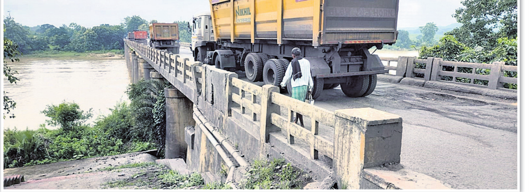
ସୁନ୍ଦରଗଡ଼-ହେମବିରି ଏମ୍.ସି.ଏଲ୍. ବସ୍ତୁହରା ପୂର୍ବ ବିଭାଗ ରାସ୍ତାର ସୁନ୍ଦରଗଡ଼ ନିକଟ ଉପ ନଦୀର ବନ୍ଧପାଲି ପୋଲ ୧୯୫୨ ମସିହାରେ ନିର୍ମିତ ହୋଇଥିବାବେଳେ ବର୍ତ୍ତମାନ ବିପଦସଙ୍କୁଳ ଅବସ୍ଥାରେ ଅଛି।