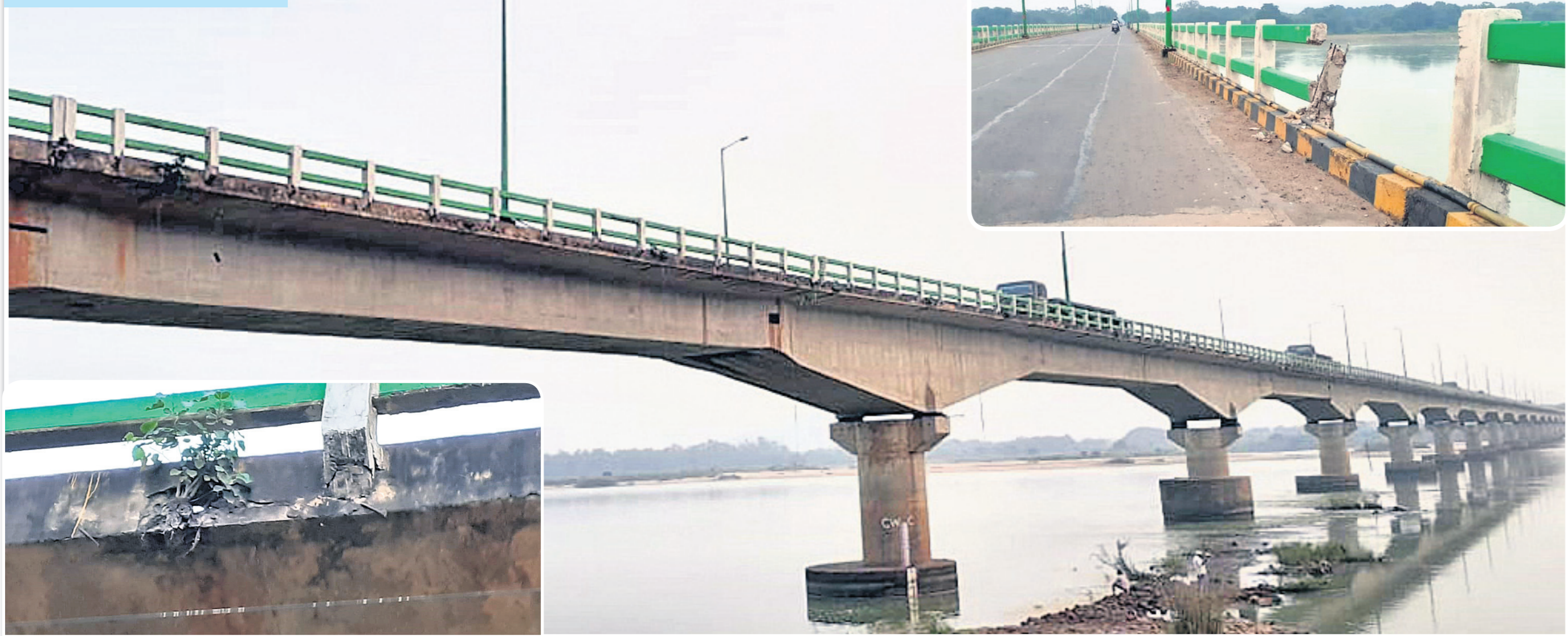
ଡେକାନାଲ-କାମାକ୍ଷାନଗର ରାସ୍ତାର ରେଲୁଆ ଓ କମଗରା ମଧ୍ୟରେ ପ୍ରବାହିତ ବ୍ରାହ୍ମଣୀ ନଦୀ ଉପରେ ପୂର୍ବ ବିଭାଗ ପକ୍ଷରୁ ୧୯୯୩ରେ ନିର୍ମାଣ କରାଯାଇଥିଲା ସାରଙ୍ଗଧର ସେତୁ। ରକ୍ଷଣାବେକ୍ଷଣ ଅଭାବରୁ ଏହି ବ୍ରିଜ୍ ଏବେ ବିପଦସଙ୍କୁଳ ହୋଇପଡ଼ିଛି। ବିଭିନ୍ନ ସ୍ଥାନରେ ସୁରକ୍ଷା ବାଡ଼ି ଭାଙ୍ଗି ଯାଇଥିବାବେଳେ ବର, ଅଶ୍ୱତ୍ୱ ଗଛ ଉଠି ଫାଟ ହୋଇଛି।