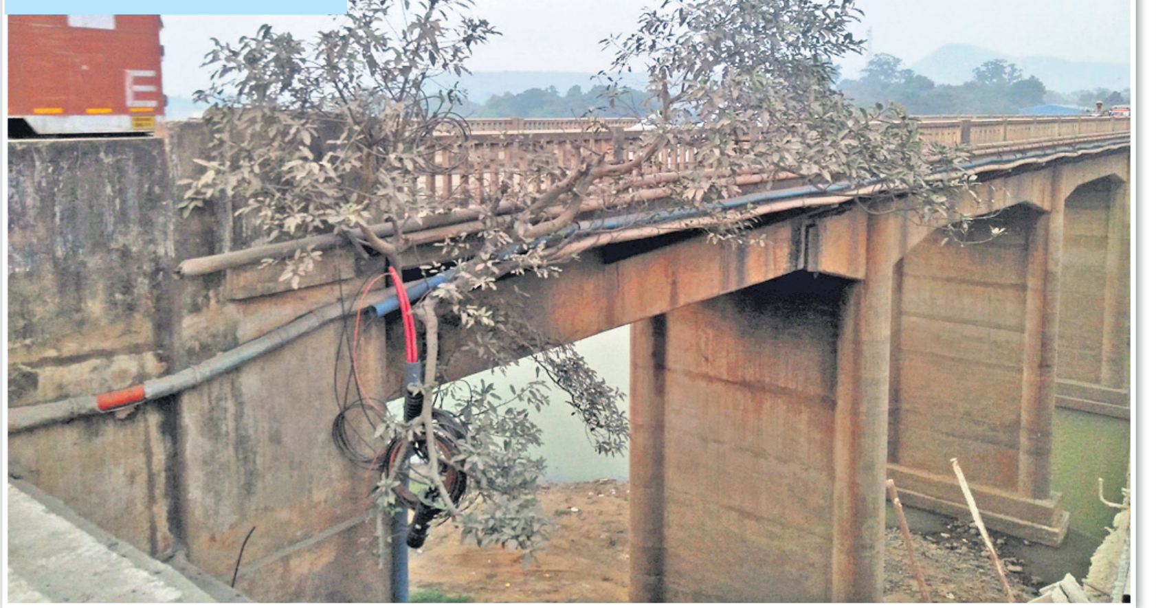
ରାଉରକେଲା-ରାଞ୍ଜି ୧୪୩ ନଂ. ଜାତୀୟ ରାଜପଥର ସୁନ୍ଦରଗଡ଼ ଜିଲ୍ଲା କୁଆଁରପୁଣ୍ଡା ବୁଦ୍ଧ ଯମୁନାନାଳି ନିକଟସ୍ଥ ଶଙ୍ଖନଦୀ ଉପରେ ଥିବା ବ୍ରିଜ୍ ଅନଳର ପୋଲର ଶୋଚନୀୟ ଅବସ୍ଥା।