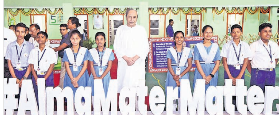
ରାଜ୍ୟସ୍ତରୀୟ ଶିଶୁ ମହୋତ୍ସବ 'ପୁରତି'ର ଉଦ୍‌ଯାପନା ଉତ୍ସବରେ ଛାତ୍ରାଛାତ୍ରୀଙ୍କ ଗହଣରେ ମୁଖ୍ୟମନ୍ତ୍ରୀ ନବୀନ ପଟ୍ଟନାୟକ।

୫-ଟି ରୂପାପତ୍ର ଗ୍ରହଣ କରି ଆନ୍ଧ୍ର ପ୍ରଦେଶର ପାଇଁ ମୁଖ୍ୟମନ୍ତ୍ରୀ ନବୀନ ପଟ୍ଟନାୟକ ରୁପାପତ୍ର 'ମୁଖ୍ୟମନ୍ତ୍ରୀ ଶିକ୍ଷା ପୁରସ୍କାର' ଯୋଜନାର ଶୁଭାରମ୍ଭ କରିଛନ୍ତି। ଶିକ୍ଷା କ୍ଷେତ୍ରରେ ଉତ୍କର୍ଷ ଲାଭି ପ୍ରତିବର୍ଷ ୧୦୦ କୋଟି ଟଙ୍କାର ପୁରସ୍କାର ମିଳିବ। ୫୦ ହଜାର ଛାତ୍ରାଛାତ୍ରୀ, ୧୫୦୦ ପ୍ରଧାନ ଶିକ୍ଷକ, ଶିକ୍ଷୟିତ୍ରୀଶିକ୍ଷକ, ସ୍କୁଲ ପରିଚାଳନା କର୍ମି, ସରପଞ୍ଚ ଏବଂ ପୁରାତନ ଛାତ୍ରଙ୍କୁ କୁଳ, ଜିଲା ଓ ରାଜ୍ୟସ୍ତରରେ ଏହି ପୁରସ୍କାର ପ୍ରଦାନ କରାଯିବ।