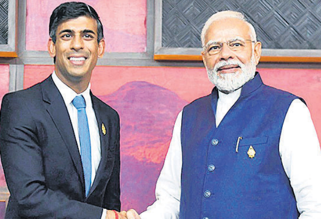
ଭାରତୀୟଙ୍କ ପାଇଁ ଭିକା ଯୋଜନାକୁ ବ୍ରିଟେନର ମଞ୍ଜୁରୀ

ଜି୨୦ ସମ୍ପର୍କ ଅବସରରେ ପ୍ରଧାନମନ୍ତ୍ରୀ ନରେନ୍ଦ୍ର ମୋଦି ବୁଧବାର ବ୍ରିଟିଶ ପ୍ରତିପକ୍ଷ ରଷି ଯୁନକଙ୍କୁ ଭେଟି ବିଭିନ୍ନ ପ୍ରସଙ୍ଗରେ ଆଲୋଚନା କରିଛନ୍ତି । ଭାରତ-ବ୍ରିଟେନ ବିସ୍ତୃତ ରାଜନୀତିକ ସହଯୋଗିତା ଏବଂ ଭବିଷ୍ୟତ ସମ୍ପର୍କ ଲାଗି କମନୱେଲଥ ସମେତ ସମସ୍ତ ଦ୍ୱିପାକ୍ଷିକ କମିଟି/କୋର୍ଡ୍ ଅଫ୍ ଗଭର୍ଣ୍ଣମେଣ୍ଟ ସମେତ ଏକାଠି କାର୍ଯ୍ୟ କରିବାର ଗୁରୁତ୍ୱ ଉଭୟ ପ୍ରଶଂସା କରିଥିଲେ । ଗତ ମାସରେ ଯୁନକ ବ୍ରିଟେନ ପ୍ରଧାନମନ୍ତ୍ରୀ ରିସି ସୁନକ ପରେ ମୋଦିଙ୍କ ସହ ଏହା ପ୍ରଥମ ସାକ୍ଷାତ୍ । ମୋଦି ଯୁନକଙ୍କୁ ଅଭିନନ୍ଦନ ଜଣାଇଥିଲେ । ବାଣିଜ୍ୟ, ଗମନାଗମନ, ପ୍ରତିରକ୍ଷା ଓ ସୁରକ୍ଷା ଆଦି ସେକ୍ଟରରେ ସହଯୋଗ ଲାଗି ସମୋଦାନ ମଧ୍ୟରେ ଆଲୋଚନା ହୋଇଥିଲା । ପ୍ରତିବର୍ଷ ବ୍ରିଟେନର କାର୍ଯ୍ୟ କରିବା ଲାଗି ଭାରତୀୟ ଯୁବ ପେସାଦାରମାନଙ୍କ ନିମନ୍ତେ ବ୍ରିଟିଶ ପ୍ରଧାନମନ୍ତ୍ରୀ ରଷି ସୁନକ ୩,୦୦୦ ଭିକା ପ୍ରଦାନ ଲାଗି ମଞ୍ଜୁରୀ ଦେଇଛନ୍ତି । ଏହି ଯୋଜନାରୁ ଉପକୃତ ପ୍ରଧାନମନ୍ତ୍ରୀ ରିସି ସୁନକ ପରେ ମୋଦିଙ୍କ ସହ ଏହା ପ୍ରଥମ ସାକ୍ଷାତ୍ । ମୋଦି ଯୁନକଙ୍କୁ