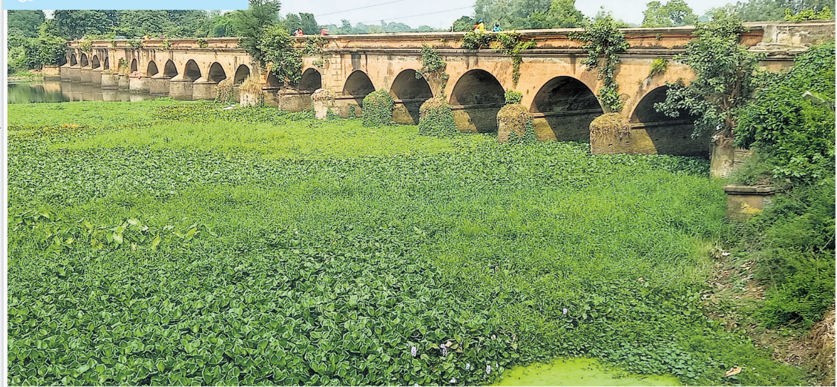
ବାଲେଶ୍ୱର ପୌରାଞ୍ଚଳର ୩୧ନଂ. ଖାଡ଼ି ସ୍ଥିତ ଅରବିନ୍ଦନାଥ ନିକଟସ୍ଥ ନୁଣିଆଯୋଡ଼ି ପୋଲ ହରିପୁର ଛକଠାରୁ ମୁକ୍ତିଦ୍ୱାର ପର୍ଯ୍ୟନ୍ତ ଲମ୍ବିଛି। ବ୍ରିଜ୍ ଅନଳରୁ ତିଆରି ହୋଇଥିବା ଏହି ପୋଲର ଉଭୟ ପାର୍ଶ୍ୱରେ ଗଛ ଉଠିବା ସହ ଫାଟ ପୁଣି ହୋଇଛି। ବିପଦ ସଙ୍କୁଳ ଅବସ୍ଥାରେ ପ୍ରତିଦିନ ହଜାର ହଜାର ଲୋକ ତଥା ଭାରିଯାନ ଏହି ପୋଲ ଦେଇ ଯା' ଆସ କରୁଛନ୍ତି।

ନଦୀ ଉପରେ ତିଆରି ହୋଇଛି ସେତୁ। ହରିଜି ବିପଦପୂର୍ଣ୍ଣ ନୌଯାତ୍ରାର ଯନ୍ତ୍ରଣା। ସହରରେ ନିର୍ମିତ ଫ୍ଲାଏ ଓଭର ପାଇଁ କମିଛି ଭିଡ଼। ବର୍ଷ ବର୍ଷ ଧରି ବ୍ୟବହୃତ ବ୍ୟସ୍ତବହୁଳ ଦ୍ୱିକୁଗୁଡ଼ିକ କିନ୍ତୁ ଏବେ ଆଉ ସୁରକ୍ଷିତ ହୋଇ ରହିନାହିଁ। ବ୍ରିଜ୍ ଅନଳର ପୋଲଗୁଡ଼ିକ କରାକାର୍ଯ୍ୟ ଅବସ୍ଥାରେ। ୩୦-୪୦ ବର୍ଷ ପୁରୁଣା ସେତୁର ସୁରକ୍ଷା ବାଡ଼ି ଭାଙ୍ଗି ପୁରୁଣା ପଡ଼ିଛି। ଦୁର୍ବଳ ସ୍ଥାନ ପାଇଁ ମାଲବାହୀ ଗାଡ଼ି ଯିବା ବେଳେ ଦୋହଲୁଛି। ରକ୍ଷଣାବେକ୍ଷଣ ଅଭାବରୁ ବଡ଼ ବଡ଼ ଗଛରେ ପରିପୂର୍ଣ୍ଣ ହୋଇ ଫ୍ଲାଏ ଓଭର ଫାଟି ଥିବା କଲାଣି। ଆପ୍ରେଲ୍ ରୋଡ଼ରେ ବିରାଟକାୟ ଗର୍ଭ ପାଇଁ ବଡ଼ ଧରଣର ଦୁର୍ଘଟଣା ଆଶଙ୍କାକୁ ଏଡ଼ାଇ ଦିଆଯାଇପାରୁନାହିଁ। ଓଡ଼ିଶାରେ ଏବେ ଏଭଳି ଦୁର୍ଘଟଣା ସତ୍ତ୍ୱେପଥରେ ସୁରକ୍ଷିତ ଯାତ୍ରା ଓ ପରିବହନ ବ୍ୟବସ୍ଥା ପ୍ରତି ଅଙ୍ଗୁଳି ନିର୍ଦ୍ଦେଶ କରୁଛି। ଏଠାରେ ବିପଦସଙ୍କୁଳ ଅବସ୍ଥାରେ ଥିବା କେତେକ ପୋଲ ଓ ଫ୍ଲାଏଓଭରର ଚିତ୍ର ପ୍ରଦର୍ଶନ କରାଗଲା।