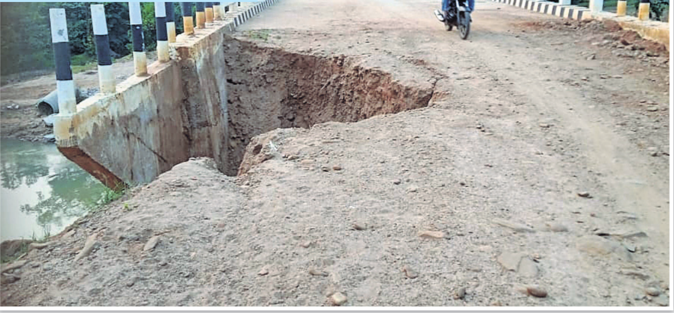
କନ୍ଧମାଳ ଜିଲ୍ଲା କୋଟଗଡ଼ ବ୍ଲକ୍ କୁଡ଼ାବାଳି ପଞ୍ଚାୟତ ରତ୍ନଗୁମା ନିକଟରେ ଗ୍ରାମ୍ୟ ନିର୍ମାଣ ବିଭାଗ (ଆର୍ଡ଼ି) ପକ୍ଷରୁ ନିର୍ମିତ ଗାଉଲଧୁଆ ନଦୀ ଉପରେ ହୋଇଥିବା ଏହି ପୋଲର ନିର୍ମାଣ ୩/୪ ମାତ୍ର ହେବ ସରିଛି। ପ୍ରଧାନମନ୍ତ୍ରୀ ଗ୍ରାମ ସଡ଼କ ଯୋଜନାରେ ନିର୍ମିତ ଏହି ପୋଲର ଗୋଟିଏ ପାର୍ଶ୍ୱ ସଂଯୋଗ ରାସ୍ତା ଧୋଇଯାଇଛି।