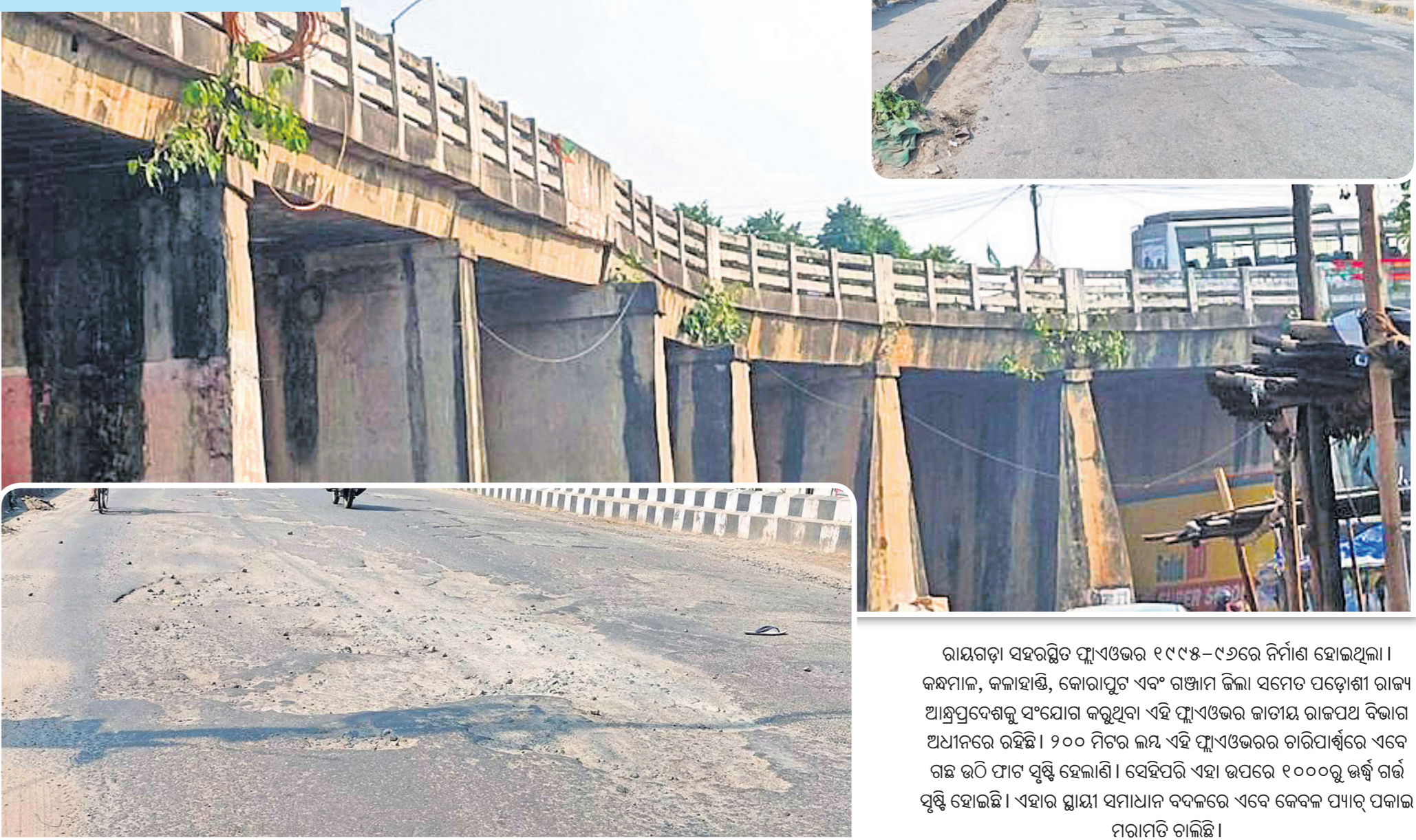
ରାୟଗଡ଼ା ସହରସ୍ଥିତ ଫ୍ଲାଏଓଭର ୧୯୯୫-୯୬ରେ ନିର୍ମାଣ ହୋଇଥିଲା। କନ୍ଧମାଳ, କନାହାଣ୍ଡି, କୋରାପୁଟ ଏବଂ ଗଞ୍ଜାମ ଜିଲ୍ଲା ସମେତ ପଡ଼ୋଶୀ ରାଜ୍ୟ ଆନ୍ଧ୍ରପ୍ରଦେଶକୁ ସଂଯୋଗ କରୁଥିବା ଏହି ଫ୍ଲାଏଓଭର ଜାତୀୟ ରାଜପଥ ବିଭାଗ ଅଧୀନରେ ରହିଛି। ୨୦୦ ମିଟର ଲମ୍ବ ଏହି ଫ୍ଲାଏଓଭରର ଚାରିପାର୍ଶ୍ୱରେ ଏବେ ଗଛ ଉଠି ଫାଟ ପୁଣି ହେଲାଣି। ସେହିପରି ଏହା ଉପରେ ୧୦୦୦ରୁ ଊର୍ଦ୍ଧ୍ୱ ଗର୍ଭ ପୃଷ୍ଠି ହୋଇଛି। ଏହାର ସ୍ଥାୟୀ ସମାଧାନ ବଦଳରେ ଏବେ କେବଳ ପ୍ୟାଟ୍ ପକାଇ ମରାମତି ଚାଲିଛି।