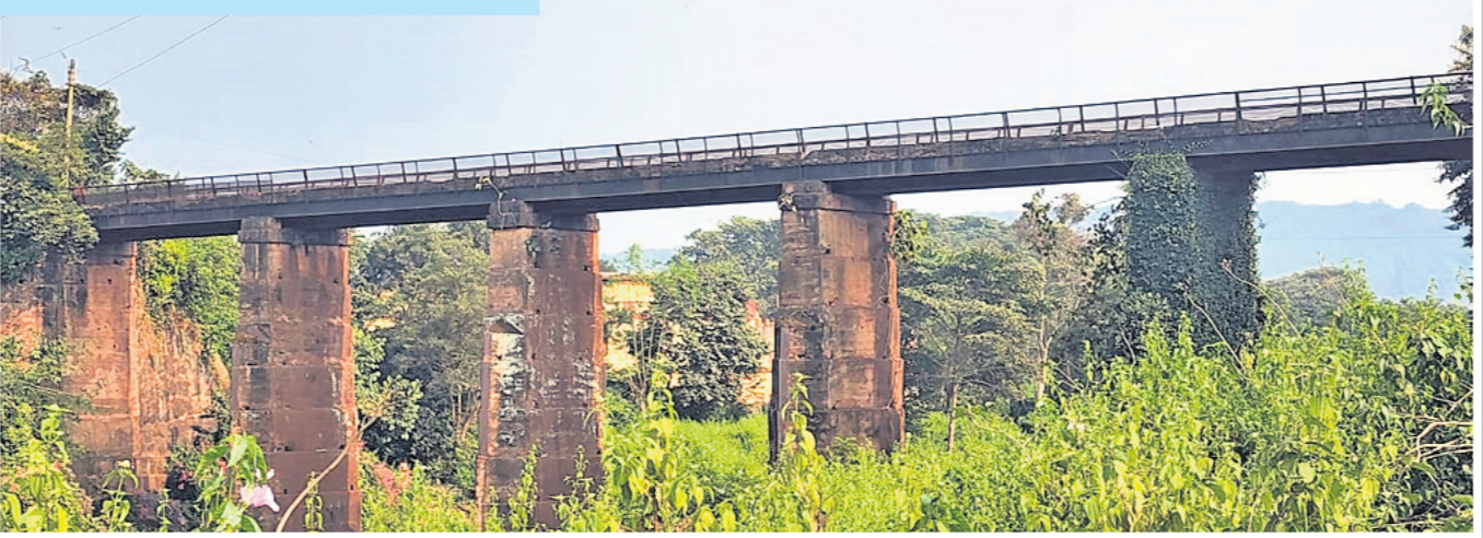
ବଡ଼ ପୋଲିଆ ପୋଲ କେନ୍ଦୁଝର ଜିଲ୍ଲା ପଶ୍ଚିମ ଯୋଡ଼ାରୁ କୁନ୍ଦୁର ନାଳାକୁ ସଂଯୋଗ କରୁଛି। ୧୯୪୮ ପୂର୍ବରୁ ଖଣିଜ ପରିବହନ ନିମନ୍ତେ ଜାଣା କମ୍ପାନୀ ଏହାକୁ ନିର୍ମାଣ କରିଥିଲା। ପରବର୍ତ୍ତୀ ସମୟରେ ଏଥିରେ ଜନସାଧାରଣ ଯାତାୟାତ କରିଆସୁଛନ୍ତି। ଏହା ଉପରେ ନିର୍ମିତ ହୋଇଥିଲା। ଯୋଡ଼ା ଅଞ୍ଚଳର ସର୍ବପୁରାତନ ପୋଲ ହୋଇଥିବା ବେଳେ ବର୍ତ୍ତମାନ ଏଥିରେ ଗଛକଟା ଉଠି କରାକାର୍ଯ୍ୟ ଅବସ୍ଥାରେ ରହିଛି।