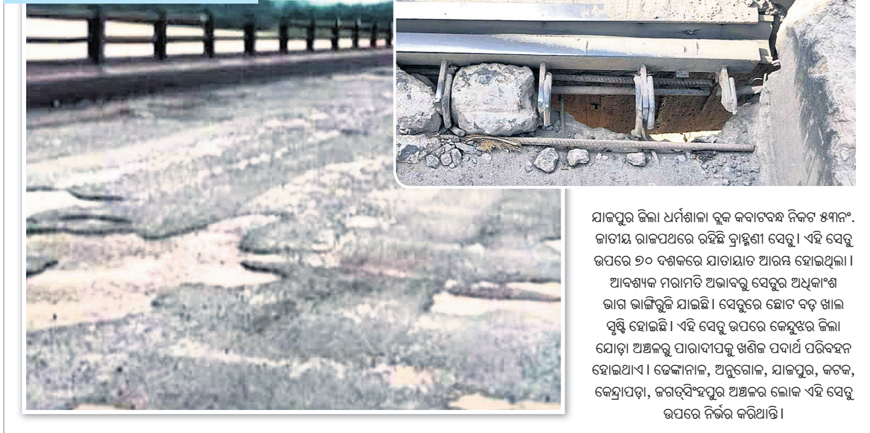
ସାକପୁର ଜିଲ୍ଲା ଧର୍ମଶାଳା ବ୍ଲକ୍ କବାଟବନ୍ଦି ନିକଟ ୫୩ନଂ. ଜାତୀୟ ରାଜପଥରେ ରହିଛି ବ୍ରାହ୍ମଣୀ ସେତୁ। ଏହି ସେତୁ ଉପରେ ୬୦ ବର୍ଷକରେ ଯାତାୟାତ ଆରମ୍ଭ ହୋଇଥିଲା। ଆବଶ୍ୟକ ମରାମତି ଅଭାବରୁ ସେତୁର ଅଧିକାଂଶ ଭାଗ ଭାଙ୍ଗିବୁଡ଼ି ଯାଇଛି। ସେତୁରେ ଛୋଟ ବଡ଼ ଖାଲ ପୁଣି ହୋଇଛି। ଏହି ସେତୁ ଉପରେ କେନ୍ଦୁଝର ଜିଲ୍ଲା ଯୋଡ଼ା ଅଞ୍ଚଳରୁ ପାରାପାଟକୁ ଖଣିଜ ପଦାର୍ଥ ପରିବହନ ହୋଇଥାଏ। ଡେକାନାଲ, ଅନୁଗୋଳ, ଯାକପୁର, କଟକ, କେନ୍ଦ୍ରାପଡ଼ା, କରକ୍ଷି-ହପୁର ଅଞ୍ଚଳର ଲୋକ ଏହି ସେତୁ ଉପରେ ନିର୍ଭର କରିଥାନ୍ତି।