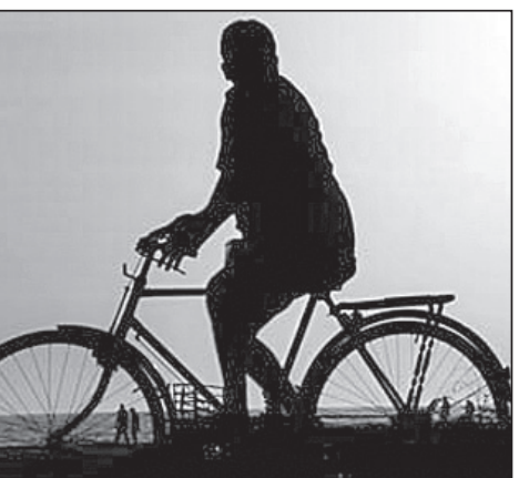
ସାଇକେଲ ଉତ୍ପାଦନ ବୃଦ୍ଧି ପାଇଛି

୨୦୧୨ରେ ୩ଶହ ସାଇକେଲ ଉତ୍ପାଦନ ହେଇଥିଲା ବୋଲି ସାଇକେଲ ପ୍ରମାଣିକାରୀ ସଂଘର ପ୍ରମାଣ ଅଛି।