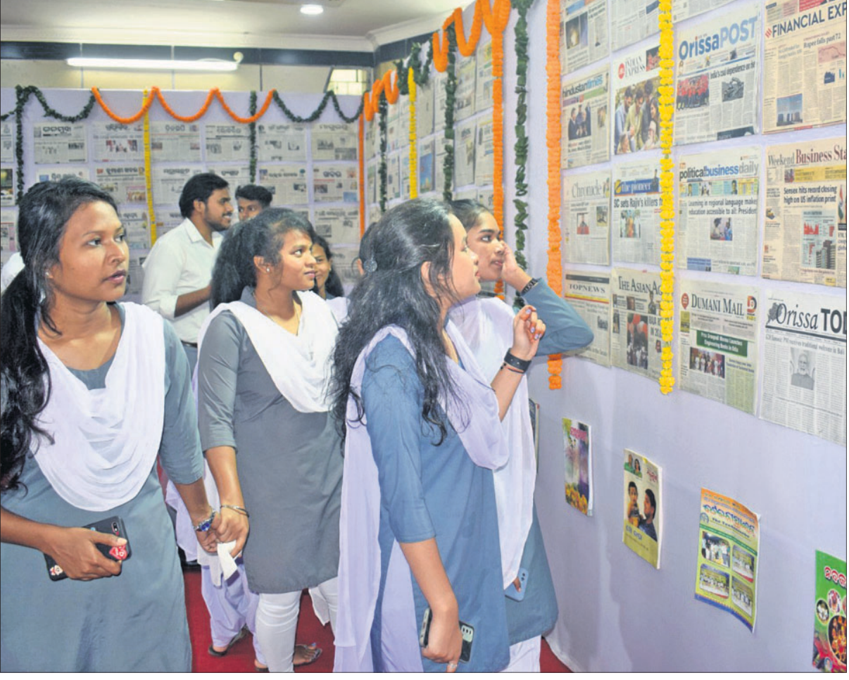
ଜାତୀୟ ପ୍ରେସ୍ ଦିବସରେ ବୁଧବାର ସୂଚନା ଓ ଲୋକ ସମ୍ପର୍କ ବିଭାଗ ପକ୍ଷରୁ ଭୁବନେଶ୍ୱର ସୂଚନା ଭବନରେ ଆୟୋଜିତ ଖବରକାଗଜ ପ୍ରଦର୍ଶନୀକୁ ଛାତ୍ରୀମାନେ ବୁଲି ଦେଖୁଛନ୍ତି।

ଝୋଝୋ (କ୍ରମେ ଲୋକପୃଷ୍ଠା ଓ ଜନମାନସରୁ ବିସ୍ତୃତ ହେଉଥିବା ଦୈନିକପତ୍ରିକା ପାଠିକା-ପାଠକଙ୍କ ନିକଟରେ ପହଞ୍ଚାଇବା ସକାଶେ ଧରିତ୍ରୀର ପ୍ରୟାସ) ଗାଁ କଥା ଚାଲୁ କଣା, ମିଛ ବୋଲୁଥାଉ ମୋହର କିଣା। କାହା ଅନ୍ଧର କଥା କେହି ବୁଝି ପାରନ୍ତିନାହିଁ। ଅନ୍ଧର ମନ ତଳର ଗହନ କଥା ବୁଝିବା ଅତ୍ୟନ୍ତ କଷ୍ଟକର ହୋଇଥାଏ। ତେଣୁ ମୁହଁରେ ଯିଏ ଯାହା କହେ ସେହି କଥାକୁ ନିଜ ବୁଝିରେ ସତ କିମ୍ବା ମିଛ ବୋଲି ଧାରଣା କରିବା ହିଁ ଉଚିତ ହୋଇଥାଏ ବୋଲି ଏଠାରେ ଉଲ୍ଲେଖ କରାଯାଇଛି। ତାଟିଆ ପାଖରେ କୁଡ଼ିକି ରୁବା ଛାଡ଼ୁନାହିଁ ବୁଢ଼ାକି। ସାଧାରଣତଃ ମଣିଷ ବୁଢ଼ାବୁଢ଼ୀ ହୋଇଗଲେ ଉଭୟଙ୍କ ମଧ୍ୟରେ ଆକର୍ଷଣ ପ୍ରବାହ ହୁଏ ବୋଲି ଜଣାଯାଇଥାଏ। ଏହା ବହୁ ମନସ୍ତତ୍ତ୍ୱବିତ୍‌ଙ୍କର ମତ ବୋଲି ଏଠାରେ ପ୍ରକାଶ କରାଯାଇଛି। ଓଡ଼ିଆ ଜଗତ୍‌ମାଳି ଓ ଲୋକଗୀତ - ଫ୍ରେଣ୍ଡସ୍ ସପ୍ଟିମ୍ବର୍