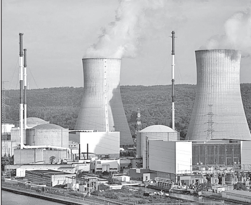
ଆଣ୍ଡୋଇ ପ୍ରୋଜାକ୍ଟର ଉତ୍ପାଦନ କ୍ଷମତା

ସେମାନେ ବଖଳ କରିଥିବା ଯୁକ୍ତମାନ କାପୋରିଣ୍ଡେଆ ଆଣବିକ ଶକ୍ତି କେନ୍ଦ୍ରକୁ ନେଇ ଅନ୍ତର୍ଜାତୀୟ ସ୍ତରରେ ଅତ୍ୟଧିକ ଆଶଙ୍କା ପ୍ରକାଶ ପାଇଆସିଛି।