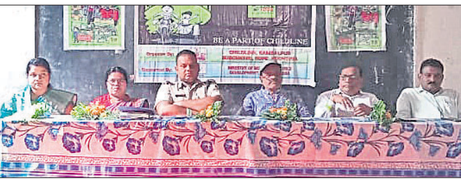
କାର୍ଯ୍ୟକ୍ରମରେ ଯୋଗଦେଇଥିବା ଅତିଥିମାନେ ।