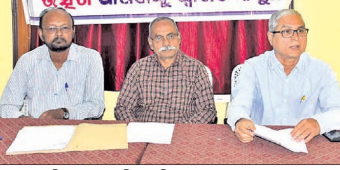
ଖବରଦାତା ସମ୍ମିଳନୀରେ ସୂଚନା ଦିଆଯାଇଛି ।