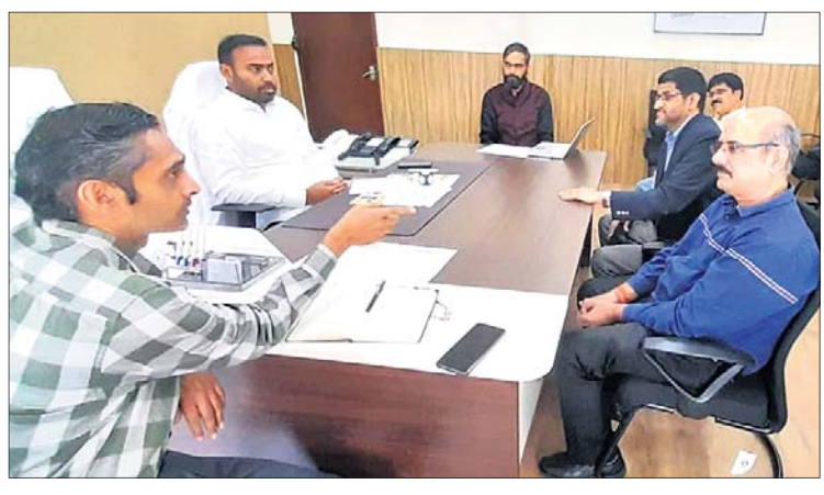
ମନ୍ତ୍ରୀ ଘଡ଼େଇ କହିଛନ୍ତି। ତେବେ ସ୍ଥାନୀୟ ଖଣି କେନ୍ଦ୍ରର ଆବଶ୍ୟକତାକୁ ଦୃଷ୍ଟିରେ ରଖି ଦକ୍ଷତା ବିକାଶ କେନ୍ଦ୍ର ସ୍ଥାପନ କରାଯିବ। ଏଥିପାଇଁ ଆବଶ୍ୟକ ଭିତ୍ତିଭୂମି ରାଜ୍ୟ ସରକାର ଯୋଗାଇଦେବେ। ଖଣି ଅଞ୍ଚଳର ଯୁବପିଢ଼ିକୁ ଉତ୍ତମା କରିବାରେ ସଫଳ ହୋଇଥିବା

ଭୁବନେଶ୍ଵର, ୧୭୧୧ (ବ୍ୟୁରୋ) ଖଣି କ୍ଷେତ୍ରରେ କାର୍ଯ୍ୟ କରିବା ନିମନ୍ତେ ଯୁବବର୍ଗକୁ ଉତ୍ତମା କରିବାକୁ ରାଜ୍ୟ ସରକାର ପ୍ରୟାସ ଆରମ୍ଭ କରିଛନ୍ତି। ଏନେଇ ଦକ୍ଷତା ବିକାଶ ମନ୍ତ୍ରୀ ପ୍ରତିରଞ୍ଜନ ଘଡ଼େଇ ଗୁରୁବାର ଲୋକସଭା ଭବନରେ ଗଣା ଗୁପ୍ତର ଶ୍ରୀମନ୍ତ୍ରୀ କାର୍ଯ୍ୟକ୍ରମ ଫର୍ ମାଲିନ୍ ସେକ୍ଟର (ଏସ୍‌ଏମ୍‌ଏସ୍) ଅଧିକାରୀଙ୍କ ସହ ଆଲୋଚନା କରିଛନ୍ତି। ଓଡ଼ିଶାର ଅଧିକାଂଶ ଜିଲ୍ଲା ଖଣି ପ୍ରାଥମିକ ଅଞ୍ଚଳ। ସେଥିପାଇଁ ଜିଲ୍ଲାସ୍ତରରେ ଖଣି ପ୍ରାଥମିକ ଅଞ୍ଚଳରେ ଦକ୍ଷତା ବିକାଶ କେନ୍ଦ୍ର ପ୍ରତିଷ୍ଠା କରିବାକୁ ଯୋଜନା ହେଉଛି। ଫଳରେ ଗୁରୁତ୍ଵ ଦେବାକୁ ଟ୍ରେନିଂ ଦେଇ ଦକ୍ଷତା ବୃଦ୍ଧି କରାଯିବ। ଗୁରୁତ୍ଵପୂର୍ଣ୍ଣ ଟ୍ରେନିଂ ପ୍ରଦାନର ମୁଖ୍ୟ ଅଂଶ ଭାବେ ଗ୍ରହଣ କରାଯିବ। ଏହାଦ୍ଵାରା ଖଣି ପ୍ରାଥମିକ ଅଞ୍ଚଳରେ ନିଯୁକ୍ତିର ସୁଯୋଗ ସୃଷ୍ଟି ହେବା ସହ ପରିବେଶ ସୁରକ୍ଷିତ ରଖାଯାଇପାରିବ ବୋଲି