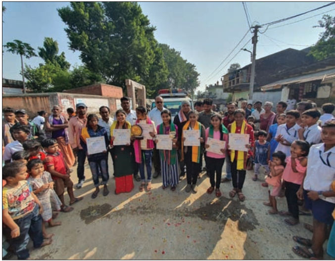
ରାଜ୍ୟସ୍ତରୀୟ ସୁରକ୍ଷିତ କାର୍ଯ୍ୟକ୍ରମରେ କୃତୀ ଛାତ୍ରୀଙ୍କୁ ଗ୍ରାମବାସୀ ସମ୍ବର୍ଦ୍ଧିତ କରୁଛନ୍ତି ।