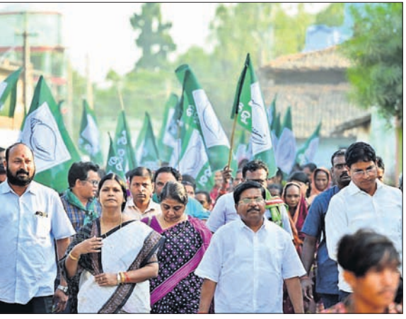
ଜାମସେଠରେ ବିଜେଡି କାର୍ଯ୍ୟାଳୟ ଉଦ୍ଘାଟନ ଅବସରରେ ବାହାରିଥିବା ରାଜିଲେ ଦଳୀୟ ନେତୃବର୍ଗ।