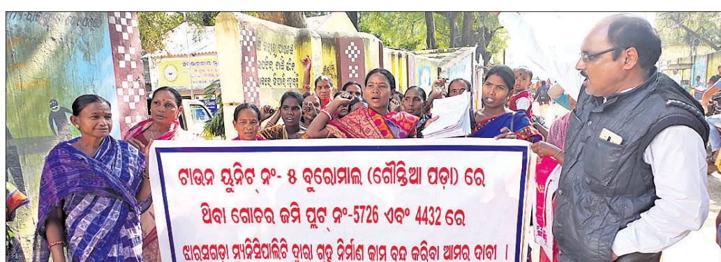
ଗ୍ରାମବାସୀ ଯୌର କାର୍ଯ୍ୟାଳୟ ସମ୍ମୁଖରେ ବିକ୍ଷୋଭ ପ୍ରଦର୍ଶନ କରୁଛନ୍ତି ।