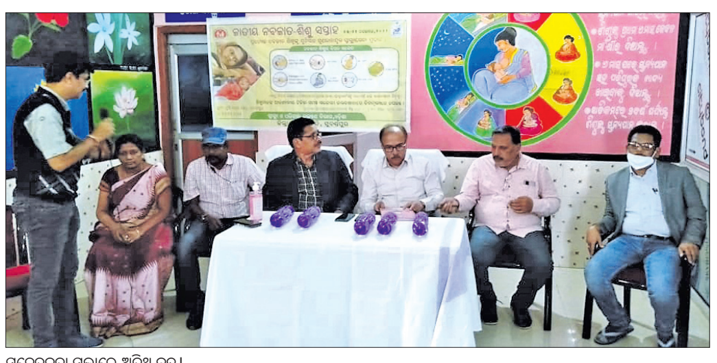
ସଚେତନତା ସଭାରେ ଅତିଥି ବୃନ୍ଦ ।

ସୋନପୁର, ୧୬/୧୧ (ନି.ପ୍ର.): ନବଜାତ ଶିଶୁ ଯଦି ୧ ମିନିଟ ଭିତରେ ୧୦ ଥରରୁ ଅଧିକ ନିଶ୍ୱାସ ନେଇଛି, ବାତ ମାଉଛି, ଜର ହେଉଛି, ନିଶ୍ୱାସ ପ୍ରଶ୍ୱାସ ନେବା ସମୟରେ ଛାତି ତଳ ଭାଗ ଭିତରକୁ ପଶିଯାଉଛି, ଶିଶୁ ମା' ସ୍ତାମ ଖାଇ ପାରୁନାହିଁ, ଦେହ ଅଣ୍ଡା ଲାଗୁଛି କିମ୍ବା ଶିଶୁ ନିଦ୍ରାରେ ରହୁଛି ତେବେ ଏହା ବିପଦ ସଙ୍କେତ ହୋଇପାରେ । ଏହି ବିପଦ ସଙ୍କେତକୁ ଅଣଦେଖା ନ କରି ତୁରନ୍ତ ଡାକ୍ତରୀ ପରାମର୍ଶ ନେବା ଉଚିତ ବୋଲି ଗୁରୁବାର ଜିଲ୍ଲା ମୁଖ୍ୟ ଚିକିତ୍ସାଳୟରୁ ପୁଣି ପୁର୍ନବାସ କେନ୍ଦ୍ରରେ ଅନୁଷ୍ଠିତ ସଚେତନତା ସଭାରେ