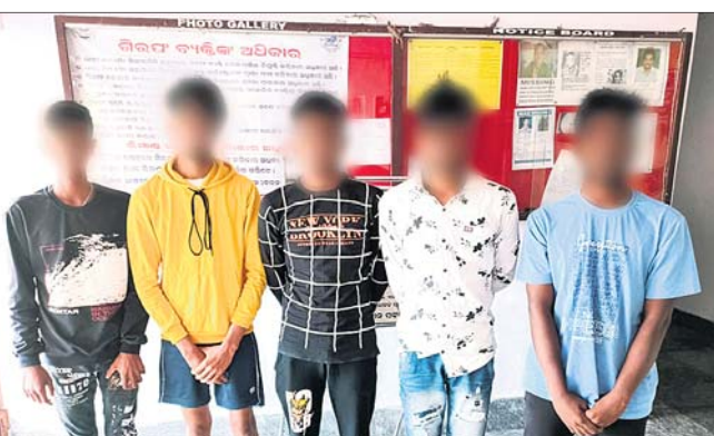
ଗଞ୍ଜାମ ଜିଲ୍ଲା ବ୍ରହ୍ମପୁର ସହରର ଏକ ଖ୍ୟାତିସମ୍ପନ୍ନ ପୁରାତନ ସରକାରୀ ମହାବିଦ୍ୟାଳୟ କ୍ୟାମ୍ପସରେ ଜଣେ ଛାତ୍ରଙ୍କୁ ଅସହାୟତା କରାଯିବା ଘଟଣାରେ ଗିରଫ ଅଭିଯୁକ୍ତମାନେ।