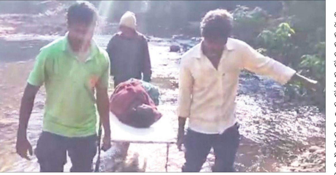
ରାୟଗଡ଼ା ଜିଲାରୁ ଯାଇଥିବା ଆୟୁଲାନୁ ଗାଳକ ଗ୍ରାମବାସୀଙ୍କ ସହଯୋଗରେ ପ୍ରସୂତିକୁ କ୍ଷେତ୍ରରେ ବୋହି ଆୟୁଲାନୁ ପର୍ଯ୍ୟନ୍ତ ନେଇଛନ୍ତି।

ବଳଜା, ୧୭।୧୧ (ଡି.ଏନ୍.ଏ.) ନନ୍ଦନକାନନରେ କଲରାପଡ଼ିଆ ବାୟୁଶା ଅନିତା ଅସୁସ୍ଥ ହୋଇପଡ଼ିଛି। ଅନିତା ଏବେ ଗୁରୁତର ଅବସ୍ଥାରେ ଡାକ୍ତରଖାନାରେ ଚିକିତ୍ସିତ ହେଉଛନ୍ତି। ସେ ଜନ୍ମଦିନ ହେବ ଠିକ୍ ଭାବେ ଖାଦ୍ୟ ଗ୍ରହଣ ନ କରିବା ସହ ମଳତ୍ୟାଗ ମଧ୍ୟ କରୁ ନାହିଁ। ଯାହାକୁ ନେଇ ପ୍ରାଣୀ ଚିକିତ୍ସକ ତତ୍ତ୍ୱା ବଢ଼ିଯାଇଛି। ଫଳରେ ପ୍ରାଣୀ ଚିକିତ୍ସକମାନେ ତା'ର ଅଳପ୍ରାଣାତ୍ତ କରିବାକୁ ଚେତନ ପାଣି ଜିନିଷ ସହ ଲିଭାଉଁ ସଂପୂର୍ଣ୍ଣ ହୋଇଥିବା ଜାଣିବାକୁ ପାଇଛନ୍ତି। ଅନିତାଙ୍କୁ ବର୍ତ୍ତମାନ ଆଇସୋଲେସନ ଖର୍ଚ୍ଚରେ ରଖାଯାଇ ଚିକିତ୍ସା ଆରମ୍ଭ ହୋଇଛି।