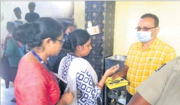
ରାଉରକେଲା ମହାନଗର ନିଗମର ସାମ୍ବଲ ବିଭାଗ ପକ୍ଷରୁ ଚଢ଼ାଉ କରାଯାଇଛି।

ଘରୋଇପ୍ରକାରର ପହଞ୍ଚି ଚଢ଼ାଉ କରିଥିଲେ। ଏହି ଚଢ଼ାଉ ସମୟରେ ଉକ୍ତ ଫ୍ୟାକ୍ଟ୍ରିରୁ ନିମ୍ନମାନର ଅଡ଼େଇ କୁଇଣ୍ଟାଲ ସସ୍ ସହିତ ବିଭିନ୍ନ କମ୍ପାନୀର ଷ୍ଟିଲକୁ ଖାଦ୍ୟ ପୁରୁଣା ଅଧିକାରୀ ଓ ସାମ୍ବଲ ଉକ୍ତ ସସ୍ ବହୁ ରାଉରକେଲା ବଜାରରେ ବୋତଲ ପିଛା ୩୦ ରୁ ୪୦ ଟଙ୍କା ଭିତରେ ବିଭିନ୍ନ ନାମାଦାମା କମ୍ପାନୀର ଷ୍ଟିଲ ମାରି ବୁଦ୍ଧି କରୁଥିଲେ। ଏହି ଦିଗରେ କୌଣସି ବିଶେଷ ସୂଚନା ଆର୍.ଏ.ଏ.ସି.ର ସାମ୍ବଲ ବିଭାଗ ଅଧିକାରୀ ଏ.ଏ.କେ. ପରିଜା ସୂଚନା ପାଇ