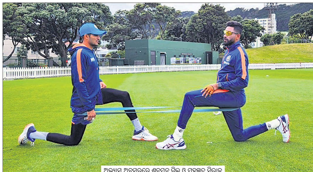
ଅଭ୍ୟାସ ଅବସରରେ ଶୁଭମନ୍ ଚିଲ୍ ଓ ମହମ୍ମଦ ସିରାଜ୍

ବିଶ୍ଵକପ୍ ବିଫଳତା ପରେ ଭାରତ ଚ୍ୟୁତିଲାଞ୍ଚି ବିପକ୍ଷରେ ୩ଟି ଲେଖାଏଁ ଟି୨୦ ଓ ଦିନକିଆ ମ୍ୟାଚ ଖେଳିବ। ଏହି ସିରିଜରେ ନୂତନ ନେତୃତ୍ଵ ସହିତ ଏକ ନୂତନ ଆରମ୍ଭ ଲକ୍ଷ୍ୟରେ ରହିବ ଭାରତ। ୩ ମ୍ୟାଚ ବିଶିଷ୍ଟ ଟି୨୦ ସିରିଜର ପ୍ରଥମ ମ୍ୟାଚ ଶୁକ୍ରବାର ଆରମ୍ଭ ହେବ। ଦୀର୍ଘ ୯ ବର୍ଷ ଧରି ଆଇସିସି