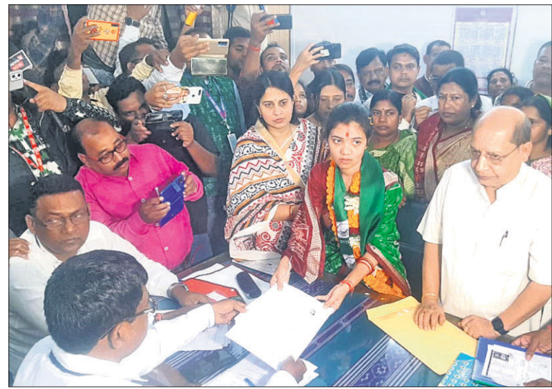
ପଦ୍ମପୁର ଉପନିର୍ବାଚନ ଲାଗି ଗୁରୁବାର ରିଟର୍ଣ୍ଣ ଅଫିସର ତଥା ଉପଜିଲ୍ଲାପାଳଙ୍କ କାର୍ଯ୍ୟାଳୟରେ ନାମାଙ୍କନ ପତ୍ର ଦାଖଲ କରୁଥିବା ବିଭିନ୍ନ ପ୍ରାର୍ଥୀଙ୍କ ସହ ସମୀକ୍ଷା କରାଯାଇଥିଲା ।