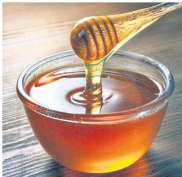
ଚରଣେ: ମହୁ ଖାଇବା ଦ୍ୱାରା ଏହା ଶରୀରରେ ରକ୍ତ ଶର୍କରା ଏବଂ କୋଲେଷ୍ଟରଲ ପ୍ରଭୃତି