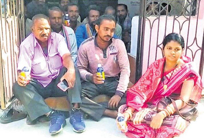
କୃଷି ଅଧିକାରୀଙ୍କ ଅର୍ଥସ ସମ୍ମୁଖରେ ଚାଷୀମାନେ କାଟନାଖିକ ବୋତଲ ଧରି ଆତ୍ମହତ୍ୟା ଉଦ୍ୟମ କରିଥିଲେ।

ଚାଷୀମାନଙ୍କୁ ୧୨ ପ୍ରତିଶତ କ୍ଷତିପୂରଣ ଚକା ପ୍ରଦାନ କରାଯାଇଛି। ସରକାରଙ୍କ ଚିପୋର୍ଟରେ ଏହି ପଞ୍ଚାୟତର ଚାଷୀମାନଙ୍କୁ ବାମା ଚକା ଦେବାକୁ ତାଲିକା ପ୍ରସ୍ତୁତ କରାଯାଇଥିଲା। ହେଲେ ଶେଷ ସମୟରେ ଚକା ଦିଆଗଲା ନାହିଁ। ଧବର୍ଷ ହେଲା ବାମା ଚକା ପାଇଁ ଲଢ଼େଇ ଭାବି ରହିଛି। କାଟାୟ ରାଜପଥ ଅବରୋଧ, ରୁକ୍ଷଅର୍ଥସ ଓ କୃଷି ବିକାଶ ଅର୍ଥସ ଘୋର ଭାବେ ପ୍ରଭାବ ପାଇଛି। ଜିଲ୍ଲାପାଳଙ୍କଠାରୁ ଆରମ୍ଭ କରି ମୁଖ୍ୟମନ୍ତ୍ରୀଙ୍କ ପର୍ଯ୍ୟନ୍ତ ଦାବିପତ୍ର ପ୍ରଦାନ କରାଯାଇଥିଲା। ହେଲେ କୌଣସି ସମାଧାନର ବାଟ ବାହାରିପାରି ନାହିଁ। ଶେଷରେ ଆତ୍ମହତ୍ୟା ଭଳି ଚରମ ପଦ୍ଧତି ଆପଣେଇଲେ। ଜୀବନ ହାରିବେଲେ ବକେୟା ଥିବା ଚାଷୀ ପରିଣତ କରିବାକୁ ପଡ଼ିବ ନାହିଁ ବୋଲି ଚାଷୀମାନେ କହିଥିଲେ। ସମ୍ମତି ଦେଖି, ଅଧିକାରୀଙ୍କୁ ସମ୍ମତ ଦେବାକୁ ଚାଷୀ ଉପସ୍ଥିତ ଥିଲେ। ଅଧିକାରୀମାନେ ଜିଲା ଓ କୁଳସ୍ତରରୁ ଚିପୋର୍ଟ ଚାଷୀମାନଙ୍କୁ ଦେଖାନ୍ତିଲେ। ହେଲେ ସେମାନେ ରାଜ୍ୟ ସରକାରଙ୍କ ଚୁଡ଼ାନ୍ତ ତାଲିକା ମାଗିଥିଲେ। ଖବର ଲେଖାହେବା ପର୍ଯ୍ୟନ୍ତ ଆନ୍ଦୋଳନ ପ୍ରତ୍ୟାହତ ହୋଇ ନ ଥିଲା।