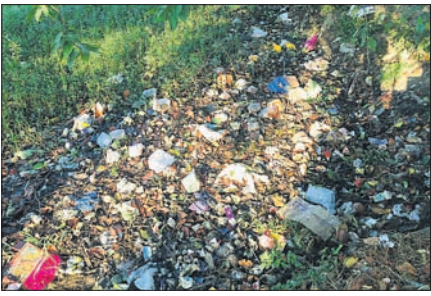
ଆବର୍ଜନାରେ ପୋତି ହୋଇଥିବା ରାୟଗୁରୁ ମଠ ବନ୍ଦ ।

ବ୍ରହ୍ମପୁର ସହରରେ ଅନେକ ଜଳାଶୟ ଏବେ ଆବର୍ଜନାପୂର୍ଣ୍ଣ ହୋଇ ପାଣି ଦୂଷିତ ହୋଇଛି । ସହରରେ ପ୍ରାୟ ୪୨ଜଳାଶୟ ରହିଛି । ଏହି ଜଳାଶୟର ପାଣିକୁ ଗୁଣାଯାଇ ବାସିନ୍ଦା ଦୈନନ୍ଦିନ କାର୍ଯ୍ୟରେ ଆରମ୍ଭ କରି ନିତ୍ୟକର୍ମ ନିମନ୍ତେ ବ୍ୟବହାର କରିଥାନ୍ତି । ଏଥିସହ ମିଳି ନିକଟରେ ଥିବା ଜଳାଶୟର ପାଣି ମିଳି କାର୍ଯ୍ୟ ନିମନ୍ତେ ବ୍ୟବହାର କରାଯାଉଛି । କିନ୍ତୁ ଏହି ଜଳାଶୟଗୁଡ଼ିକର ଉଚିତ ରକ୍ଷଣାବେକ୍ଷଣ ଅଭାବକୁ ଦୂଷିତ ହେବା ସାଙ୍ଗରେ ପୂର୍ଣ୍ଣ ହୋଇ ଅନେକ ପୋଖରୀ ପୋତି ହୋଇଯାଉଥିବା ଦେଖିବାକୁ ମିଳିଛି ।