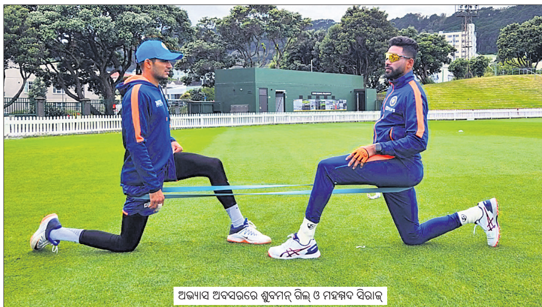
ଅଭ୍ୟାସ ଅବସରରେ ଶୁଭମନ୍ ଗିଲ୍ ଓ ମହମ୍ମଦ ସିରାଜ୍

ବିଶ୍ୱକପ ବିଫଳତା ପରେ ଭାରତ ଚଳିଥିବା ବିପକ୍ଷରେ ୩ଟି ଲେଖାଏଁ ଟି୨୦ ଓ ଦିନିକିଆ ମ୍ୟାଚ ଖେଳିବ। ଏହି ସିରିଜରେ ନୂତନ ନେତୃତ୍ୱ ସହିତ ଏକ ନୂତନ ଆରମ୍ଭ ଲକ୍ଷ୍ୟରେ ରହିବ ଭାରତ। ୩ ମ୍ୟାଚ ବିଶିଷ୍ଟ ଟି୨୦ ସିରିଜର ପ୍ରଥମ ମ୍ୟାଚ ଶୁକ୍ରବାର ଆରମ୍ଭ ହେବ। ଦୀର୍ଘ ୯ ବର୍ଷ ଧରି ଆଜିଯାଏ