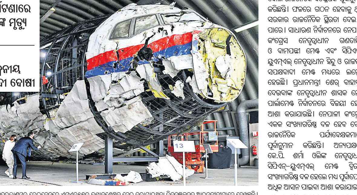
୨୦୨୧ ମେ' ୨୬ରେ ନେଦରଲାଣ୍ଡସର ରେଜକେନ୍ଦର୍ ଏଏଏ୨୧୨ର ଭଗ୍ନାବଶେଷକୁ ନେଇ କରାଯାଇଥିବା ରିକନଷ୍ଟ୍ରକ୍ସନକୁ ଆଇନଜୀବୀମାନେ ଦେଖୁଛନ୍ତି। ତୋନେନ୍ଦ୍ ଅଞ୍ଚଳକୁ ବିଚ୍ଛିନ୍ନତାବାଦୀଙ୍କ ଦେଖିଥିବା ସତ୍ୟ ଘଟଣା କହିଛନ୍ତି। ସେହି ଅଞ୍ଚଳ ଏକ ଚାଷଜମିରୁ ହିଁ ବନ୍ଦ ମିଶାଇଲ୍ ଛଡ଼ାଯାଇଥିଲା। ୨୦୨୦ ମାର୍ଚ୍ଚରେ ଆରମ୍ଭ ହୋଇଥିବା ଶୁଣାଣି ବେଳେ ଅଭିଯୁକ୍ତମାନେ ଆକ୍ରମଣ ପରିସ୍ପୋଷାରେ ଗୋଟିଏ କଥା କହିବା ଅଭିଯୋଗରେ ଅପାଳିତ ୩ ହୋଇଥିଲା। ସେମାନେ ୟୁକ୍ରେନ୍ କ୍ଷମା ଦେବା ପାଇଁ ବିଚାର ପ୍ରଣାଳୀ ଲାଗି ପାଲେସିଆର ରୁଷ୍ଟିଆର ବହିର୍ଯ୍ୟାପାର ମନ୍ତ୍ରୀମାନଙ୍କୁ ପକ୍ଷରୁ କୁହାଯାଇଛି। ନେଦରଲାଣ୍ଡ ନେତୃତ୍ୱାଧୀନ ଏହି ବିମାନ ଦୁର୍ଘଟଣାରେ ତଦନ୍ତରେ ୟୁକ୍ରେନ୍, ମାଲେସିଆ, ଅଷ୍ଟ୍ରେଲିଆ ଓ ବେଲଜିୟମର ବିଶେଷଜ୍ଞମାନେ ସାମିଲ ଥିଲେ।

ପାରିବାକୁ ୩୫ ଖଣ୍ଡ କରିବା ମାମଲା କରୁ ନ ଥିବା ଆତ୍ମତାବକ୍ ନାକୋ ଟେକ୍ସ ପାଇଁ ପୋଲିସ୍ ପକ୍ଷରୁ କରାଯାଇଥିବା ଆବେଦନକୁ କୋର୍ଟ ରୁଧିରା ଅନୁମତି ପ୍ରଦାନ କରିଥିଲେ। ଦିନକୁ ପୂର୍ବରୁ ପୋଲିସ୍ ଆତ୍ମତାବଙ୍କୁ ତାଙ୍କ ଘରକୁ ନେଇ ଯେଉଁଠି ସେ ସନ୍ଧ୍ୟାଙ୍କ ସହ ରହୁଥିଲେ, ସେଠାରେ ଅପରାଧ ଦୃଶ୍ୟ ଦୋହରାଇବାକୁ କହିଥିଲେ। ଗତ ୧୨ ତାରିଖରେ ଆତ୍ମତାବଙ୍କୁ ଚିରଫ କରାଯାଇଥିଲା। ଜେରା ବେଳେ ତାଙ୍କ ବୟାନରେ ତାଲମେଲ ରହୁ ନ ଥିବାରୁ ସେ ସତ ଲୁଚାଉଥିବା ପୋଲିସ୍ ଜାଣିବାକୁ ପାରିଥିଲା।