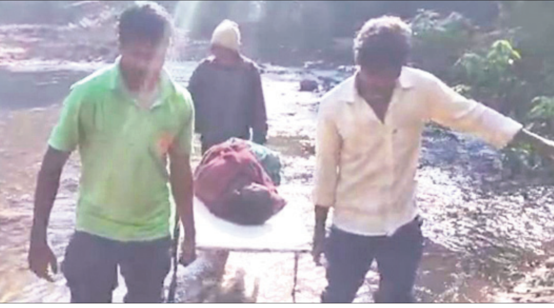
ରାୟଗଡ଼ା ଜିଲ୍ଲାରୁ ଆୟୁଲାନ୍ସ ଚାଳକ ଗ୍ରାମବାସୀଙ୍କ ସହଯୋଗରେ ପ୍ରସୂତିକ୍ଷେତ୍ରରେ ବୋହି ଆୟୁଲାନ୍ସ ପର୍ଯ୍ୟନ୍ତ ନେଇଛନ୍ତି।