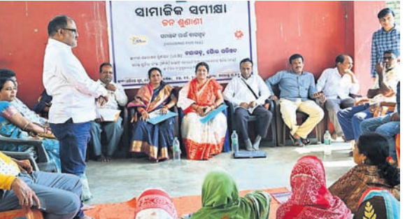
ସାମାଜିକ ସମାକ୍ଷାରେ ଯୋଗ ଦେଇଥିବା ପର୍ଯ୍ୟବେକ୍ଷକ ଏବଂ ଅନ୍ୟମାନେ ।