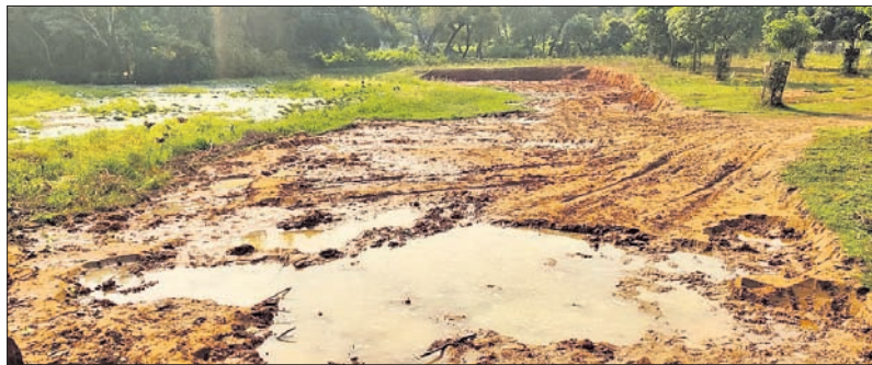
ବିନା ଅନୁମତିରେ ପୋଖରୀ ଖୋଳାକୁ ବନ୍ଦ କରାଯାଇଛି।

କେନ୍ଦ୍ରାପଡ଼ା ଜିଲ୍ଲା ରାଜକନିକା ବ୍ଲକ୍ ତରାସ ପଞ୍ଚାୟତରେ ପୋଖରୀ ଖୋଳା ଯାଇ ଗ୍ରାହକଙ୍କୁ ମାଟି ବୁଝା ହେଉଥିବା ଘଟଣାରେ ଗ୍ରାମବାସୀ ତହସିଲଦାର ଓ ବିଡ଼ିଓଙ୍କ ନିକଟରେ ଅଭିଯୋଗ କରିଥିଲେ।