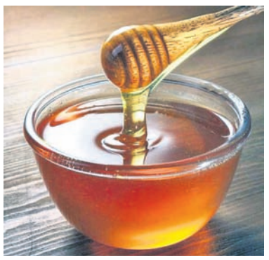
ଚରଣୋ: ମହୁ ଖାଇବା ଦ୍ୱାରା ଏହା ଶରୀରରେ ରକ୍ତ ଶର୍କରା ଏବଂ କୋଲେଷ୍ଟ୍ରଲ ପ୍ରଭୃତି

ରକ୍ତ ଶର୍କରା, କୋଲେଷ୍ଟ୍ରଲ କମାଇବ ମହୁ ରକ୍ତ ଶର୍କରା, କୋଲେଷ୍ଟ୍ରଲ ପ୍ରଭୃତିକୁ ନିୟନ୍ତ୍ରଣରେ ରଖିଥାଏ ବୋଲି ଗବେଷକମାନେ ଜାଣିବାକୁ ପାଇଛନ୍ତି। ଚରଣୋ ବିଶ୍ୱବିଦ୍ୟାଳୟର ଗବେଷକମାନେ ମହୁର କ୍ଲିନିକାଲ ପରୀକ୍ଷାର ଫଳାଫଳ ଏବଂ ମେଡିଆନାଲିସ୍ କରୁଥିଲେ। ଏହା ଖାଇବା ପୂର୍ବର ରକ୍ତ ଶର୍କରା, ମୋଟ ରକ୍ତ ଶର୍କରା ଏବଂ ଏଲଡିଏଲ୍ ବା