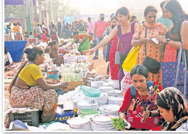
ବାଲିଯାତ୍ରା ପଡ଼ିଆରେ ବୁଲି ବ୍ୟବସାୟୀଙ୍କ ପସରା ।