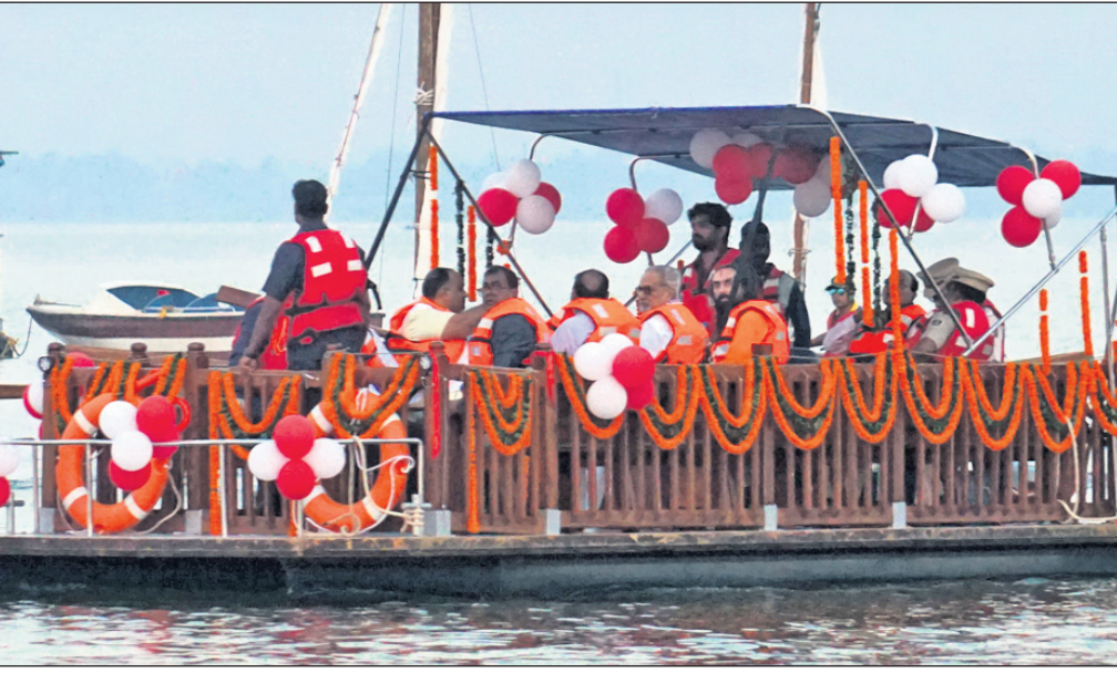
ମହାନଦୀରେ ରାଜ୍ୟପାଳ ପ୍ରଫେସର ଗଣେଶୀ ଲାଲ୍ ଓ ଅନ୍ୟ ଅତିଥିମାନେ ନୈବିହାର ମଜା ନେଉଛନ୍ତି ।