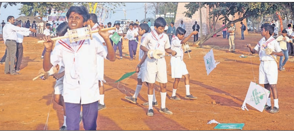
ବାଲିଯାତ୍ରା ପଡ଼ିଆରେ ଛାତ୍ରମାନେ ଗୁଡ଼ି ଉଡ଼ାଉଛନ୍ତି ।