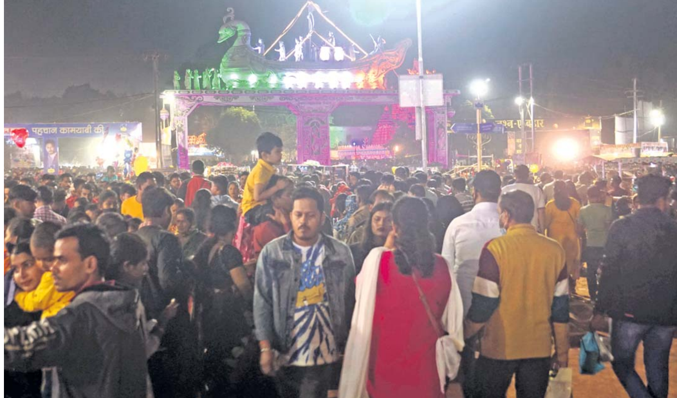
କଟକ ବାଲିଯାତ୍ରାର ଶେଷ ଦିନରେ ଗୁରୁବାର ଦର୍ଶନଙ୍କ ପ୍ରଦର୍ଶନ ଗହଳ।