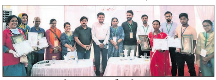
ଅତିଥିଙ୍କ ଗହଣରେ ସମର୍ପିତ ପ୍ରତିଭାଧାରୀ ।

କଟକ ଅପ୍ରିଲ, ୧୭୧୧ କଟକ ବାଲିଯାତ୍ରା ଗୁରୁବାର ଉଦ୍‌ଘାଟିତ ହୋଇଯାଇଛି। ଚଳିତବର୍ଷ ବାଲିଯାତ୍ରାକୁ ରାଜ୍ୟ ତଥା ଦେଶର ବିଭିନ୍ନ ପ୍ରାନ୍ତରୁ ବ୍ୟବସାୟୀ ଆସି ବ୍ୟବସାୟ କରିବା ସହ ନିଜର ପ୍ରତିଭା ପ୍ରଦର୍ଶନ କରିଥିଲେ। ଫଳରେ ପ୍ରତିଦିନ ଲକ୍ଷାଧିକ ଲୋକ ଆକର୍ଷିତ ହୋଇ ବାଲିଯାତ୍ରା ଆସିଥିଲେ। ବାଲିଯାତ୍ରାରେ ଓଡ଼ିଆ ଓଡ଼ିଶା ଉତ୍କଳ ଉତ୍କଳ ଉତ୍କଳ ଆଣ୍ଡ ଆକ୍ସେସ୍ ଟୋପିଆଲଟି) ପକ୍ଷରୁ ଗ୍ରାମୀଣଙ୍କର କାର୍ଯ୍ୟକ୍ରମ, ଶିଳ୍ପୀ ଓ ମହିଳା ଉଦ୍ୟୋଗୀମାନଙ୍କୁ ସହଯୋଗୀ କ୍ରେତାମାନଙ୍କ ସହ ଯୋଗାଯୋଗ କରିବା ପାଇଁ ଏକ ମଞ୍ଚ ଯୋଗାଇ ଦିଆଯାଇଥିଲା। ଏହା ମାଧ୍ୟମରେ ସେମାନେ ନିଜର ଉତ୍ପାଦ ବିକ୍ରି ପରିସରକୁ ବୃଦ୍ଧି କରିପାରିଛନ୍ତି। ଚଳିତବର୍ଷ ବାଲିଯାତ୍ରାର ଓଡ଼ିଆ