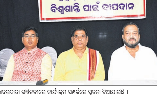
ଖବରଦାତା ସମ୍ମିଳନୀରେ କାର୍ଯ୍ୟକ୍ରମ ସମ୍ପର୍କରେ ସୂଚନା ଦିଆଯାଇଛି ।

କମିଶନରେ ପୋଲିସ୍ ପୁଷ୍ପ କାର୍ଯ୍ୟାଳୟରେ ଗୁରୁବାର ଉତ୍କଳ ସମ୍ମିଳନୀ ସମାଚାର ପତ୍ରିକା ଉନ୍ମୋଚିତ ହୋଇଯାଇଛି।