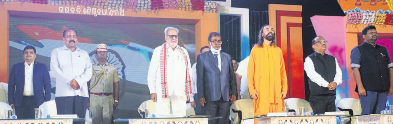
ବାଲିଯାତ୍ରା ଉଦ୍‌ଘାଟନା କାର୍ଯ୍ୟକ୍ରମରେ ରାଜ୍ୟପାଳ ପ୍ରଫେସର ଗଣେଶୀ ଲାଲଙ୍କ ସହ ଅନ୍ୟ ଅତିଥିବୃନ୍ଦ ।

କଟକ ଅପ୍ରିଲ, ୧୭୧୧ ବାଲିଯାତ୍ରାର ଐତିହ୍ୟ ଓ ପରମ୍ପରା ଅତ୍ୟନ୍ତ ଗୌରବମୟ। ଓଡ଼ିଶାର ସମୃଦ୍ଧ ଐତିହ୍ୟ ଓ ଏକ ଉତ୍କଳ ଭବିଷ୍ୟତ ଗଠନର ପ୍ରେରଣା ରହିଛି ଏହି ଯାତ୍ରା ପଛରେ। ବାଲିଯାତ୍ରା ହେଉଛି ସଂସ୍କୃତି ଓ ପ୍ରଗତିର ଅନନ୍ୟ ମିଳନ ସ୍ଥଳ ବୋଲି ରାଜ୍ୟପାଳ ପ୍ରଫେସର ଗଣେଶୀ ଲାଲ କହିଛନ୍ତି। ବାଲିଯାତ୍ରା ଚଳପଡ଼ିଆର ଗଣକବି ବୈଷ୍ଣବ ପାଣି ମଞ୍ଚରେ ବାଲିଯାତ୍ରା ଉଦ୍‌ଘାଟନା କାର୍ଯ୍ୟକ୍ରମ ଗୁରୁବାର ଅନୁଷ୍ଠିତ ହୋଇଥିଲା। ଏଥିରେ ପୁଷ୍ପ ଅଭିଷେକ ଭାବେ ରାଜ୍ୟପାଳ ଯୋଗଦେଇ କହିଥିଲେ, ଯେତେବେଳେ