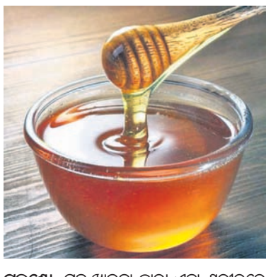
ଚରଣୋ: ମହୁ ଖାଇବା ଦ୍ୱାରା ଏହା ଶରୀରରେ ରକ୍ତ ଶର୍କରା ଏବଂ କୋଲେଷ୍ଟରଲ ପ୍ରଭୃତି