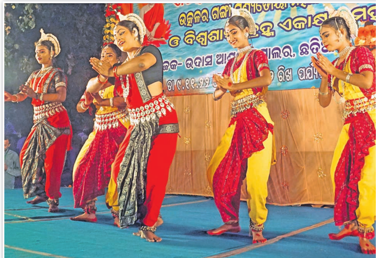
ବାଲିଯାତ୍ରା ପଡ଼ିଆରେ ମହାନଦୀ ଆଳତି କାର୍ଯ୍ୟକ୍ରମ ଅବସରରେ ଅନୁଷ୍ଠିତ ସାଂସ୍କୃତିକ କାର୍ଯ୍ୟକ୍ରମ ।