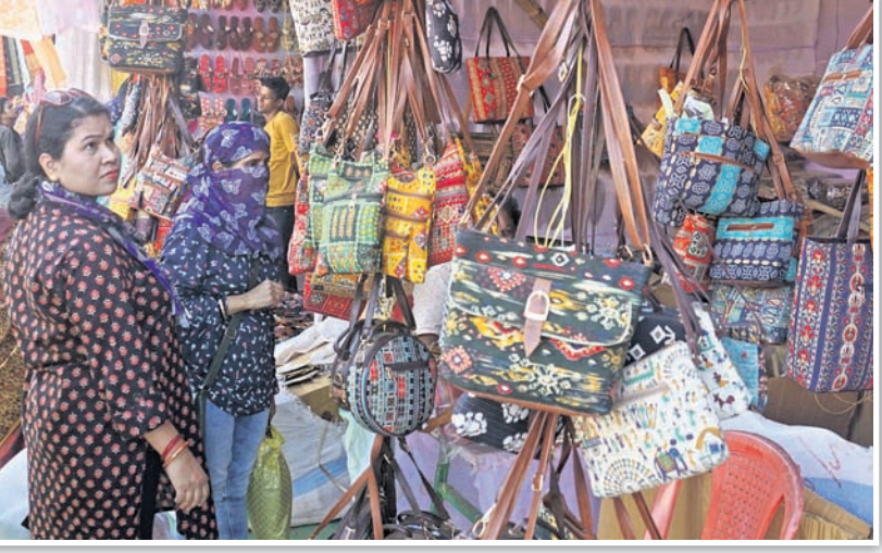
ବାଲିଯାତ୍ରା ଷ୍ଟଲରେ ବିକ୍ରି ହେଉଥିବା ସାମଗ୍ରୀ ।