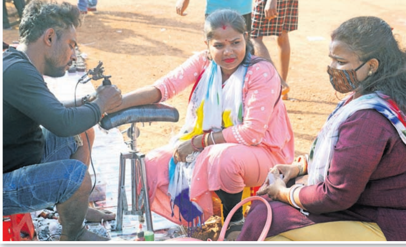
କଟକ ମହିଳା ହାତରେ ତିଆରି କୁଟାଉଛନ୍ତି ।