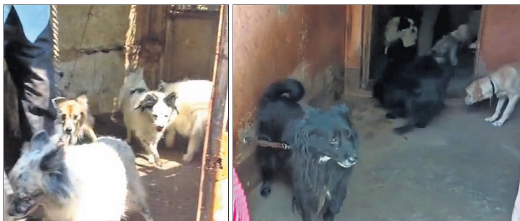
ଲକ୍ଷ୍ମୀସାଗର ଥାନା ଅନ୍ତର୍ଗତ ଗୋବିନ୍ଦ ପ୍ରସାଦ ମୌଜାର ସରକାରୀ ପୁଠରେ ଉଚ୍ଛେଦ ପୂର୍ବରୁ ଜବତ କୁକୁର ।