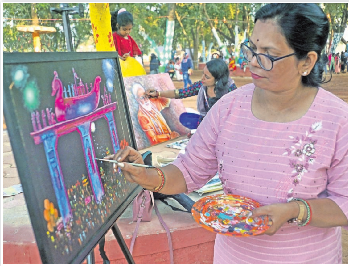
ବାଲିଯାତ୍ରା ପଡ଼ିଆର କଟକ ଇନ୍ କଟକ ଏନ୍‌କ୍ଲୋଚରରେ ଜଣେ ମହିଳା ରଙ୍ଗ ବୁଲୀରେ ରୂପରେଖ ଦେଉଛନ୍ତି ।