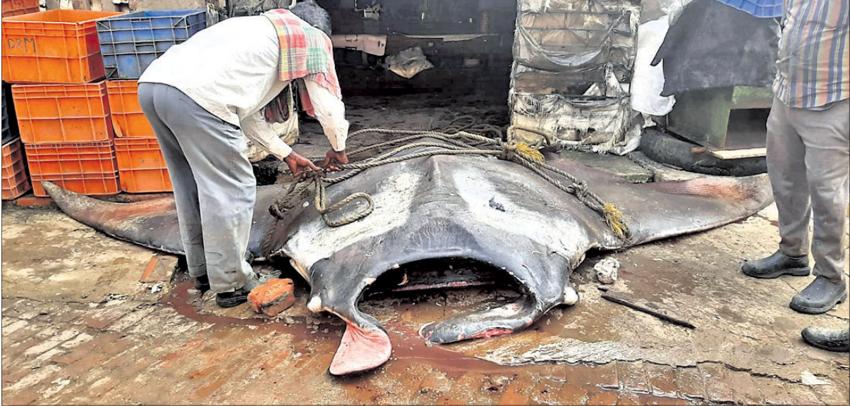
ଦୀଘା ମାଛ ମାର୍କେଟରେ ବିରଳ ପ୍ରଜାତିର ସଙ୍କର ଚିଲ ମାଛ ।

ଭୋଗରାଇ, ୧୮.୧୧ (ଡି.ଏନ.ଏ.) ଓଡ଼ିଶା ସାମୁଦ୍ର ବିଜ୍ଞାନ ବିଭାଗ ଦୀଘା ମୁହାଣ ଗଭୀର ସମୁଦ୍ରକୁ ଶୁକ୍ରବାର ପୁଣି ଏକ ବିରଳ ପ୍ରଜାତିର ସଙ୍କର ଚିଲ ମାଛ ମାଧ୍ୟମାଳଙ୍କ ଲାଲରେ ପଡ଼ିଛି । ପ୍ରକାର ମାଲିକ ଏହି ମାଛକୁ ଦୀଘା ମାର୍କେଟ୍ ନିଲାମ କେନ୍ଦ୍ରକୁ ଆଣି ବିକ୍ରି କରିଛନ୍ତି । ଏହି ମାଛର ଓଜନ ୫ କୁଇଣ୍ଟାଲ ଓ ଦେଖିବାକୁ ଦୈର୍ଘ୍ୟାକୃତି ଭଲ । ବୋଲାକାତାର ଏକ କମ୍ପାନୀ ମାଛକୁ ୨୦ ହଜାର ଟଙ୍କାରେ କିଣି ନେଇଥିବା ସୂଚନା ମିଳିଛି । ଏହି ମାଛକୁ ଦେଖିବାକୁ ମାର୍କେଟ୍ରେ ପର୍ଯ୍ୟଟକ ଓ ସ୍ଥାନୀୟ ଲୋକଙ୍କ ଭିଡ଼ ଜମିଥିଲା । ସଙ୍କର ଜାତୀୟ ମାଛ ସାଧିବା ହୋଇଥିବାରୁ ଜାତୀୟ ଓ ଆନ୍ତର୍ଜାତିକ ବଜାରରେ ବହୁ ଦାମ୍ରେ ବିକ୍ରି କରାଯାଇଥିବା ମଧ୍ୟଜାତୀୟମାନେ କହିଛନ୍ତି । ସୂଚନା ଅନୁଯାୟୀ, ଗତ ୫ ତାରିଖରେ ଦୀଘା ମୁହାଣ ମାଛ ମାର୍କେଟ୍ରେ ସାତେ ୫ କୁଇଣ୍ଟାଲର ଏକ ତେଲିଆ ଭୋଲା ମାଛ ନିଲାମ କରାଯାଇ ୨ଲକ୍ଷ ୨୦ ହଜାରରେ ବିକ୍ରି କରାଯାଇଥିଲା । କିଛିବର୍ଷ ପରେ ଏହି ବିରଳ ପ୍ରଜାତିର ମାଛ ଧରାଯାଇଥିବା ମଧ୍ୟଜାତୀୟମାନେ ପ୍ରକାଶ କରିଛନ୍ତି । ଗଭୀର ସମୁଦ୍ରରେ ଏଭଳି ବିରଳ ପ୍ରଜାତିର ମାଛ ଧରାଯାଇଥିବାରୁ ସାମୁଦ୍ରିକ ଜୀବ ବଂଶ ଲୋପପାଇବ ବୋଲି ଆଶଙ୍କା କରିଥିବା ସାମୁଦ୍ରିକ ବିଜ୍ଞାନୀମାନେ ମତ ପ୍ରକାଶ କରିଛନ୍ତି ।