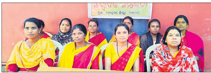
ଖବରଦାତା ସମ୍ପର୍କରେ ଅଜ୍ଞାନତା କର୍ମୀ।