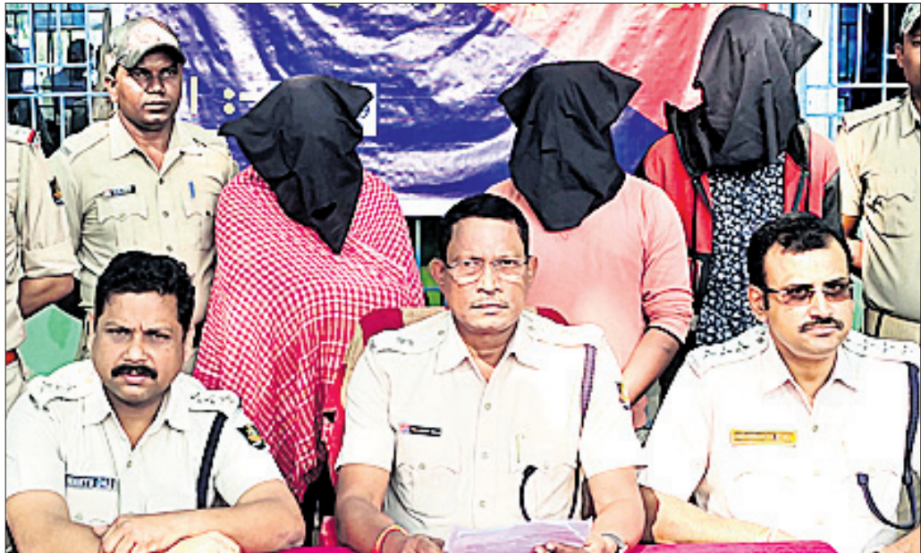
ଖବରଦାତା ସମ୍ପର୍କରେ ପୋଲିସ୍ ଅଭିଯୁକ୍ତଙ୍କ ସମ୍ପର୍କରେ ସୂଚନା ଦେଇଛି।