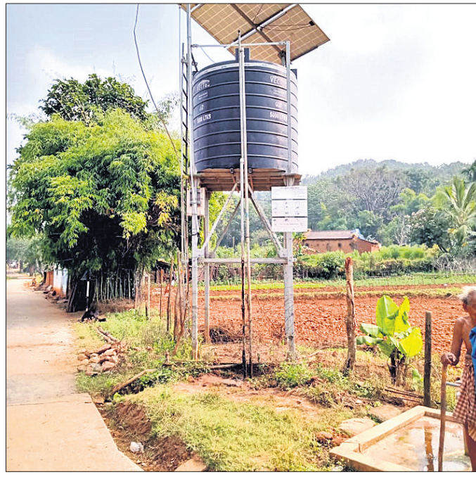
ଟେଙ୍ଗେରୀ ଗ୍ରାମରେ ଅଳ ହୋଇଥିବା ପ୍ରକଳ୍ପ। ପ୍ରଥମେ ପ୍ରକଳ୍ପ ଯୋଗେ ପାଣି ମିଳିବାରୁ ଏହା ଅଳ ହୋଇଗଲା। ପୂର୍ବ ପରି ପୂଣି ବହୁତ ଖୁସି ହୋଇଥିଲା। କିଛି ଦିନ ପରେ ଏହା ଅଳ ହୋଇଗଲା। ପୂର୍ବ ପରି ପୂଣି ଏବେ ରୁଆ ଏବଂ ନାଳ ପାଣି ବ୍ୟବହାର କରୁଛନ୍ତି।

ପୁଲକାଣୀ ଅଫିସ, ୧୮୧୧ ଯୋଗାଇ ଦାନାୟ ଜଳ ପ୍ରକଳ୍ପ ହୋଇଥିଲା। ସେଠାରୁ ଲୋକେ ପାଣି ନେଉଥିଲେ। ଦୁବଘାଟି ଗ୍ରାମର ଉପର ସାହିରେ ବର୍ଷେ ହେବ ଏହି ପ୍ରକଳ୍ପ ହୋଇଥିଲା।