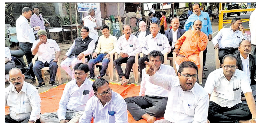
ଆଇନକାରୀମାନେ ରାସ୍ତା ଅବରୋଧ କରିଛନ୍ତି।

ଭଞ୍ଜନଗର, ୧୮୧୧ (ଡି.ଏନ.ଏ.) ଭଞ୍ଜନଗର ବାର୍ ଆସୋସିଏଶନର ଦରିଷ୍ଟ ଦତ୍ତା ଅଭାଙ୍ଗିନୀ ବିଷୟାୟା, ଟାଙ୍କ ଭାଉଜ ଓ ଭାଇଙ୍କ ସମେତ ଅବସରପ୍ରାପ୍ତ ଏସ୍ଆଇ ଏବଂ ଜଣେ ମୁବକଲ୍ ରୁଧିବାର ରାତିରେ ଚୁର୍ଚ୍ଚମାନେ ଆକ୍ରମଣ କରିଥିଲେ।