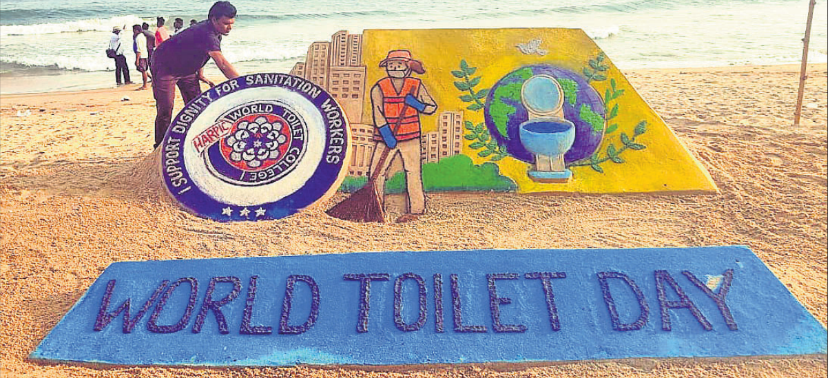
ବିଶ୍ଵ ପାଇଖାନା ଦିବସ ଅବସରରେ ପୂର୍ବରୁ ଶୁକ୍ରବାର ଶିଳ୍ପୀ ସୁଦାନ ସୁଦାନ ପୁରୀ ବେଳାଭୂମିରେ ବାଲୁକା କଳା ମାଧ୍ୟମରେ ସତେଜନା ବାଉଁ ଦେଇଛନ୍ତି ।

ଆଜି ନଭେମ୍ବର ୧୯ ତାରିଖ, ଜାତୀୟ ସଂସ୍କୃତି ଦିବସ, ପୂର୍ବତନ ପ୍ରଧାନମନ୍ତ୍ରୀ ଶ୍ରୀମତୀ ଜୟିରା ଗାନ୍ଧୀଙ୍କ ଜୟନ୍ତୀ, ମାର୍ଗଶିର କୃଷ୍ଣ ଦଶମୀ ସ୍ଵଳ୍ପ ଏକାଦଶୀ, ଶନିବାର, ରାଶି ନକ୍ଷତ୍ର-ଉତ୍ତରୀ ପୁଲଗୁନୀ/କନ୍ୟା, ଏକାଦଶୀର ଏକୋଦିଷ୍ଠ ଓ ପାବିଶଶ୍ରୀଳ, ଦିବା ଘ.୦୨।୨୯.ମି ଗତେ ଘ.୦୮।୪୭ ମଧ୍ୟେ, ଘ.୧।୧୪୩ ଗତେ ଘ.୧।୨।୪୪ ମଧ୍ୟେ ଶୁଭ ଶୁଭବେଳା । ଦିବା ଘ.୦୮।୪୭ ଗତେ ଘ.୧୦।୦୯ ମଧ୍ୟେ ରାହୁକାଳ ।