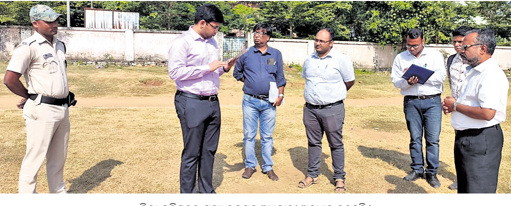
ଜିଲ୍ଲା ପରିଷଦର ମୁଖ୍ୟ ଭବନ ଅଧିକାରୀ ଅନୁଧ୍ୟାନ କରୁଛନ୍ତି।

ବ୍ରହ୍ମପୁର ଠାରେ ଥିବା ଅନୁସ୍ନୋ ସରକାରୀ ହାଇସ୍କୁଲର ଖେଳପଡ଼ିଆକୁ ମିନି ଷ୍ଟାଡ଼ିୟମରେ ପରିଣତ କରାଯିବ। ଏନେଇ ପ୍ରଶାସନ ପକ୍ଷରୁ ପ୍ରକାଶ ଆରମ୍ଭ ହୋଇଛି। ବ୍ରହ୍ମପୁର ଠାରେ କ୍ରୀଡା ବିଭାଗ ପକ୍ଷରୁ ଷ୍ଟାଡ଼ିୟମ ରହିଥିବା ବେଳେ ଏଠାରେ ମିନି ଷ୍ଟାଡ଼ିୟମ ନ ଥିଲା। ରାଜ୍ୟ ସରକାରଙ୍କ ପକ୍ଷରୁ ସମସ୍ତ ସହରରେ ଗୋଟିଏ ଖେଳାସ ପିନି ଷ୍ଟାଡ଼ିୟମ ସ୍ଥାପନ ଲାଗି ୪ ବର୍ଷ ପୂର୍ବେ ସ୍ଥିର ହୋଇଥିଲା। ମାତ୍ର କୌଣସି କାରଣବଶତଃ ଜିଲ୍ଲାର ହେଡକ୍ୱାର୍ଟର ବ୍ରହ୍ମପୁର ହୋଇ ମଧ୍ୟ ଏଠାରେ ମିନି ଷ୍ଟାଡ଼ିୟମ ସ୍ଥାପନ ପାଇଁ ପଦକ୍ଷେପ ନିଆଯାଇ ନ ଥିଲା। ଏବେ ବ୍ରହ୍ମପୁରସ୍ଥିତ ଅନୁସ୍ନୋ ସରକାରୀ ହାଇସ୍କୁଲର ଖେଳପଡ଼ିଆକୁ ମିନି ଷ୍ଟାଡ଼ିୟମ ଭାବେ ପରିଣତ କରିବା ପାଇଁ