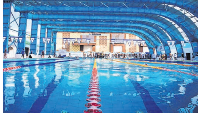
(ବାମ), ସୁଲିମ୍ ଫେଡେରେଶନ ଅଫ୍ ଇଣ୍ଡିଆ, ରାଜ୍ୟ ସରକାରଙ୍କ କ୍ରୀଡ଼ା ଓ ଯୁବବ୍ୟାପାର ବିଭାଗ ଏବଂ ଓଡ଼ିଶା ରାଜ୍ୟ ସ୍ପୋର୍ଟସ୍ ଆୟୋଗର ମିଳିତ ଆୟତ୍ତକୁଳ୍ୟରେ ଏହି ପ୍ରତିଯୋଗିତା ହେବ।

କଳିଙ୍ଗ ଖ୍ରୀତିଯମସ୍ଥିତ ବିଜୁ ପଟ୍ଟନାୟକ ସ୍ପୋର୍ଟସ୍ ପୁଲ୍‌ରେ ଶନିବାରଠାରୁ ଖେଳା ଇଣ୍ଡିଆ ଜୁନିୟର ମହିଳା ସନ୍ତରଣ ସିରିଜ ଗୋଟିଏ ୨-୨ ଆରମ୍ଭ ହେବ। ଏଥିରେ ଓଡ଼ିଶା, ବିହାର, ଛତିଶଗଡ଼, ଝାଡ଼ଖଣ୍ଡ ଓ ମଧ୍ୟପ୍ରଦେଶ ଆଦି ୫ଟି ରାଜ୍ୟର ପ୍ରତିଯୋଗୀ ଅଂଶଗ୍ରହଣ କରିବେ। ଓଡ଼ିଶାରେ ପ୍ରଥମଥର ପାଇଁ ଏହି ପ୍ରତିଯୋଗିତା ଆୟୋଜନ ହେବ।