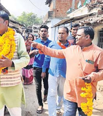
ସାଁ ଗାଁ ବୁଲି ପ୍ରଚାର କରୁଛନ୍ତି ଭାଜପା ପ୍ରାର୍ଥୀ ।