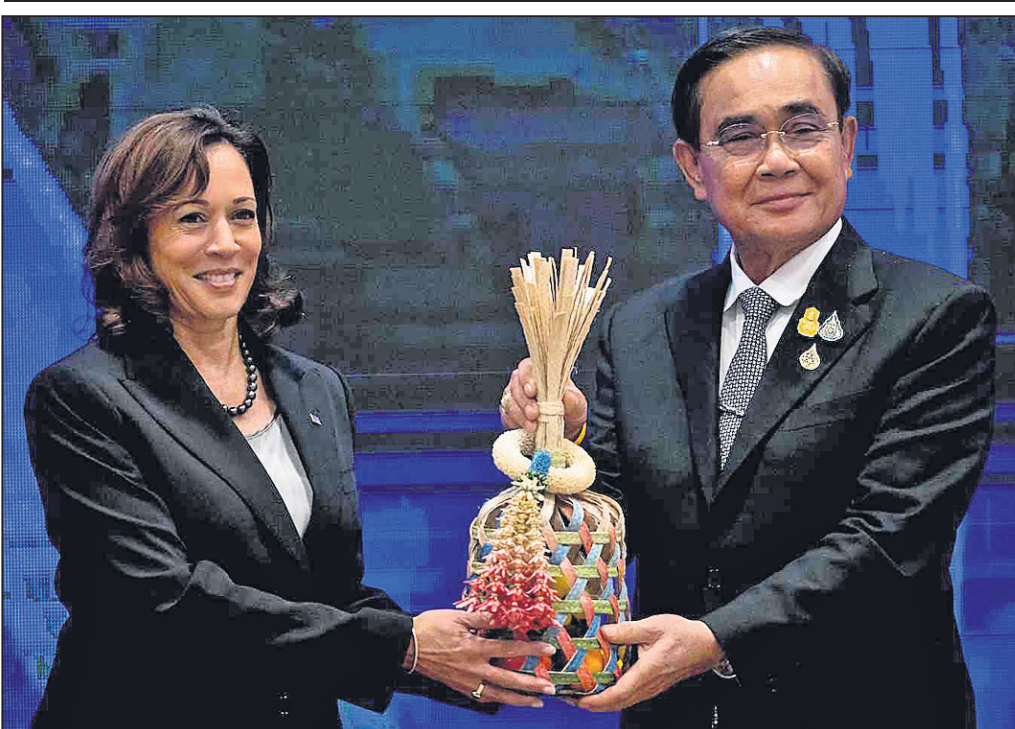
ଆଇଲାଣ୍ଡ ପ୍ରଧାନମନ୍ତ୍ରୀ ପ୍ରୟୁ ଗାନ୍ତୋଗା ଶନିବାର ଆମେରିକା ଉପରାଷ୍ଟ୍ରପତି କମଲା ହାରିସ୍‌ଙ୍କୁ ତାଲୋମ ହସ୍ତାନ୍ତର କରୁଛନ୍ତି। ଆସନ୍ତାବର୍ଷ ଖ୍ରୀଷ୍ଟିୟନ ଏପିଲିସି ସମିତ୍ ଆୟୋଜନ କରିବ।

ଓ ଆର୍ଥିକ ସମସ୍ୟା ସୃଷ୍ଟି ହୋଇଥିବା ସେମାନେ କହିଛନ୍ତି। ଇଣ୍ଡୋନେସିଆର ବାଲିଠାରେ ଶେଷ ହୋଇଥିବା ଜି୨୦ ସମିତ୍ରେ ମଧ୍ୟ ମୁକ୍ତେ-ଦେଶାଦେବୀ ସହ ଖାଦ୍ୟ ଅଭାବରୁ