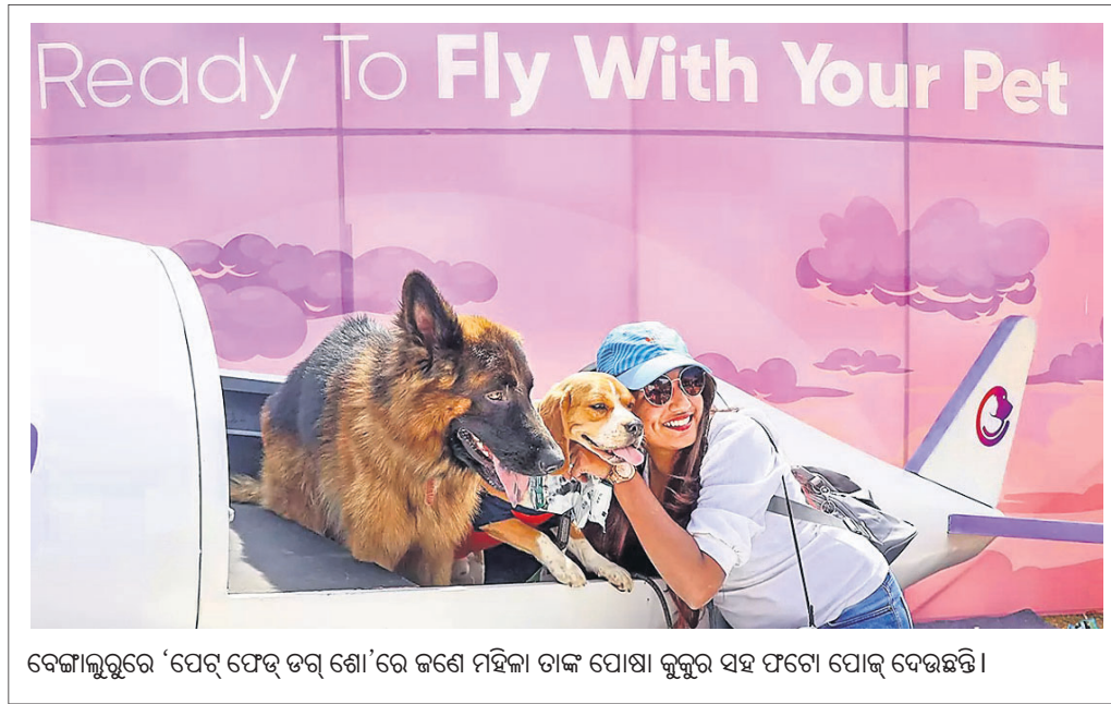
ବେଙ୍ଗାଲୁରୁରେ 'ପେଟ୍ ଫୋର୍ ଡଗ୍ ଶୋ'ରେ ଜଣେ ମହିଳା ତାଙ୍କ ପୋଷା କୁକୁର ସହ ଫଟୋ ପୋର୍ଟ ଦେଉଛନ୍ତି।

ନେପାଳ ପାର୍ଲିମେଣ୍ଟ ଏବଂ ପ୍ରାଦେଶିକ ବିଧାନସଭାକୁ ନିର୍ବାଚନ କରିବା ପାଇଁ ନେପାଳ କଂଗ୍ରେସ୍ ନେତୃତ୍ୱାଧୀନ ମେଣ୍ଟ ବିଜୟୀ ହେବା ଆଶା କରାଯାଉଥିଲେ ମଧ୍ୟ ରାଜନୈତିକ ଦ୍ୱିରତା ଆଶିରାଜିରେ ବିଫଳ ହୋଇପାରେ ବୋଲି କୁହାଯାଉଛି। ୭ ପ୍ରଦେଶର ୧ କୋଟି ୬୯ ଲକ୍ଷ ଭୋଟର ସେମାନଙ୍କ ମତାଧିକାର ବ୍ୟବହୃତ କରିବେ। ଫେଡେରାଲ ପାର୍ଲିମେଣ୍ଟର ୨୭୫ ସଦସ୍ୟଙ୍କ ମଧ୍ୟରୁ ୧୭୫ ଜଣ ପ୍ରତ୍ୟକ୍ଷ ଭୋଟିଂରେ ନିର୍ବାଚିତ ହେବାକୁ ଥିବାବେଳେ ଅବଶିଷ୍ଟ ୧୧୦ ସଦସ୍ୟ ଆନୁସାରିକ ଇଲେକ୍ଟୋରାଲ ବ୍ୟବସ୍ଥାରେ ନିର୍ବାଚିତ ହୋଇଥାନ୍ତି। ସେହିପରି ପ୍ରାଦେଶିକ ବିଧାନସଭାର ୫୫୦ ସଦସ୍ୟଙ୍କ ମଧ୍ୟରୁ ୩୩୦ ପ୍ରତ୍ୟକ୍ଷ ଓ ୨୨୦ ଜଣ ଆନୁସାରିକ ପଦ୍ଧତିରେ ନିର୍ବାଚିତ ହୁଅନ୍ତି। ମତଦାନ ପରେ ଭୋଟଗଣତି ହେବାକୁ ଥିବାବେଳେ ବୃତ୍ତାନ୍ତ ଫଳାଫଳ ପାଇଁ କିଛିଦିନ ଲାଗିବ ବୋଲି କୁହାଯାଉଛି।