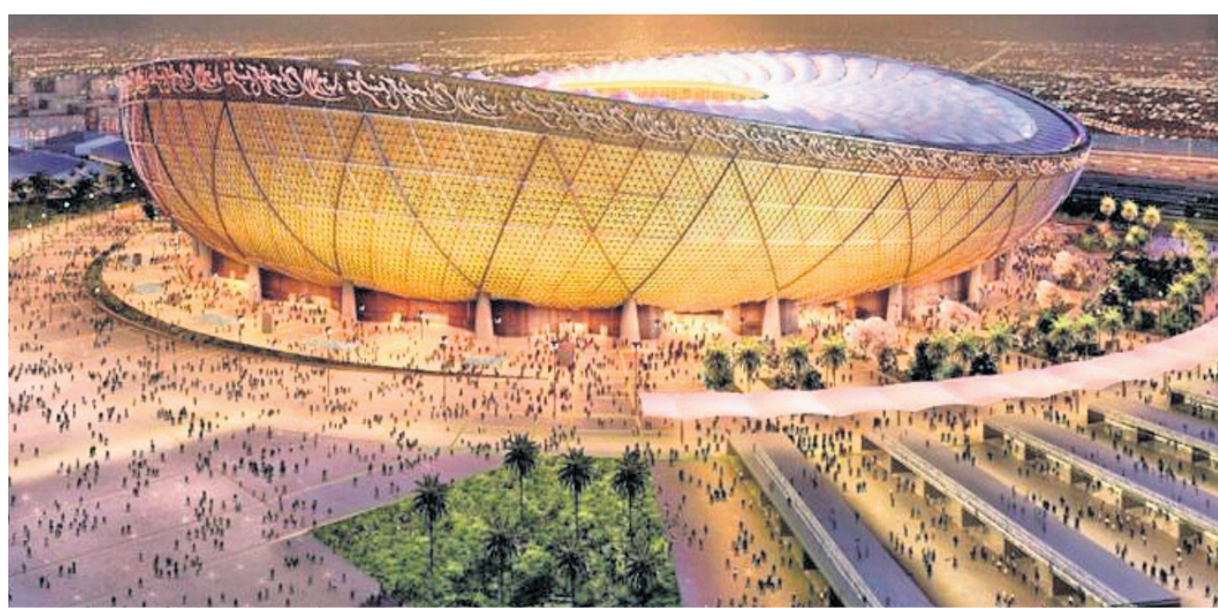
କାତାରର ସର୍ବାଧିକ ୮୦,୦୦୦ ଦର୍ଶକ କ୍ଷମତା ବିଶିଷ୍ଟ ଲୁସେଲ ଆଇକନିକ୍ ସ୍ଵାତିୟମ।