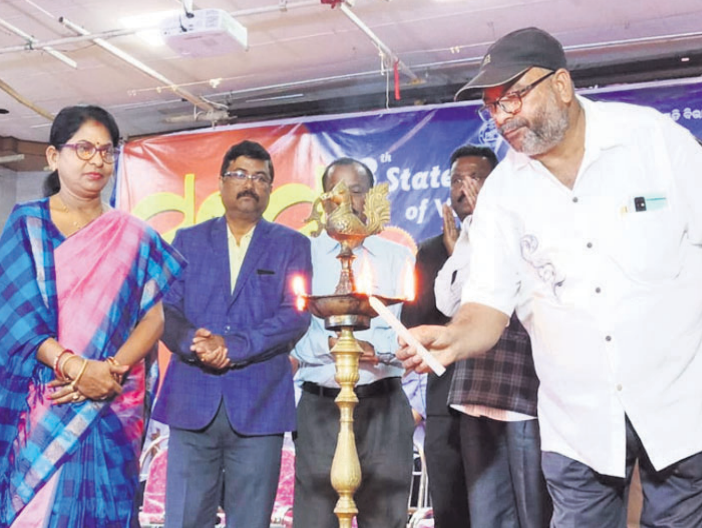
'ସମ୍ପର୍କ' କାର୍ଯ୍ୟକ୍ରମର ଉଦ୍‌ଘାଟନ କରାଯାଇଛି।

ପ୍ରକାଶ କରିଥିଲେ। ଅନ୍ୟତମ ଅତିଥି ଭାବେ ରାଣୀପାଟଣା ଦୃଷ୍ଟିହୀନ ବିଦ୍ୟାଳୟର ମୁଖ୍ୟ ବିବାକର ସ, ବରିଷ୍ଠ ସଦସ୍ୟ ସ୍ନାତକ ଦାସ, ଦୃଷ୍ଟିହୀନ ଉପସାଧକ ପ୍ରମୁଖ ମହାକୁଡ଼ ପ୍ରମୁଖ ମହାସାନ ହୋଇ ବକ୍ତବ୍ୟ ପ୍ରଦାନ କରିଥିଲେ।