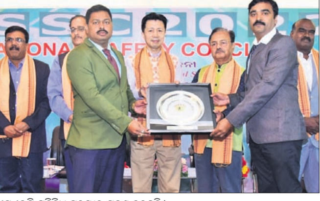
ଟିଏସ୍‌ଏଲ୍‌ପି ପ୍ରତିନିଧି ପୁରସ୍କାର ଗ୍ରହଣ କରୁଛନ୍ତି।

ଯୋଡ଼ା, ୧୯୧୧ (ଡି.ଏନ.ଏ.) ଶ୍ରମ ଏବଂ ଇସ୍‌ସାଧକ ବିଭାଗ ଓଡ଼ିଶାରେ ଏକ ସରକାରୀ ପୁରସ୍କାର ପ୍ରଦାନ କରିବା ପାଇଁ ଟିଏସ୍‌ଏଲ୍‌ପିକୁ ସମ୍ମାନଜନକ କଳିଙ୍ଗ ସୁରକ୍ଷା ଉତ୍କର୍ଷ ପୁରସ୍କାର ପ୍ରଦାନ କରାଯାଇଛି।