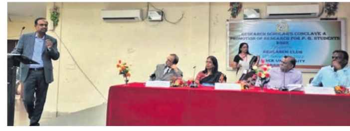
ପ୍ରୋତ୍ସାହନ ସମ୍ମିଳନୀରେ ଉପସ୍ଥିତ ଅତିଥି।

ବାର୍ତ୍ତାପତ୍ର ପତ୍ରାଳୟ ଶ୍ରୀରାମଚନ୍ଦ୍ର ଭଞ୍ଜଦେଓ ବିଶ୍ୱବିଦ୍ୟାଳୟରେ ଗବେଷକ ଓ ସ୍ନାତକୋତ୍ତର ଛାତ୍ରାଛାତ୍ରୀଙ୍କୁ ଗବେଷଣା ନିମନ୍ତେ ପ୍ରୋତ୍ସାହନ ପାଇଁ ଏକ ସମ୍ମିଳନୀ ବିଶ୍ୱବିଦ୍ୟାଳୟର ସମ୍ମେଳନ କକ୍ଷରେ ଶନିବାର ଅନୁଷ୍ଠିତ ହୋଇଯାଇଛି।