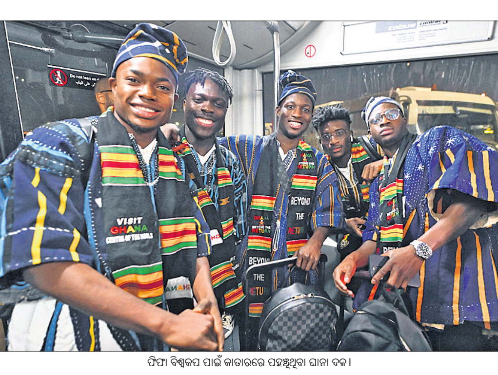
ଫିଫା ବିଶ୍ଵକପ ପାଇଁ କାତାରରେ ପହଞ୍ଚିଥିବା ଗାନା ଦଳ।

ଉଦ୍‌ଘାଟନା ସମାରୋହ ସମୟ ଓ ପ୍ରସାରଣ ଆରମ୍ଭ ସମୟ: ସନ୍ଧ୍ୟା ୭.୩୦ (ଭାରତୀୟ ସମୟ) ଅଲ୍ ବାୟଟ୍ ସ୍ଵାତିୟମ ପ୍ରସାରଣ: ସ୍ଵୋର୍ଡ୍ ୧୮ ଓ ଲିଓ ସିନେମା