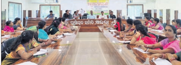
ରୁକ୍ମ ସଭାଗୃହରେ ଅନୁଷ୍ଠିତ ଦକ୍ଷତା ବୃଦ୍ଧି ତାଲିମ ଶିବିର।

ଖଜରା, ୧୯୧୧ (ଡି.ଏନ.ଏ.) ସାମାଜିକ ସମାଜକ ହେମନ୍ତ କୁମାର ପାଠ୍ୟ ପ୍ରମୁଖ ଅଧିକାରୀ ଯୋଗଦେଇ ପ୍ରଧାନମନ୍ତ୍ରୀ ଆବାସ ଦ୍ୱାରା କରାଯାଇଥିବା ଦକ୍ଷତା ବୃଦ୍ଧି ତାଲିମ ଶିବିର ଅନୁଷ୍ଠିତ ହୋଇଯାଇଛି।