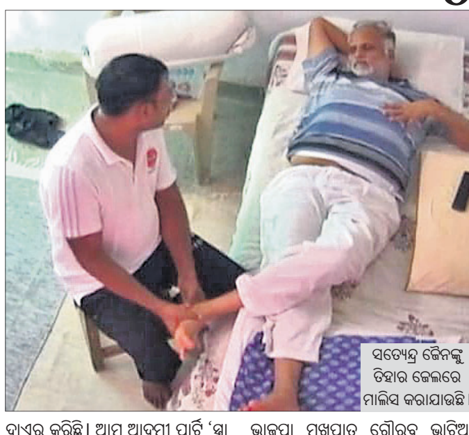
ସତ୍ୟେନ୍ଦ୍ର ଜେନାଙ୍କୁ ତିହାର ଜେଲରେ ମାଲିସ୍ କରାଯାଇଛି।

ମନିଲଖଣ୍ଡି ମାମଲାରେ ଦିଲ୍ଲୀ ଜେଲ ବିଭାଗ ମନ୍ତ୍ରୀ ସତ୍ୟେନ୍ଦ୍ର ଜେନା ଗିରଫ ହୋଇ ତିହାର ଜେଲରେ ରହିଥିବାବେଳେ ତାଙ୍କୁ ସେଠାରେ ମାଲିସ୍ କରାଯାଇଥିବାର ଭିତ୍ତି ଭାଇରାଲ ହୋଇଛି। ଏହାକୁ ନେଇ ବିରୋଧୀ ଦଳ ଭାଙ୍ଗିବା ଦିଲ୍ଲୀ ମୁଖ୍ୟମନ୍ତ୍ରୀ ଅରବିନ୍ଦ କେଜ୍ରିୱାଲ ଏବଂ ଆର୍ମ୍ ଆର୍ଦ୍ମା ପାର୍ଟିକୁ ସମାଲୋଚନା କରିଛି। ଜେନାଙ୍କୁ ଜେଲରେ ସ୍ୱତନ୍ତ୍ର ଚର୍ଚ୍ଚା କରାଯାଉଥିବା ଅଭିଯୋଗକୁ ଏହା ପ୍ରମାଣିତ କରିଛି। ଅନେକ ଭାଙ୍ଗିବା ନେତା ଉକ୍ତ ଭିତ୍ତି କ୍ରିପ୍‌କୁ ସୋସିଆଲ ମିଡିଆରେ ଶେୟାର କରିଛନ୍ତି। ଜେନା ମୁଖ୍ୟମନ୍ତ୍ରୀ କେଜ୍ରିୱାଲଙ୍କ ବଡ଼ି ଆଦାୟ ଏବେଠି ଥିଲେ ବୋଲି ଭାଙ୍ଗିବା ଅଭିଯୋଗ କରିବା ସହ ଉଭୟଙ୍କ ବିରୋଧରେ ଏତଲା