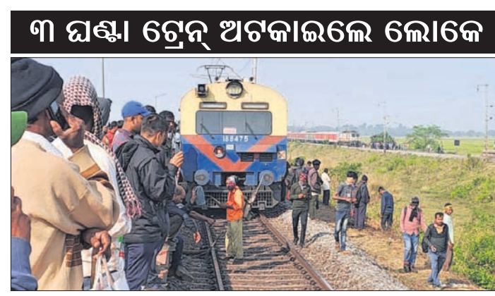
ଭାଙ୍ଗପାସାଗରୀ, ୧୯୧୧ (ସ.ପ୍ର.) ଉଦ୍ଧାରକର୍ମରେ ଉପସ୍ଥିତ ଲୋକେ

କଳେଶ୍ୱର, ୧୯୧୧ (ଡି.ଏନ.ଏ.): କଳେଶ୍ୱର ନିର୍ଦ୍ଦଳନମଣ୍ଡଳାସ୍ଥରାୟ ଭାଙ୍ଗପା ସାଙ୍ଗଠିକ ଚୈଠକ ଗୋବରଦତୀ ପଞ୍ଚାୟତରେ ଅନୁଷ୍ଠିତ ହୋଇଯାଇଛି।