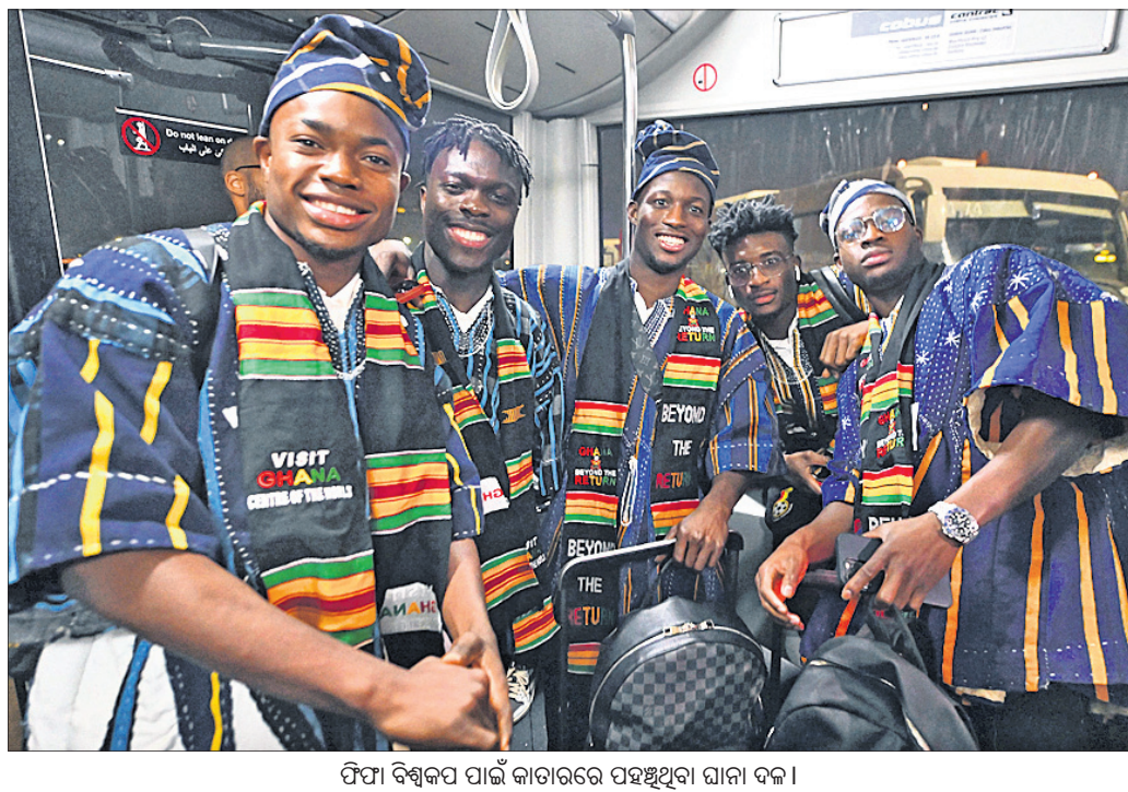
ଫିଫା ବିଶ୍ୱକପ ପାଇଁ କାତାରରେ ପହଞ୍ଚିଥିବା ଗାନା ଦଳ।