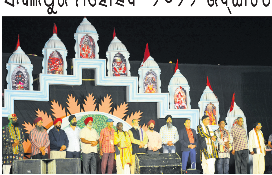
ରବିବାର ସମ୍ବଲପୁର ମହୋତ୍ସବ ଉଦ୍ଘାଟନା ଉତ୍ସବରେ ଅତିଥି ଓ କର୍ମକର୍ତ୍ତା ।