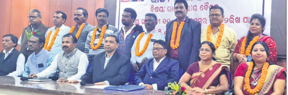
ଭାରତୀୟ ଦଳିତ ସାହିତ୍ୟ ଏକାଡେମୀ ବୈଠକରେ ଅତିଥି ଓ ଅନ୍ୟମାନେ ।