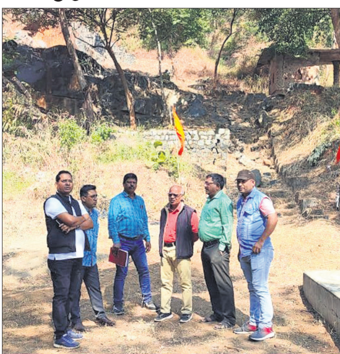
ରବିବାର ସମ୍ବଲପୁର ମହାନଗର ନିଗମ ଅନ୍ତର୍ଗତ କୁଦୋପାଳି ଐତିହାସିକ ସ୍ଥଳକୁ କମିଶନର ଓ ଅନ୍ୟମାନେ ପରିଦର୍ଶନ କରୁଛନ୍ତି ।

ସମ୍ବଲପୁର ସହର ଉପକଣ୍ଠରେ କୁଦୋପାଳି ପାହାଡ଼ ରହିଛି । ଇଂରେଜ ଓ ସାଧାରଣ ସଂଗ୍ରାମୀଙ୍କ ମଧ୍ୟରେ ଯୁଦ୍ଧର ମୂଳସାକ୍ଷୀ ହେଉଛି ଏହି ଐତିହାସିକ ସ୍ଥଳ । ରକ୍ତତୀର୍ଥ କୁଦୋପାଳି କୁଦୋପାଳି ପାହାଡ଼ ଓ ଐତିହାସିକ କିର୍ତ୍ତିରାଜିର ପୁନରୁଦ୍ଧାର ହେବ । ଏନେଇ ପ୍ରଶ୍ନାସନ ପକ୍ଷରୁ ତତ୍ପରତା ପ୍ରକାଶ ପାଇଛି । ଗତ ୧୪ ତାରିଖ ଦିନ ଏହି ସ୍ଥାନରେ ଥିବା ପ୍ରାଚୀନ କାର୍ତ୍ତି, ମନ୍ଦିର, ଗୁମ୍ଫା, ମୂର୍ତ୍ତିର ପୁନରୁଦ୍ଧାର ଓ ରକ୍ଷଣାବେକ୍ଷଣ କରାଯାଇ ବୋଲି ଧରିତ୍ରୀରେ ଖବର ପ୍ରକାଶ ପାଇଥିଲା ।