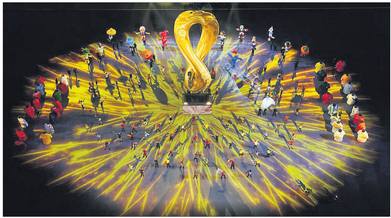
କାତାରର ଅଲ୍‌ବାୟର୍ ଷ୍ଟାଡ଼ିୟମରେ ରବିବାର ପିଫା ବିଶ୍ୱକପ୍ ଉଦ୍‌ଘାଟନା ଉତ୍ସବରେ କଳାକାରମାନେ ନୃତ୍ୟ ପରିବେଷଣ କରୁଛନ୍ତି । (ଅଧିକ ଫଟୋ ଓ ରିପୋର୍ଟ ଖୋଜନ୍ତୁ)