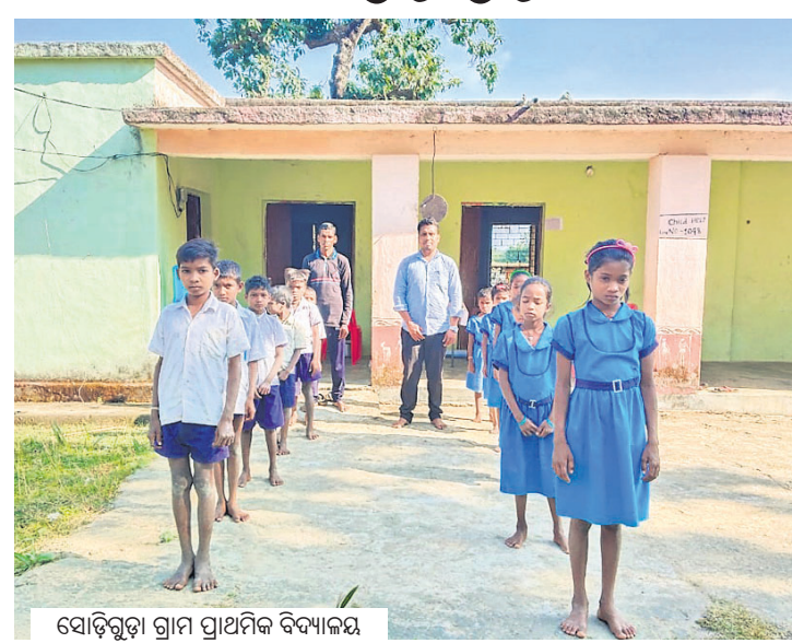
ସୋଡ଼ିଗୁଡ଼ା ଗ୍ରାମ ପ୍ରାଥମିକ ବିଦ୍ୟାଳୟ

ଓଡ଼ିଆ ଭାଷାକୁ ବିପଦ କରିବାକୁ ଆନ୍ତରାଜ୍ୟରେ ଉପସ୍ଥାପନ ହେଉଛି କିମ୍ବା କିମ୍ବଦନ୍ତୀ ଫଳରେ ଓଡ଼ିଆର ସାମାଜିକ ଗ୍ରାମଗୁଡ଼ିକରେ ତେଲୁଗୁ ଏବଂ ହିନ୍ଦୀ ଭାଷାର ପ୍ରାବଳ୍ୟ ଅନୁଭୂତ ହେଲାଣି । ଆଦିବାସୀଙ୍କ କଥିତ ଆଞ୍ଚଳିକ ଭାଷା ଏବଂ ଲିଖିତ ଓଡ଼ିଆ ଭାଷା ମଧ୍ୟରେ ରହିଥିବା ବ୍ୟବଧାନ ଏବେ ଛିଟିକି ଆହୁରି ଜଟିଳ କରିପକାଇଲାଣି । ବିଶେଷ କରି ମାଲକାନଗିରି ଜିଲ୍ଲାର ବଣ୍ଡା, ଦିସାୟା, କୋୟା ସମ୍ପ୍ରଦାୟର ଜନଜାତି ସମ୍ପ୍ରଦାୟର ଛାତ୍ରାଛାତ୍ରୀ ଓଡ଼ିଆ ଭାଷାର ଶବ୍ଦକୁ ଆୟତ୍ତ କରି ନ ପାରିବା ଏବଂ ସେମାନଙ୍କ ଲାଗି ନିୟୋଜିତ ବହୁଭାଷୀ ଶିକ୍ଷକଙ୍କ ସହ ଭାବ ବିନିମୟ ଶତ ପ୍ରତିଶତ ସଫଳ ନ ହେବା କାରଣରୁ ଉପାନ୍ତ ଅଞ୍ଚଳରେ ଛିଟି ରକ୍ଷା ଲାଗି ସଂଘର୍ଷ କରୁଛି ଓଡ଼ିଆ ଭାଷା ।