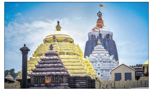
ପୁରୀ ଅଫିସ୍, ୨୦୧୧

ସେଥିପାଇଁ ମିଡିଆରେ ଶ୍ରୀମନ୍ଦିର ଗର୍ଭଗୃହ ଫଟୋ ଭାଇରାଲ ହେବା ଘଟଣାକୁ ନେଇ ଶ୍ରୀମନ୍ଦିର ପ୍ରଶାସନ ପକ୍ଷରୁ ତତ୍ପରତା ପ୍ରକାଶ ପାଇଛି।