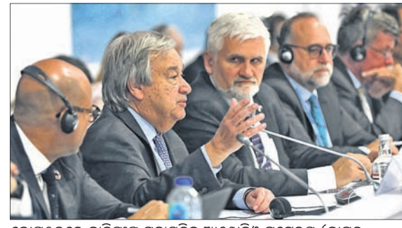
କୋପୂ୨୭ରେ କାଟିସଂଘ ମହାସଭାରେ ଆଷ୍ଟ୍ରେଲିଆ ଗୁଡ଼େରସ୍ (ବାମରୁ ଦ୍ୱିତୀୟ)ଙ୍କ ସମେତ ଅନ୍ୟ ଦେଶର ପ୍ରତିନିଧିମାନେ ।