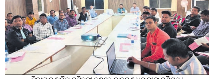
ଜିଲ୍ଲାପାଳ ଅଧିକାରୀଙ୍କୁ ପ୍ରଶିକ୍ଷଣ କରିବା ପାଇଁ ଅଧିକାରୀଙ୍କୁ ପ୍ରଶିକ୍ଷଣ।

ବରଗଡ଼ ଜିଲ୍ଲା ପଦ୍ମପୁର ଉପନିର୍ବାଚନ ଯେତିକି ପାଖେଇ ଆସୁଛି, ପ୍ରଶାସନିକ ପ୍ରଶିକ୍ଷଣ ଆବଶ୍ୟକ ହେଉଛି। ରବିବାର ଜିଲ୍ଲାପାଳଙ୍କ ଅଧିକାରୀଙ୍କୁ ପ୍ରଶିକ୍ଷଣ କକ୍ଷରେ ପୋଷ୍ଟାଳ ବାଲଟ୍ ଅଧିକାରୀଙ୍କୁ ପ୍ରଶିକ୍ଷଣ କାର୍ଯ୍ୟକ୍ରମ ହୋଇଥିଲା। ଅତିରିକ୍ତ ଜିଲ୍ଲାପାଳ ମିର୍ଷା ଚଟ୍ଟୋପା ଅଧିକାରୀଙ୍କୁ ପ୍ରଶିକ୍ଷଣ କରାଯାଇଥିଲା। ଅତିରିକ୍ତ ଜିଲ୍ଲାପାଳ ମିର୍ଷା ଚଟ୍ଟୋପା ଅଧିକାରୀଙ୍କୁ ପ୍ରଶିକ୍ଷଣ କରାଯାଇଥିଲା।