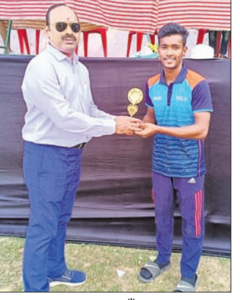
ସହିଦ ନଗର ଟିମର ରୁଜ୍ଜି କାଲିଆ ପ୍ଲେୟର୍ ଅର୍ପି ଦି ମ୍ୟାଚ୍ ପରେ ଗ୍ରହଣ କରୁଛନ୍ତି।

ଭୁବନେଶ୍ୱର, ୨୧।୧୧, (ସୋର୍ଟ୍ କ୍ୟୁବୋ): କେଶୁରା ଖେଳ ପଡିଆରେ ଅନୁଷ୍ଠିତ ଏକାମ୍ର କପ୍ ଟେନିସ ବଲ ଟୁର୍ନାମେଣ୍ଟର ସେମି ଫାଇନାଲରେ ପ୍ରବେଶ କରିଛି ସହିଦ ନଗର। ସୋମବାର ଅନୁଷ୍ଠିତ କ୍ୱାର୍ଟର ଫାଇନାଲରେ କଟକର ଚାର୍ଲ ଏକାଦଶକୁ ୭ ରଲ୍ଲେ ହରାଇ ପରାସ୍ତ କରିଥିଲା ସହିଦ ନଗର। ପ୍ରଥମେ ବ୍ୟାଟି କରି ଚାର୍ଲ ଏକାଦଶ ୧୦ ଓଭରରେ ୧୦୭ ରନରେ