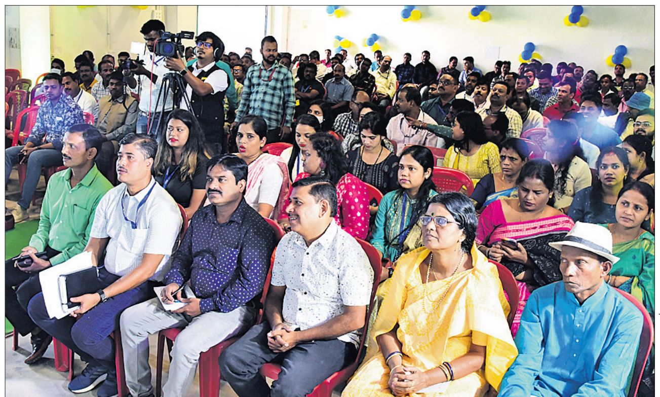
ବନ୍ଧୁମିଳନ କାର୍ଯ୍ୟକ୍ରମରେ ସମବେତ ହୋଇଥିବା ଧରିତ୍ରୀ ପରିବାରର ସଦସ୍ୟ ଏବଂ ଖବରଦାତାମାନେ।