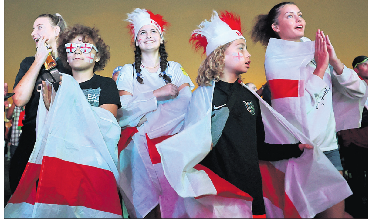
ଇଂଲଣ୍ଡ ପୁରୁଷ ଦଳକୁ ଉତ୍ସାହିତ କରୁଛନ୍ତି ସମର୍ଥକ।

୭୧ ତମ ମିନିଟ୍ରେ ମାର୍କସ ରାସଫୋର୍ଡ ଓ ୮୯ ତମ ମିନିଟ୍ରେ ଜ୍ୟାକ୍ ଗ୍ରାଲିସ୍ ଗୋଟିଏ ଲୋଖାଏ ଗୋଲ ଘୋର କରିବାରୁ ଇଂଲଣ୍ଡ ୬-୧ରେ ଆଗୁଆ ରହିଥିଲା। ମାତ୍ର ମ୍ୟାଚ ଇଣ୍ଡିଆ ଟାଇମ୍ରେ ରହିଥିବା ବେଳେ ଇରାନ ପକ୍ଷରୁ ତଥା ବ୍ୟକ୍ତିଗତ ତୃତୀୟ ଗୋଲ ଘୋର କରିଥିଲେ ମେହଦୀ ଟାରେମୀ। ବନ୍ଧୁ ମଧ୍ୟରେ ସାର୍ ଟାୟାଲିଆ ବେଳେ ଇରାନକୁ ଏକ ପେନାଲ୍ଟି ମିଳିଥିଲା। ଟାରେମୀ ଏହାକୁ ଗୋଲରେ ପରିଣତ କରିଥିଲେ ହେଁ ଇଂଲଣ୍ଡ ବୃହତ ବିଜୟ ହାସଲ କରିଥିଲା।