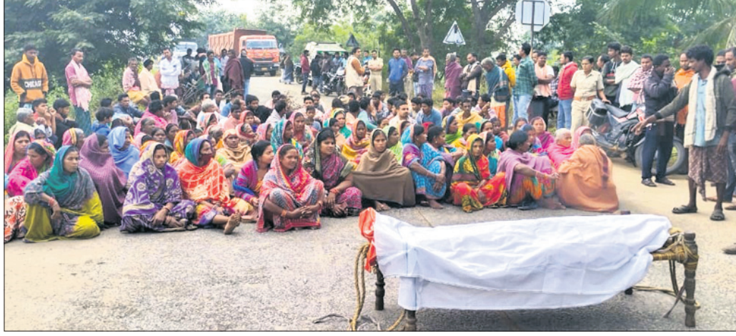
ଭବ୍ୟ ଲୋକେ ଆଠମଲିକ-କିଆକଟା ରାଜ୍ୟ ରାଜପଥ ଅବରୋଧ କରିଛନ୍ତି।