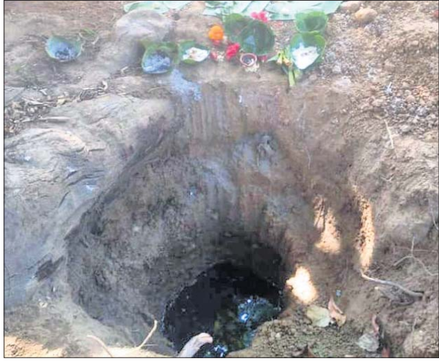
ଶିଶୁ ବଳି ପାଇଁ ଖୋଜାଯାଇଥିବା ଗାଡ଼।