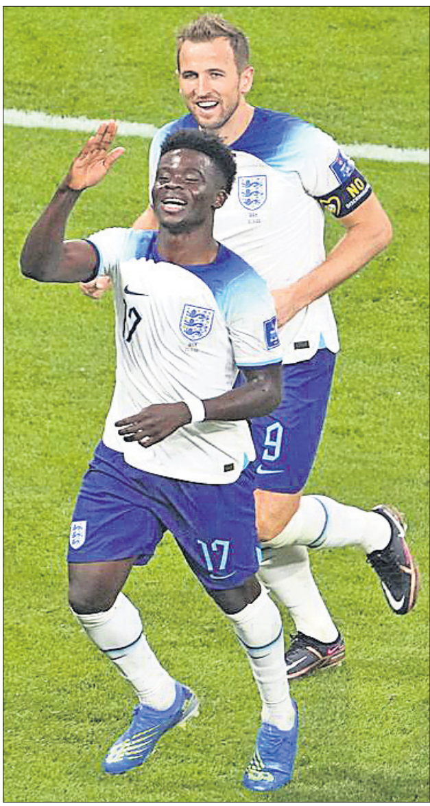
ଗୋଲ ଘୋର ପରେ ଖୁସି ମୁହୂର୍ତ୍ତରେ ଇଂଲଣ୍ଡର ବୁକାୟୋ ସାକା।

ବୋହା, ୨୧।୧୧ କାତାରରେ ଅନୁଷ୍ଠିତ ଫିଫା ବିଶ୍ୱକପ ୨୦୨୨ର ତୃତୀୟ ମ୍ୟାଚରେ ବୃହତ ବିଜୟ ହାସଲ କରିଛି ଇଂଲଣ୍ଡ। ଫ୍ରିଜର ବୁକାୟୋ ସାକାଙ୍କ ଡବଲ ଗୋଲ ଗୋଲ ୬-୨ରେ ଇରାନକୁ ପରାସ୍ତ କରିଥିଲା। ଇଂଲଣ୍ଡ ଖଲିଫା ଷ୍ଟାଡ଼ିୟମରେ ଆଡସବାକି ପ୍ରଦର୍ଶନ ପରେ ମ୍ୟାଚ ଆରମ୍ଭ ହୋଇଥିଲା। ଇଂଲଣ୍ଡ ୪-୨-୩-୧ ଓ ଇରାନ ୫-୪-୧ କମିନେଶନରେ ପଡିଆକୁ ଓହ୍ଲାଇଥିଲେ। ମ୍ୟାଚ ଆରମ୍ଭରୁ ବିଶ୍ୱ ମାନ୍ୟତାରେ ୫ମ ସ୍ଥାନରେ ଥିବା ଇଂଲଣ୍ଡ ଆକ୍ରମଣାତ୍ମକ ପୁରୁଷ ଖେଳିଥିଲା। ପ୍ରଥମାର୍ଦ୍ଧର ୩୬ ମିନିଟ୍ ଯାଏ ଉଭୟ ଦଳ ଗୋଲ ଘୋର କରିବାରେ ଅସମର୍ଥ ହୋଇଥିଲେ। ମ୍ୟାଚର ୩୬ ତମ ମିନିଟ୍ରେ ଇଂଲଣ୍ଡ ପକ୍ଷରୁ ଲୁକ୍ ଦେଲିଂହାମ୍ ପ୍ରଥମ ଗୋଲ ଘୋର କରିଥିଲେ। ଲୁକ୍ ଶକ୍ ପାଶକୁ ହେତର କରିଥିଲେ ବେଲିଂହାମ୍। ୪୩ ତମ ମିନିଟ୍ରେ ଫ୍ରିଜର ସାକା ନିଜର ପ୍ରଥମ ଗୋଲ ଘୋର କରିବା ସହିତ ଇଂଲଣ୍ଡକୁ ୨-୦ରେ ଆଗୁଆ କରିଥିଲେ। ପ୍ରଥମାର୍ଦ୍ଧ ଶେଷ ହେବା ବେଳକୁ ଫରଫାଉଟ ରହିମ ଷ୍ଟୁଲିଂ ଆଉ ଏକ ଗୋଲ ଦେଇଥିଲେ। ପ୍ରଥମାର୍ଦ୍ଧ ଶେଷ ସୁଦ୍ଧା ଇଂଲଣ୍ଡ ୩-୦ରେ ଆଗୁଆ