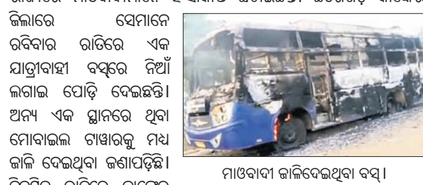
ମାଓବାଦୀ ଜାଲିଦେଇଥିବା ବସ୍।

ମାଲକାନଗିରି, ୨୧।୧୧ (ସ୍ୱ.ସ୍ୱ.): ମାଲକାନଗିରି ସାମାଜିକ ଛତିଶଗଡ଼ ରାଜ୍ୟରେ ମାଓବାଦୀମାନେ ହିଂସାକାଣ୍ଡ ଘଟାଇଛନ୍ତି।