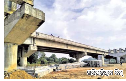
ଖସିପଡ଼ିଥିବା ବିନ୍ ବିନ୍