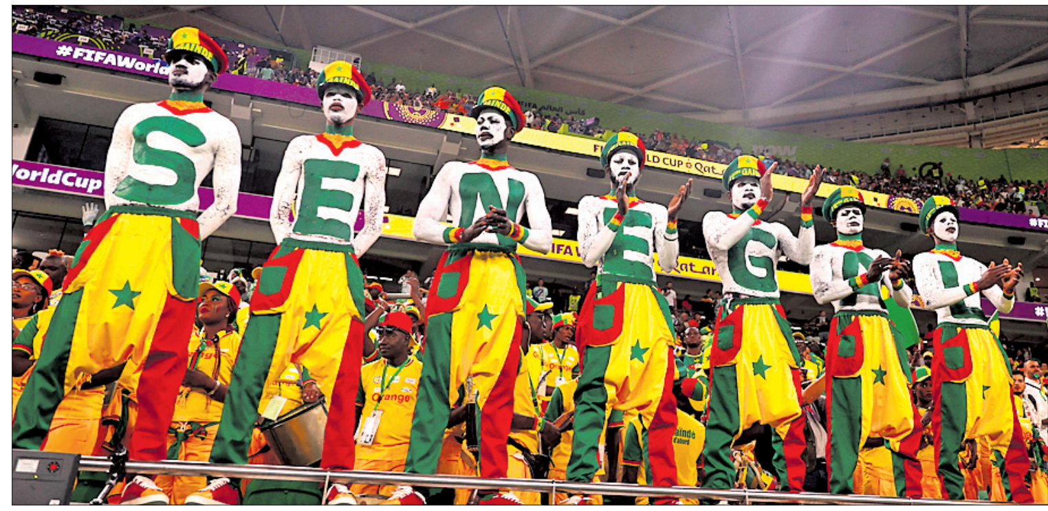
ନେଦରଲ୍ୟାଣ୍ଡ ବିପକ୍ଷ ମ୍ୟାଚ୍ ବେଳେ ଉପସ୍ଥିତ ସେନେଗାଲ ସମର୍ଥକ।