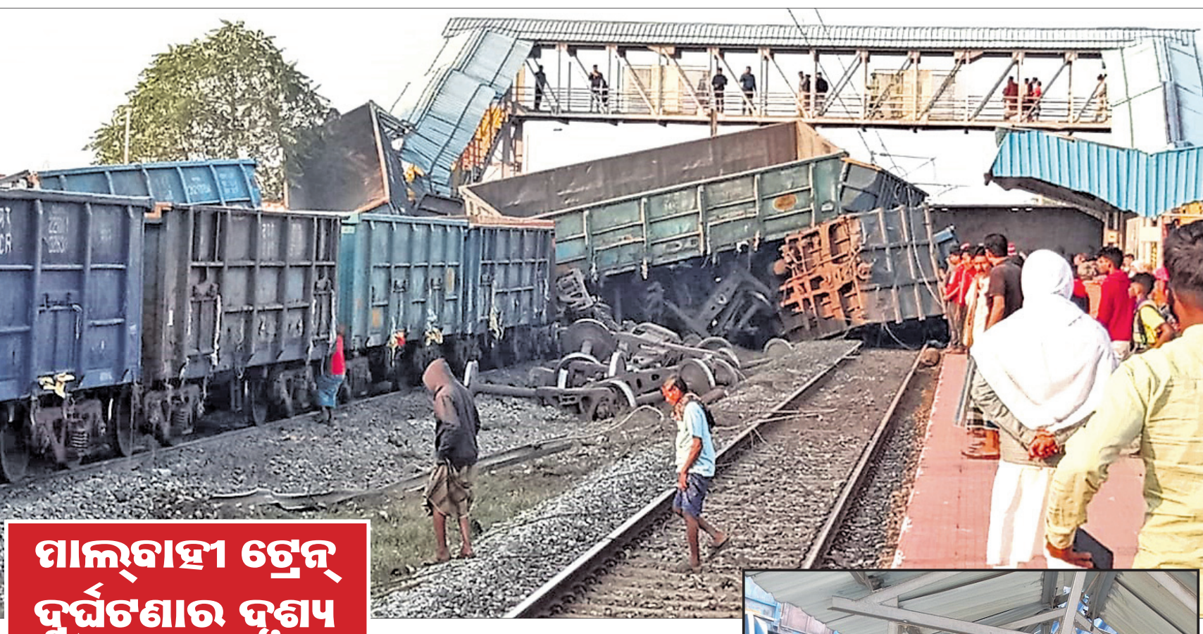
ପାଲ୍‌ବାହା ଟ୍ରେନ୍ ଦୁର୍ଘଟଣାର ଦୃଶ୍ୟ

ଯାକପୁର ଜିଲ୍ଲା କୋରେଇ ଷ୍ଟେଶନରେ ସୋମବାର ସକାଳେ ଦୁର୍ଘଟଣାଗ୍ରସ୍ତ ହୋଇଛି ଏକ ମାଲବାହୀ ଟ୍ରେନ୍। ଏହା ଏତେ ଭୟଙ୍କର ଥିଲା ଯେ, ୫୯ ବଗି ମଧ୍ୟରୁ ୧୪ଟି ଲାଲନରୁପ୍ତ ହୋଇଥିଲା। ସେଥିମଧ୍ୟରୁ ୮ଟି ବଗି ପ୍ଲାଟଫର୍ମକୁ ଚଢ଼ିଯାଇଥିଲା। ଫଳରେ ନିମିଷକ ମଧ୍ୟରେ କୋରେଇ ଷ୍ଟେଶନ ଛାରଖାର ହୋଇଯାଇଥିଲା। ଟ୍ରେନ୍‌କୁ ଅପେକ୍ଷା କରିଥିବା ୩ ମହିଳା ଯାତ୍ରୀଙ୍କ ଜୀବନ ଚାଲିଯାଇଥିବାବେଳେ ୪ଜଣଙ୍କ ଅବସ୍ଥା ସ୍ୱଳ୍ପାପନ ରହିଛି।