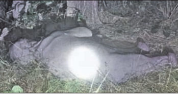
ହାତୀ ଛୁଆର ମୃତଦେହ।

ହାତୀ ଶାବକ ସେଠାରେ ଦୁର୍ବଳ ହୋଇ ପଡ଼ିଥିବା ଦେଖି ଗ୍ରାମବାସୀ ବନବିଭାଗକୁ ଖବର ଦେଇଥିଲେ। ଖବରପାଇ ସମ୍ବନ୍ଧରେ ବନବିଭାଗ କର୍ମଚାରୀ ପହଞ୍ଚି ହାତୀ ଶାବକକୁ ଉଦ୍ଧାର କରି ତିକ୍ଷା ବ୍ୟବସ୍ଥା କରିଥିଲେ।