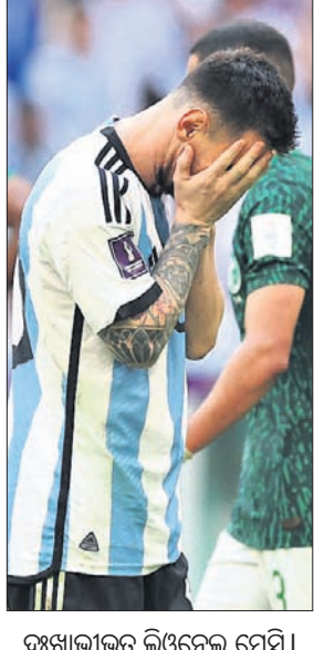
ଦୁଃଖାତ୍ମକ ଭାବରେ ଲିଓନେଲ ମେସି।

ଅଗ୍ରଣୀ କରାଇଥିଲେ। ୨୭ତମ ମିନିଟରେ ଆର୍ଜେଣ୍ଟିନା ଲିଓନେଲ ମେସିଙ୍କ ଗୋଲ ପାଇଥିଲେ। ମାତ୍ର ସୌଦୀ ଆରବ 'ଭାର୍'ର ସହାୟତା ନେଇଥିଲା। ଫରାଓଡ଼ି ଲାଇନର ଜଣେ ଖେଳାଳି ଅଫ୍‌ସାଇଡରେ ଥିବାରୁ ଗୋଲଟି ନାକଟ ହୋଇ ଯାଇଥିଲା। ଉଭୟ ଦଳର ଡକ୍ଟରଙ୍କୁ ଉର୍ଦ୍ଧ୍ୱ ଅଫ୍‌ସାଇଡ଼ ଓ ଫାଇଲ୍‌ମଧ୍ୟରେ ପ୍ରଥମାଞ୍ଚ ଶେଷକୁ ଆର୍ଜେଣ୍ଟିନା ୧-୦ ଗୋଲରେ ଅଗ୍ରଣୀ ରହିଥିଲା। ବିପର୍ଯ୍ୟୟ ସମ୍ମୁଖୀନ ହେବା ପରେ ସୌଦୀ ଆରବ କଠକରେ ଥିଲା। ଖେଳ ଆରମ୍ଭର ୩ ମିନିଟ ମଧ୍ୟରେ ଅର୍ଥାତ୍ ୪୮ତମ ମିନିଟରେ ସାଲେ