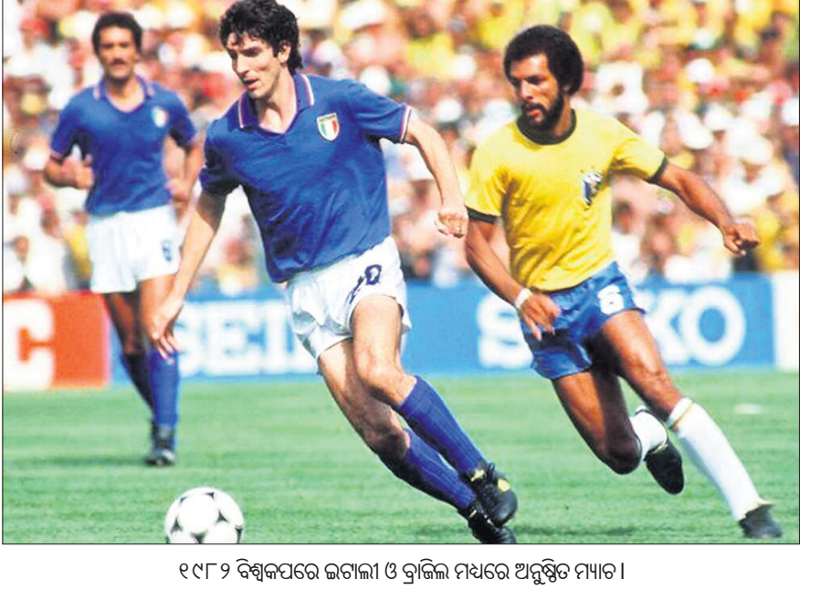
୧୯୮୨ ବିଶ୍ୱକପରେ ଜଗାଲୀ ଓ ବ୍ରାଜିଲ ମଧ୍ୟରେ ଅନୁଷ୍ଠିତ ମ୍ୟାଚ।