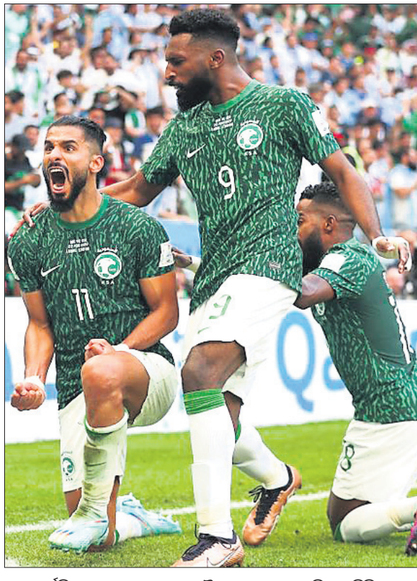
ଆର୍ଜେଣ୍ଟିନାକୁ ହରାଇବାପରେ ସୌଦୀ ଆରବ ଖେଳାଳିଙ୍କ ପ୍ରତିକ୍ରିୟା।

କ୍ରୋଏସିଆ (କାତାର), ୨୨।୧୧ ଚଳିତ ଫିଫା ବିଶ୍ୱକପର ଚତୁର୍ଥ ଦିବସରେ ସବୁଠାରୁ ବଡ଼ ବିପର୍ଯ୍ୟୟ ଘଟାଇଛି ସୌଦୀ ଆରବ। କ୍ରୋଏସିଆ ଖୁବ୍ ଲାଜରେ ମଙ୍ଗଳବାର ଅନୁଷ୍ଠିତ ମ୍ୟାଚରେ ଏହି ଦଳ ୨ ଥର ଗମ୍ଭୀର ଥାପା ଗାଇବା ସହିତ ଆର୍ଜେଣ୍ଟିନାକୁ ପରାସ୍ତ କରି ବିଶ୍ୱକ୍ରମକୁ ଚ୍ୟୁତି କରିଛି। ବିଶ୍ୱକ୍ରମ ଅନୁସାରେ ଶ୍ରେଷ୍ଠ ଖେଳାଳି ଲିଓନେଲ ମେସିଙ୍କ ଗୋଲ ବଳରେ ଆର୍ଜେଣ୍ଟିନା ଅଗ୍ରଣୀ ରହିଥିଲେ ହେଁ ବିପର୍ଯ୍ୟୟରେ ୫ ମିନିଟ ମଧ୍ୟରେ ଛୁଟି ଗୋଲ କରି ସୌଦୀ ଆରବ ୨-୧ ଗୋଲରେ ବିଜୟ ହୋଇ ଏହାର ପୁରୁଷ ଇତିହାସରେ ଅନ୍ୟତମ ଶ୍ରେଷ୍ଠ ସଫଳତା ପାଇଛି। ଅନ୍ୟପକ୍ଷରେ ଆର୍ଜେଣ୍ଟିନା କ୍ରମାଗତ ୩୬ ମ୍ୟାଚ ବିଜୟରେ ଟ୍ରେକ୍ କରିଛି।