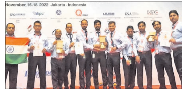
ଜେଏସପିର ଇଞ୍ଜିନିୟରମାନେ ପାଇଥିବା ସ୍ୱର୍ଣ୍ଣ ପଦକ ପ୍ରଦର୍ଶନ କରୁଛନ୍ତି।