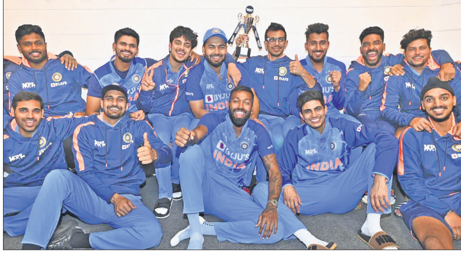
ସ୍ୱାଧୀନତା ଦିନରେ ୨୨୦ ସିରିଜ ବିଜୟୀ ଭାରତୀୟ ଦଳ।

ଭାରତ ଓ ଚିଲିକା ମଧ୍ୟରେ ଅନୁଷ୍ଠିତ ୨୨୦ ସିରିଜର ଅନ୍ତିମ ମ୍ୟାଚ ଗାଲ ହେବା ପରେ ଭାରତ ୧-୦ରେ ସିରିଜ ଜିତି ନେଇଛି। ସିରିଜର ପ୍ରଥମ ମ୍ୟାଚ ବର୍ଷାରେ ଧୋଇ ଯାଇଥିବା ବେଳେ ଦ୍ୱିତୀୟ ମ୍ୟାଚକୁ ଜିତି ନେଇଥିଲା ଭାରତ। ଅନ୍ତିମ ମ୍ୟାଚରେ ଚନ୍ଦ୍ର ଜିତି ବ୍ୟାଟି କରିଥିବା ଚିଲିକା ଟେଜନ କର୍ଣ୍ଣେକ ୫୯ ଓ ଗ୍ରେନ ଫିଲିପ୍ସଙ୍କ ୫୪ ରନ ବଳରେ ୧୬୦ ରନରେ ଅଲଆଉଟ ହୋଇଥିଲା। ଭାରତ ପକ୍ଷରୁ ମହମ୍ମଦ ସିରାଜ ଓ ଅର୍ଶଦୀପ ସିଂ ଧର୍ମି ଲେଖାଏ ଉଲ୍ଲେଖନୀୟ କରିଥିଲେ। ଜବାବରେ ଭାରତ ୯ ଓଭରରେ ୪ ଉଲ୍ଲେଖନୀୟ ହରାଇ ୨୫ ରନ କରିଥିବା ବେଳେ ବର୍ଷା ହୋଇଥିଲା। ତର୍କହେଉଛି ଗ୍ରେନ ଫିଲିପ୍ସଙ୍କ ୫୪ ରନ କରିଥିଲେ। ଫିଲିପ୍ସଙ୍କ ଇନିଂସରେ ୫ ଟୋକା ଓ ୩ ଛକା ସାମିଲ ଥିଲା। ତେବେ ସିରାଜ ଓ ଅର୍ଶଦୀପ ନିୟମିତ ବ୍ୟବଧାନରେ ଉଲ୍ଲେଖନୀୟ ହୋଇଥିଲେ। ତେବେ ଅଧିନାୟକ ହାରୋଲ୍ ଦଳ ୧୯.୪ ଓଭରରେ ୧୬୦ ରନରେ ସାମିତ ରହିଥିଲା।