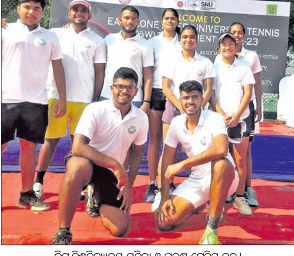
କିଟ୍ ବିଶ୍ୱବିଦ୍ୟାଳୟ ମହିଳା ଓ ପୁରୁଷ ଟେନିସ୍ ଦଳ।

ନୂଆଦିଲ୍ଲୀଠାରେ ଚାଲିଥିବା ଇଣ୍ଡିଆନ୍ ଯୁନିଭର୍ସିଟି ଟେନିସ୍ (ମହିଳା ଓ ପୁରୁଷ) ଚୁନାବଳରେ ଭଲ ପ୍ରଦର୍ଶନ କରି କିଟ୍ ବିଶ୍ୱବିଦ୍ୟାଳୟ ଦଳ ସର୍ବଭାରତୀୟ ଆନ୍ଧ୍ର ଟେନିସ୍ ଚୁନାବଳ ଏବଂ ଖେଳୋ ଇଣ୍ଡିଆ ବିଶ୍ୱବିଦ୍ୟାଳୟ କ୍ରୀଡ଼ାପାଇଁ ଯୋଗ୍ୟତା ଅର୍ଜନ କରିଛି। ମଙ୍ଗଳବାର ଅନୁଷ୍ଠିତ କ୍ୱାର୍ଟର ଫାଇନାଲରେ କିଟ୍ ପୁରୁଷ ଦଳ ୨-୧ରେ ବନାରସ ହିନ୍ଦୁ ବିଶ୍ୱବିଦ୍ୟାଳୟକୁ ଏବଂ ମହିଳା ଦଳ ଗୁଆହାଟୀର କଟନ ବିଶ୍ୱବିଦ୍ୟାଳୟକୁ ପରାସ୍ତ କରି ସେମିଫାଇନାଲରେ ପ୍ରବେଶ କରିଛି। ସେମିଫାଇନାଲରେ କିଟ୍ ପୁରୁଷ ଓ ମହିଳା ଦଳ ରାୟପୁରର ପଣ୍ଡିତ ରବି ଶୁକ୍ଳା ବିଶ୍ୱବିଦ୍ୟାଳୟ ଦଳକୁ ଭେଦିବ। ସର୍ବଭାରତୀୟ ଆନ୍ଧ୍ର ବିଶ୍ୱବିଦ୍ୟାଳୟ ଆନ୍ଧ୍ର ଟେନିସ୍ ଚୁନାବଳ ପୁରୀଆଲମ୍ବିତ ଦୀନକରୁ ଛୋଡ଼ୁରାମ