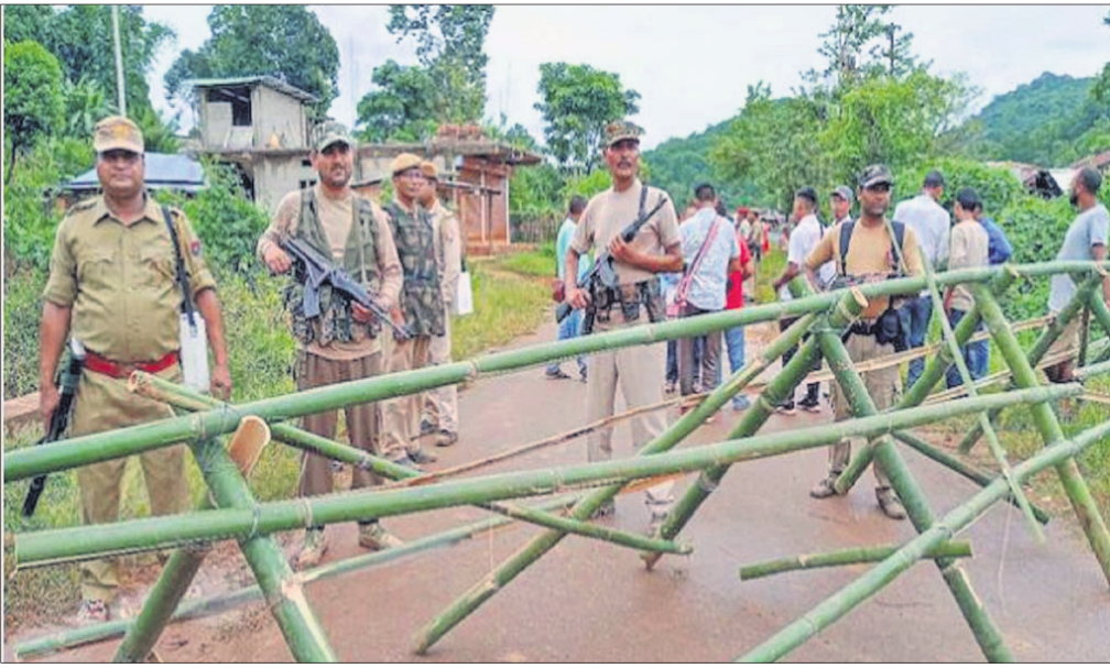
ବୁଲିକାଣ୍ଡ ଘଟିଥିବା ମେଘାଳୟ ସୀମାରେ ମୃତ୍ୟୁର ଘଟଣା ସମ୍ବନ୍ଧରେ ପୋଲିସ୍ କର୍ମଚାରୀ।

୧୯୭୨ରେ ଆସାମରୁ ଅଲଗା ହୋଇ ମେଘାଳୟ ଏକ ସ୍ୱତନ୍ତ୍ର ରାଜ୍ୟର ମାନ୍ୟତା ଲାଭ କରିଥିଲା। ଆସାମ ପୁନର୍ଗଠନ ଆଇନ, ୧୯୭୧କୁ ମେଘାଳୟ ଚଳାଣି କରିବା ପରେ ସୀମାରେ ଥିବା ୧୨ ଅଞ୍ଚଳରେ ବିବାଦ ଦେଖାଦେଇଥିଲା। ବୁଲ୍ ପଡ଼ୋଶୀ ରାଜ୍ୟ ମଧ୍ୟରେ ଦୀର୍ଘ ୫୦ ବର୍ଷ ଧରି ଲାଗିରହିଥିବା ସୀମା ବିବାଦର ଅନ୍ତ ଘଟାଇବା ପାଇଁ ଗତ ମାର୍ଚ୍ଚରେ ସ୍ୱରାଷ୍ଟ୍ରମନ୍ତ୍ରୀ ଅମିତ୍ ଶାହା ଉଦ୍ୟମ କରିଥିଲେ। ସ୍ୱରାଷ୍ଟ୍ରମନ୍ତ୍ରୀଙ୍କ ଉପସ୍ଥିତିରେ ଆସାମ ପୃଷ୍ଠାମନ୍ତ୍ରୀ ହିମନ୍ତ ବିଶ୍ୱଶର୍ମା ଓ ମେଘାଳୟ ପ୍ରତିପକ୍ଷ କନ୍ନୋଡ଼ ସାଙ୍ଗମା ଏକ ଐତିହାସିକ ବୃତ୍ତିରେ ସ୍ୱାକ୍ଷର କରିଥିଲେ। ଏହି ରାଜିନାମା ଅନୁସାରେ ବୁଲ୍ ରାଜ୍ୟ ସଂଲଗ୍ନ ନେଇ ରହିଥିବା ବିବାଦର ୭୦% ସମାଧାନ ହୋଇଗଲା ବୋଲି ସେତେବେଳେ ଶାହା କହିଥିଲେ। କିନ୍ତୁ ଏହି ବିବାଦ ଛିଣ୍ଡିନାହିଁ। ଏହାର ସଦ୍ୟ ଦୃଷ୍ଟାନ୍ତ ହେଉଛି ମଙ୍ଗଳବାର ଘଟିଥିବା ବୁଲିକାଣ୍ଡ, ଯହିଁରେ ଆସାମର କଣେ ଫରେଷ୍ଟ ଗାର୍ଡ଼ ଓ ମେଘାଳୟର ୫ ଗ୍ରାମବାସୀଙ୍କ ମୃତ୍ୟୁ ଘଟିଛି।