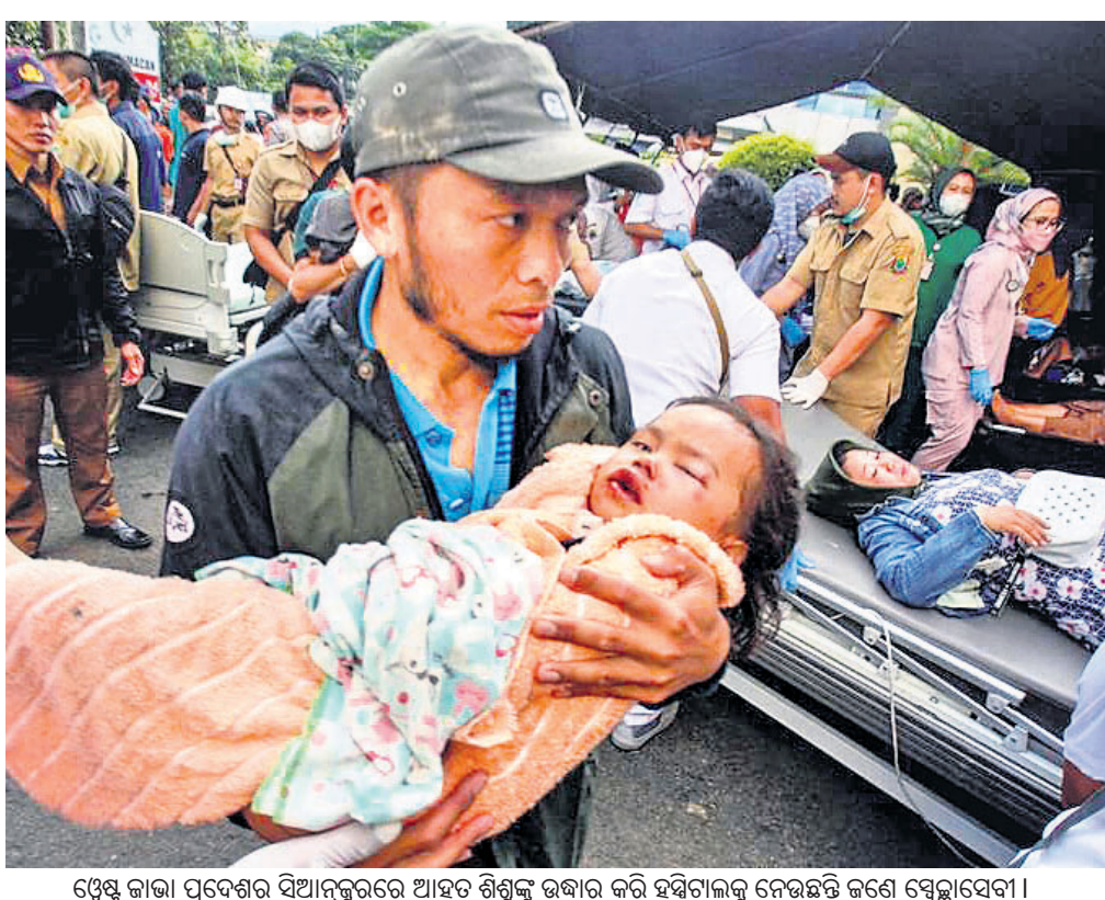
ଫ୍ରେଷ୍ଟ ଡାକ୍ତା ପ୍ରଦେଶର ସିଆନୁରୁରେ ଆହତ ଶିଶୁକୁ ଉଦ୍ଧାର କରି ହସ୍ପିଟାଲକୁ ନେଉଛନ୍ତି ଜଣେ ସ୍ତ୍ରୀସାଥୀ।