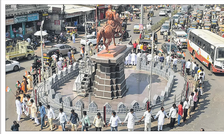
ମହାରାଷ୍ଟ୍ର ରାଜ୍ୟପାଳ ଭଗତସିଂହ ଲୋଣିଆର ଛତ୍ରପତି ଶିବାଜୀଙ୍କ ବିଷୟରେ ଦେଖାଯାଉଥିବା ମନୋରମ ପ୍ରଦର୍ଶନୀର ଉଦ୍ଘାଟନ କରୁଥିବା ପ୍ରିୟଙ୍କା ଗାନ୍ଧୀ

ଭାରତ ଯୋଡ଼ା ଯାତ୍ରା ଆରମ୍ଭ ହୋଇଥିଲା। ବର୍ତ୍ତମାନ ପୁଣି ଏହା ଚାଲିଯାଇଛି, କେନ୍ଦ୍ର, କର୍ମଚାରୀ, ଆହୁତିପ୍ରଦେଶ, ତେଲଙ୍ଗାନା ଏବଂ ମହାରାଷ୍ଟ୍ର ଅତିକ୍ରମ କରିଛି। ଏହି ପଦଯାତ୍ରାରେ ପ୍ରଥମ ଥର ପାଇଁ ପ୍ରିୟଙ୍କା ସାମିଲ ହେବାକୁ ଯାଉଛନ୍ତି।