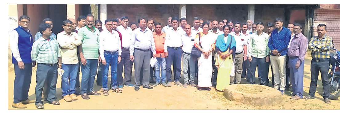
ବୈଠକରେ ଯୋଗ ଦେଇଥିବା ଶିକ୍ଷକମାନେ ।