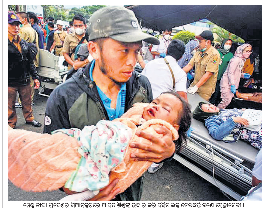
ଫ୍ରେଷ୍ଟ ଡାକ୍ତା ପ୍ରଦେଶର ସିଆନୁରୁରେ ଆହତ ଶିଶୁଙ୍କୁ ଉଦ୍ଧାର କରି ହସ୍ପିଟାଲକୁ ନେଉଛନ୍ତି ଜଣେ ସ୍ତ୍ରୀସାଥୀ।

ପୁଷ୍ପ, ୨୨।୧୧: କଣ୍ଟ୍ରୋଲରେ ୩୦୦ ଆତଙ୍କବାଦୀ ସକ୍ରିୟ ଥିବାବେଳେ ଅନୁପ୍ରବେଶ ଲାଗି ୧୬୦ ଜଣ ଧଳାପତ୍ରି ସେବକଙ୍କୁ ଯୋଗ୍ୟତା ପ୍ରଦାନ କରାଯାଇଛି।