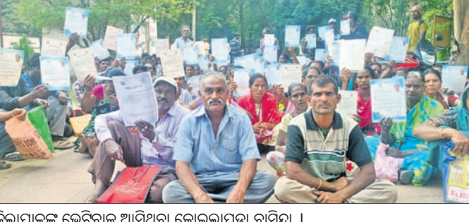
ଜିଲାପାଳଙ୍କୁ ଭେଟିବାକୁ ଆସିଥିବା କୋଇଲାପତ୍ତା ବାସିନ୍ଦା ।