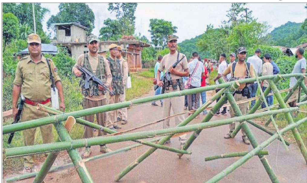
ବୁଲିକାଣ୍ଡ ଘଟିଥିବା ମେଘାଳୟ ସୀମାରେ ମୃତ୍ୟୁର ଗ୍ରାମରେ ପୁଲିସ୍ ଉପସ୍ଥିତ ହୋଇଥିବା ପୋଲିସ୍ କର୍ମଚାରୀ।

୧୯୭୨ରେ ଆସାମରୁ ଅଲଗା ହୋଇ ମେଘାଳୟ ଏକ ସ୍ୱତନ୍ତ୍ର ରାଜ୍ୟର ମାନ୍ୟତା ଲାଭ କରିଥିଲା। ଆସାମ ପୁନର୍ଗଠନ ଆଇନ, ୧୯୭୧କୁ ମେଘାଳୟ ରଖାଲେଖି କରିବା ପରେ ସୀମାରେ ଥିବା ୧୨ ଅଞ୍ଚଳରେ ବିବାଦ ଦେଖାଦେଇଥିଲା। ବୁଲ୍ ପଡ଼ୋଶୀ ରାଜ୍ୟ ମଧ୍ୟରେ ଦୀର୍ଘ ୫୦ ବର୍ଷ ଧରି ଲାଗିରହିଥିବା ସୀମା ବିବାଦର ଅନ୍ତ ଘଟାଇବା ପାଇଁ ଗତ ମାର୍ଚ୍ଚରେ ସ୍ୱରାଷ୍ଟ୍ରମନ୍ତ୍ରୀ ଅମିତ୍ ଶାହା ଉଦ୍ୟମ କରିଥିଲେ। ସ୍ୱରାଷ୍ଟ୍ରମନ୍ତ୍ରୀଙ୍କ ଉପସ୍ଥିତିରେ ଆସାମ ପୃଷ୍ଠାମନ୍ତ୍ରୀ ହିମନ୍ତ ବିଶ୍ୱଶର୍ମା ଓ ମେଘାଳୟ ପ୍ରତିପକ୍ଷ କର୍ମୀ ଘୋଷଣା ଏକ ଐତିହାସିକ ବୃକ୍ଷରେ ସ୍ୱାକ୍ଷର କରିଥିଲେ। ଏହି ରାଜିନାମା ଅନୁସାରେ ବୁଲ୍ ରାଜ୍ୟ ସଂଲଗ୍ନ ନେଇ ରହିଥିବା ବିବାଦର ୭୦% ସମାଧାନ ହୋଇଗଲା ବୋଲି ସେତେବେଳେ ଶାହା କହିଥିଲେ। କିନ୍ତୁ ଏହି ବିବାଦ ଛିଣ୍ଡିନାହିଁ। ଏହାର ସଦ୍ୟ ବୃକ୍ଷାନ୍ତ ହେଉଛି ମଙ୍ଗଳବାର ଘଟିଥିବା ବୁଲିକାଣ୍ଡ, ଯହିଁରେ ଆସାମର କଣେ ଫରେଷ୍ଟ ଗାର୍ଡ଼ ଓ ମେଘାଳୟର ୫ ଗ୍ରାମବାସୀଙ୍କ ମୃତ୍ୟୁ ଘଟିଛି।