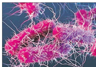
କାରଣରୁ ଭାରତରେ ମୋଟ ୬.୮ ଲକ୍ଷ ଲୋକଙ୍କ ଜୀବନ ଯାଇଥିବା ଲାନ୍ସେଟ୍ ମାଗାଜିନ୍‌ରେ ପ୍ରକାଶିତ ଏକ

ଢାକିଂଗର, ୨୨।୧୧ କଟକ ଓ ପ୍ରାଣପାତୀ ରୋଗଗୁଡ଼ିକରେ ବିଶ୍ୱର ବହୁ ଲୋକଙ୍କ ମୃତ୍ୟୁ ଘଟୁଛି। ପ୍ରାଣ ହରାଇଥିବା ଲୋକଙ୍କ ମଧ୍ୟରୁ ଅନେକଙ୍କ ପାଇଁ ବ୍ୟାଙ୍କ୍ରେଡିଆ ସଂକ୍ରମଣ ବା ଇନ୍ଫେକ୍ସନ୍ କାଳ ସାଜୁଛି। ଭାରତରେ ମଧ୍ୟ ବହୁ ଲୋକ ସଂକ୍ରମଣକ୍ରମେ ରୋଗରେ ଆକ୍ରାନ୍ତ ହେଉଛନ୍ତି। ଉପଯୁକ୍ତ ଔଷଧ ଉପଲବ୍ଧ ନ ହେବାରୁ ସେମାନଙ୍କ ମୃତ୍ୟୁ ଘଟୁଛି। ୨୦୧୯ରେ ଇନ୍ଫେକ୍ସନ୍