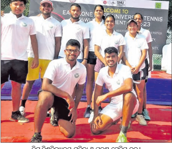
କିଙ୍ଗ୍ ବିଶ୍ୱବିଦ୍ୟାଳୟ ମହିଳା ଓ ପୁରୁଷ ଟେନିସ୍ ଦଳ।

ନୂଆଦିଲ୍ଲୀରେ ଚାଲିଥିବା ଇଣ୍ଡିଆନ୍ ଯୁନିଭର୍ସିଟି ଟେନିସ୍ (ମହିଳା ଓ ପୁରୁଷ) ରୁନିଂମେଣ୍ଟରେ ଭଲ ପ୍ରଦର୍ଶନ କରି କିଙ୍ଗ୍ ବିଶ୍ୱବିଦ୍ୟାଳୟ ଦଳ ସର୍ବଭାରତୀୟ ଆନ୍ଧ୍ର ବିଶ୍ୱବିଦ୍ୟାଳୟ ଆନ୍ଧ୍ର ଜୋନ୍ ଟେନିସ୍ ରୁନିଂମେଣ୍ଟ ଏବଂ ଖେଲୋ ଇଣ୍ଡିଆ ବିଶ୍ୱବିଦ୍ୟାଳୟ କ୍ରୀଡ଼ାପାଇଁ ଯୋଗ୍ୟତା ଅର୍ଜନ କରିଛି। ମଙ୍ଗଳବାର ଅନୁଷ୍ଠିତ କ୍ୱାର୍ଟର ଫାଇନାଲରେ କିଙ୍ଗ୍ ପୁରୁଷ ଦଳ ୨-୧ରେ ବନାରସ ହିନ୍ଦୁ ବିଶ୍ୱବିଦ୍ୟାଳୟକୁ ଏବଂ ମହିଳା ଦଳ ଗୁଆହାଟୀର କଟନ ବିଶ୍ୱବିଦ୍ୟାଳୟକୁ ପରାସ୍ତ କରି ସେମିଫାଇନାଲରେ ପ୍ରବେଶ କରିଛି। ସେମିଫାଇନାଲରେ କିଙ୍ଗ୍ ପୁରୁଷ ଓ ମହିଳା ଦଳ ରାୟପୁରର ପଣ୍ଡିତ ରବି ଶୁକ୍ଳା ବିଶ୍ୱବିଦ୍ୟାଳୟ ଦଳକୁ ଭେଦିବ। ସର୍ବଭାରତୀୟ ଆନ୍ଧ୍ର ବିଶ୍ୱବିଦ୍ୟାଳୟ ଆନ୍ଧ୍ର ଜୋନ୍ ଟେନିସ୍ ରୁନିଂମେଣ୍ଟ ପୁରୀଆଇସ୍ପିଡ୍ ଦୀନବନ୍ଧୁ ଛୋଡ଼ୁରାମ