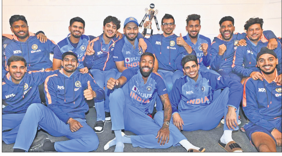
ଝାଡ଼ଖଣ୍ଡ ବିପକ୍ଷରେ ଟି୨୦ ସିରିଜ ବିଜୟୀ ଭାରତୀୟ ଦଳ।