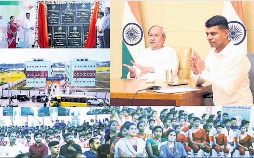
ଭିଡିଓ କନ୍ଫରେନ୍ସରେ ପ୍ରକଳ୍ପ ଉଦ୍‌ଘାଟନ କରୁଛନ୍ତି ମୁଖ୍ୟମନ୍ତ୍ରୀ ନବୀନ ପଟ୍ଟନାୟକ । ନିକଟରେ ଅଛନ୍ତି ୫-ଟି ସଚିବ ଭି.କେ. ପାଣ୍ଡିଆନ ।