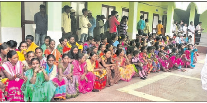
ମହିଳାମାନେ ବୁକ୍ସ କାର୍ଯ୍ୟକ୍ରମ ସମ୍ମୁଖରେ ଧାରଣାରେ ବସିଛନ୍ତି।

ବିଡିଓଙ୍କ ମନମୁଖି କାର୍ଯ୍ୟ ବିରୋଧରେ ଲୋକ ପ୍ରତିନିଧିଙ୍କ ସମେତ ବିଭିନ୍ନ ପଞ୍ଚାୟତବାସୀ ମଙ୍ଗଳବାର ରାୟଗଡ଼ା ଜିଲା ଗୁଣପୁର ବୁକ୍ସ ଅଞ୍ଚଳ ଘେରାଉ କରି ଧାରଣା ଦେଇଛନ୍ତି। ବିଡିଓ ପାତ୍ରଙ୍କ ଅଧୀନରେ ଅବଲମ୍ବନ କରୁଛନ୍ତି। ବିଭିନ୍ନ ଯୋଜନାରେ କାର୍ଯ୍ୟ ହେଉଥିଲେ ମଧ୍ୟ ତାହାର ବିଲ୍ କରାଯାଇ ନ ଥିବା ଓ କୋ ମିଳୁ ନ ଥିବା ନେଇ ଅଭିଯୋଗ ଆସିଛି। ଏଥିସହ ସେ ଏକ ନିର୍ଦ୍ଦିଷ୍ଟ ରାଜନୈତିକ ଦଳର ହାତକାରି ସାଜି ବୁକ୍ସ ଅଧ୍ୟକ୍ଷଙ୍କ ଅଜାଗତରେ ସମସ୍ତ କାର୍ଯ୍ୟ ବିଡିଓ କରୁଥିବା ଆଧାରରେ ଅଭିଯୋଗ କରିଛନ୍ତି। ସେମାନେ ବିଡିଓଙ୍କ ବଦଳ ଦାବି କରିଥିଲେ। ବିଡିଓ ଯଦି ରାଜନୀତି କରିବାକୁ ଚାହୁଁଛନ୍ତି ତାହେଲେ ଗାନ୍ଧି ଛାଡ଼ି ନିର୍ବାଚନରେ ଠିଆ ହୁଅନ୍ତୁ ବୋଲି ଲୋକେ କହିଛନ୍ତି। ବୁକ୍ସ ଅଞ୍ଚଳରେ କିଛି ଘୋଷ୍ଟି ଧରି ଉଦ୍ଘାଟନା ଲାଗି ରହିଥିଲା। ବିଡିଓ ଏବଂ କୌଣସି ଅଧିକାରୀ ଏପରି