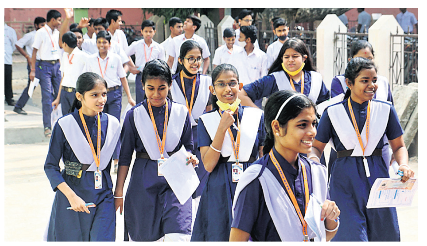
କଟକସ୍ଥିତ ଯେକେଡିକେ ବୋର୍ଡ ହାଇସ୍କୁଲରୁ ବୁଧବାର ଛାତ୍ରାଛାତ୍ରମାନେ ଦଶମଶ୍ରେଣୀ ଏସ୍-ଏ ପରୀକ୍ଷା ଦେଇ ଫେରୁଛନ୍ତି।