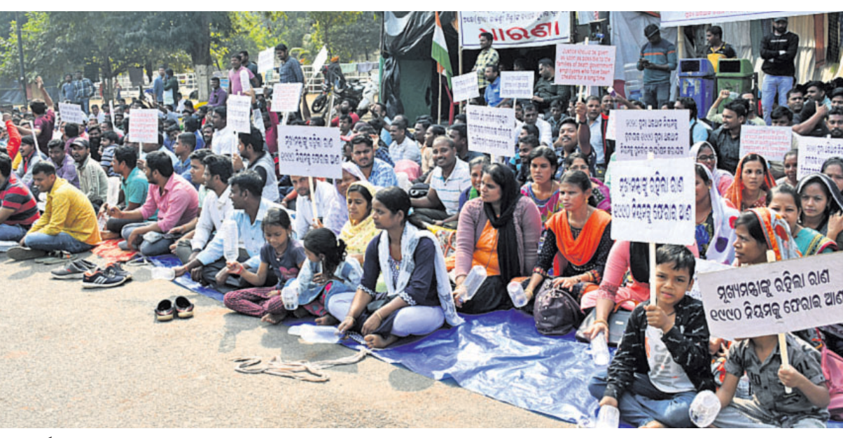
ଓଡ଼ିଶା ରାଜ୍ୟ କର୍ମଚାରୀ ଅଭିଯାନ ଆନ୍ଦୋଳନ ସଂଘ ପକ୍ଷରୁ ଭୁବନେଶ୍ୱର ଲୋୟର ପିଏମ୍‌ଜିରେ ଚାଲିଥିବା ଧାରଣାପୂର୍ଣ୍ଣ ଆନ୍ଦୋଳନକାରୀମାନେ ହାତରେ ବୋତଲ ଧରି ବିକ୍ଷୋଭ କରୁଛନ୍ତି ।

ଭୁବନେଶ୍ୱର, ୨୩।୧୧ (ବ୍ୟୁରୋ) - ଓଡ଼ିଶା ରୁ ସେବାମିତ୍ରିକ ସେବା ପୁନଃ ଅଭିଯାନ ନିୟମ-୨୦୨୦କୁ ଉଲ୍ଲଙ୍ଘନ କରି ପୁଣିଥରେ ପୁନଃ ଅଭିଯାନ ନିୟମ-୧୯୯୦ ଲାଗୁ କରିବା ଦାବିରେ ଓଡ଼ିଶା ରାଜ୍ୟ କର୍ମଚାରୀ ଅଭିଯାନ ଆନ୍ଦୋଳନ ସଂଘ ପକ୍ଷରୁ ଲୋୟର ପିଏମ୍‌ଜିରେ ଆନ୍ଦୋଳନ ଜାରି ରହିଛି । ରୁଧିର ଆନ୍ଦୋଳନକାରୀମାନେ ଅଭିଯାନ ଉପାୟରେ ବିକ୍ଷୋଭ ପ୍ରଦର୍ଶନ କରିବା ସହ ସରକାରଙ୍କ ଦୃଷ୍ଟି ଆକର୍ଷଣ କରିବାକୁ ଉଦ୍ୟମ କରିଛନ୍ତି । ଧାରଣାପୂର୍ଣ୍ଣ ଖାଲି ବୋତଲ ବାଡ଼େଇ ପ୍ରତିବାଦ କରିଛନ୍ତି । ପୁନଃ ଅଭିଯାନ ନିୟମ-୧୯୯୦ ଲାଗୁ କରାଯିବା ସହ ମୃତ ସରକାରୀ କର୍ମଚାରୀଙ୍କ ପରିବାରକୁ ରୁଚିତ କ୍ଷତିପୂରଣ ପ୍ରଦାନ କରାଯାଉ । ସେହିପରି ୨୦୦୩-୦୪ ମସିହାରେ ନିଯୁକ୍ତ ଶିକ୍ଷାସହାୟକଙ୍କୁ ସମାନ ସୁବିଧା ସୁଯୋଗ ପ୍ରଦାନ ତଥା ଛଡ଼େଇ ହୋଇଥିବା ଶିକ୍ଷା ସହାୟକଙ୍କୁ ପୁନଃ ନିଯୁକ୍ତି ନେଇ ସେମାନେ ଦାବି ଉପସ୍ଥାପନ କରିଛନ୍ତି ।