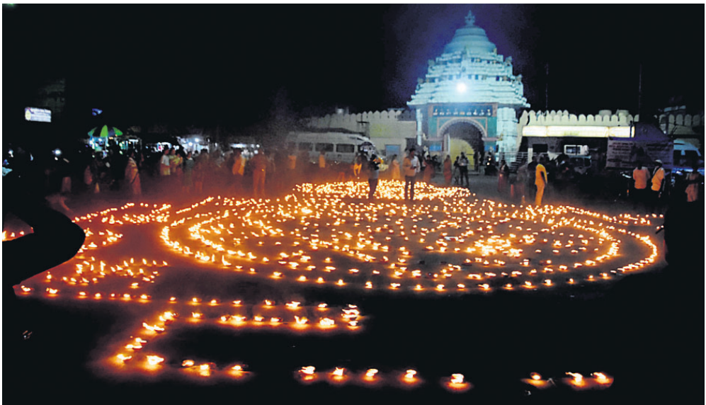
ପୁରୀ ଅଫିସ, ୨୩।୧୧

ବିଶ୍ୱାସୀୟ ମଙ୍ଗଳ କାମନା କରି ଦେବ ଦୀପାବଳିର ଦିନରେ ପୁରୀର ଶ୍ରୀକ୍ଷେତ୍ରରେ ଦୀପାବଳି କାର୍ଯ୍ୟକ୍ରମ ଅନୁଷ୍ଠିତ ହୋଇଯାଇଛି।