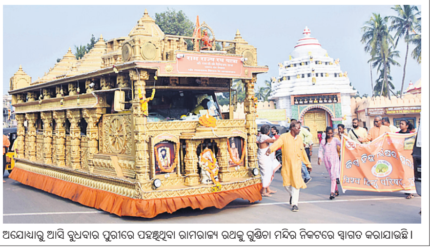
ଅଯୋଧ୍ୟାକୁ ଆସି ବୁଧବାର ପୁରୀରେ ପହଞ୍ଚିଥିବା ରାମରାଜ୍ୟ ରଥକୁ ଦୁର୍ଭିକ୍ଷା ମନ୍ଦିର ନିକଟରେ ସ୍ୱାଗତ କରାଯାଇଛି ।