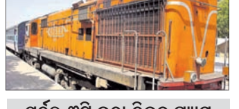
ପୂର୍ବରୁ ୩ଟି ଲୁହା ଟ୍ରେନ୍‌କୁ ଗ୍ୟାସ୍ କେନ୍ଦ୍ରରେ କାଟି ଚୋରି କରିଥିଲେ

ଗତ ଏପ୍ରିଲ-ମେ' ମାସରେ ବିହାରର ରୋହତାସ, ଜାହାନାବାଦ ଏବଂ ବାକା ଜିଲ୍ଲାକୁ ୩ଟି ଲୁହା ଟ୍ରେନ୍‌ଚୋରମାନେ ଗ୍ୟାସ୍ କେନ୍ଦ୍ରରେ କାଟି ଚୋରି କରି ନେଇଥିଲେ। ଏବେ ବିହାର ବେଗୁସରାଇ ଜିଲ୍ଲାରେ ଚୋରମାନେ ଫୁଲ୍‌କ ଖୋଲି ସମ୍ପୂର୍ଣ୍ଣ ଡିଲେଇ ଟ୍ରେନ୍ ଇଞ୍ଜିନ ଚୋରିକରି ନେଇଯାଇଛନ୍ତି। ମରାମତି ପାଇଁ ଆସିଥିବା ଇଞ୍ଜିନଟି ବହୁଦିନ ହେଲା ବେଗୁସରାଇ ରେଲୱେ ଯାତରେ ଛିଡ଼ାହୋଇଥିଲା। ଚୋରମାନେ ଫୁଲ୍‌କ ଖୋଲି ଇଞ୍ଜିନ ଚୋରି ପରେ ଗୋଟିଏ ପାର୍ଟି ଖୋଲି ନେଇଯାଇଥିବା ଯୋଗିସ କହିଛନ୍ତି। ଏ ନେଇ ଗତ ସପ୍ତାହରେ ପରାଭଣି ଆନାରେ ମାମଲା ରୁଜୁ ହୋଇଛି। ଇଞ୍ଜିନ ଚୋରିରେ ସମ୍ପୃକ୍ତ ୩ ଜଣଙ୍କୁ ଗିରଫ କରାଯାଇଥିବା ମୁଜାଫରପୁର ରେଲ୍ ସୁରକ୍ଷା ବଳ(ଆର୍‌ପି‌ଏଫ୍)ର ଇନ୍‌ସପେକ୍ଟର ପି.ଏସ୍. ଦୁବେ କହିଛନ୍ତି।