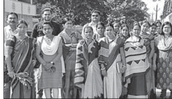
କର୍ମଶାଳାରେ ଉପସ୍ଥିତ ଅଧିକାରୀ ଓ ମହିଳାମାନେ ।

ପଚାରିଥିଲେ । ମୁଦବର୍ଦ୍ଧ ନିମୁକ୍ତ, ଆୟ ଏବଂ କୃଷକମାନଙ୍କ ସହିତ ଆଲୋଚନା ପୂର୍ବକ ସେମାନଙ୍କ ଜୀବିକା, କ'ଣ ଶୁକ୍ରବାର ଉଦ୍‌ଘାଟିତ ହୋଇଯାଇଛି । ଶେଷ ଦିନରେ ରାଜ୍ୟପ୍ରତ୍ୟାୟ ଅଧିକାରୀ ଯୋଗଦେଇ ସୁସ୍ୱାଦୁରା ବୁକର କରାଯାଇ ଗ୍ରାମପଞ୍ଚାୟତ ଓ ମାଗେଶ୍ୱର ବୁକର ଧମା ଗ୍ରାମ ପଞ୍ଚାୟତ ଗସ୍ତ କରିଥିଲେ । ସେମାନେ ମହିଳା, ମୁଦବର୍ଦ୍ଧ, କୃଷକମାନଙ୍କ ସହ ଆଲୋଚନା କରିଥିଲେ । ଦାରିଦ୍ର୍ୟ ଦୂରୀକରଣ, ସ୍ୱାସ୍ଥ୍ୟ, ଶିକ୍ଷା ଓ କ୍ଷୁଧା ଦୂରୀକରଣ ସହ ଖାଦ୍ୟ ନିରାପତ୍ତା ଓ ପୋଷଣ ଉପରେ ଗୁରୁତ୍ୱ ଦିଆଯାଇଥିଲା । ସ୍ୱୟଂ ସହାୟକ ଗୋଷ୍ଠୀ ମାଧ୍ୟମରେ ମହିଳାମାନେ କିପରି ରୋଜଗାରକ୍ଷମ ହେଉଛନ୍ତି ସେ ଉପରେ ମଧ୍ୟ ଅଧିକାରୀମାନେ