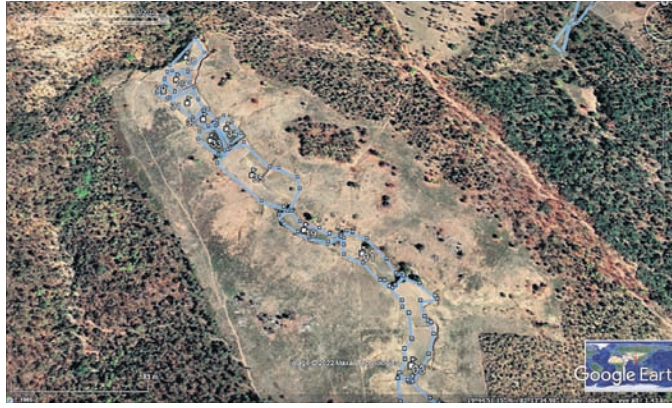
ଉତ୍କଳଭୂମିର ଜଙ୍ଗଲ ଜମି ବିଧାନସଭାରେ ଚାଷୀ ଝଡ଼

ଭୁବନେଶ୍ୱର, ୨୫.୧୧ (ବୁଧବେଳା) ବଡ଼ଗଡ଼ ଜିଲ୍ଲାର ପଦ୍ମପୁର ଉପନିର୍ବାଚନରେ ଚାଷୀ ସମସ୍ୟା ପୂର୍ଣ୍ଣ ପ୍ରସଙ୍ଗ ହୋଇଛି। ଚାଷୀଙ୍କ ଭୋଟ ହାତେଇବା ପାଇଁ ପ୍ରମୁଖ ରାଜନୈତିକ ଦଳଗୁଡ଼ିକ ଭୋଟ ଲଗାଇଛନ୍ତି। ଏହିକ୍ରମରେ ଚାଷୀ ପ୍ରସଙ୍ଗକୁ ନେଇ ବିଧାନସଭାରେ ଶୁକ୍ରବାର ଝଡ଼ ସୃଷ୍ଟି ହୋଇଛି। ବିଧାନସଭା ଓ ବାହାରେ ଶାସକ ଓ ବିରୋଧୀ ଦଳ ମୁହାଁମୁହିଁ ହୋଇ ପ୍ରବଳ ହଜଗୋଳ କରିଛନ୍ତି। ଚାଷୀଙ୍କୁ ଇନପୁର୍ତ୍ତ ସର୍ବସିଦ୍ଧି ଦେବାରେ ବିଳମ୍ବ, ମଣ୍ଡି ଅବ୍ୟବସ୍ଥା, ଫସଲ ବାମନା ଯୋଜନାରେ ତ୍ରୁଟିପୂର୍ଣ୍ଣ ନୀତିକୁ ନେଇ ଭାଜପା ରାଜ୍ୟ ସରକାରଙ୍କୁ ଯେରିଥିବା ବେଳେ କଂଗ୍ରେସ୍ ଇନପୁର୍ତ୍ତ ସର୍ବସିଦ୍ଧି ବିଳମ୍ବ, ମଣ୍ଡି ଅବ୍ୟବସ୍ଥା ■ ବିରୋଧୀ-ଶାସକ ମୁହାଁମୁହିଁ ■ ଫେଲ୍ ମାରିଲା ସର୍ବଦଳୀୟ ବୈଠକ ■ ଶନିବାର ଯାଏ ଗୃହ ମୁଲତବା ■ ରାଜ୍ୟପାଳଙ୍କୁ ଫେରାଦ ହେଲା ବିଜେଡି, ଭାଜପା ଓ ଫସଲ ବାମନା ମିଳିବାରେ ବିଳମ୍ବ ପାଇଁ ଉଭୟ ରାଜ୍ୟ ଓ କେନ୍ଦ୍ର ସରକାରଙ୍କ ଉପରେ ବର୍ଷିଛି। ସେହିପରି ବିଜେଡି ଧାନର ସର୍ବନିମ୍ନ ସହାୟକ ମୂଲ୍ୟ ବୃଦ୍ଧି, ଚାଷୀଙ୍କୁ ପ୍ରଧାନମନ୍ତ୍ରୀ ଫସଲ ବାମନା ସରକାରଙ୍କୁ ଯେରିଥିବା ବେଳେ କଂଗ୍ରେସ୍ ଯୋଗାଣ ଆଦି ପ୍ରସଙ୍ଗରେ କଂଗ୍ରେସ୍-୪