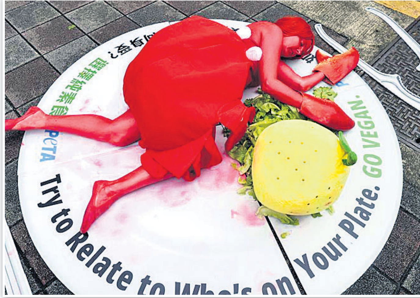
ଜଣେ ପ୍ରାଣୀ ଅଧିକାର କର୍ମୀ ନିଜ ଦେହରେ କଳ୍ପା ଭଳି ପେଣ୍ଟି କରାଇ ତାଲ୍‌ଫାନର ତାଲପେଇଁଥିବ ଏକ ମାଛ ବଜାର ସାମ୍ନାରେ ଗହୁଛନ୍ତି। ଲୋକେ କ'ଣ ସବୁ ଖାଉଛନ୍ତି ତା' ଉପରେ ସେମାନଙ୍କୁ ସଚେତନ କରାଇବା ହେଉଛି ଏହି ଆକ୍ଟିଭିଷ୍ଟଙ୍କ ଉଦ୍ଦେଶ୍ୟ।