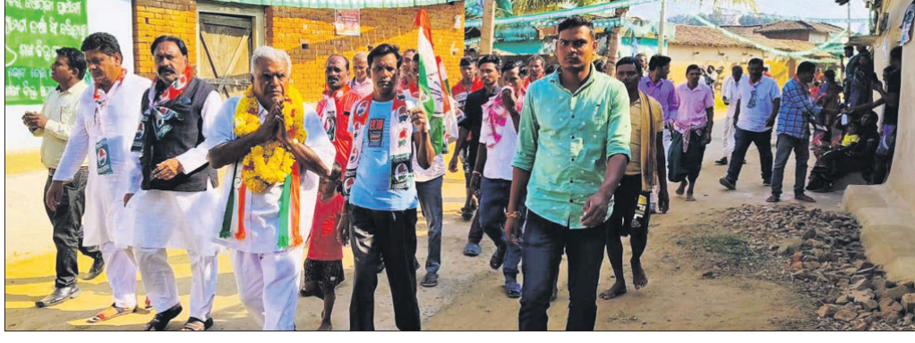
ଝାରବନ୍ଧ କୁଳରେ କଂଗ୍ରେସର ନିର୍ବାଚନୀ ପ୍ରଚାର ।