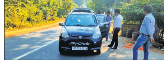
ପଦ୍ମପୁର ନିର୍ବାଚନ ମଣ୍ଡଳୀରେ ଗାଡ଼ି ଯାଞ୍ଚ କରାଯାଉଛି ।