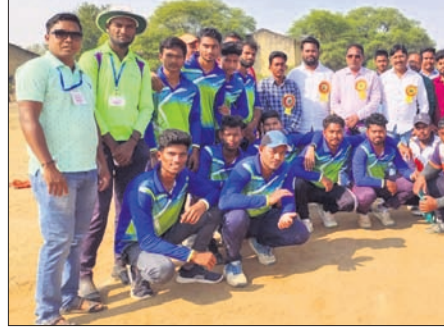
ଅତିଥିଙ୍କ ଗହଣରେ ଖେଳାଳିମାନେ।