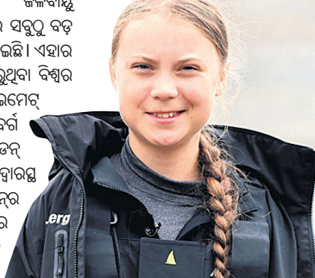
ସମ୍ପାଦନ ଉଲ୍ଲଂଘନ କରୁଛି ସୁଇଡେନ୍‌ର ଜଳବାୟୁ ନୀତି

ଷ୍ଟକହୋମ୍, ୨୫।୧୧: ଜଳବାୟୁ ପରିବର୍ତ୍ତନ ପୃଥିବୀ ଆଗରେ ସବୁଠୁ ବଡ଼ ଚ୍ୟାଲେଞ୍ଜ ଭାବେ ଛିଡ଼ା ହୋଇଛି। ଏହାର ପୂର୍ଣ୍ଣାଙ୍ଗ ପାଇଁ କାର୍ଯ୍ୟ କରୁଥିବା ବିଶ୍ୱର ସର୍ବାଧିକ ଜଣାଶୁଣା କ୍ଲାଇମେଟ୍ ଆକ୍ଟିଭିଷ୍ଟ ଗ୍ରେଟା ଥନବର୍ଗ ଏବେ ନିଜ ଦେଶ ସୁଇଡେନ୍ ବିରୋଧରେ କୋର୍ଟେ ଡାଉନ୍ ହୋଇଛନ୍ତି। ସୁଇଡେନ୍‌ର ଜଳବାୟୁ ନୀତି ଦେଶର ସମ୍ପାଦନ କରୁଥିବା ସେ ଅଭିଯୋଗ ଆଣିଛନ୍ତି। ଗ୍ରେଟାଙ୍କ ସହ ଏହି ଆଇନଗତ ଲଢ଼େଇରେ ୬୦୦ରୁ ଊର୍ଦ୍ଧ୍ୱ ଜଣ ସାମିଲ ହୋଇଛନ୍ତି।