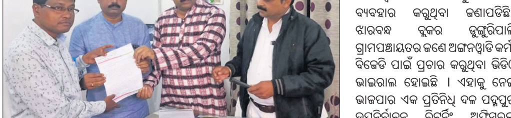
ଭାଜପା କାର୍ଯ୍ୟକର୍ତ୍ତା ରିଟିନିଂ ଅଫିସରଙ୍କୁ ଅଭିଯୋଗପତ୍ର ଦେଉଛନ୍ତି ।