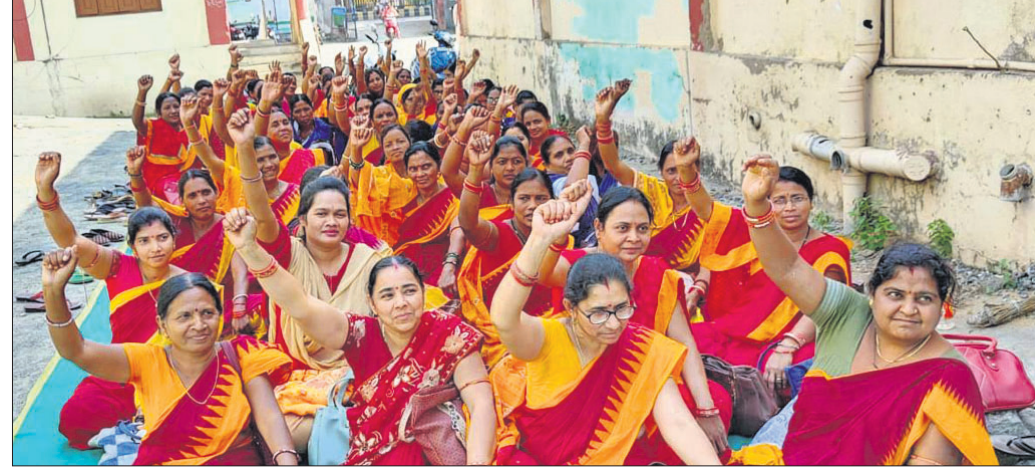
ବରଗଡ଼ରେ ଅଜ୍ଞାନତା କର୍ମୀ ଧାରଣା ଦେଉଛନ୍ତି ।

ରାଜ୍ୟରେ କାର୍ଯ୍ୟରତ ଅଜ୍ଞାନତା କର୍ମୀଙ୍କ ପ୍ରତି ସରକାର ଅଣଦେଖା ମନୋଭାବ ପୋଷଣ କରୁଛନ୍ତି ।