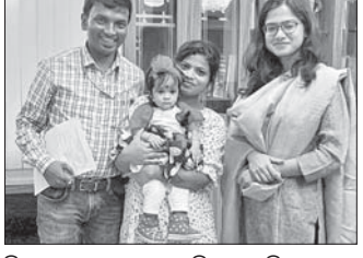
ଜିଲ୍ଲାପାଳ ଓ ବଙ୍ଗୀୟ ଦମ୍ପତିଙ୍କ ସହ ଶିଶୁକନ୍ୟା ।

କରାଯାଇ ବୁକ୍ସିଲାଇଠା ବାକନିକେତନରେ ଲାଳନ ପାଳନ କରାଯାଉଥିଲା । ଶିଶୁ କନ୍ୟାକୁ ପାଇ ବଙ୍ଗୀୟ ଦମ୍ପତି ବେଶ୍ ଖୁସି ବ୍ୟକ୍ତ କରିଥିଲେ । ଅନ୍ୟମାନଙ୍କ ସୂଚନାଯୋଗ୍ୟ, ଶିଶୁ କନ୍ୟାକୁ ଗତ ଏପ୍ରିଲରେ ପ୍ରଶାସନ ତରଫରୁ ଉଦ୍ଧାର