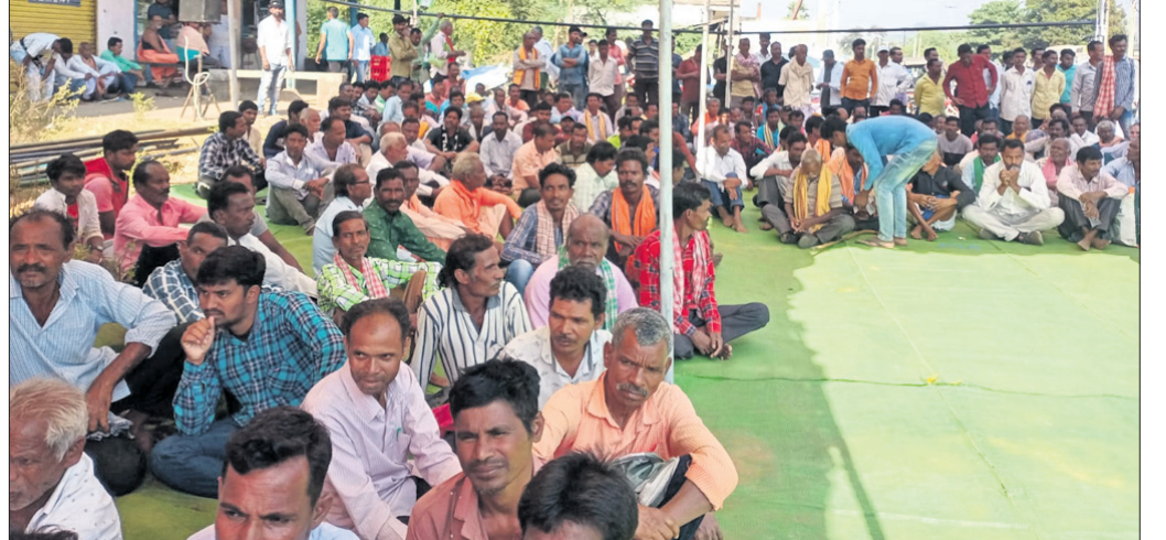
ଏଫ୍‌ସିଆଇ ସମ୍ମୁଖରେ ଧାରଣା ଦିଆଯାଇଛି।