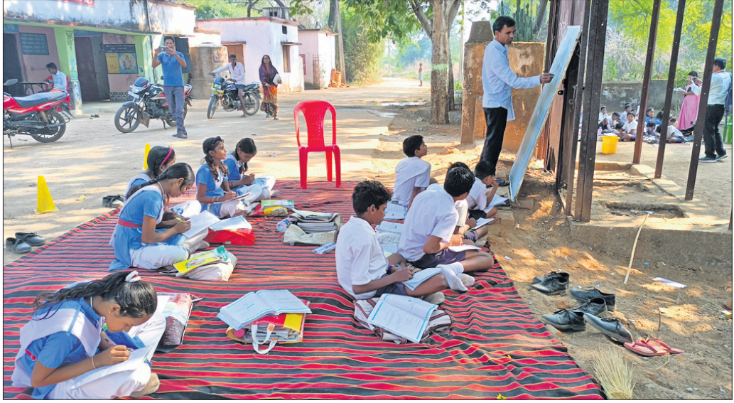
ରାସ୍ତା କଡ଼ରେ ବରଗଛ ମୂଳରେ ପାଠପଢ଼ା ଚାଲିଛି।

ରାଜ୍ୟ ସରକାର ଶିକ୍ଷାର ପ୍ରଚାର ପ୍ରସାର ପାଇଁ ବିଭିନ୍ନ ଯୋଜନା ମଧ୍ୟମରେ ବିଦ୍ୟାଳୟକୁ ବଡ଼ ବଡ଼ କୋଠା ନିର୍ମାଣ କରି ଚିକ୍ଷା ଓ ଚକଚକ କରୁଛନ୍ତି। ଛାତ୍ରଛାତ୍ରୀଙ୍କୁ ଉତ୍ସାହ କରିବା ପାଇଁ ନାଟଗୀତ ଓ ଅନ୍ୟାନ୍ୟ କାର୍ଯ୍ୟକ୍ରମ କରି କୋଟି କୋଟି ଟଙ୍କା ଖର୍ଚ୍ଚ କରାଯାଉଛି। ହେଲେ ନୂଆପଡ଼ା ଜିଲ୍ଲାର ଉପାତ ଅଞ୍ଚଳରେ ବିଦ୍ୟାଳୟର ତିନି ଓଲଟା। ଗଛମୂଳେ, ରାସ୍ତା କଡ଼ରେ ଛାତ୍ରଛାତ୍ରୀମାନେ ପାଠ ପଢ଼ୁଥିବା ବିକଳ ଚିତ୍ର ଦେଖିବାକୁ ମିଳିଛି। ନୂଆପଡ଼ା ସଦର ବ୍ଲକ ଭାଲେଶ୍ୱର ପଞ୍ଚାୟତ ଗାମ୍ବୀରୀରେ ଗାଁରେ। ୧୯୬୦ରେ ଏଠାରେ ଉଚ୍ଚ ପ୍ରାଥମିକ ବିଦ୍ୟାଳୟ ସ୍ଥାପିତ ହୋଇଛି। ପ୍ରଥମରୁ ଅଷ୍ଟମ ଶ୍ରେଣୀ ପର୍ଯ୍ୟନ୍ତ ୧୩୨ଟଙ୍କା ଛାତ୍ରଛାତ୍ରୀ ଅଧ୍ୟୟନ କରୁଥିବା ବେଳେ ୬ଟଙ୍କା ଶିକ୍ଷକ ରହିଛନ୍ତି। ଶ୍ରେଣୀ କୋଠା ଅତି ପୁରୁଣା ଓ ନିମ୍ନମାନର ହୋଇଥିବାରୁ ବର୍ଷା ଦିନେ ଛାତ୍ର ପାଣି ଗଳିବା ସହ ଛାତ୍ର ପିନେଣ୍ଡ ଖସିପଡ଼ୁଛି। ବର୍ଷା ଋତୁରେ ଶ୍ରେଣୀ କୋଠା ଭିତରେ ପିଲାଙ୍କୁ ବସାଇ ପାଠ ପଢ଼ାଉଥିବା ସମୟରେ ଛାତ୍ର ପିନେଣ୍ଡ ପଡ଼ିବାରୁ ୫ଟଙ୍କା ଛାତ୍ରଛାତ୍ରୀ ଅଳ୍ପକେ ବର୍ଷା ଯାଇଥିଲେ। ଏ ବିଷୟରେ