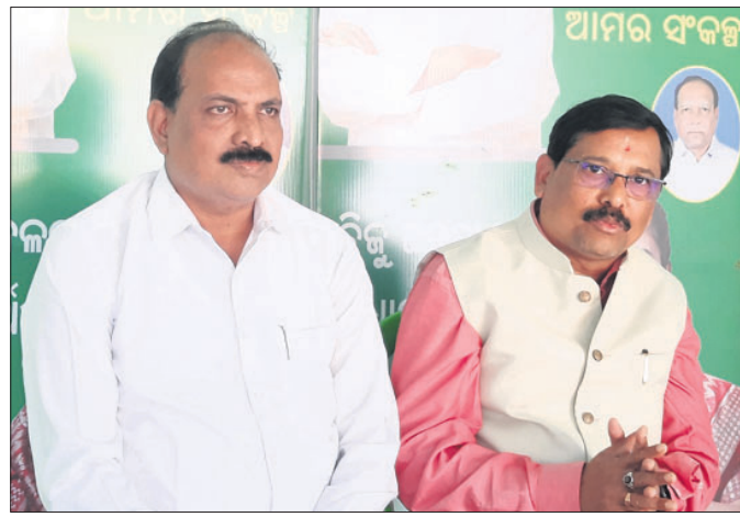
ବିଜେଡି ମୁଖ୍ୟମନ୍ତ୍ରୀ ଖବରଦାତା ସମ୍ମିଳନୀକୁ ସମ୍ବୋଧନ କରୁଛନ୍ତି ।

ମୁଖ୍ୟମନ୍ତ୍ରୀ ନବୀନ ପଟ୍ଟନାୟକ କେନ୍ଦ୍ରପଡ଼ା ତୋଳାଇ, ବନ୍ଧେଇ ଶ୍ରମିକ ଓ ସିନିମାଲ କର୍ମଚାରୀଙ୍କ ପାଇଁ ବନ୍ଧୁ ହିତକର ଯୋଜନା ଘୋଷଣା କରିଛନ୍ତି ।