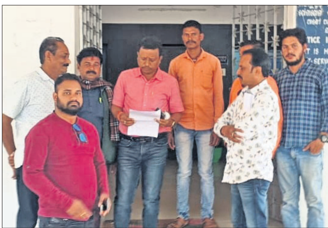
ଗ୍ରାମବାସୀଙ୍କ ତରଫରୁ କାଉନସିଲର ଉପଜିଲ୍ଲାପାଳଙ୍କୁ ଦାବିପତ୍ର ଦେଉଛନ୍ତି ।