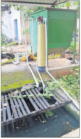
ସୁସ୍ୱାଦୁରାଗ ଏକ ଦେଶୀ ଭାଟି ଭିତରେ ଅଚଳ ହୋଇପଡ଼ିଥିବା ପ୍ଲାଣ୍ଟ ।

ପରିବେଶ ସୁରକ୍ଷା ଓ ପ୍ରଦୂଷଣ ନିୟନ୍ତ୍ରଣ ପାଇଁ ଦେଶୀ ମଦଭାଟିରେ ଇଟିପି (ଏଡୁକେସ୍ ଟ୍ରିଟମେଣ୍ଟ ପ୍ଲାଣ୍ଟ ବା ବର୍ଜ୍ୟଜଳ ବିଶୋଧନ କରୁଥିବା ପ୍ଲାଣ୍ଟ) ଲଗାଇବାକୁ ଏନିକିଟି ନିର୍ଦ୍ଦେଶ ଦେଇଥିଲା । ତଦନୁଯାୟୀ ରାଜ୍ୟ ପ୍ରଦୂଷଣ ନିୟନ୍ତ୍ରଣ ବୋର୍ଡ଼ ଏହାକୁ କାର୍ଯ୍ୟକାରୀ କରିବାକୁ ସମ୍ବଲପୁର ଜିଲ୍ଲାର ସମସ୍ତ ମଦଭାଟିକୁ ନିର୍ଦ୍ଦେଶ କରି ଦେଖାଇଲା । ଏକ ନିର୍ଦ୍ଦେଶ କମ୍ପାନୀ ପକ୍ଷରୁ ଜିଲ୍ଲାରେ ଥିବା ଶହେରୁ ଊର୍ଦ୍ଧ୍ୱ ଭାଗରେ ଇଟିପି ଲଗାଯାଇଥିଲା । ଏବେ ଏହା ଭାଗ ଭାଗରେ ନାମକ୍ରମାନ୍ୱୟ ରହିଥିବା ଦେଖାଯାଉଛି । ପାଇପ୍, ଟାଙ୍କି, ମେଶିନ ଖଞ୍ଜାଯାଇଥିଲେ ବି ସେସବୁ ନଷ୍ଟ ହେବାକୁ ବସିଛି । ଲଗାଇବା ଦିନଠାରୁ ଏହାକୁ କାର୍ଯ୍ୟକାରୀ କରା ନ ଯିବାରୁ ଏଭଳି ଅବସ୍ଥା ସୃଷ୍ଟି ହୋଇଛି । ପ୍ରାୟ ସମସ୍ତ ଭାଗରେ ଲାଗିଥିବା ଇଟିପି ଅଚଳ ହୋଇପଡ଼ିଛି । ପ୍ଲାଣ୍ଟକୁ ଅନାବନା ରକ୍ଷାକାରୀ ଯୋଗାଣ ରଖିଛି । ଭାଗରେ କାର୍ଯ୍ୟକାରୀ କର୍ମଚାରୀ ପ୍ଲାଣ୍ଟ