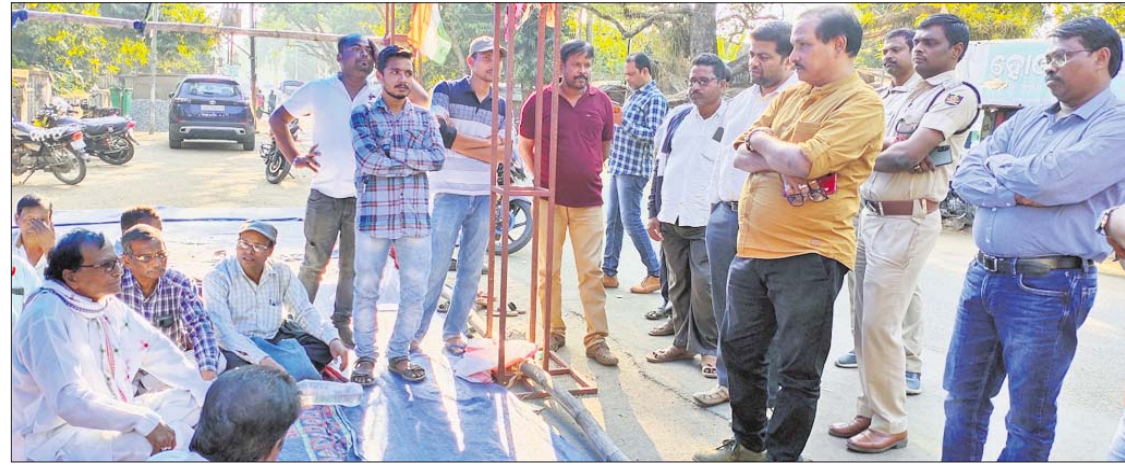
ଧାରଣାସ୍ଥଳରେ ଆଲୋଚନା କରାଯାଉଛି।

ଆରଟିଆଇରେ ତଥ୍ୟ ନ ମିଳିବାରୁ ପୂର୍ବତନ ବିଧାୟକଙ୍କ ଧାରଣା