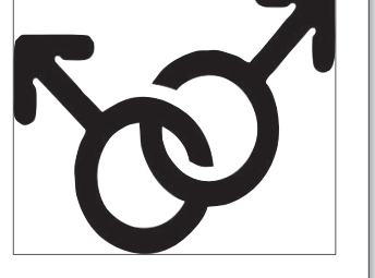
ତାଲ୍‌ଫାନ, ଡ୍ରୁଗେନ୍, ଆମେରିକା ଓ ଉରୁଗୁଏ। ୨୦୨୩ ଫେବୃଆରୀ ୧୭ରେ ଆଷ୍ଟ୍ରେଲିଆରେ ସମାଜିକୀ ବିବାହ ବୈଧ ମାନ୍ୟତା ପାଇବ।

ସମାଜିକୀ ବିବାହକୁ ଅଧ୍ୟାବୃତ୍ତ ୩୩ ଦେଶରେ ସ୍ୱୀକୃତି ଦିଆଯାଇଛି। ସେଗୁଡ଼ିକ ହେଲା ଆର୍ଜେଣ୍ଟିନା, ଅଷ୍ଟ୍ରେଲିଆ, ଅଷ୍ଟ୍ରିଆ, ବେଲ୍‌ଜିୟମ୍, ବ୍ରାଜିଲ୍, କାନାଡା, ଚିଲି, କଲମ୍ବିଆ, କୋଷ୍ଟାରିକା, କ୍ୟୁବା, ଡେନ୍‌ମାର୍କ, ଇକ୍ୱେଡର, ଫିଲିପାଇନ୍ସ, ଫ୍ରାନ୍ସ, ଜର୍ମାନୀ, ଆଇସଲାଣ୍ଡ, ଆୟର୍ଲ୍ୟାଣ୍ଡ, ଲକ୍ସମ୍ବର୍ଗ, ମାଲ୍ଡୋଭା, ନେଦରଲ୍ୟାଣ୍ଡସ୍, ନ୍ୟୁଜିଲାଣ୍ଡ, ନରୱେ, ପର୍ଚ୍ଚୁଗାଲ୍, ସ୍ଲୋଭେନିଆ, ଦକ୍ଷିଣ ଆଫ୍ରିକା, ସ୍ୱେଡ, ସୁଇଡେନ୍, ସୁଇଜରଲ୍ୟାଣ୍ଡ