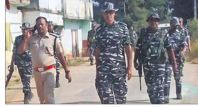
ପଦ୍ମପୁର ନିର୍ବାଚନ ମଣ୍ଡଳୀରେ ପ୍ଲାଗମାର୍କ ।