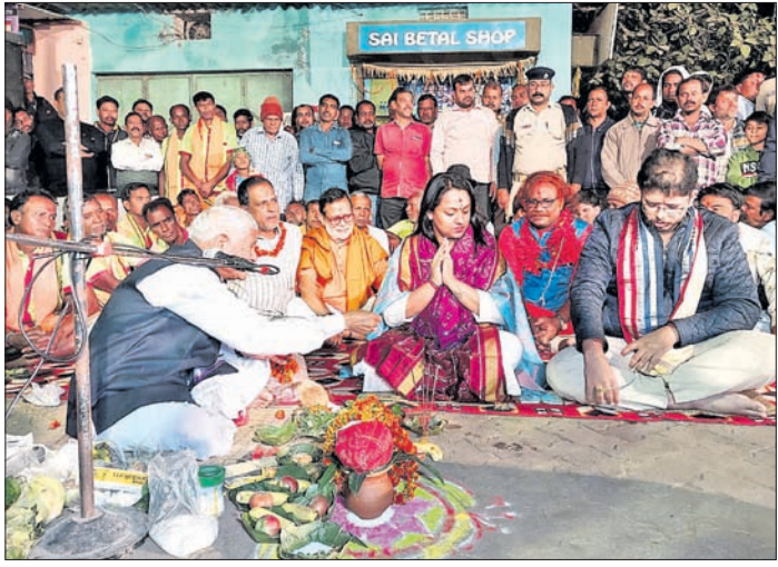
ବରଗଡ଼ ଧନୁଯାତ୍ରା ପାଇଁ ଶୁଭସ୍ତ୍ରମ୍ଭ ସ୍ଥାପନ କରାଯାଇଛି ।