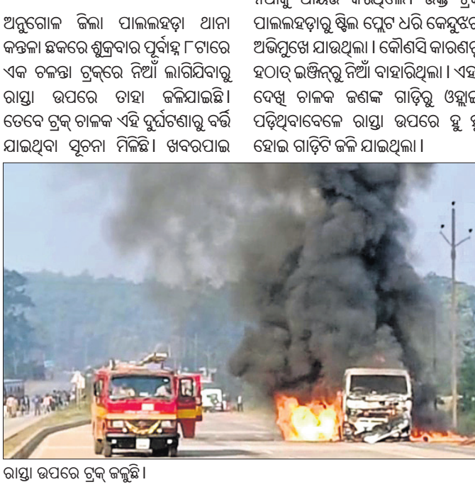
ରାତ୍ରୀ ଉପରେ ଟ୍ରକ୍ ଜଳୁଛି।