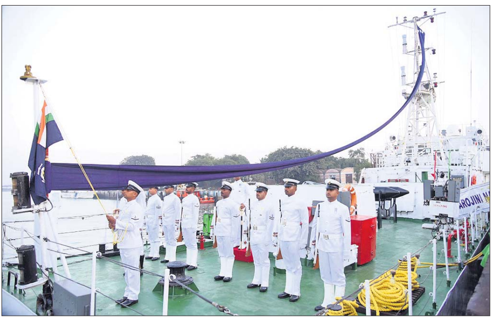
କୋଷ୍ଠଗାର୍ତ୍ତର ଯବାନମାନେ କାହାକୁ ପତାକା ଅବତରଣ କରୁଛନ୍ତି।