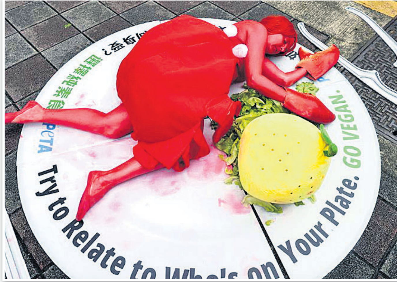
ଜଣେ ପ୍ରାଣୀ ଅଧିକାର କର୍ମୀ ନିଜ ଦେହରେ କଳ୍ପା ଭଳି ପେଣ୍ଟି କରାଇ ତାଲ୍ୟାନର ତାଳପେଇଁଥିବ ଏକ ମାଛ ବଜାର ସାମ୍ନାରେ ଗହୁଛନ୍ତି। ଲୋକେ କ'ଣ ସବୁ ଖାଇଛନ୍ତି ତା' ଉପରେ ସେମାନଙ୍କୁ ସଚେତନ କରାଇବା ହେଉଛି ଏହି ଆକ୍ଟିଭିଷ୍ଟଙ୍କ ଉଦ୍ଦେଶ୍ୟ।