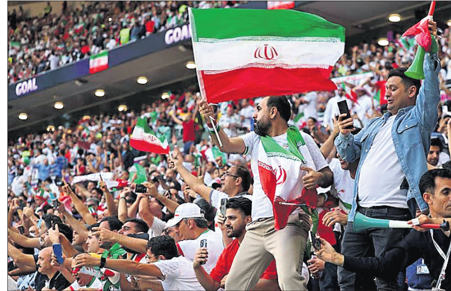
ଫ୍ଲେଲ୍ ବିପକ୍ଷ ମ୍ୟାଚରେ ଷ୍ଟାଡ଼ିୟମରେ ଉପସ୍ଥିତ ଇରାନ ସମର୍ଥକ।

ଚଳିତ ଫିଫା ବିଶ୍ୱକପରେ ପ୍ରଥମ ବିଜୟ ହାସଲ କରିଛି ଇରାନ। ଶୁକ୍ରବାର ଅନୁଷ୍ଠିତ ମ୍ୟାଚରେ ଏହି ଦଳ ୨-୦ ଗୋଲରେ ଫ୍ଲେଲ୍‌କୁ ପରାସ୍ତ କରିଛି। ପ୍ରଥମ ମ୍ୟାଚରେ ଇରାନ ଶକ୍ତିଶାଳୀ ଇଂଲଣ୍ଡଠାରୁ ୨-୨ ଗୋଲରେ ହାରି ଯାଇଥିଲା। ୨ ମ୍ୟାଚରୁ ଏହି ଦଳ ଗୋଟିଏ ଲେଖାଏ ବିଜୟ ଓ ପରାଜୟ ସହ ୩ ପଏଣ୍ଟ ପାଇଛି। ଅନ୍ୟପକ୍ଷରେ ନିଜର ପ୍ରଥମ ମ୍ୟାଚକୁ ଆମେରିକା ବିପକ୍ଷରେ ଡ୍ର ରଖିଥିବା ଫ୍ଲେଲ୍ ୨ ମ୍ୟାଚ ପରେ ଟେବୁଲର ନିମ୍ନରେ ରହିଛି। ଇରାନ-ଫ୍ଲେଲ୍ ଗ୍ରୁପ୍ 'ବି' ମ୍ୟାଚ ଚାନ୍ଦ୍ର ସଂଘର୍ଷପୂର୍ଣ୍ଣ ହୋଇଥିଲା। ପ୍ରଥମାର୍ଦ୍ଧ ଗୋଲଶୂନ୍ୟ ରହିବା ପରେ ଦ୍ୱିତୀୟାର୍ଦ୍ଧରେ କଡ଼ା ଚକ୍‌ର ଦେଖିବାକୁ ମିଳିଥିଲା। ୯୦ ମିନିଟ ପର୍ଯ୍ୟନ୍ତ ଗୋଲ ନ ହେବାରୁ ମ୍ୟାଚଟି ଡ୍ର ରହିବା ଆଶା କରାଯାଉଥିଲା। ତେବେ ଇଞ୍ଜୁରି ଚାଇମ୍‌ମର ମାତ୍ର ୩ ମିନିଟ ମଧ୍ୟରେ ୨ଟି ଗୋଲ ଇରାନକୁ ବିଜୟ ମୁକୁଟ ପିନ୍ଧାଇ ଦେଇଥିଲା। ଇରାନର ମୋହମ୍‌ମଦ୍ ଚାରେମିଙ୍କୁ ହାଇ ବ୍ୟାଲେଞ୍ଜ ପାଇଁ ଫ୍ଲେଲ୍‌ର ପ୍ରଥମ ପସନ୍ଦ ଗୋଲକିପର ଫ୍ରେନ୍ ହେନେସି ୮୨ତମ ମିନିଟରେ ରେଡ୍ କାର୍ଡ ପାଇ ପଡ଼ିଆ ଛାଡ଼ିଥିଲେ। ଏହା ଦଳ ପାଇଁ ମହଙ୍ଗା ପଡ଼ିଥିଲା। ତାଙ୍କ ସ୍ଥାନରେ ଗୋଲକିପିଟ୍ କରିଥିବା ତାନି