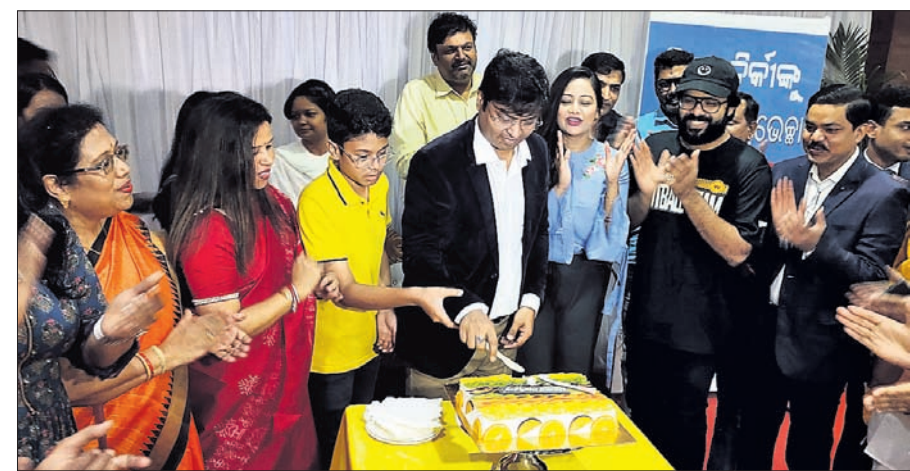
ପରିବାର ଓ ବନ୍ଧୁଙ୍କ ଗହଣରେ ଶୁକ୍ରବାର ଭୁବନେଶ୍ୱରରେ ଜନ୍ମଦିନ ପାଳନ କରୁଛନ୍ତି ଭାରତୀୟ ଦଳର ପୂର୍ବତନ ଅଧିନାୟକ ତଥା ହକି ଇଞ୍ଜିଆ ସଭାପତି ଦିଲୀପ ଚିକା।

ବର୍ଷାଦି ରାଜ୍ୟଗୋଷ୍ଠୀ ଜାତୀୟରେ ଅଷ୍ଟ୍ରେଲିଆକୁ ଭେଟିଥିଲା। ସେହି ମ୍ୟାଚରେ ଅଷ୍ଟ୍ରେଲିଆ ୬-୦ ଗୋଲରେ ବିଜୟୀ ହୋଇଥିଲା। ନିକଟ ଅତୀତରେ ଭୁବନେଶ୍ୱରର କଳିଙ୍ଗ ଷ୍ଟାଡ଼ିୟମରେ ଅନୁଷ୍ଠିତ ନ୍ୟୁଜିଲାଣ୍ଡ ଓ ସ୍କୋଟ୍‌ଲ୍ୟାଣ୍ଡ ପ୍ରୋ ଲିଗ୍ ମ୍ୟାଚରେ ଭାରତକୁ ମିଶ୍ରିତ ଫଳ ମିଳିଥିଲା। ନ୍ୟୁଜିଲାଣ୍ଡକୁ ଭାରତ ୨ଟି ଯାକ ମ୍ୟାଚରେ ହରାଇଥିବାବେଳେ ସ୍କୋଟ୍‌ଲ୍ୟାଣ୍ଡ ବିପକ୍ଷରେ ଗୋଟିଏ ଲେଖାଏ ବିଜୟ ପରାଜୟ ସ୍ୱାଦ ଚାଖୁଥିଲା। ତେଣୁ ଆଗାମୀ ସିରିଜରେ ଭାରତ କଡ଼ା ଚକ୍‌ର ଦେବା ଆଶା କରାଯାଉଛି। ବିଶ୍ୱକପ ପୂର୍ବରୁ ଅଷ୍ଟ୍ରେଲିଆ ବିପକ୍ଷରେ ଖେଳି ପ୍ରସ୍ତୁତ ହେବାଠାରୁ ଆଉ ବଡ଼ କିଛି ନାହିଁ ବୋଲି କହିଛନ୍ତି ମୁଖ୍ୟ କୋଚ୍ ଗ୍ରାହାମ ରିଡ୍। ଅଧିନାୟକ ହରମନପ୍ରୀତ ସିଂ ମଧ୍ୟ କୋଚ୍‌ଙ୍କ ସହ ଏକମତ ହୋଇଛନ୍ତି।