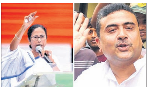
ମମତା ବାନାର୍ଜୀ ଓ ଶୁଭେନ୍ଦୁ ଅଧିକାରୀ

କୋଲକାତା, ୨୫.୧୧.୨୨ ଯାହାକୁ ମୁଁ ଭାଇ ଭଳି ଦେଖେ ସେ ମୋତେ କହୁଛନ୍ତି, ପଶ୍ଚିମବଙ୍ଗ ସରକାର ଏବେ ପାର୍ଟି ପାଇଁ, ପାର୍ଟି ବ୍ରାହ୍ମଣ ଏବଂ ପାର୍ଟିର ହୋଇଯାଇଛି। ତେବେ କେନ୍ଦ୍ର ସରକାର ଏଜେଣ୍ଡର, ଏଜେଣ୍ଡର ବ୍ରାହ୍ମଣ ଏବଂ ଏଜେଣ୍ଡର ପାଇଁ ବୋଲି ମୁଁ ଏହାର ଜବାବ ଦେଇପାରିବି। ପଶ୍ଚିମବଙ୍ଗ ମୁଖ୍ୟମନ୍ତ୍ରୀ ମମତା ବାନାର୍ଜୀ ବିଧାନସଭାରେ ବିରୋଧୀ ଦଳ ନେତା ତଥା ପୂର୍ବତନ ସହଯୋଗୀ ଶୁଭେନ୍ଦୁ ଅଧିକାରୀଙ୍କ ସହ ସାକ୍ଷାତ ପରେ ଏଭଳି କହିଛନ୍ତି। 'ମା' ପାଇଁ ନିମନ୍ତ୍ରଣ ପାଇ ଶୁକ୍ରବାର ରାଜ୍ୟ ବିଧାନସଭାରେ ମୁଖ୍ୟମନ୍ତ୍ରୀଙ୍କ ପ୍ରକାଶରେ ମମତାଙ୍କୁ ଅନ୍ୟ ତିନି ବିଧାୟକଙ୍କ ସହ ଶୁଭେନ୍ଦୁ ସାକ୍ଷାତ କରିଥିଲେ। ତେବେ ବିଧାନସଭା ପରିସରରେ ପ୍ରାର୍ଥନା କରୁଥିବା ମୋମୋଟିଆଲି ବିଲ୍ଡର ଉଦ୍ଦେଶ୍ୟରେ ପୂର୍ବରୁ ଏହି ଦୁଇ ନେତାଙ୍କ ସାକ୍ଷାତ ହୋଇଛି। ମମତାଙ୍କ ସହ ସାକ୍ଷାତ ସମ୍ପର୍କରେ ଶୁଭେନ୍ଦୁ କହିଛନ୍ତି, ମୁଖ୍ୟମନ୍ତ୍ରୀଙ୍କ ସହ ୩-୪ ମିନିଟ୍ ଏହି ସାକ୍ଷାତ ଯୋଜନା କରା ଥିଲା। ନିହିତାଗରେ ଲଭେଇ ମମତାଙ୍କ ସହ ବ୍ୟକ୍ତିଗତ ନ ଥିଲା। ଏହା ରାଜନୈତିକ ଏବଂ ଏକ ବିଚାରଧାରା ମଧ୍ୟରେ ଲଭେଇ ଥିଲା। ସୂଚନାଯୋଗ୍ୟ, ଶୁଭେନ୍ଦୁ ତାଙ୍କ ଆସନ ବ୍ୟବସ୍ଥାକୁ ବିରୋଧକରି ରୁଧିବାର ନୂତନ ରାଜ୍ୟପାଳ ସିଦ୍ଧି ଆନନ୍ଦ ଦେବତାଙ୍କ ଶପଥ ଗ୍ରହଣ ଉପରେ ବିରୋଧକରି ନ ଥିଲେ। ଏଥିନେଇ ସେ ମୁଖ୍ୟମନ୍ତ୍ରୀ ମମତାଙ୍କୁ ଚାଟରଜ୍ କରିଥିଲେ। ତେବେ ତୁଣ୍ଡପୁର କଂଗ୍ରେସ ଛାଡ଼ିବା ପରେ ମମତାଙ୍କ ସହ ଶୁଭେନ୍ଦୁଙ୍କର ଏହା ତାଙ୍କର ପ୍ରଥମ ସାକ୍ଷାତ ଥିଲା। ଏହି ସାକ୍ଷାତକୁ ନେଇ ଏବେ ଚର୍ଚ୍ଚା ଜୋର ଧରିଛି।