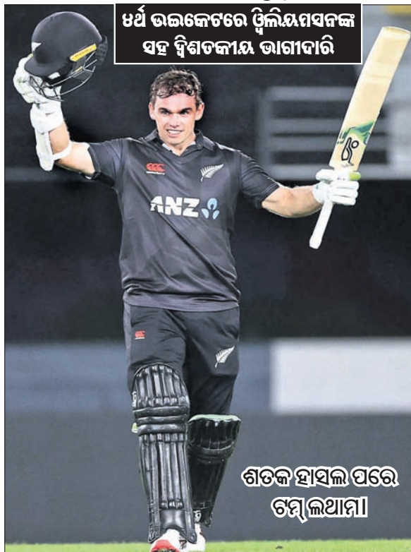
ଶତକ ହାସଲ ପରେ ଟମ୍ ଲଥାମ।

ଉଇକେଟକିପର ଟମ୍ ଲଥାମଙ୍କ ଅପରାଜିତ ଶତକ ସହାୟତାରେ ନ୍ୟୁଜିଲାଣ୍ଡ ଶୁକ୍ରବାର ଏଠାରେ ଅନୁଷ୍ଠିତ ଏକ ହାଇଲେଣ୍ଡିଂ ଦିନିକିଆ କ୍ରିକେଟ ମ୍ୟାଚରେ ଭାରତକୁ ୬ ଉଇକେଟରେ ପରାସ୍ତ କରିଛି। ଭାରତ ୫୦ ଓଭରରେ ୬ ଉଇକେଟ ହରାଇ ୩୦୬ ରନ ସଂଗ୍ରହ କରିଥିଲେ ମଧ୍ୟ ବିଜୟ ପାଇଁ ତାହା ପର୍ଯ୍ୟାପ୍ତ ହୋଇ ନ ଥିଲା। ଲଥାମ ଏବଂ ଅଧିନାୟକ କେନ୍ ଡ୍ରେଲିୟମସନଙ୍କ ଦ୍ୱିଶତକୀୟ ଭାଗାଦାରି ବଳରେ ନ୍ୟୁଜିଲାଣ୍ଡ ୪୭.୧ ଓଭରରେ ୩ ଉଇକେଟ ହରାଇ ୩୦୯ ରନ ସଂଗ୍ରହ କରି ନେଇଥିଲା। ୧୦୪ ବଲରୁ ୧୯ ଚୋକା ଓ ୫ ଛକା ସହାୟତାରେ ୧୪୫ ରନ କରି ନ୍ୟୁଜିଲାଣ୍ଡ ବିଜୟରେ ସହାୟତା ଲଥାମ ଫ୍ଲୋୟଡ ଅଫ୍ ଦି ମ୍ୟାଚ ବିବେଚିତ ହୋଇଥିଲେ। କେନ୍ ଡ୍ରେଲିୟମସନ ମଧ୍ୟ ଅଧିନାୟକ ଭୂମିକା ଖେଳି ୯୪ ରନରେ ଅପରାଜିତ ଥିଲେ। ୮୮ଟି ବଲ୍‌ର ସମ୍ମୁଖୀନ ହୋଇ ସେ ୬ ଚୋକା ଓ ୧ ଛକା ମାରିଥିଲେ।