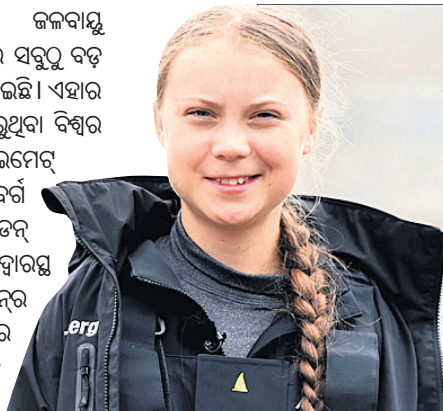
ସମ୍ପାଦନ ଉଲ୍ଲଙ୍ଘନ କରୁଛି ସୁଇଡେନ୍‌ର ଜଳବାୟୁ ନୀତି