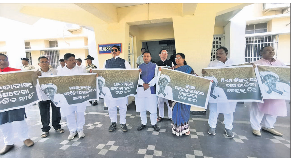
ବିଧାନସଭା ପରିସରରେ ଥିବା ରାଷ୍ଟ୍ରୀୟ ମୂର୍ତ୍ତି ତଳେ ବିଭେଦିତ ବିଧାୟକମାନେ ଚାଷୀ ପ୍ରସଙ୍ଗ ନେଇ ପ୍ରତିବାଦ କରୁଛନ୍ତି। ବିଧାନସଭା ବାହାରେ ଭାଜପା ବିଧାୟକମାନେ ଚାଷୀ ପ୍ରସଙ୍ଗ ନେଇ ବିକ୍ଷୋଭ କରୁଛନ୍ତି।