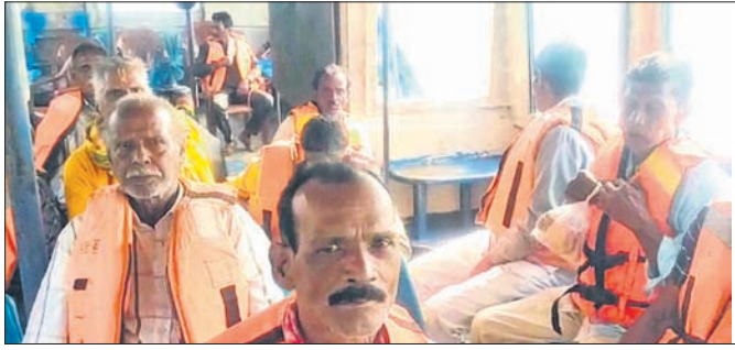
ବୋର୍ରେ ଫସି ରହିଥିବା ଯାତ୍ରୀ।

ଖୋର୍ଦ୍ଧା ଜିଲ୍ଲା ବାଲୁଆଁ ନିକଟ ବଡ଼କୁଳ ପାଞ୍ଚନିବାସ କେନ୍ଦ୍ରରେ ଘଟିଥିବା ଘଟଣାରେ ଫସିଥିବା ଯାତ୍ରୀମାନଙ୍କୁ ଖୋଜିବା ପାଇଁ ପତ୍ନୀବତୀ ବୋର୍ ପତ୍ନୀବତୀଙ୍କୁ ହତ୍ୟା କରାଯାଇଥିବା ଜଣାପଡ଼ିଛି। ଘଟଣାରେ ପତ୍ନୀବତୀଙ୍କୁ ହତ୍ୟା କରିବା ପାଇଁ ମାଓବାଦୀମାନଙ୍କର ହାତ ଥିବାରୁ ଗଣତନ୍ତ୍ର ସରକାରଙ୍କୁ ଏହାକୁ ଉଚିତ ଭାବେ ଚିଲିକାରେ ବୋର୍ ପତ୍ନୀବତୀଙ୍କୁ ଉଦ୍ଧାର କରିବା ପାଇଁ ଅନୁରୋଧ କରାଯାଇଛି।