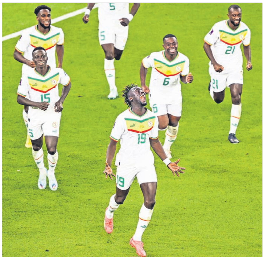
କାତାର ବିପକ୍ଷରେ ଗୋଲ ହେବାପରେ ଉଲ୍ଲସିତ ସେନେଗାଲ ଖେଳାଳି।

ଚଳିତ ଫିଫା ବିଶ୍ୱକପରେ ପ୍ରଥମ ଦଳଭାବେ ଆୟୋଜକ କାତାର ଏଲିମିନେଟ ହୋଇଛି। ଅଲ ଥୁମାମା ଷ୍ଟାଡ଼ିୟମରେ ଶୁକ୍ରବାର ଅନୁଷ୍ଠିତ ମ୍ୟାଚରେ ଏହି ଦଳ ସେନେଗାଲ ନିକଟରୁ ପରାଜିତ ହୋଇଛି। ୨ ମ୍ୟାଚରୁ କାତାରର ଏହା ଦ୍ୱିତୀୟ ପରାଜୟ। ପୂର୍ବ ମ୍ୟାଚରେ ଏହି ଦଳ ଇକ୍ୱେଡରଠାରୁ ୦-୨ ଗୋଲରେ ହାରି ଯାଇଥିଲା। ଅନ୍ୟପକ୍ଷରେ କାତାରକୁ ୩-୧ ଗୋଲରେ ହରାଇ ସେନେଗାଲ ପ୍ରଥମ ବିଜୟ ସ୍ୱାଦ ଚାଖୁଛି। ପ୍ରଥମ ଆଫ୍ରିକୀୟ ଦଳଭାବେ ସେନେଗାଲ ଏହି ବିଶ୍ୱକପରେ ବିଜୟୀ ହେବାରେ ସକ୍ଷମ ହୋଇଛି। ନିଜର ପ୍ରଥମ ମ୍ୟାଚରେ ଏହି ଦଳ ନେଦରଲାଣ୍ଡଠାରୁ ୦-୨ ଗୋଲରେ ହାରି ଯାଇଥିଲା। ଅନ୍ୟ ମ୍ୟାଚ ଚୁଡ଼ିକ ପରି ଏଠାରେ ମଧ୍ୟ ଆରମ୍ଭରେ ଉଭୟ ଦଳ ଭଲ ପ୍ରଦର୍ଶନ କରିଥିଲେ। ମାତ୍ର ଖେଳ ଆଗେଇବା ସହିତ ସେନେଗାଲ ପ୍ରାଧାନ୍ୟ ବିସ୍ତାର କରିଥିଲା। ୪୧ତମ ମିନିଟରେ ବୋଲିଲୋୟେ ତିଆ ଏକ ଗୋଲ ଦେଇ ପ୍ରଥମାର୍ଦ୍ଧ ଶେଷ ବେଳକୁ ସେନେଗାଲକୁ ୧-୦ରେ ଅଗ୍ରଣୀ କରିଥିଲେ। ଦ୍ୱିତୀୟାର୍ଦ୍ଧ ଆରମ୍ଭରୁ ସେନେଗାଲ