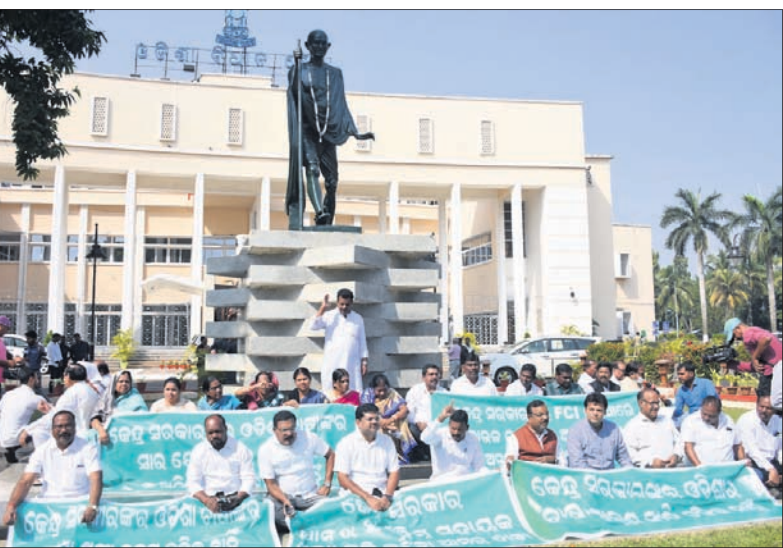
ବିଧାନସଭା ପରିସରରେ ଥିବା ରାଷ୍ଟ୍ରୀୟ ମୂର୍ତ୍ତି ତଳେ ବିଭେଦିତ ବିଧାୟକମାନେ ଚାଷୀ ପ୍ରସଙ୍ଗ ନେଇ ପ୍ରତିବାଦ କରୁଛନ୍ତି। ବିଧାନସଭା ବାହାରେ ଭାଜପା ବିଧାୟକମାନେ ଚାଷୀ ପ୍ରସଙ୍ଗ ନେଇ ବିକ୍ଷୋଭ କରୁଛନ୍ତି।