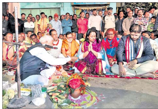
ବରଗଡ଼ ଧନୁଯାତ୍ରା ପାଇଁ ଶୁଭପ୍ରସ୍ତୁତ ସ୍ଥାପନ କରାଯାଇଛି ।