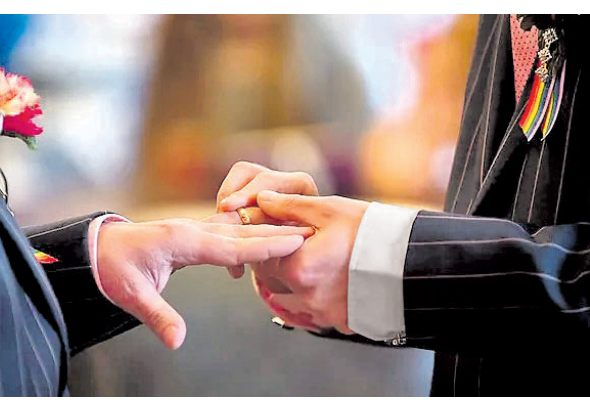
ବାସିନ୍ଦା ସୁପ୍ରିମୋ କୋର୍ଟରୁ ଓ ଅଭୟ ତାଙ୍କ ସେମାନଙ୍କ ବିବାହକୁ ସ୍ୱତନ୍ତ୍ର ବିବାହ

ନୂଆଦିଲ୍ଲୀ, ୨୫।୧୧: ସମାଜିକ ବିବାହ ପାଇଁ ସମାଜିକ, ଉଚ୍ଚାଧିକାରୀ, ତୃତୀୟାଧିକାରୀ ଓ ଅପ୍ରାକୃତିକ ଯୌନ ସମ୍ବନ୍ଧ ରକ୍ଷାକାରୀ (ଏଲଜିବିଟିସ୍) ସମ୍ପ୍ରଦାୟକୁ ବିବାହ ସମ୍ପର୍କିତ ଅଧିକାର ପ୍ରଦାନ ପାଇଁ ସୁପ୍ରିମକୋର୍ଟରେ ୨ଟି ପିଟିଶନ ଦାଖଲ ହୋଇଛି। ସର୍ବୋଚ୍ଚ ଅଦାଲତ ଶୁକ୍ରବାର ଏହା ଉପରେ କେନ୍ଦ୍ର ସରକାରଙ୍କୁ ଜବାବ ମାଗିଛନ୍ତି। ଏହାର ପରବର୍ତ୍ତୀ ଶୁଣାଣି ୪ ସପ୍ତାହ ପରେ ହେବ। ଦୁଇଜଣ ପୁରୁଷ ସମାଜିକୀ ପରସ୍ପରକୁ ବିବାହ କରିବାକୁ ଚାହୁଁଛନ୍ତି। ହାଇଦ୍ରାବାଦ