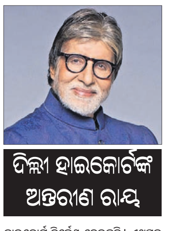
ଦିଲ୍ଲୀ ହାଇକୋର୍ଟଙ୍କ ଅଭିଯୋଗ ରାୟ

ବଲିଉଡ୍ ମହାନାୟକ ଅମିତାଭ ବଚନଙ୍କ ସ୍ୱର, ଫଟୋ କିମ୍ବା ନାମକୁ ତାଙ୍କ ବିନା ଅନୁମତିରେ ବ୍ୟବହାର କରାଯାଇପାରିବ ନାହିଁ। ବର୍ଷାୟାନ ଅଭିନେତାଙ୍କ ପକ୍ଷରୁ ଦାଏର ଏକ ପିଟିଶନର ଶୁଣାଣି କରି ଦିଲ୍ଲୀ ହାଇକୋର୍ଟ ଶୁକ୍ରବାର ଏହି ଅଭିଯୋଗ ରାୟ ଦେଇଛନ୍ତି। ଆସନ୍ତା ମାର୍ଚ୍ଚରେ ଏହି ପ୍ରସଙ୍ଗରେ ପରବର୍ତ୍ତୀ ଶୁଣାଣି କରାଯିବ ବୋଲି ହାଇକୋର୍ଟ ଧାର୍ଯ୍ୟ କରିଛନ୍ତି। ଜଣେ ସେଲିବ୍ରିଟି ରୂପେ ୮୦ ବର୍ଷୀୟ ଅଭିନେତା ଅମିତାଭ ବଚନଙ୍କ ପୂର୍ବସିଦ୍ଧି ରାଜନୂତ ଅନେକ ଲୋକ ବେଆଇନ ଭାବେ ବ୍ୟବହାର କରୁଛନ୍ତି। ଏପରି କି ଜଣେ ବ୍ୟକ୍ତି ଲୋକଙ୍କୁ ଠିକି ଗୋଟି ଶୋ' କୌନ୍ ବନେଗା କରୋତପତି (କେବିସି)