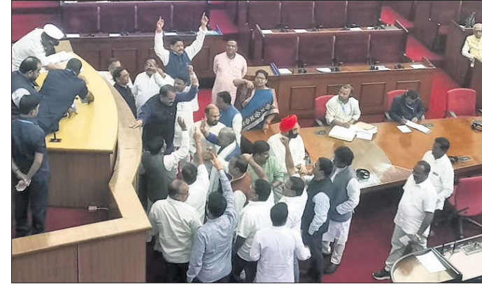
ବିଧାନସଭା ଭିତରେ ଶୁକ୍ରବାର ବିରୋଧୀମାନେ ଚାଷୀ ସମସ୍ୟା ନେଇ ହଜଗୋଳ କରୁଛନ୍ତି।

ଭୁବନେଶ୍ୱର, ୨୫.୧୧ (ସ୍ୱପ୍ନା) ବଡ଼ଗଡ଼ ଜିଲ୍ଲାର ପଦ୍ମପୁର ଉପନିର୍ବାଚନରେ ଚାଷୀ ସମସ୍ୟା ପୂର୍ଣ୍ଣ ପ୍ରସଙ୍ଗ ହୋଇଛି। ଚାଷୀଙ୍କ ଭୋଟ ହାତେଇବା ପାଇଁ ପ୍ରମୁଖ ରାଜନୈତିକ ଦଳଗୁଡ଼ିକ ଜୋର ଲଗାଇଛନ୍ତି। ଏହିକ୍ରମରେ ଚାଷୀ ପ୍ରସଙ୍ଗକୁ ନେଇ ବିଧାନସଭାରେ ଶୁକ୍ରବାର ଝଡ଼ ସୃଷ୍ଟି ହୋଇଛି। ବିଧାନସଭା ଓ ବାହାରେ ଶାସକ ଓ ବିରୋଧୀ ଦଳ ମୁହାଁମୁହିଁ ହୋଇ ପ୍ରବଳ ହଜଗୋଳ କରିଛନ୍ତି। ଚାଷୀଙ୍କୁ ଇନପୁର୍ତ୍ତ ସର୍ବସିତି ଦେବାରେ ବିଳମ୍ବ, ମଣ୍ଡି ଅବ୍ୟବସ୍ଥା, ଫସଲ ବାମା ଯୋଜନାରେ ତ୍ରୁଟିପୂର୍ଣ୍ଣ ନୀତିକୁ ନେଇ ଭାଜପା ରାଜ୍ୟ ସରକାରଙ୍କୁ ଯେରିଥିବା ବେଳେ କଂଗ୍ରେସ୍ ଇନପୁର୍ତ୍ତ ସର୍ବସିତି ବିଳମ୍ବ, ମଣ୍ଡି ଅବ୍ୟବସ୍ଥା