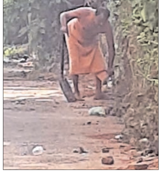
ରାସ୍ତାକୁ ଅଳ୍ପ ଆସିବା ସଫା କରାଯାଉଛି।

ବାସିନ୍ଦା ପ୍ରାୟ ୨୦୦ ଯୁବକ ଓ ଯୁବିକା ସହ ଶୁଭାରମ୍ଭ କରିଛନ୍ତି। ରାସ୍ତା ଓ ଶୁଳ୍କ କର୍ମଚାରୀମାନଙ୍କୁ ଖରାପ ବ୍ୟବହାର ପ୍ରଦର୍ଶନ କରିଥିବା ଅଭିଯୋଗରେ ଜିଲ୍ଲାପାଳ (ଡି.ଓ. ନଂ. ୨୭୧୭/୨୫.୧୧.୧୨) ଶିକ୍ଷକ ସଂଘକୁ କାର୍ଯ୍ୟରେ ନିଯୋଗ କରିବା ପାଇଁ ନିର୍ଦ୍ଦେଶ ଦେଇଛନ୍ତି। ନିର୍ଦ୍ଦେଶ ଅନୁସାରେ ନିୟମିତ ଭାବେ ରାସ୍ତା ପାର୍ଶ୍ୱ ସମେତ ଗଳିଗଳି ରାସ୍ତାକୁ ମାସିକ ସ୍ୱାଚ୍ଛତା କରିବାକୁ ନିର୍ଦ୍ଦେଶ ଦେଇଛନ୍ତି। ଫଳରେ ଖାର୍ତ୍ତିବା ଆସନ୍ତେ ପ୍ରକାଶ କରୁଛି। ବିଭିନ୍ନ ଖାର୍ତ୍ତିରେ ସ୍ଥାନୀୟ