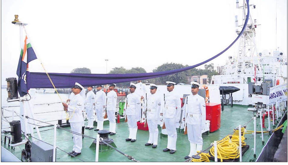
କୋଷ୍ଟଗାର୍ଡ ଯବାନମାନେ କାହାକୁ ପତାକା ଅବତରଣ କରୁଛନ୍ତି।