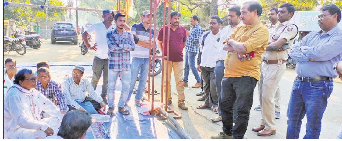
ଧାରଣାସ୍ଥଳରେ ଆଲୋଚନା କରାଯାଉଛି।