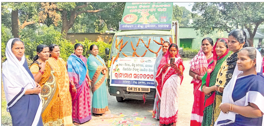
ବାଲ୍ୟବିବାହ ନିରାକରଣ ରଥର ଶୁଭାରମ୍ଭ ହେଉଛି।

ବାଲ୍ୟବିବାହ ନିରାକରଣ ରଥ ଖଣ୍ଡପଡ଼ା ଜୁରୁ ୨୨ଟି ପଞ୍ଚାୟତ ପରିକ୍ରମା ଆରମ୍ଭ କରିଛି। ଖଣ୍ଡପଡ଼ା ରୁକ୍ମ ପରିସରସ୍ଥିତ ଶିଶୁ ବିକାଶ ପ୍ରକଳ୍ପ ଅଧିକାରୀଙ୍କ ପ୍ରଶ୍ନାବଳୀ ପଢ଼ି ବନ୍ଧୁ ବନ୍ଧୁ କରି ରହିଛି। ଏହି ପରିକ୍ରମାରେ ସାଧାରଣରେ ସଚେତନତା ସୃଷ୍ଟି କରିବାକୁ ବାଲ୍ୟ ବିବାହ ନିରାକରଣ ରଥ ଅଜ୍ଞାନତା କର୍ମୀ, ମହିଳା ସ୍ୱୟଂ ସହାୟକା ଗୋଷ୍ଠୀର ସଦସ୍ୟାମାନେ ସ୍ୱାଗତ କରିଥିଲେ। ବାଲ୍ୟ ବିବାହ ନିରାକରଣ, ଶିଶୁମାନଙ୍କୁ ସୁରକ୍ଷା ଯୋଗାଇ ଦେବା ଓ ପାରମ୍ପରିକ ଝିଅକୁ ବୃତ୍ତଭଲ ରହିବା ସମ୍ପର୍କରେ ସଚେତନତା ସୃଷ୍ଟି ନେଇ ଏହି ରଥ ପଞ୍ଚାୟତ ପରିକ୍ରମା କରିବ ବୋଲି ଜଣାପଡ଼ିଛି।