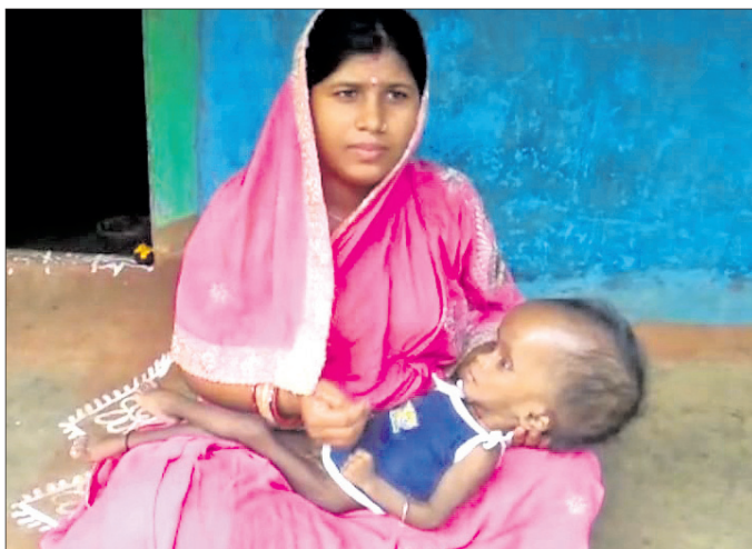
ମା' କୋଳରେ 'ଶିଶୁକନ୍ୟା'।