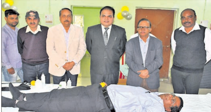
ଶିବିରରେ ଜଣେ ରକ୍ତଦାତା ରକ୍ତଦାନ କରୁଛନ୍ତି।