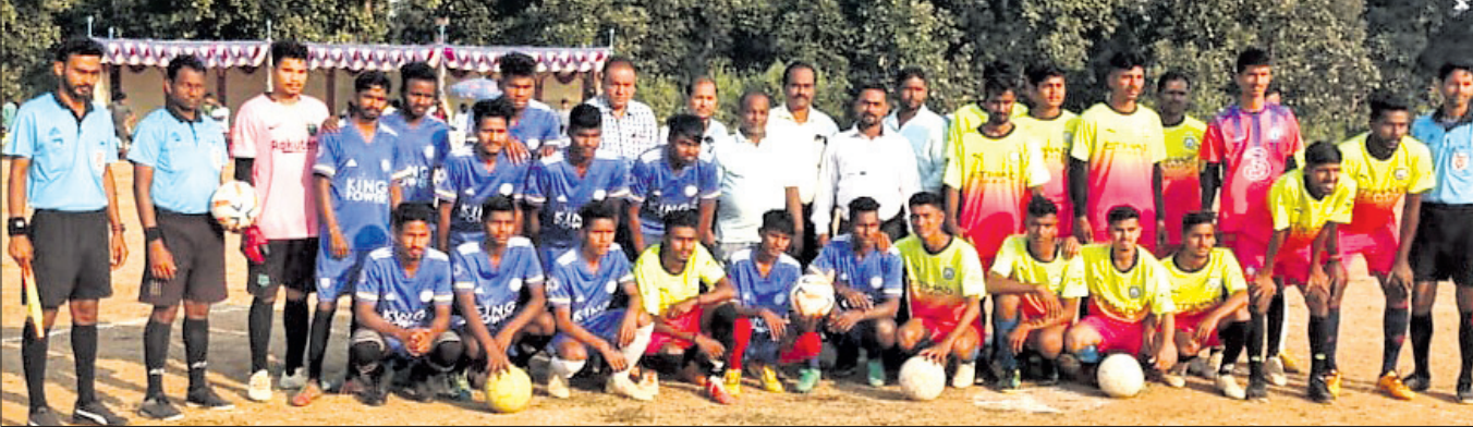
ସେନିପାଇନାଳ ମ୍ୟାଚ ଖେଳୁଥିବା ଉଭୟ ଦଳର ଖେଳାଳି।