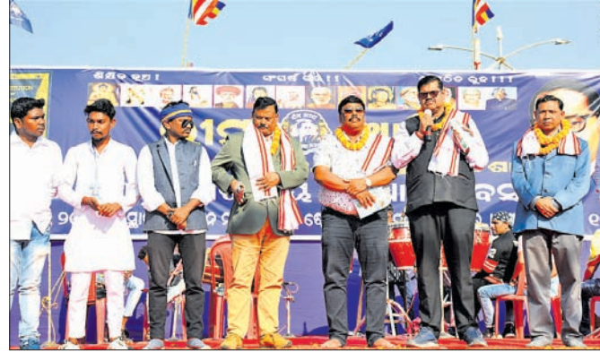
ସମ୍ବଲପୁର ଜିଲ୍ଲା ଅଧିକ୍ଷକ ଉପାଧ୍ୟକ୍ଷ ଶ୍ରୀ ଡାକ୍ତରୀ ଚରଫ୍ ଉଲ୍ଲହ୍ ସମ୍ପ୍ରଦାୟର ମଧ୍ୟ ପାଖେ, ମାନବ ସମ୍ବଳ ମୁଖ୍ୟ କ୍ରମେ ପାଠ୍ୟ ପଢ଼ା, ମାନବ ସମ୍ବଳ ମୁଖ୍ୟ କ୍ରମେ ପାଠ୍ୟ ପଢ଼ା...