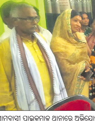
ଗ୍ରାମବାସୀ ପାଇକମାଳ ଧାନରେ ଅଭିଯୋଗ କରୁଛନ୍ତି।