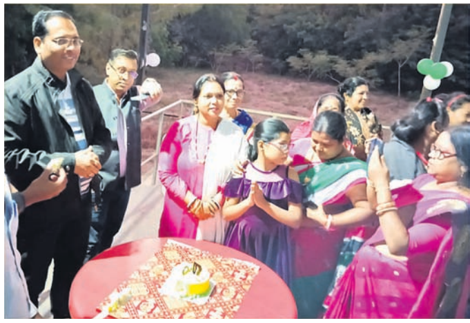
ଏକ ସମ୍ବଳ ପକ୍ଷରୁ ଉପକ୍ରମ ଗ୍ରହଣ କରାଯାଇଛି।