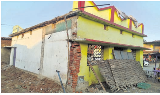
ଯାତ୍ରା ପ୍ରତୀକ୍ଷାକ୍ରମ କାର୍ଯ୍ୟକ୍ରମ ସମ୍ପର୍କରେ ସରପଞ୍ଚଙ୍କୁ ଦାବି କରାଯାଇଛି।

ଜମନକିରା ବ୍ଲକ୍‌ରେ ଯାତ୍ରା ପ୍ରତୀକ୍ଷାକ୍ରମ ବିପଦସଙ୍କୁଳ ଅବସ୍ଥାରେ ରହିଛି। ସରପଞ୍ଚଙ୍କୁ ଦାବିପତ୍ର ପ୍ରଦାନ କରାଯାଇଛି। ବିପଦସଙ୍କୁଳ ଯାତ୍ରା ପ୍ରତୀକ୍ଷାକ୍ରମ ବିପଦସଙ୍କୁଳ ଅବସ୍ଥାରେ ରହିଛି। ସରପଞ୍ଚଙ୍କୁ ଦାବିପତ୍ର ପ୍ରଦାନ କରାଯାଇଛି।