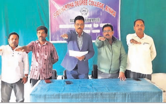
ସିଦ୍ଧାର୍ଥ ତିଗ୍ରୀ କଲେଜରେ ସମ୍ବିଧାନ ଦିବସ ପାଳନ ସଭାରେ ମଞ୍ଚାସୀନ ଅତିଥି।