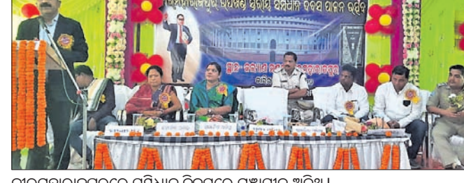
ବାରମହାରାଜପୁରରେ ସମ୍ବିଧାନ ଦିବସରେ ମଞ୍ଚାସୀନ ଅତିଥି।