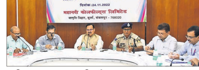
ଏକ ସମ୍ମେଳନାରେ ଆୟୋଜିତ ବୈଠକ।

ସମ୍ବଲପୁର, ୨୭.୧୧.୨୦୨୧ (ବୁଧବେଳା) ସମ୍ବଲପୁର ଜିଲ୍ଲାପାଳଙ୍କ ନିର୍ଦ୍ଦେଶରେ ଯୋଜିତ ହେଉଥିବା ହିନ୍ଦୀ ଭାଷା ସମସ୍ତଙ୍କୁ ଯୋଡ଼ିଥାଏ ଉପକ୍ରମ ଗ୍ରହଣ କରାଯାଇଛି। ସମ୍ବଲପୁର ଜିଲ୍ଲାପାଳଙ୍କ ନିର୍ଦ୍ଦେଶରେ ଯୋଜିତ ହେଉଥିବା ହିନ୍ଦୀ ଭାଷା ସମସ୍ତଙ୍କୁ ଯୋଡ଼ିଥାଏ ଉପକ୍ରମ ଗ୍ରହଣ କରାଯାଇଛି।