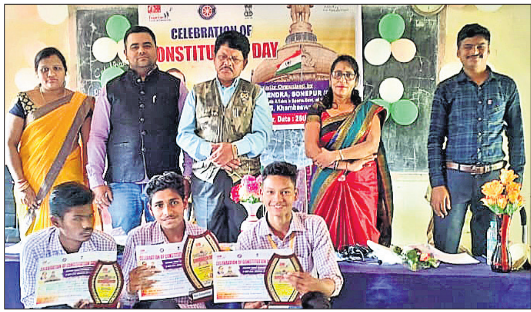
ସମ୍ବିଧାନ ଦିବସ ପାଳନ ଅବସରରେ ମଞ୍ଚାସୀନ ଅତିଥି ବୃନ୍ଦ।

ସୋନପୁର, ୨୬।୧୧ (ନି.ପ୍ର.): ସୋନପୁର ବ୍ଲକ୍ ଖଣ୍ଡେଶ୍ୱରୀପାଳି ଗ୍ରାମପଞ୍ଚାୟତ ମାହେଶ୍ୱରୀ ଉଚ୍ଚ ମାଧ୍ୟମିକ ବିଦ୍ୟାଳୟରେ ନେହେରୁ ମୁଦ୍ରକେନ୍ଦ୍ର