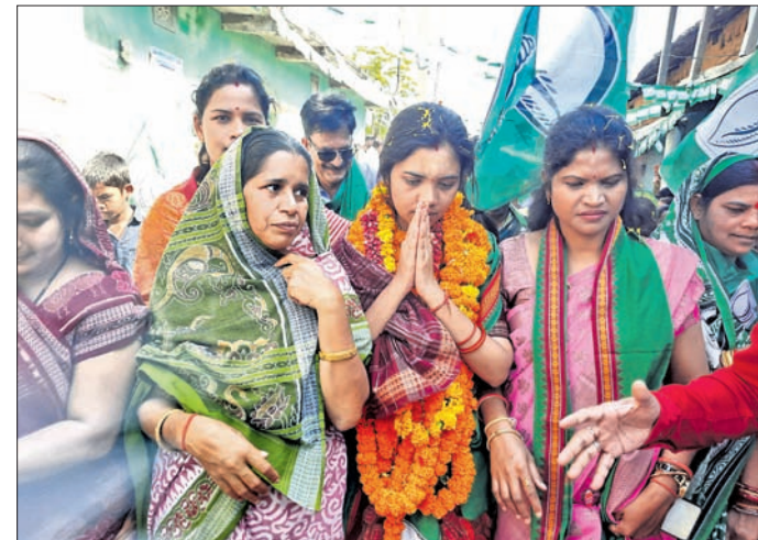
ପଠାପୁଣ୍ଡାଠାରେ ବିଜେଡି ପ୍ରାର୍ଥୀଙ୍କ ଶୋଭାଯାତ୍ରା।