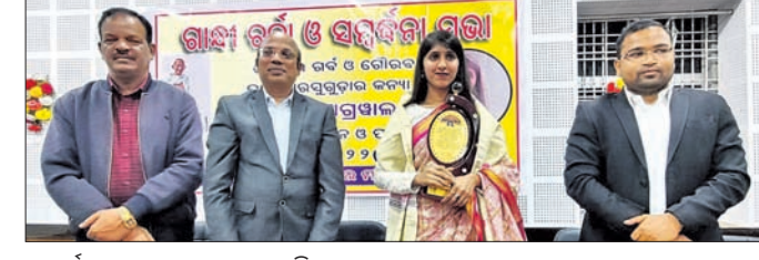
ସମର୍ଥନ ସଭାରେ ମହାସଭା ଅଧିଷ୍ଠିତ।