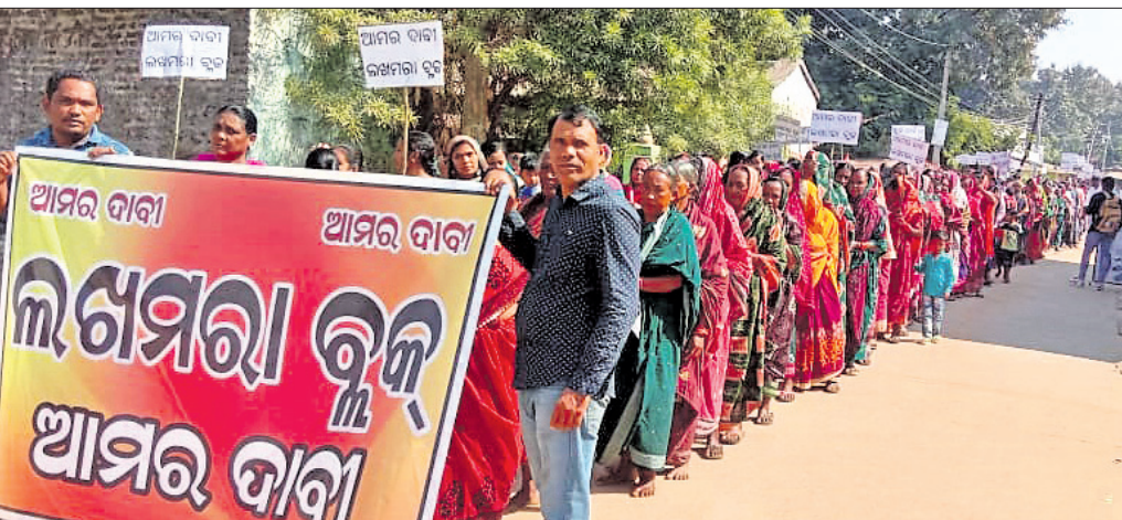
ଲଖମରାକୁ ବ୍ଲକ୍ ଦାବିରେ ଶୋଭାଯାତ୍ରା।