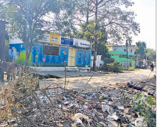
ଅଜ୍ଞାନତା କେନ୍ଦ୍ର ସମ୍ପ୍ରଦାୟରେ ଅଧିକ୍ଷକ ଉପାଧ୍ୟକ୍ଷ ଶ୍ରୀ ଡାକ୍ତରୀ ଚରଫ୍ ଉଲ୍ଲହ୍ ସମ୍ପ୍ରଦାୟର ମଧ୍ୟ ପାଖେ, ମାନବ ସମ୍ବଳ ମୁଖ୍ୟ କ୍ରମେ ପାଠ୍ୟ ପଢ଼ା, ମାନବ ସମ୍ବଳ ମୁଖ୍ୟ କ୍ରମେ ପାଠ୍ୟ ପଢ଼ା...