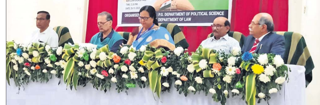
ବ୍ରହ୍ମପୁର ବିଶ୍ଵବିଦ୍ୟାଳୟରେ ସମ୍ପିଧାନ ଦିବସରେ ଯୋଗଦେଇଥିବା ଅତିଥି।

ବ୍ରହ୍ମପୁର ଅଧିକ, ୨୬/୧୧ ବ୍ରହ୍ମପୁର ବିଶ୍ଵବିଦ୍ୟାଳୟ ସ୍ଵାତନ୍ତ୍ର୍ୟଦିନ ପୂର୍ବକାଳର ଯୋଜନା, ଆଇନ ଓ ରାଜନୀତି ବିଭାଗ ପକ୍ଷରୁ ସମ୍ପିଧାନ ଦିବସ ପାଳିତ ହୋଇଯାଇଛି।