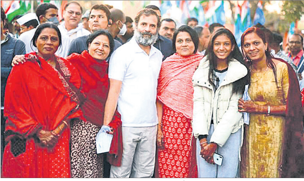
ଭାରତ ଯୋଡ଼ାଯାତ୍ରା ଅବସରରେ ଶନିବାର ମଧ୍ୟପ୍ରଦେଶର ଖଣ୍ଡ଼ା ଜିଲ୍ଲାରେ ସମର୍ଥକଙ୍କ ସହ କଂଗ୍ରେସ ନେତା ରାଜୁଲ ଗାନ୍ଧୀ ।