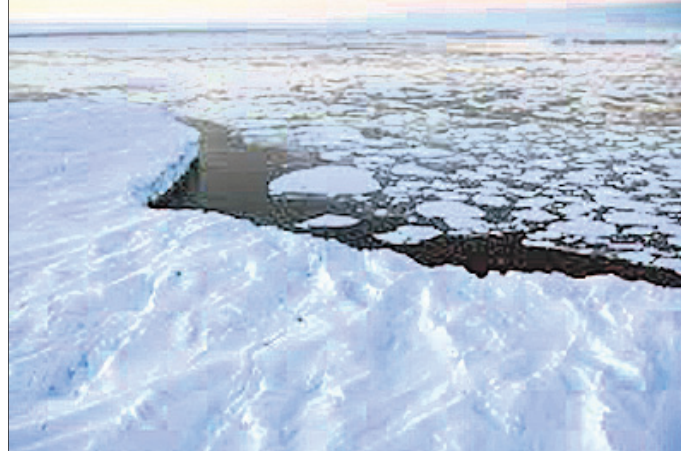
ଜଳବାୟୁ ପରିବର୍ତ୍ତନ ପ୍ରଭାବ

ଲକ୍ଷଣ: ବିଶ୍ୱାସୀଙ୍କ ପାଇଁ ଜଳବାୟୁ ପରିବର୍ତ୍ତନ ଏକ ବଡ଼ ଆହ୍ୱାନ ପାଲଟିଛି । ଏହା ପ୍ରଭାବରେ ବୈଶ୍ୱିକ ତାପମାତ୍ରା ମଧ୍ୟ କ୍ରମାଗତ ଭାବେ ବଢ଼ିବାରେ ଲାଗିଛି । ଫଳରେ ହିମବାହ, ବରଫ ଚାପର ତରଳିବା ଆରମ୍ଭ କରିଛନ୍ତି । ସମୁଦ୍ର ଓ ନଦୀର ଜଳସ୍ତରରେ ବୃଦ୍ଧି ଘଟିବା ସାଙ୍ଗକୁ ଜଳରେ ବ୍ୟାକ୍ଟେରିଆର ପରିମାଣ ବୃଦ୍ଧି ପାଇବ ବୋଲି ବ୍ରିଟେନ୍‌ର ଆବିଷ୍କୃତ୍ୱ ଯୁକ୍ତିତର୍କିତ ପକ୍ଷରୁ କରାଯାଇଥିବା ଅଧ୍ୟୟନରୁ ଜଣାପଡ଼ିଛି । ବରଫ ତରଳିବା ଦ୍ୱାରା ଏଥିରେ ରହୁଥିବା ବ୍ୟାକ୍ଟେରିଆ ସବୁ ପାଣିରେ ମିଶିବେ । ବରଫ ତୁଳନାରେ ଜଳର ତାପମାତ୍ରା ଅଧିକ ହୋଇଥିବା ଯୋଗୁ ଏହି ବ୍ୟାକ୍ଟେରିଆ ସବୁ ବହୁଗୁଣା ହୋଇଯିବେ । ସୁରୋପ, ନର୍ଥ ଆମେରିକା ଏବଂ ଗ୍ରୀନଲଣ୍ଡର ପାଖାପାଖି ୧୦ଟି ହିମବାହକୁ ନେଇ ବିଶେଷଜ୍ଞଙ୍କ