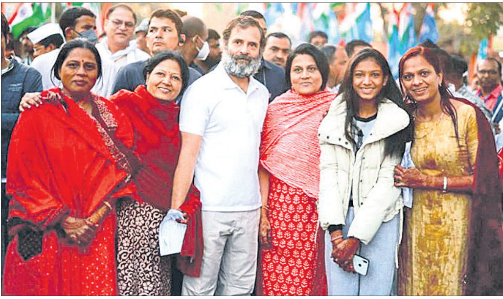
ଭାରତ ଯୋଡ଼ୋଯାତ୍ରା ଅବସରରେ ଶନିବାର ମଧ୍ୟପ୍ରଦେଶର ଖଣ୍ଡ଼ା ଜିଲ୍ଲାରେ ସମର୍ଥକଙ୍କ ସହ କଂଗ୍ରେସ ନେତା ରାଜୁଲ ଗାନ୍ଧୀ ।