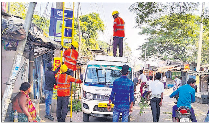
ବେତାକିରୀ ବଜାରରେ ବିଦ୍ୟୁତ୍ କର୍ମଚାରୀ ଗଛ କାଟିବାକୁ ଉଦ୍ୟମ କରୁଛନ୍ତି ।

ଉତ୍କଳ ଜିଲ୍ଲାର ଚାନ୍ଦବାଲି ବ୍ଲକ୍ ଆରଡ଼ି ଅଞ୍ଚଳରେ ଶନିବାର ଅପୋଷିତ ବିଦ୍ୟୁତ୍ କାଟ୍ ନେଇ ଉପକୋଭାମାନଙ୍କ ମଧ୍ୟରେ ଅସନ୍ତୋଷ ଦେଖାଦେଇଛି । ପୂର୍ବାହ୍ନ ୧୦ଟାରୁ ଦିନ ୧ଟା ପର୍ଯ୍ୟନ୍ତ ବିନା ସୂଚନାରେ ଏହି ଅଞ୍ଚଳରେ ବିଦ୍ୟୁତ୍ କାଟ୍ କରାଯାଇଥିଲା । ଅଧୁରାଳି ବିଦ୍ୟୁତ୍ ସର୍ବତ୍ତ୍ୱିକ୍ଷିତ ସାଆଁଳପୁର ଖୁଲୁର ଅଧୀନରେ ଥିବା ପ୍ରାୟ ୪୫ ଖଣ୍ଡ ଗାଁର ଉପକୋଭାମାନେ ଅଧୁରାଳିର ସମ୍ପୂର୍ଣ୍ଣାନ୍ତ ହୋଇଥିଲେ । ବିଶେଷକରି ଦଶମ ଶ୍ରେଣୀ ସମ୍ପେତିଆ ଆସେସମେଣ୍ଟ-୧ ପରୀକ୍ଷା ସମୟରେ ଏଭଳି ବିଦ୍ୟୁତ୍ କାଟ୍ ଯୋଗୁ ପରୀକ୍ଷାର୍ଥୀମାନେ ଅଧୁରାଳି ଭୋରିଥିଲେ । କେତେକ ପରୀକ୍ଷା କେନ୍ଦ୍ରରେ କୋଠରୀ ଅନ୍ଧାର ଥିବାରୁ ଛାତ୍ରଛାତ୍ରୀ ସମସ୍ୟାରେ ପଡ଼ିଥିଲେ । ସେହିପରି କପି ରୋଜିଟା ପାଇଁ ପରୀକ୍ଷା କେନ୍ଦ୍ରରେ ସିସିଟି