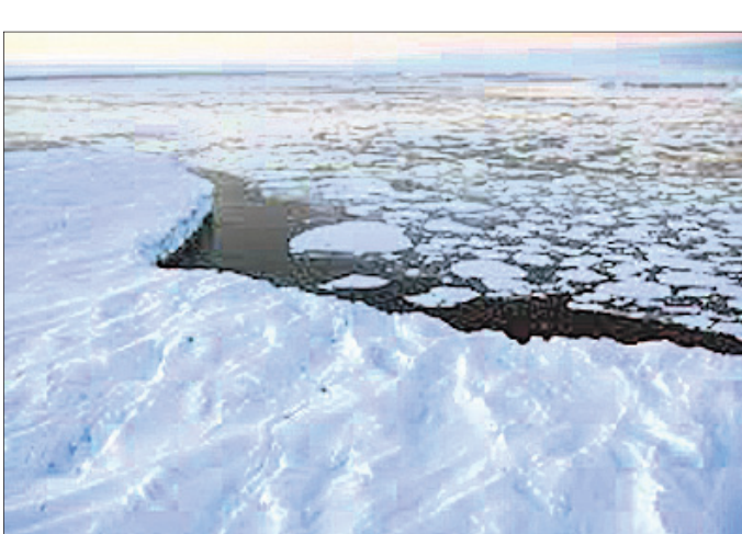
ଜଳବାୟୁ ପରିବର୍ତ୍ତନ ପ୍ରଭାବ

ଲକ୍ଷ୍ମଣ: ବିଶ୍ୱାସୀଙ୍କ ପାଇଁ ଜଳବାୟୁ ପରିବର୍ତ୍ତନ ଏକ ବଡ଼ ଆହ୍ୱାନ ପାଲଟିଛି । ଏହା ପ୍ରଭାବରେ ବୈଶ୍ୱିକ ତାପମାତ୍ରା ମଧ୍ୟ କ୍ରମାଗତ ଭାବେ ବଢ଼ିବାରେ ଲାଗିଛି । ଫଳରେ ହିମବାହ, ବରଫ ଚାପର ତରଳିବା ଆରମ୍ଭ କରିଛନ୍ତି । ସମୁଦ୍ର ଓ ନଦୀର ଜଳସ୍ତରରେ ବୃଦ୍ଧି ଘଟିବା ସାଙ୍ଗକୁ ଜଳରେ ବ୍ୟାକ୍ଟେରିଆର ପରିମାଣ ବୃଦ୍ଧି ପାଇବ ବୋଲି ବ୍ରିଟେନ୍‌ର ଆବିଷ୍କୃତ୍ୱ ଯୁକ୍ତିତର୍କିତ ପକ୍ଷରୁ କରାଯାଇଥିବା ଅଧ୍ୟୟନରୁ ଜଣାପଡ଼ିଛି । ବରଫ ତରଳିବା ଦ୍ୱାରା ଏଥିରେ ରହୁଥିବା ବ୍ୟାକ୍ଟେରିଆ ସବୁ ପାଣିରେ ମିଶିବେ । ବରଫ ଚଳନରେ ଜଳର ତାପମାତ୍ରା ଅଧିକ ହୋଇଥିବା ଯୋଗୁ ଏହି ବ୍ୟାକ୍ଟେରିଆ ସବୁ ବହୁଗୁଣୀ ହୋଇଯିବେ । ସୁରୋପ, ନର୍ଥ ଆମେରିକା ଏବଂ ଗ୍ରୀନଲଣ୍ଡର ପାଖାପାଖି ୧୦ଟି ହିମବାହକୁ ନେଇ ବିଶେଷଜ୍ଞଙ୍କ