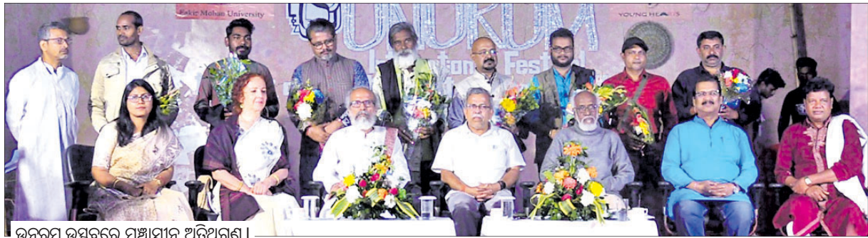
ଉତ୍କଳ ଉତ୍ସବରେ ମହାସାଧନ ଅଭିଯୋଗୀ ବାଲେଶ୍ଵର ଅଫିସ, ୨୭/୧୧

ବାଲେଶ୍ଵର ପଞ୍ଚାୟତମୋହନ ବିଶ୍ଵବିଦ୍ୟାଳୟ ଆନୁକୂଲ୍ୟରେ ଗତ ୨୪ତାରିଖରୁ ଆରମ୍ଭ ହୋଇଥିବା ଅନ୍ତର୍ଜାତୀୟ ସାଂସ୍କୃତିକ ଉତ୍ସବର 'ଉତ୍କଳ' ଶିବିର ଉଦ୍‌ଘାଟିତ ହୋଇଯାଇଛି। 'ଉତ୍କଳ' ଲୋକକଳା ଓ ଲୋକସଂସ୍କୃତିକୁ