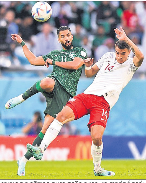
ପୋଲାଣ୍ଡ ଓ ସାଉଦି ଆରବ ମଧ୍ୟରେ ଅନୁଷ୍ଠିତ ମ୍ୟାଚର ଏକ ସଂଘର୍ଷପୂର୍ଣ୍ଣ ମୁହୂର୍ତ୍ତ।

୧୪ ଶତ୍ ଚାରିଦିନ ଭେଦେ ଅଷ୍ଟ୍ରେଲିଆର ଟି ଟି ଶର୍ତ୍ତ ଗର୍ବରେ ଉପସ୍ଥାପନା ହୋଇଥିଲା।