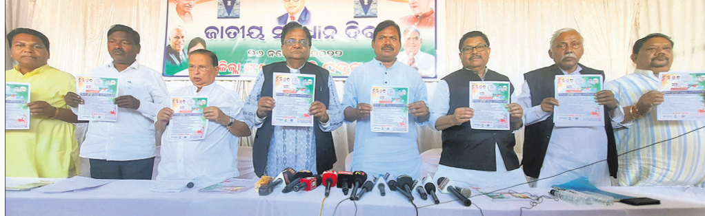
କଂଗ୍ରେସର ନିର୍ବାଚନୀ ଏକେଣ୍ଡାକୁ ପ୍ରଦର୍ଶନ କରାଯାଇଛି ।