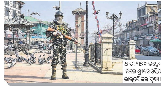
ଧାରା ୩୭୦ ଉଚ୍ଛେଦ ପରେ ଶ୍ରୀନଗରସ୍ଥିତ ଲାଲ୍‌ଚୌକର ଦୃଶ୍ୟ।

ପାକିସ୍ତାନ-ଅଧିକୃତ କଶ୍ମୀରକୁ ଭାରତରେ ପିଓକେ କୁହାଯାଏ। ନାମରୁ ସ୍ପଷ୍ଟ ହେଉଛି ଯେ, ଉକ୍ତ ଅଞ୍ଚଳକୁ ପଡ଼ୋଶୀ ପାକିସ୍ତାନ ବେଆଇନ ଭାବେ ଦଖଲ କରି ରଖିଛି। ୧୩,୨୯୭ ବର୍ଗ କି.ମି. ବିସ୍ତୃତ ଏହି ଭୃଷ୍ଟକୃତ ଇସ୍ଲାମାବାଦ 'ଆକାଦ କଶ୍ମୀର' କହି ନିଜର ବୋଲି ଦାବି କରିଆସୁଛି। ୪୦,୪୫,୩୬୬ ଜନସଂଖ୍ୟା ବିଶିଷ୍ଟ ପିଓକେ ସମ୍ପର୍କିତ ଚର୍ଚ୍ଚା ଏବେ ଭାରତରେ ହଠାତ୍ ବଢ଼ିଯାଇଛି। କେତେକ ଜାତୀୟ ଗଣମାଧ୍ୟମ ଏପରି ଖବର ପ୍ରସାରଣ କରୁଛନ୍ତି, ଯେତେଯେନିତି ଭାରତ ସରକାର ଏହି ବିବାଦୀୟ ଅଞ୍ଚଳକୁ ପାକିସ୍ତାନ କବ୍‌ଚାରୁ ରାତାରାତି ଛଡ଼ାଇଆଣିବେ। ତେବେ ଏଭଳି ଦାବି ପଛର କାରଣ କ'ଣ ହୋଇପାରେ? ଏହା କ'ଣ ସତରେ ସମ୍ଭବ?