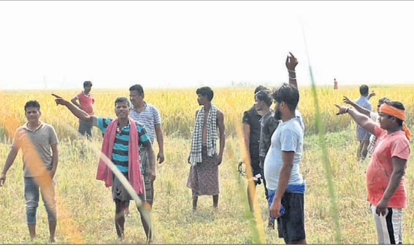
ବାଷାମାନେ ବିକ୍ଷୋଭ ପ୍ରଦର୍ଶନ କରୁଛନ୍ତି ।