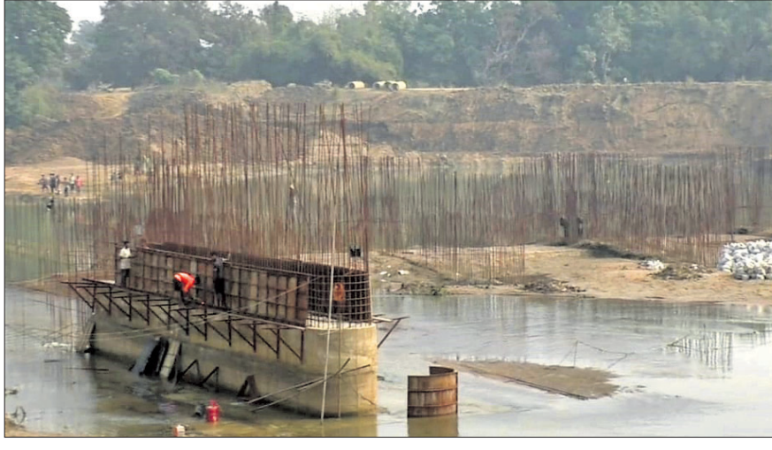
ନିର୍ମାଣାଧୀନ ବ୍ୟାରେଜ ।