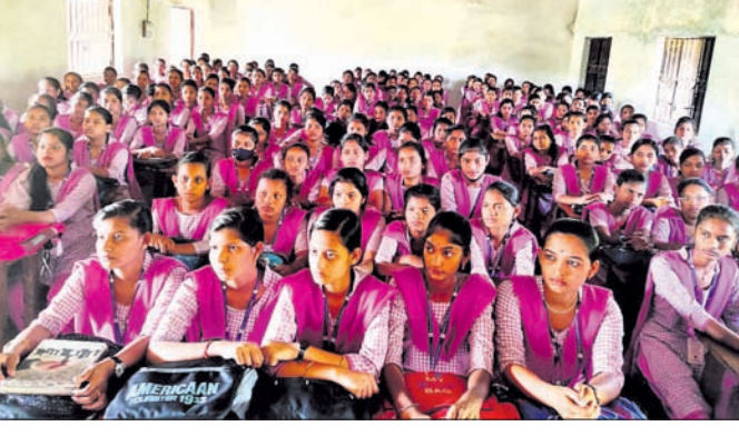
ସମ୍ବିଧାନ ଦିବସ ସଭାରେ ଯୋଗ ଦେଇଥିବା ଛାତ୍ରୀମାନେ ।