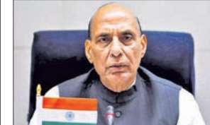
-ରାଜନାଥ ସିଂ, ଭାରତର ପ୍ରତିରକ୍ଷା ମନ୍ତ୍ରୀ

ପିଓକେକୁ ଫେରାଇ ଆଣିବା ପାଇଁ ନୂଆଦିଲ୍ଲୀ ପ୍ରତିଶ୍ରୁତିବଦ୍ଧ। ସମସ୍ତ ଶରଣାଗୀ ସେମାନଙ୍କ ଭୂମି ଓ ଘର ଫେରିପାଇବେ। ପାକିସ୍ତାନ ଭାରତ ପିଓକେ ଛୁଟାମାଡ଼ କରି ନିଜ ଦଖଲରେ ରଖୁଥିବା କଶ୍ମୀରବାସୀଙ୍କ ଉପରେ ଅତ୍ୟାଚାର କରୁଛି।