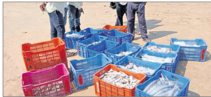
କୋଣାର୍କ, ୨୬.୧୧.୨୨ (ଡି.ଏନ୍.ଏ.)