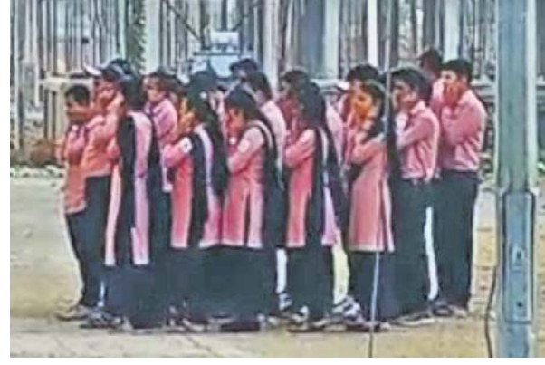
ବାରମ୍ବାର ଅପରାଧ, ୨୬/୧୧

କଲେଜ ଛାତ୍ରୀଛାତ୍ରଙ୍କୁ ଏମିତି ଦଣ୍ଡ ଦେଉଛନ୍ତି ଅଧ୍ୟାପକ