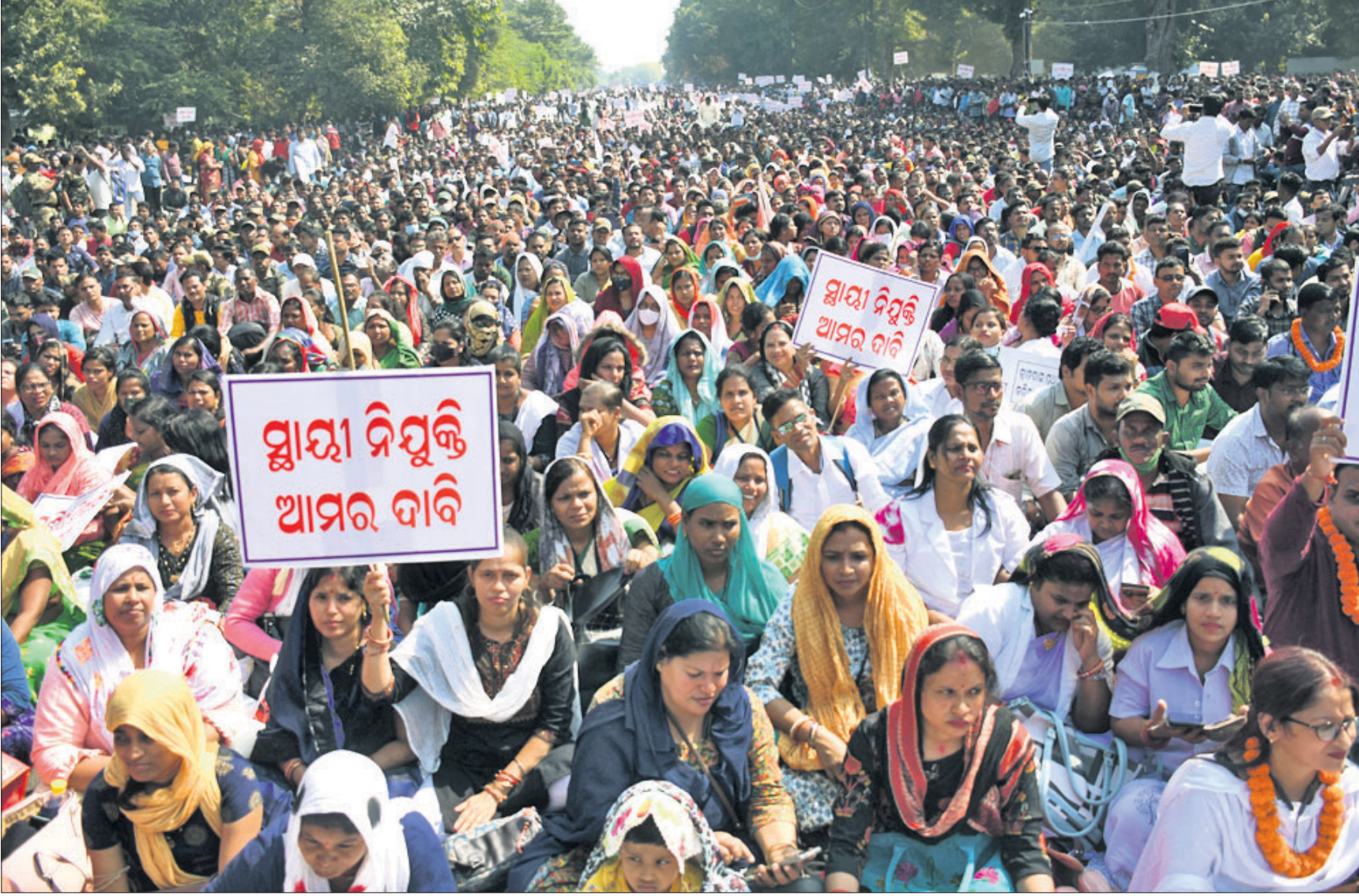
ସ୍ଥାୟୀ ନିଯୁକ୍ତି ଦାବିରେ ଓଡ଼ିଶା ଆଉଟ୍‌ସୋର୍ସିଂ ମହାସଂଘ ପକ୍ଷରୁ ମହାପୁରାଣୀ ମାର୍ଗରେ ବିରୋଧ ପ୍ରଦର୍ଶନ କରାଯାଇଛି।