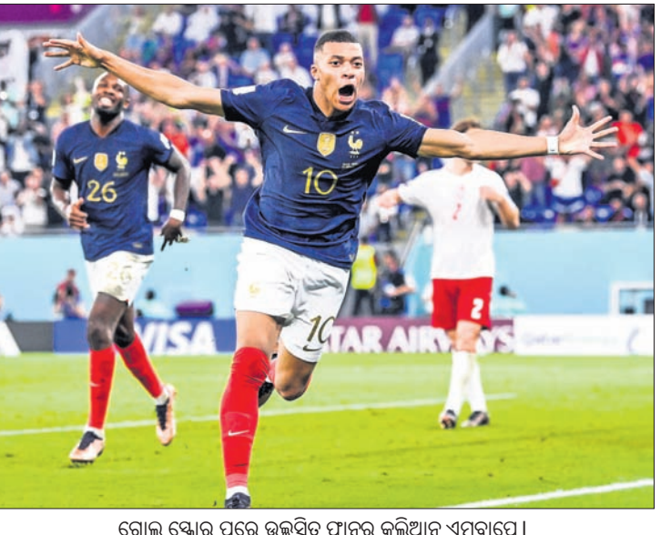
ଗୋଲ ଘୋର ପରେ ଉତ୍ସାହ ପ୍ରାନ୍ତର କଲିଆନ୍ ଏମ୍ବାସେ।