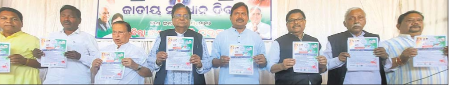
କଂଗ୍ରେସର ନିର୍ବାଚନୀ ଏକତାକୁ ପ୍ରଦର୍ଶନ କରାଯାଇଛି ।