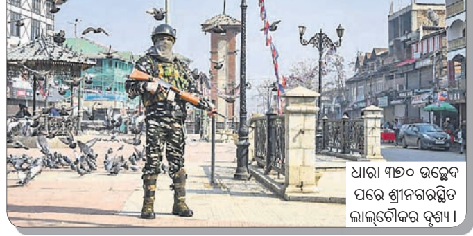
ଧାରା ୩୭୦ ଉଚ୍ଛେଦ ପରେ ଶ୍ରୀନଗରସ୍ଥିତ ଲାଲଟୋକର ଦୁଖୀ।

ପାକିସ୍ତାନ-ଅଧିକୃତ କଶ୍ମୀରକୁ ଭାରତରେ ପିଓକେ କୁହାଯାଏ। ନାମରୁ ସ୍ପଷ୍ଟ ହେଉଛି ଯେ, ଉକ୍ତ ଅଞ୍ଚଳକୁ ପଡ଼ୋଶୀ ପାକିସ୍ତାନ ବେଆଇନ ଭାବେ ଦଖଲ କରି ରଖିଛି। ୧୩,୨୯୭ ବର୍ଗ କି.ମି. ବିସ୍ତୃତ ଏହି ଭୃଷ୍ଣକୁ ଇସ୍ଲାମାବାଦ 'ଆକାସ କଶ୍ମୀର' କହି ନିଜର ବୋଲି ଦାବି କରିଆସୁଛି। ୪୦,୪୫,୩୬୬ ଜନସଂଖ୍ୟା ବିଶିଷ୍ଟ ପିଓକେ ସମ୍ପର୍କିତ ଚର୍ଚ୍ଚା ଏବେ ଭାରତରେ ହଠାତ୍ ବଢ଼ିଯାଇଛି। କେତେକ ଜାତୀୟ ଗଣମାଧ୍ୟମ ଏପରି ଖବର ପ୍ରସାରଣ କରୁଛନ୍ତି, ଯେତେଯେମିତି ଭାରତ ସରକାର ଏହି ବିବାଦୀୟ ଅଞ୍ଚଳକୁ ପାକିସ୍ତାନ କବ୍‌ଚାରୁ ରାଜାରାଜି ଛଡ଼ାଇଆଣିବେ। ତେବେ ଏଭଳି ଦାବି ପଛର କାରଣ କ'ଣ ହୋଇପାରେ? ଏହା କ'ଣ ସତରେ ସମ୍ଭବ?