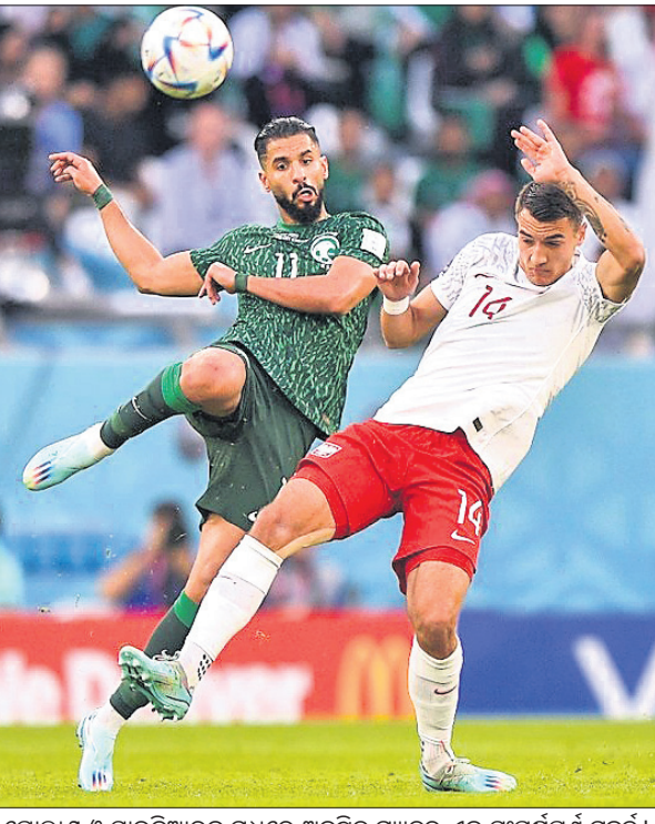
ଯୋଲାଣ୍ଡ ଓ ସାଉଦିଆରବ ମଧ୍ୟରେ ଅନୁଷ୍ଠିତ ମ୍ୟାଚର ଏକ ସମ୍ପର୍କପୂର୍ଣ୍ଣ ମୁହୂର୍ତ୍ତ।

ସାଉଦି ଆରବ ଓ ଯୋଲାଣ୍ଡ ପକ୍ଷରୁ ଯଥାକ୍ରମେ ୧୫ ଓ ୧୬ଟି ଫାଉଲ୍ ମରା ଯାଇଥିଲା। ମ୍ୟାଚର ୩୯ତମ ମିନିଟରେ ପିଓଟ୍ର ଜିଲେନସ୍କି ଯୋଲାଣ୍ଡ ପକ୍ଷରୁ ପ୍ରଥମ ଗୋଲ କରିଥିଲେ। ରବର୍ଟ ଲିଓପୋସ୍କିଙ୍କ ଆସିଷ୍ଟରେ ସେ ଏହି ଗୋଲ ଘୋର କରିଥିଲେ। ଲିଓପୋସ୍କିଙ୍କ ଶତକୁ ସାଉଦି ଗୋଲରକ୍ଷକ ଓଏସିଏ ଅଟକାଇଥିବା ବେଳେ ରିଭାଉଣ୍ଡକୁ ଜିଲେନସ୍କିଙ୍କୁ ପାସ କରିଥିଲେ। ସେ ଏହାକୁ ଗୋଲ ପୋଷ୍ଟ ମଧ୍ୟକୁ ପଠାଇବା ସହିତ ଯୋଲାଣ୍ଡକୁ ୧-୦ରେ ଆଗୁଆ