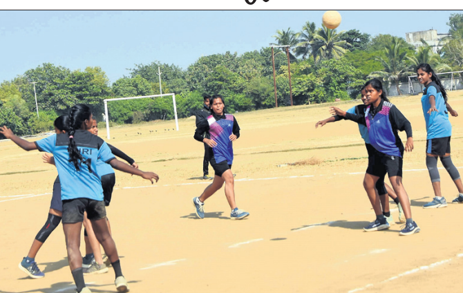
ଝାଡ଼େଶ୍ୱରୀ କ୍ଲବ ଆନୁକୁଲ୍ୟରେ ତାଳବଣିଆସ୍ଥିତ ଷୋର୍ଟସ କମ୍ପ୍ଲେକ୍ସରେ ଅନୁଷ୍ଠିତ ରାଜ୍ୟସ୍ତରୀୟ ଜୁନିୟର ହ୍ୟାଣ୍ଡବଲ ଚାମ୍ପିୟନଶିପ ପ୍ରତିଯୋଗିତାରେ ବାଳିକା ଓ ବାଳକଙ୍କ ଖେଳ ଚାଲିଛି।