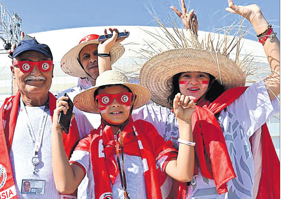
ଲୁନିସିଆ ପୁରୁବଳ ଦଳର ସମର୍ଥକ।