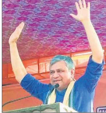
କେନ୍ଦ୍ରମନ୍ତ୍ରୀ ଅଶ୍ୱିନୀ ବୈଷ୍ଣବ ଓ ନରେନ୍ଦ୍ର ସିଂ ତୋମାର।

ବରଗଡ଼ରୁ ନୂଆପଡା ଭାଙ୍ଗି ପଦ୍ମପୁର ରେଳ ପ୍ରକଳ୍ପକୁ କେନ୍ଦ୍ର ସରକାର ଅନୁମୋଦନ ଦେଇ ସମାପ୍ତ ହେବ। ସେଥିପାଇଁ ଅଧିକାରୀମାନଙ୍କୁ ଆଭାବ ନାହିଁ। ରାଜ୍ୟ ସରକାରଙ୍କ ପାଖରେ କାମ ଅଟକିଛି। ରାଜ୍ୟ ସରକାର ଜମି ଦେଲେ ରେଳ ପ୍ରକଳ୍ପ ନିର୍ମାଣ କାମ ଆରମ୍ଭ ହେବ। ଯଦି ରାଜ୍ୟ ସରକାର କାଳି ଜମି ଦେବେ ତାହେଲେ ପରଦିନୁ ରେଳ ପ୍ରକଳ୍ପ କାମ ଆରମ୍ଭ ହେବ। ରାଜ୍ୟ ସରକାର ଯଦି ଜମି ନ ଦେବେ କାମ କେମିତି ଆରମ୍ଭ ହେବ ବୋଲି ରବିବାର ପଦ୍ମପୁର ଉପନିର୍ବାଚନରେ ଭାଜପା ପ୍ରାର୍ଥୀ ପ୍ରଦୀପ ପୁରୋହିତଙ୍କ ପାଇଁ ପ୍ରଚାର ସମୟରେ କହିଛନ୍ତି କେନ୍ଦ୍ର ରେଳ ମନ୍ତ୍ରୀ ଅଶ୍ୱିନୀ ବୈଷ୍ଣବ। ସେ କହିଛନ୍ତି, ଭାଜପା ପ୍ରାର୍ଥୀ ପ୍ରଦୀପ ପୁରୋହିତ ପଦ୍ମପୁର ହକ୍ ଓ ବିକାଶ ପାଇଁ ସଂଗ୍ରାମ କରୁଅଛନ୍ତି। ଏଠାକାର ଚାଷୀ, କେନ୍ଦ୍ରପତ୍ର ତୋଳକାମାନଙ୍କ ପାଇଁ ସେ ସବୁଦିନ ଲାଜେଇ କରୁଛନ୍ତି। ପ୍ରଦୀପ ପୁରୋହିତ ଏଠୁ ନିର୍ବାଚିତ ହୋଇ ଗଲେ ସେ ହିଁ ବିଧାନସଭାରେ ଗପ ପକାଇ ଜମି ଦେବା ପାଇଁ ରାଜ୍ୟ ସରକାରକୁ ବାଧ୍ୟ କରିପାରିବେ ବୋଲି କେନ୍ଦ୍ରମନ୍ତ୍ରୀ ବୈଷ୍ଣବ କହିଥିଲେ। ସେହିପରି କେନ୍ଦ୍ର କୃଷି ମନ୍ତ୍ରୀ ନରେନ୍ଦ୍ର ସିଂ ତୋମାର କହିଥିଲେ, ପ୍ରାଧାନମନ୍ତ୍ରୀ ଫସଲ ବାମା ଯୋଜନାରେ ରାଜ୍ୟ ସରକାର ବାମା କମ୍ପାନୀ ତତ୍ପର କରନ୍ତି। ସେମାନଙ୍କ ସହିତ ଚୁକ୍ତି କରନ୍ତି। ଫସଲ କ୍ଷୟକ୍ଷତି ରିପୋର୍ଟ ବି ରାଜ୍ୟ ସରକାର କରିଥାନ୍ତି। ସାରା ଦେଶରେ ଫସଲ ବାମା ଯୋଜନାରେ ଚାଷୀମାନେ କ୍ଷୟକ୍ଷତି ପାଇଁ ବାମା ରାଶି ପାଇବାକୁଛନ୍ତି। ହେଲେ ଓଡିଶାରେ କାର୍ଯ୍ୟକ୍ରମ ନ ଥିଲା। କାରଣ ଏଠାରେ ରାଜ୍ୟ ସରକାର ବାମା