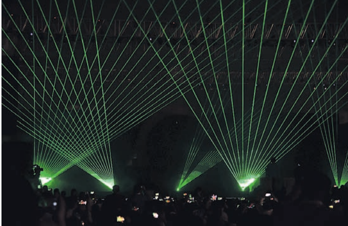
ପ୍ରଦର୍ଶିତ ଲେଜର ଲାଇଟ୍ ଶୋ ।