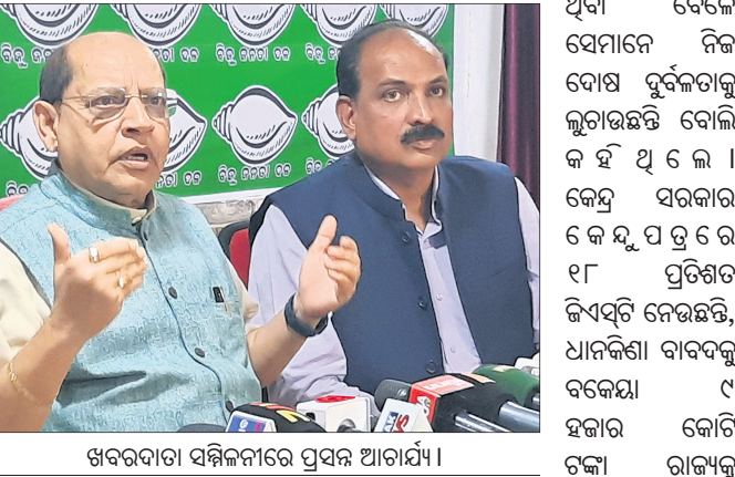
ଝରଣାଦ୍ଵାରା ସମ୍ପର୍କରେ ପ୍ରସନ୍ନ ଆଚାର୍ଯ୍ୟ।

କେନ୍ଦ୍ର ମନ୍ତ୍ରୀଙ୍କ ଦ୍ଵାରା କରାଯାଇଥିବା ବିକୃତ ଚିତ୍ରାଙ୍କୁ ପ୍ରସନ୍ନ କହିଛନ୍ତି। ଏହା ଅନ୍ତର୍ଭୁକ୍ତ ହୋଇଥିଲା। ଏହା ଅନ୍ତର୍ଭୁକ୍ତ ହୋଇଥିଲା। ଏହା ଅନ୍ତର୍ଭୁକ୍ତ ହୋଇଥିଲା।