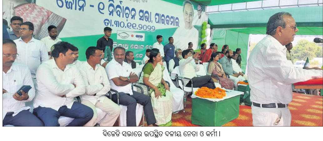
ବିଜେଡି ସଭାରେ ଉପସ୍ଥିତ ଦଳୀୟ ନେତା ଓ କର୍ମୀ।

ସେଲ୍‌ଫି ପଠାଇବା ସମୟରେ ନିଜର ନାମ ଏବଂ ମୋବାଇଲ ନମ୍ବର ଦେବାକୁ ଭୁଲି ନାହିଁ। ଯୋଗାଯୋଗ କରିବା ପାଇଁ ପ୍ରକାଶ ପାଇବ।