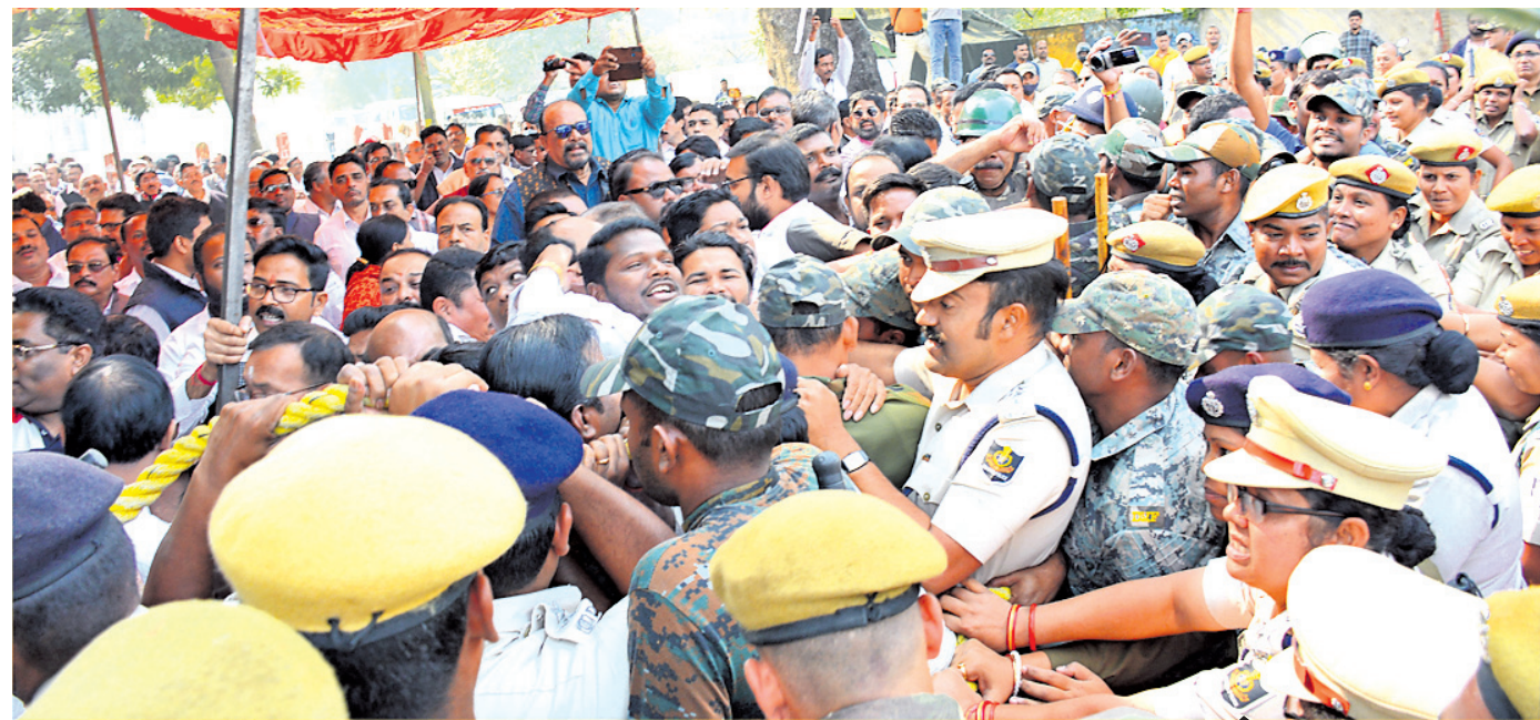
ସମ୍ବଲପୁର କଟେରି ଛକ ଆନ୍ଦୋଳନ ସ୍ଥଳରେ ପୋଲିସ-ଓକିଲ ଧସ୍ତାଧସ୍ତି।