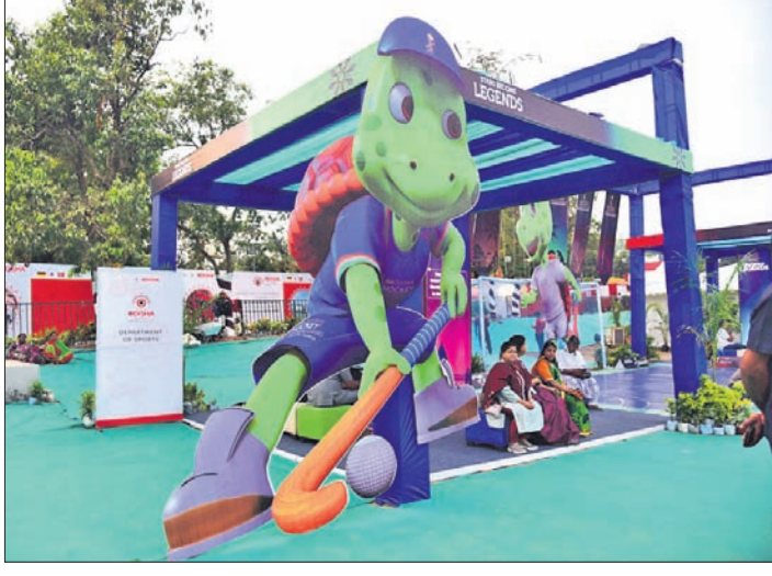
କାର୍ଯ୍ୟକ୍ରମରେ ହଳି ମାଷଟରୁ ପ୍ରଦର୍ଶନ କରାଯାଇଛି ।