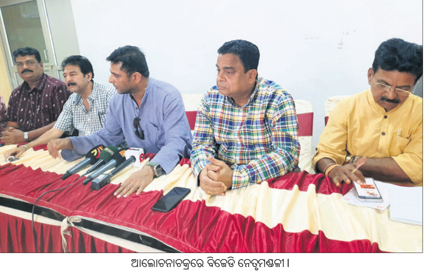
ଆଲୋଚନାରେ ଭାଗ ନେଉଥିବା ପକ୍ଷରୁର କର୍ମଚାରୀ।