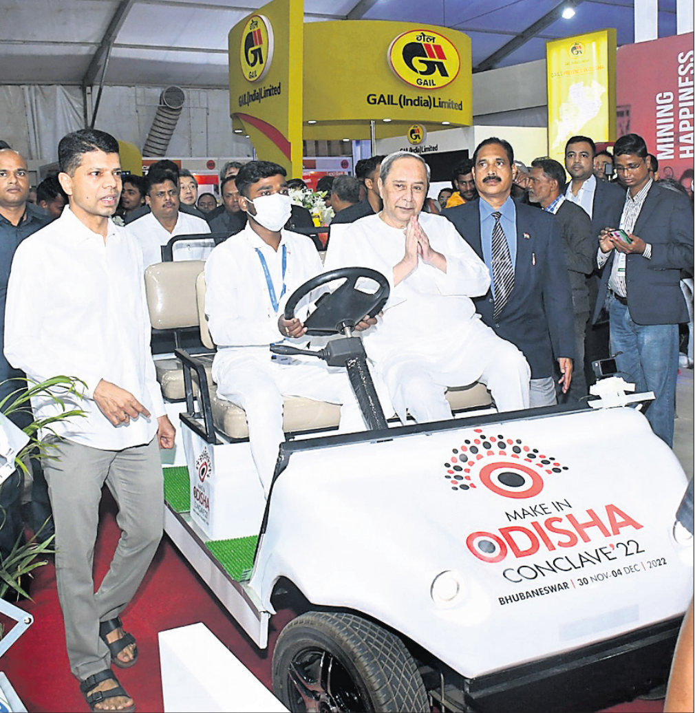
ପୁଣ୍ୟମନ୍ତ୍ରୀ ନବୀନ ପଟ୍ଟନାୟକ ପ୍ରଦର୍ଶନୀ ଭୂମି ଦେଖୁଛନ୍ତି । ନିକଟରେ ଅଛନ୍ତି ଡି.ଏଚ୍. ପାଣିଆନ ।