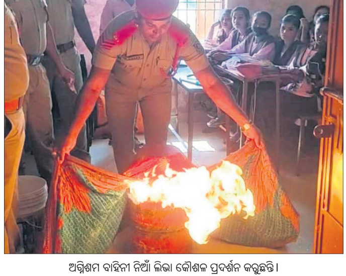
ଅଗ୍ନିଶମ ବାହିନୀ ନିଆଁ ଲିଭାଇବା ପ୍ରଦର୍ଶନ କରୁଛନ୍ତି।