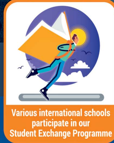
Various international schools participate in our Student Exchange Programme