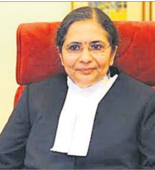
ଜଷ୍ଟିସ୍ ହିମା କୋହଲି