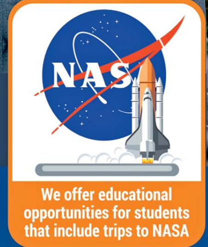
We offer educational opportunities for students that include trips to NASA