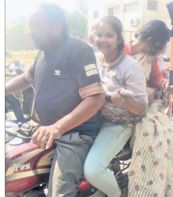
ଅଜଗର ଧରି ବଜାର ବୁଲିଥିବା ଯାପଧାରାଳି ପରିବାର।

କାର୍ଯ୍ୟକ୍ରମ ଅଧିକାରୀ, ୧୧୧୨ ମୟୂରଭଞ୍ଜ ଜିଲ୍ଲା କୁଳିଆଣୀ ବ୍ଲକ ଅଞ୍ଚଳରୁ ଉଦ୍ଧାର ହୋଇଥିବା ଏକ ବିରାଟକାୟ ଅଜଗରକୁ ଧରି ଯାଏ ଧାରାଳ ବଜାର ବୁଲିବା ଘଟଣା ଚର୍ଚ୍ଚାର ବିଷୟ ହୋଇଛି। ବିଲୁପ୍ତ ପ୍ରାଣୀ ପ୍ରାଣୀ ଉଦ୍ଧାର ନିୟମର ଉଲ୍ଲଙ୍ଘନ କରି ଜନଗହନପୂର୍ଣ୍ଣ ଅଞ୍ଚଳରେ ପ୍ରଦର୍ଶନ କରିବା ଘଟଣାକୁ ବିଭିନ୍ନ ମହଲରେ ସମାଲୋଚନା କରାଯାଇଛି।