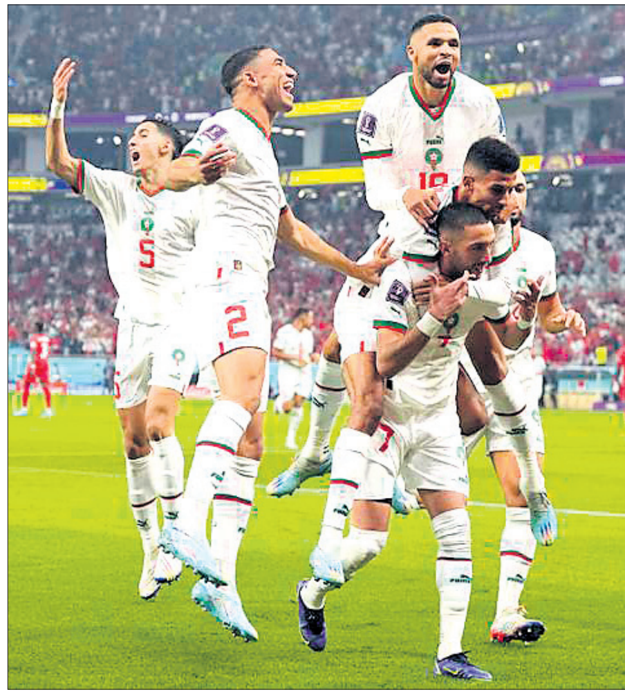
କାନାଡ଼ା ବିପକ୍ଷରେ ବିଜୟ ଖୁସିରେ ଉଲ୍ଲସିତ ମରକ୍କୋ ଖେଳାଳି ।