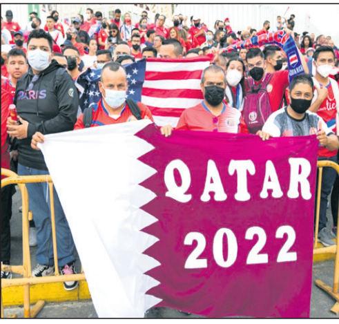
କିମ୍ପାସ ପୂଷ୍ପ, ନାରିକେଳ, ଅସଂଖ୍ୟ ଦାପ, ଅମାପ ବାଉଳ ଓ ରକ୍ଷାଅନ୍ନ ମଧ୍ୟ ଭାଗ ଯାଇଥାଏ । ଏଗୁଡ଼ିକ ନଷ୍ଟ ହୋଇଗଲେ, ଜଳରେ ପରିଚାଳିତ ଜଳ ଦୂଷିତ ହେବା ସହିତ ଜାଣିବା ଆକାରରେ ଦୂଷିତ ହୋଇଥାଏ । ଆମ ଦେଶରେ ଅଧିକାଂଶ ପୋଖରୀ ଘାଟରେ, ବ୍ୟକ୍ତି ବିଶେଷ ନିଷ୍ପାସନ ପ୍ରକ୍ରିୟା ଜାରି ରଖିଥାଆନ୍ତି ; ପରିଣାମ ସ୍ୱରୂପ ଜଳ ସମ୍ପୂର୍ଣ୍ଣ ଦୂଷିତ ହୋଇଥାଏ । ବିପତ୍ତିରେ ବିକ୍ରି ହେଉଥିବା ପଲିଥିନ୍, ସୋଲୋ ଓ ଅର୍ପୋକ୍ଲେ ଆଦି ଆଣି ପଦନରେ ଉଡ଼ି ପାଣି ସଂଶ୍ଳେଷଣ ଆଦି ଅତି ଜଳଧନୀ ଭାବେ ଜଳକୁ ପ୍ରଦୂଷିତ କରିଥାଏ, ବିଷାକ୍ତ କାର୍ବନାକ୍ସିଡ୍ ଔଷଧ ଓ କଳକାରଖାନାକୁ ନିର୍ଗତ ତରଳ ପଦାର୍ଥ ନିକଟସ୍ଥ ନଦୀରେ ନିର୍ଗତ ହୋଇ ଜଳ ପ୍ରଦୂଷିତ

ସମୟରେ ମାର୍କେଟ୍ ଉପରେ ନକାରାତ୍ମକ ପ୍ରଭାବ ସୃଷ୍ଟି ହେବା ଯୋଗୁ ସେମାନେ ଏହା ଜାଣିବା ସମ୍ଭବ ହୋଇଥିଲା । ବିଶ୍ୱକପ ସମୟରେ ଆମେରିକାର ହାରାହାରି ମାର୍କେଟ୍ ରିଟର୍ଣ୍ଣ ୨.୬% ହ୍ରାସ ଘଟିଥିବା ଜଣାପଡ଼ିଥିଲା । କିନ୍ତୁ ୪ଟି ଟ୍ରେଡାଭିଜିଟ୍ରେ ଏହା ହାରାହାରି ୧.୨% ବୃଦ୍ଧି ହୋଇଥିଲା । ବିଶ୍ୱକପରେ ହାରାହାରି ଦେଶଗୁଡ଼ିକର ସଂଖ୍ୟା ବଢ଼ିବା ଯୋଗୁ ଆମେରିକା ଷ୍ଟକ୍ ମାର୍କେଟ୍ ବା ଶେୟାର ବଜାର ଉପରେ ସାମଗ୍ରିକ ପ୍ରଭାବ ଅଧିକ ବଢ଼ିଛି । ଫଳରେ ମାର୍କେଟ୍ ମାନ୍ଦା ହେଉଛି । ଏହି ଧାରାକୁ ଦେଖିଲେ ଫିଫା ବିଶ୍ୱକପ ସମୟରେ ଧୂର୍ଣ୍ଣ ନିବେଶକମାନେ ସେମାନଙ୍କ ଯୁଏଲ୍ ଶେୟାର ହ୍ରାସ କରିବାକୁ ଚାହଁପାରନ୍ତି । ଯଦି ଅନେକ ନିବେଶକ ଏହି ଗଣନାଟିକୁ ଆପଣାଇବେ ଏବଂ ଲାଗାତର ଭାବେ ଯୁଏଲ୍ ଶେୟାର ବଜାର ସହ କମ୍ ଜଡ଼ିତ ହେବେ, ତେବେ ଶେୟାର ବଜାରରେ ହ୍ରାସ ଯାହା ଅନୁମାନ କରାଯାଇଛି ତାହା ହିଁ ସତ ପ୍ରମାଣିତ ହେବ । ମାର୍କେଟ୍ରେ ନେଇ ବିଶ୍ୱକପ ପ୍ରେରିତ ଚଳଣିର ବିଚାର ଶୀଘ୍ର ଶେଷ ହେବା ସମ୍ଭାବନା ନାହିଁ । କିନ୍ତୁ ଚଳିତ ବିଶ୍ୱକପରେ ଜର୍ମାନୀକୁ ହରାଇବା ଓ ସାଉଦି ଆରବ ଆର୍ଜେଣ୍ଟିନାକୁ ପରାସ୍ତ କରିବା ଭଳି ଯେତେବେଳେ ତୁମ ଚିତ୍ର ଅସମ୍ଭବକୁ ସମ୍ଭବ କରିବ ସେତେବେଳେ ତୁମ ଉତ୍ସାହ ଦର୍ଶକଗୁଡ଼ିକର ଅପମାନ ଦୂରହୋଇ ଅଧିକ ମନୋରଞ୍ଜନ ପ୍ରଦାୟକ ହୋଇଯିବ । ଦୀର୍ଘ ଦିନର ସମ୍ଭାବନା ଦୃଷ୍ଟିରୁ ଏକ ଅଲୌକିକ ପାଇଁ ଏହା ହିଁ ହେଉଛି ସେହି ଆଶା ଯାହା ଖେଳପ୍ରେମୀ, ନିବେଶକ, ଭୋଟର ଏବଂ ସନ୍ତାନପ୍ରାପ୍ତି କିମ୍ବା ବିବାହ କରିବାକୁ ଯୋଜନା କରିଥିବା ବ୍ୟକ୍ତିମାନଙ୍କୁ ପ୍ରେରିତ କରିବ । ଏଗୁଡ଼ିକ ମଧ୍ୟରୁ କୌଣସିଟି ଚର୍ଚ୍ଚାବସ୍ତୁ ନୁହେଁ । କିନ୍ତୁ ଏହା ଏକ ସୁନ୍ଦର ଖେଳ ଭଳି ଜୀବନକୁ ସୁନ୍ଦର କରିଥାଏ ଗୋଟିଏ ଗୋଟିଏ ଆଶା ମାତ୍ର । ସାଲକିଆନ୍ତ୍ରଣ ଏବଂ 'ମେଣ୍ଟାଲ ଡାକ୍ତରୀ'ର ପଦ୍ମ କୋଭିଡ୍-୧୯'ର ଲେଖକ