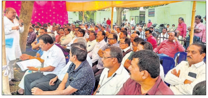
ରାଜ୍ୟ ପରିବହନ କମିଶନରଙ୍କ କାର୍ଯ୍ୟାଳୟ ସମ୍ମୁଖରେ ଧାରଣାରେ ବସିଥିବା ବସ୍ ମାଲିକମାନେ ।

ବିଭାଗ ବିଭାଗ ଦ୍ୱାରା ସଞ୍ଚାଳିତ ସମ୍ବନ୍ଧିତ ଶିଶୁ ବିଭାଗ ଯୋଜନା (ଆଇସିଡିଏସ୍) ଓ ବିଦ୍ୟାଳୟ ଓ ଗଣଶିକ୍ଷା ବିଭାଗର ପିଏମ୍-ପୋଷଣ (ପୂର୍ବତନ ମଧ୍ୟାହ୍ନଭୋଜନ ଯୋଜନା) ରେ ଉପକୃତ ହେଉଥିବା ହିତାଧିକାରୀଙ୍କ ନିମନ୍ତେ ୨୦୧୭-୧୮ ବର୍ଷଠାରୁ ଜିଟାମିନିମୁକ୍ତ ଚାଉଳ ଯୋଗାଣ ଯୋଜନା କାର୍ଯ୍ୟକାରୀ କରାଯାଇଛି । ଏହି ଯୋଜନା ଅନ୍ତର୍ଗତ ମାଲିକାନାଗିରି ପାଇଲଟ ଜିଲ୍ଲାରେ ୨୦୧୭ ଜୁଲାଇଠାରୁ ହିତାଧିକାରୀଙ୍କୁ ଜିଟାମିନିମୁକ୍ତ ଚାଉଳ ଯୋଗାଣ ଦିଆଯାଇଛି ଓ ଅବଶିଷ୍ଟ ଜିଲ୍ଲାଗୁଡ଼ିକରେ ଏହି ଯୋଜନା ପର୍ଯ୍ୟାୟକୁଳମେ ଲାଗୁ କରାଯିବ ।