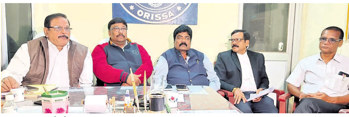
ଜିଲ୍ଲା ଓକିଲ ସଂଘ କର୍ମକର୍ତ୍ତାଙ୍କ ସହ ଓଲ୍ଲା ସଭାପତିଙ୍କ ବୈଠକ ।