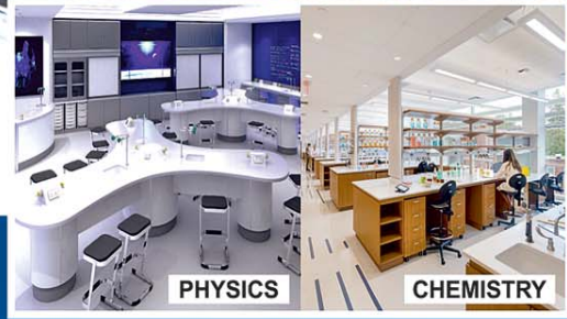
STATE-OF-THE-ART SCIENCE LABORATORIES

ADMISSION OPEN 2023-24 NURSERY - STANDARD IX, XI CBSE PATTERN