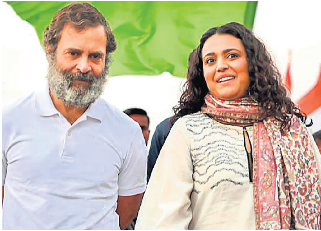
ଭାରତ ଯୋଡ଼ା ଯାତ୍ରା ଅବସରରେ ମଧ୍ୟପ୍ରଦେଶର ଉତ୍କଳିନୀରେ ରାହୁଲ ଗାନ୍ଧୀଙ୍କ ସହ ଅଭିନେତ୍ରୀ ସୁରା ଭାଷ୍ଟର ।

କଂଗ୍ରେସ ପକ୍ଷରୁ ଚାଲିଥିବା ଭାରତ ଯୋଡ଼ା ଯାତ୍ରାରେ ନେତା ରାହୁଲ ଗାନ୍ଧୀଙ୍କ ସହ ଜଣେ ପରେ ଜଣେ ସେଲିବ୍ରିଟି ସାମିଲ ହେବାରେ ଲାଗିଛନ୍ତି । ଏହି କ୍ରମରେ ଗୁଜରାଟର ଅଭିନେତ୍ରୀ ସୁରା ଭାଷ୍ଟର ମଧ୍ୟପ୍ରଦେଶର ଉତ୍କଳିନୀରେ ରାହୁଲଙ୍କ ସହିତ ପହଞ୍ଚିଥିଲେ । ଏହି ବିଶାଳ ଜନସମ୍ମିଳନୀରେ ନେତାମାନେ ସାମିଲ ହୋଇ ଦେଶ ପାଇଁ ଛିଡ଼ା ହୁଅନ୍ତୁ ବୋଲି ସେ ଆହ୍ୱାନ ଦେଇଥିଲେ ।