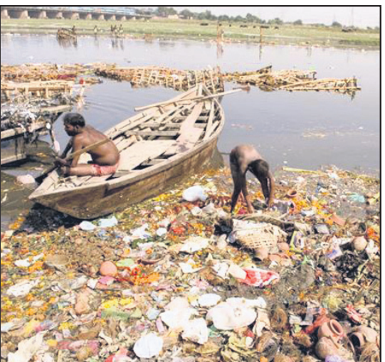
ନିୟନ୍ତ୍ରିତ ହୋଇଥାଏ । ବିଶ୍ୱକପ ଜଳର ଉପାଦେୟତା ଓ ଜଳପ୍ରଦୂଷଣର ନିୟନ୍ତ୍ରଣ ଉପରେ ଜନସଚେତନା ସୃଷ୍ଟି କଲେ ଜଳ ପ୍ରଦୂଷଣକୁ ପ୍ରତିରୋଧ କରିବା ଅସମ୍ଭବ ହେବ ନାହିଁ । ପୃଥିବୀରେ କ୍ରମଶଃ ବିଶ୍ୱକପ ଜଳର ପରିମାଣ କମିକମି ଯାଉଛି ; ଏହା ମାନବ ସଭ୍ୟତା ପାଇଁ ଏକ ସଙ୍କଟଜନକ ସ୍ଥିତି । ତେଣୁ ଜଳ ପ୍ରଦୂଷଣର ଭୟାବରତାକୁ ସର୍ବସାଧାରଣ ଉପଲକ୍ଷ୍ମ କରିବା ଉଚିତ ; ସୁତରାଂ ଜଳ ସଂରକ୍ଷଣ ଓ ପ୍ରଦୂଷଣ ନିରାକରଣ କ୍ଷେତ୍ରରେ ସାମୁଦ୍ରିକ ପଦକ୍ଷେପ ସର୍ବାନ୍ତକରଣରେ ଏକ ସ୍ୱାଗତଯୋଗ୍ୟ ପଦ । ତେଣୁ ସମଗ୍ର ଜଗତ ମନେରଖିବ ଉଚିତ ଯେ, 'ଜଳ ପ୍ରଦୂଷଣେ ଜୀବନ ନିରସ' : ଜଳ ବିଶୋଧନେ ଜୀବନ ସରସ' ।

କିମ୍ପାସ ପୂଷ୍ପ, ନାରିକେଳ, ଅସଂଖ୍ୟ ଦାପ, ଅମାପ ବାଉଳ ଓ ରକ୍ଷାଅନ୍ନ ମଧ୍ୟ ଭାଗ ଯାଇଥାଏ । ଏଗୁଡ଼ିକ ନଷ୍ଟ ହୋଇଗଲେ, ଜଳରେ ପରିଚାଳିତ ଜଳ ଦୂଷିତ ହେବା ସହିତ ଜାଣିବା ଆକାରରେ ଦୂଷିତ ହୋଇଥାଏ । ଆମ ଦେଶରେ ଅଧିକାଂଶ ପୋଖରୀ ଘାଟରେ, ବ୍ୟକ୍ତି ବିଶେଷ ନିଷ୍ପାସନ ପ୍ରକ୍ରିୟା ଜାରି ରଖିଥାଆନ୍ତି ; ପରିଣାମ ସ୍ୱରୂପ ଜଳ ସମ୍ପୂର୍ଣ୍ଣ ଦୂଷିତ ହୋଇଥାଏ । ବିପତ୍ତିରେ ବିକ୍ରି ହେଉଥିବା ପଲିଥିନ୍, ସୋଲୋ ଓ ଅର୍ପୋକ୍ଲେ ଆଦି ଆଣି ପଦନରେ ଉଡ଼ି ପାଣି ସଂଶ୍ଳେଷଣ ଆଦି ଅତି ଜଳଧନୀ ଭାବେ ଜଳକୁ ପ୍ରଦୂଷିତ କରିଥାଏ, ବିଷାକ୍ତ କାର୍ବନାକ୍ସିଡ୍ ଔଷଧ ଓ କଳକାରଖାନାକୁ ନିର୍ଗତ ତରଳ ପଦାର୍ଥ ନିକଟସ୍ଥ ନଦୀରେ ନିର୍ଗତ ହୋଇ ଜଳ ପ୍ରଦୂଷିତ