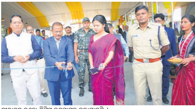
ହାରାକୁଦ ଲକୋ ରିଟ୍ରିଭ୍ ଉଦ୍ଘାଟନ କରାଯାଉଛି ।