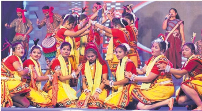
ଛାତ୍ରୀମାନେ ଲୋକନୃତ୍ୟ ପରିବେଷଣ କରୁଛନ୍ତି ।