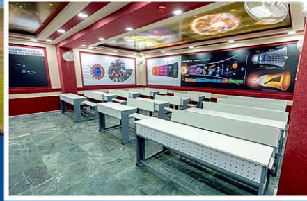
SMART INTERACTIVE CLASSROOMS