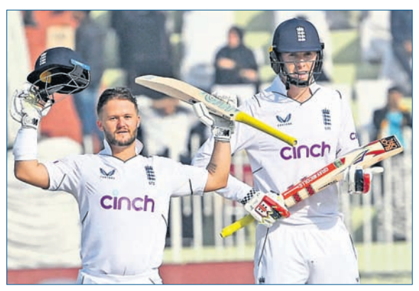
ବୃତ୍ତନ୍ତରୀଣ ଭାଗ୍ୟାଦୀ ଅବସରରେ ଲ୍ୟାକ କ୍ରୁଲି ଓ ବେନ୍ ଡକେଟ୍ ।

ପାକିସ୍ତାନ ବିପକ୍ଷ ପ୍ରଥମ କ୍ରିକେଟ ଟେଷ୍ଟ ମ୍ୟାଚରେ ଭୃତାଣୁ ପ୍ରଭାବିତ ଇଂଲଣ୍ଡ ଆକ୍ରମଣାତ୍ମକ କ୍ରିକେଟ ଖେଳିଛି । ୪ଜଣ ବ୍ୟାଟ୍ସମ୍ୟାନଙ୍କ ଶତକ ସହାୟତାରେ ଦଳ ୫୦୬/୪ ଘୋର କରି ଏକ ବିଶ୍ୱ ରେକର୍ଡ କରିଛି । ଲ୍ୟାକ କ୍ରୁଲି ୧୨୨ ରନ କରିଥିବା ବେଳେ ବେନ୍ ଡକେଟ୍ ୧୦୭ ରନ କରିଛନ୍ତି । ଉଭୟେ ପ୍ରଥମ ଉଇକେଟ ପାର୍ଟନରଶିପ୍ରେ ରୁତ ୨୩୩ ରନ ସଂଗ୍ରହ କରିଛନ୍ତି । ଅନ୍ତିମ ସେସନରେ ଓଲି ପୋପ୍ ଓ ହ୍ୟାରି ବ୍ରୁକ୍ ସେମାନଙ୍କର ଶତକ ହାସଲ କରିଥିଲେ । ଦୁହେଁ ପାକିସ୍ତାନର ଅନଭିକ୍ଷ ବୋଲି ଆକ୍ରମଣକୁ ବେଶାନ୍ତ କରି ରନ ସଂଗ୍ରହ କରିଥିଲେ । ବ୍ୟାଟ୍ ଲାଇଟ ଯୋଗୁ ଗୁରୁବାର କେବଳ ୭୫ ଓଭର ଖେଳ ସମ୍ଭବ ହୋଇଥିଲା । ଇଂଲଣ୍ଡ ବ୍ୟାଟରମାନେ ୬୩