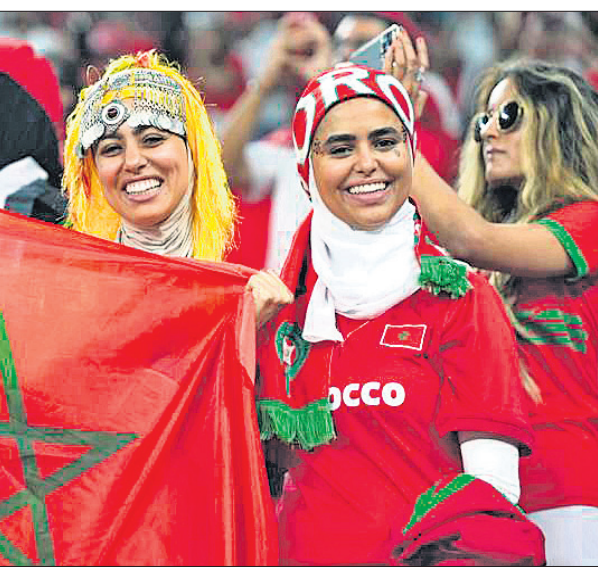
କାନାଡ଼ା ବିପକ୍ଷ ମ୍ୟାଚ ଅବସରରେ ମରକ୍କୋ ପ୍ରଶଂସକ ।

ଘାଲୋନିକ ପରି କୋର୍ ଦୃଢ଼ ନିଶ୍ଚିତ ନେଇଥିବା ଏବଂ ମ୍ୟାଚ ପରେ ଦଳର ପ୍ରଦର୍ଶନ କିପରି ଉନ୍ନତ ହୋଇପାରିବ ତା' ଉପରେ ଧ୍ୟାନ ଦେଇପାରିବ । ପ୍ରଥମାର୍ଦ୍ଧରେ ଆଜେଣ୍ଟିନା ଅନେକ ଷ୍ଟେଟ୍ ପରିସ୍ଥିତି ସୃଷ୍ଟି କରିଥିଲା । ମାତ୍ର ସିଜେସି ଗୋଲ ହେବାକୁ ଦେଇ ନ ଥିଲେ । ତାଙ୍କ ପ୍ରଦର୍ଶନ ଚମତ୍କାର ଥିଲା । ୩୭ତମ ମିନିଟରେ ଲିଓନେଲ ମେସିଙ୍କ ପେନାଲ୍ଟି ଶତକୁ ମଧ୍ୟ ସେ ରୋକି ଦେଇଥିଲେ । ମାତ୍ର ଦ୍ୱିତୀୟାର୍ଦ୍ଧରେ ଆଜେଣ୍ଟିନା ପକ୍ଷରୁ ପକାଯାଇଥିବା ଚାପକୁ ସେ ସମ୍ବଳିପାରି ନ ଥିଲେ ଏବଂ ଗୋଲ ବରଣ କଲେ । ଦ୍ୱିତୀୟାର୍ଦ୍ଧରେ ମ୍ୟାକ୍ ଆଲିଷ୍ଟରଙ୍କ ପ୍ରଥମ ଗୋଲ ଆଜେଣ୍ଟିନାକୁ ଆଶ୍ଚର୍ଯ୍ୟ କରିଥିଲା । ଲୁଲିଆନ ଆଲଭାରେଜଙ୍କ ଦ୍ୱିତୀୟ ଗୋଲ ଦଳର ବିଜୟକୁ ନିଶ୍ଚିତ କରି ଦେଇଥିଲେ । ପୂର୍ବା ରେମ୍‌ଗେରେ ଆଧିପତ୍ୟ ବିସ୍ତାର କରି ଖେଳିଥିବା ଆଜେଣ୍ଟିନା ଅଧିକ ଗୋଲ ଦେଇ ପାରିଥାନ୍ତା, ମାତ୍ର ୨ଟି ଗୋଲ ପରେ ମେସିଙ୍କ ଦଳ ନିଜକୁ ସହଜ ମଣିଥିଲେ । ମେସି କଠିନ ପରିଶ୍ରମ କରୁଛନ୍ତି, ମାତ୍ର ନିଜର ଶ୍ରେଷ୍ଠ ପ୍ରଦର୍ଶନ ଦେଇପାରୁ ନାହାନ୍ତି । ୯୮'୬ ବିଶ୍ୱକପ କଥା ମୋର ମନେ ପଡ଼ୁଛି । ନିଜ ଅଭିଜ୍ଞତାରୁ ଏତିକି କହିପାରିବି ଯେ, ପ୍ରଥମରୁ ଶେଷ ପର୍ଯ୍ୟନ୍ତ ଆଜେଣ୍ଟିନା କେବେ ଫେରାଉଛନ୍ତ ନ ଥିଲା । ପ୍ରଥମ ଗେମ୍ ଲିଟିବା ପରେ ଇଟାଲୀ ସହିତ