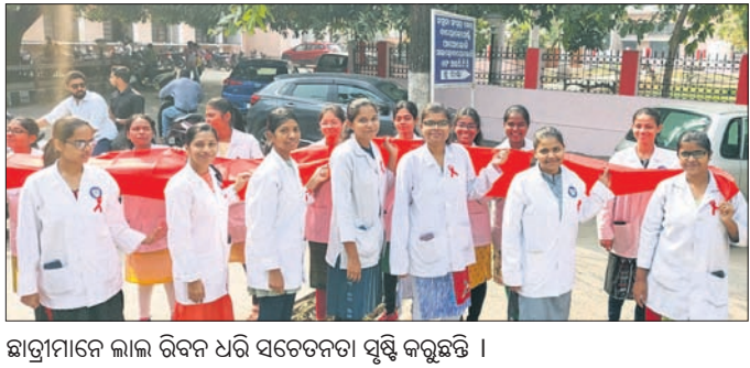
ଛାତ୍ରୀମାନେ ଲାଲ ରିବନ ଧରି ସଚେତନତା ସୃଷ୍ଟି କରୁଛନ୍ତି ।