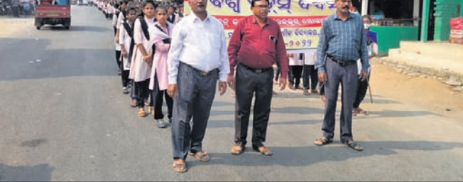
ରାଲିରେ ସାମିଲ ଛାତ୍ରାଛାତ୍ରୀ ଓ ଅନ୍ୟମାନେ।