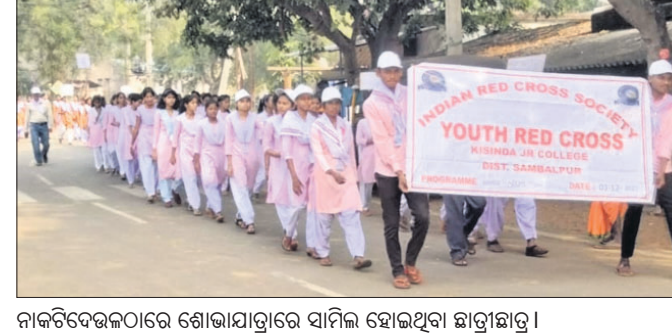
ନାକଟିଦେଉଳଠାରେ ଶୋଭାଯାତ୍ରାରେ ସାମିଲ ହୋଇଥିବା ଛାତ୍ରଛାତ୍ରୀ ।