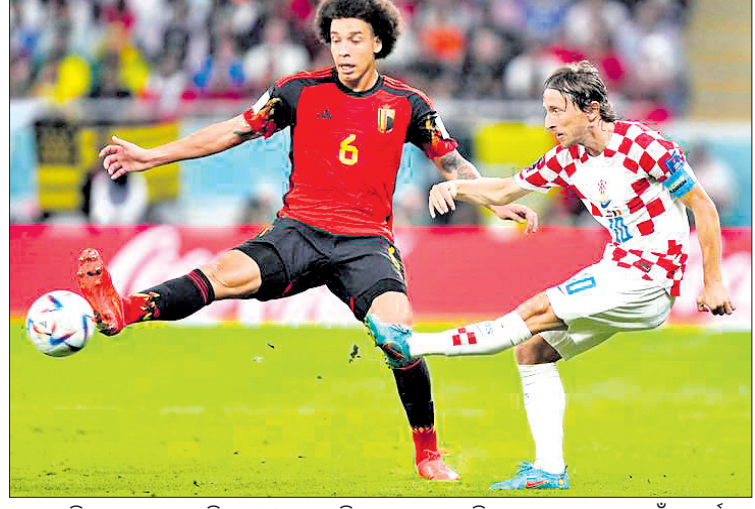
ବେଲଜିୟମର ଆକ୍ସେଲ ଓ ଡ୍ରୋଏସିଆର ଲୁକା ମୋଡ୍ରିକଙ୍କ ମଧ୍ୟରେ ବଲ୍ ପାଇଁ ସଂଘର୍ଷ ।