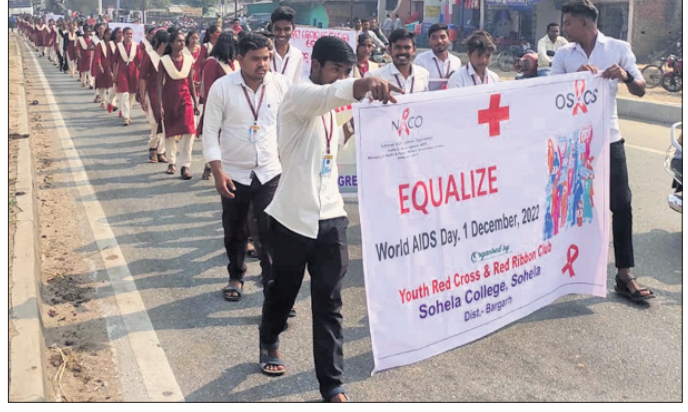
ଛାତ୍ରାଛାତ୍ରୀମାନେ ସଚେତନତା ଶୋଭାଯାତ୍ରାରେ ବାହାରିଛନ୍ତି।