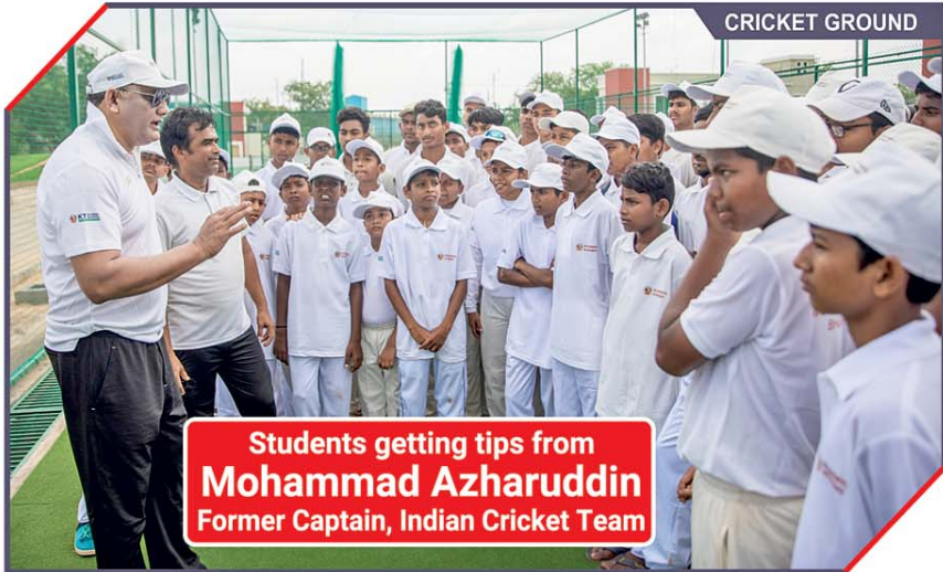
Students getting tips from Mohammad Azharuddin Former Captain, Indian Cricket Team