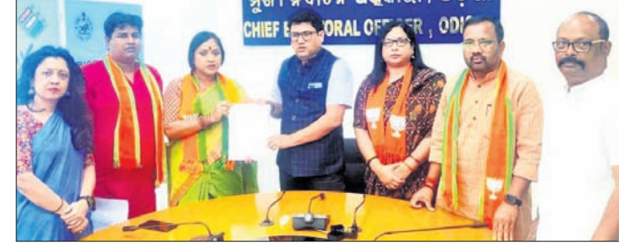
ସିଲିଣ୍ଡର ଭେଙ୍ଗିବାରେ ଭାଜପା ପ୍ରତିନିଧି ଦଳ ଦାବିପତ୍ର ପ୍ରଦାନ କରୁଛନ୍ତି ।

ନିର୍ବାଚନ ପୂର୍ବରୁ ଆଇଆଇସିଙ୍କୁ ଆଣିଛନ୍ତି ମନ୍ତ୍ରୀ