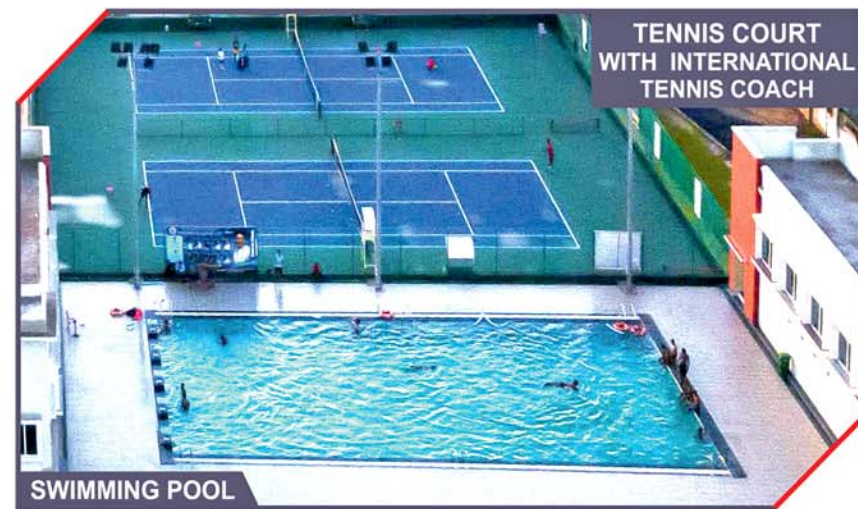
TENNIS COURT WITH INTERNATIONAL TENNIS COACH