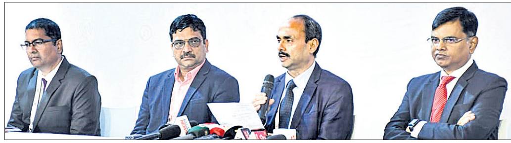
ଶିଳ୍ପ ସଚିବ ହେମନ୍ତ ଶର୍ମା ଓ ଅନ୍ୟମାନେ ମେକ୍-ଇନ୍-ଓଡ଼ିଶା କନଫରେନ୍ସ-୨୦୨୨ର ପ୍ରଥମ ଦିନର କାର୍ଯ୍ୟକ୍ରମ ଓ ଏମ୍ଏସ୍ଏମଇ ପ୍ରଦାନ କରୁଛନ୍ତି।