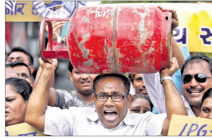
ଦେବାକୁ ଯାଇଥିଲେ । ସଦ୍ୟ ବିବାହ ଜିଲାର ଏକ ପୋଲିଂ ସେକ୍ଟରକୁ କରିଥିବା ଏକ ଯୋଡ଼ି ବୋତାଫ ବ୍ୟାଣ୍ଡ ବାଜା ନେଇ ଯାଇଥିଲେ ।

ଭୁବନେଶ୍ଵରର ପ୍ରଥମ ପର୍ଯ୍ୟାୟ ମତଦାନ ବେଳେ ଗୁରୁବାର ରାସ୍ତା ଗ୍ୟାଙ୍ଗ୍ ପ୍ରତିବାଦର ପ୍ରତୀକ ପାଲଟିଛି । ହୁ ହୁ ହୋଇ ବହୁଥୁବା ବରଦାମ ପ୍ରତିବାଦରେ କେତେଜଣ ଭୋଟର ନିଜ କାନ୍ଧରେ ଗ୍ୟାଙ୍ଗ୍ ସିଲିଣ୍ଡର ବୋହି ଭୋଟ ଦେବାକୁ ଯାଇଥିଲେ ।