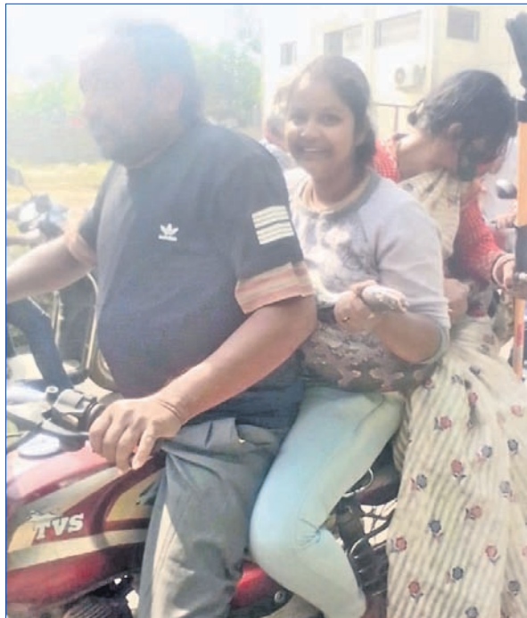
ଅଜଗର ଧରି ବଜାର ବୁଲିଥିବା ସାପଧରାଳି ପରିବାର।