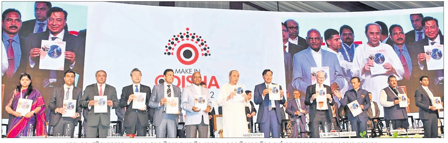
ମେକ୍-ଇନ୍-ଓଡ଼ିଶା କନଫରେନ୍ସ-୨୦୨୨ର ପ୍ରଥମ ଦିନରେ ଆୟୋଜିତ ଟ୍ରେକିଂ ଉପରେ ବିଭିନ୍ନ କାର୍ଯ୍ୟକ୍ରମ ଅବସରରେ ପୁଞ୍ଜିନିବେଶ ନବୀନ ପଟ୍ଟନାୟକ, ଶିଳ୍ପମନ୍ତ୍ରୀ ପ୍ରତାପ ଦେବଙ୍କ ସମେତ ଦେଶର ପ୍ରମୁଖ ଶିଳ୍ପ ସଂସ୍ଥାର ମୁଖ୍ୟମାନଙ୍କ ଉପସ୍ଥିତିରେ ପୁଞ୍ଜି ଉନ୍ମୋଚନ କରାଯାଇଛି।