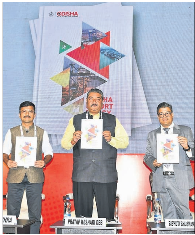
ଓଡ଼ିଶା ଏକ୍ସପୋର୍ଟ ପଲିସି-୨୦୨୨କୁ ଉନ୍ମୋଚନ କରାଯାଇଛି।