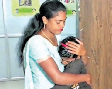
ଶିଶୁ ମଙ୍ଗଳ ସମିତି କାର୍ଯ୍ୟାଳୟରେ ମାଆ ଓ ଝିଅ ।