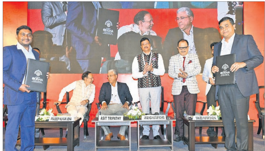
'ଫରେଷ୍ଟ୍ ଏଗ୍ରି ବିକ୍ସନେସ୍ ଏବଂ ଏଗ୍ରି ମାର୍କେଟିଂ ଇକୋ ସିଷ୍ଟମ୍ ଇନ୍ ଓଡ଼ିଶା' ସେଗନରେ ଏମ୍ପ୍ଲୟ୍ ସାକ୍ଷର କରାଯାଇଛି।