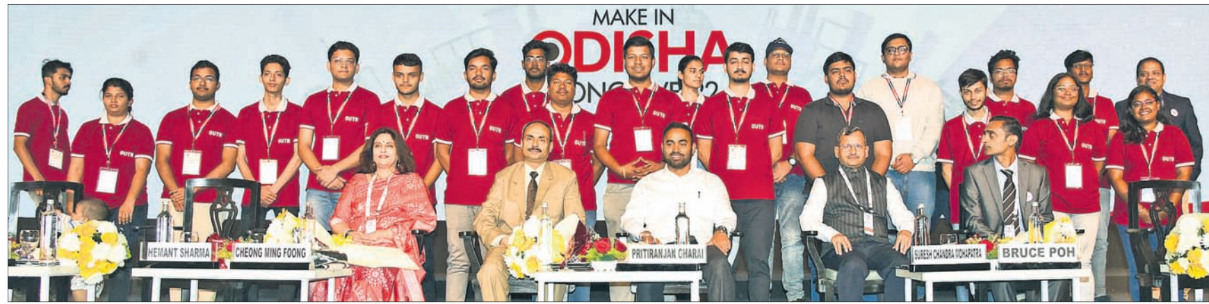
ଦକ୍ଷତା ବିକାଶ କ୍ଷେତ୍ରରେ ଉଲ୍ଲେଖନୀୟ ସଫଳତା ପାଇଁ ପୁରସ୍କୃତ ଛାତ୍ରାଛାତ୍ରୀ ଓ ବିଭାଗୀୟ ମନ୍ତ୍ରୀ ଏବଂ ଅଧିକାରୀ।