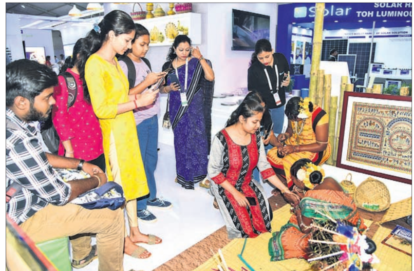
ମେକ୍ ଇନ୍ ଓଡ଼ିଶା କନ୍ଫେରନ୍ସ ସ୍ମାରକଗୁଡ଼ିକୁ ରୁଲି ଦେଖୁଥିବା ଛାତ୍ରାଛାତ୍ରୀ ଓ ଅନ୍ୟମାନେ।