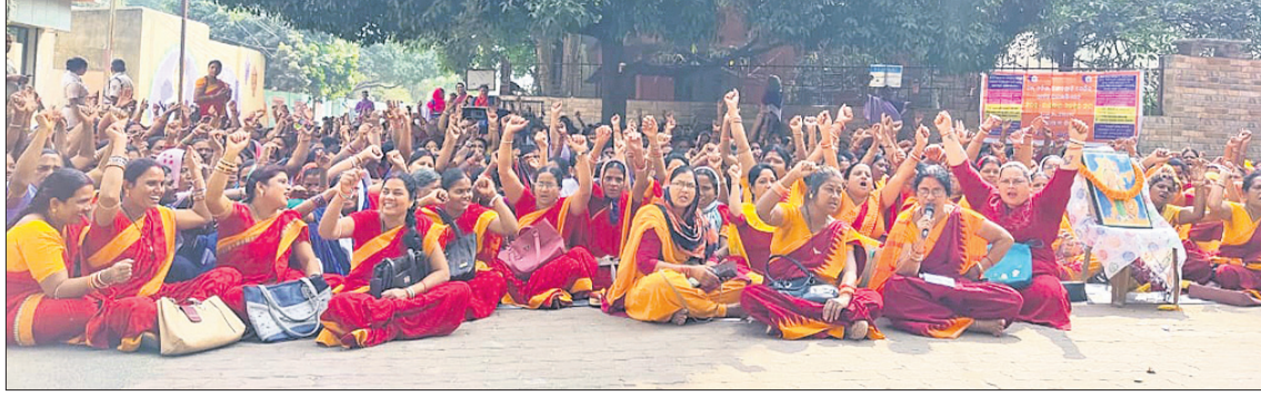
ଜିଲ୍ଲାପାଳଙ୍କ କାର୍ଯ୍ୟାଳୟ ସମ୍ମୁଖରେ ଅଜ୍ଞାନତ୍ରାଡ଼ି କର୍ମଚାରୀମାନେ ଧାରଣାରେ ବସିଛନ୍ତି ।