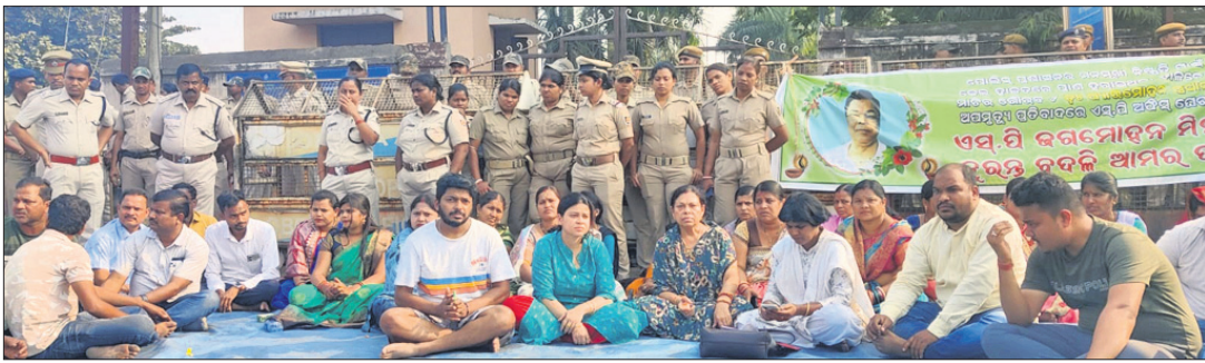
ଅନୁଗୋଳ ଏସ୍ପିକ କାର୍ଯ୍ୟାଳୟକୁ ଯୋରାଉ କରାଯାଇଛି ।