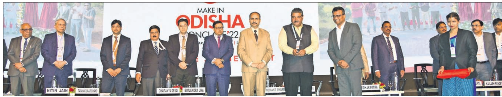
'ଏକ୍ସପୋର୍ଟ ପୋରେନ୍ସିଆଲ୍ ଅଫ୍ ଓଡ଼ିଶା' ଶୀର୍ଷକ ପୂନାରା ସେଗନରେ ଉପସ୍ଥିତ ମନ୍ତ୍ରୀ, ଅଧିକାରୀ ଓ ନିବେଶକମାନେ।