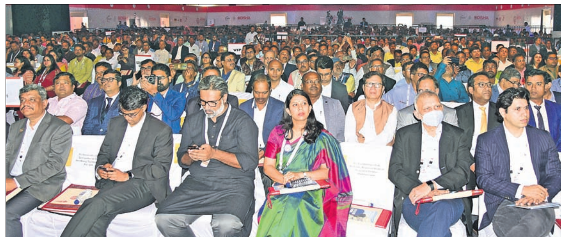
ମେକ୍ ଇନ୍ ଓଡ଼ିଶା କନ୍ଫ୍ରେନ୍ସର ଶୁକ୍ରବାର ଉପସ୍ଥିତ ନିବେଶକ, ବିଭିନ୍ନ କମ୍ପାନୀର ଅଧିକାରୀ, ସରକାରୀ ଅଧିକାରୀ ଓ ଅନ୍ୟମାନେ ।