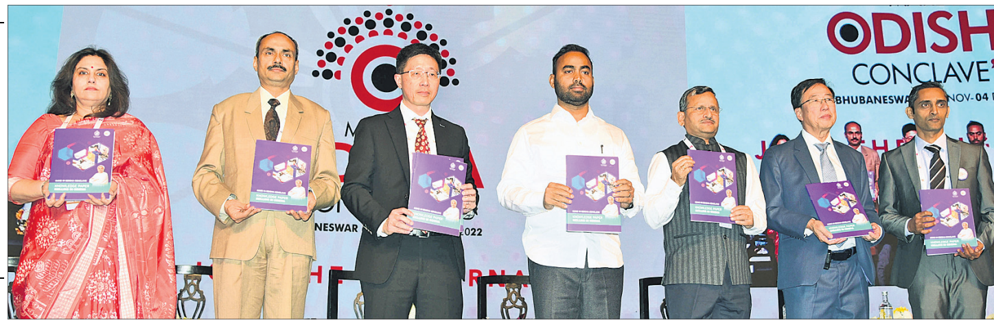
ନଲକ୍ ପେପର୍ 'ସିଲିକ୍ ଇନ୍ ଓଡ଼ିଶା' କୁ ବିଭାଗୀୟ ମନ୍ତ୍ରୀ, ଅଧିକାରୀ ଓ ଅତିଥିମାନେ ଉନ୍ମୋଚନ କରୁଛନ୍ତି ।