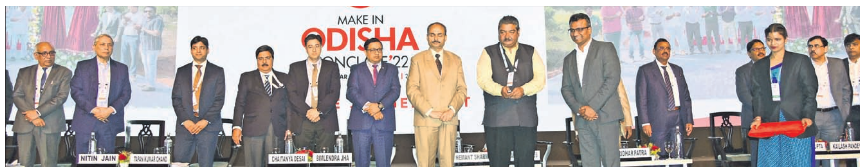
'ଏକ୍ସପୋର୍ଟ ପୋରେନ୍ସିଆଲ୍ ଅଫ୍ ଓଡ଼ିଶା' ଶୀର୍ଷକ ପୁନଃ ଆୟୋଜନର ଉପସ୍ଥିତ ମନ୍ତ୍ରୀ, ଅଧିକାରୀ ଓ ନିବେଶକମାନେ ।