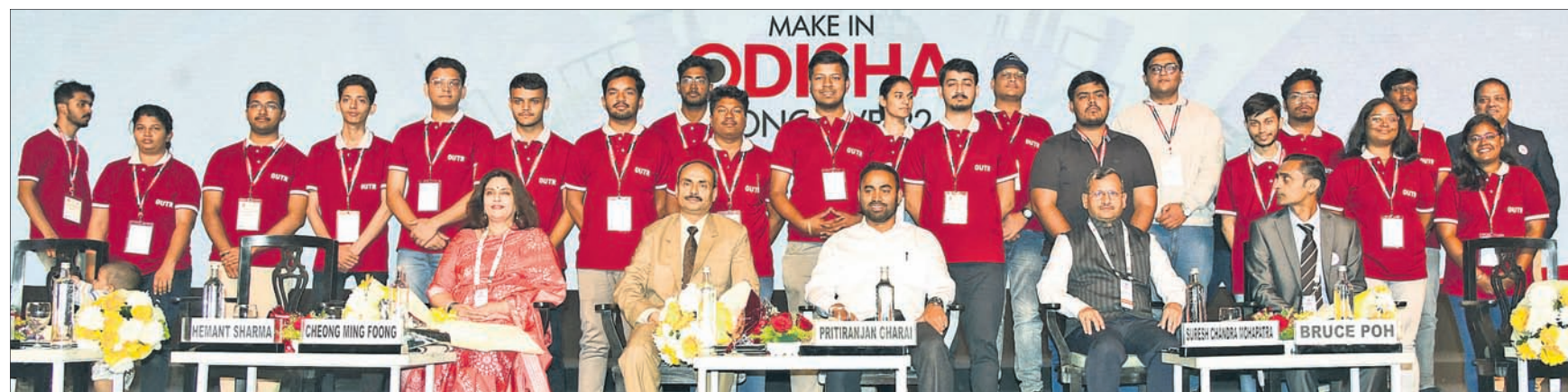
ଦକ୍ଷତା ବିକାଶ କ୍ଷେତ୍ରରେ ଉଲ୍ଲେଖନୀୟ ସଫଳତା ପାଇଁ ପୁରସ୍କୃତ ଛାତ୍ରାଛାତ୍ରୀ ଓ ବିଭାଗୀୟ ମନ୍ତ୍ରୀ ଏବଂ ଅଧିକାରୀ ।