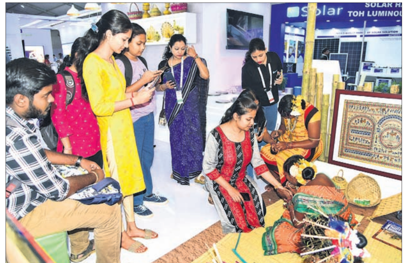
ମେକ୍ ଇନ୍ ଓଡ଼ିଶା କନ୍ଫ୍ରେନ୍ସ ସ୍ଫଳଗୁଡ଼ିକୁ ରୁଚି ଦେଖୁଥିବା ଛାତ୍ରାଛାତ୍ରୀ ଓ ଅନ୍ୟମାନେ ।