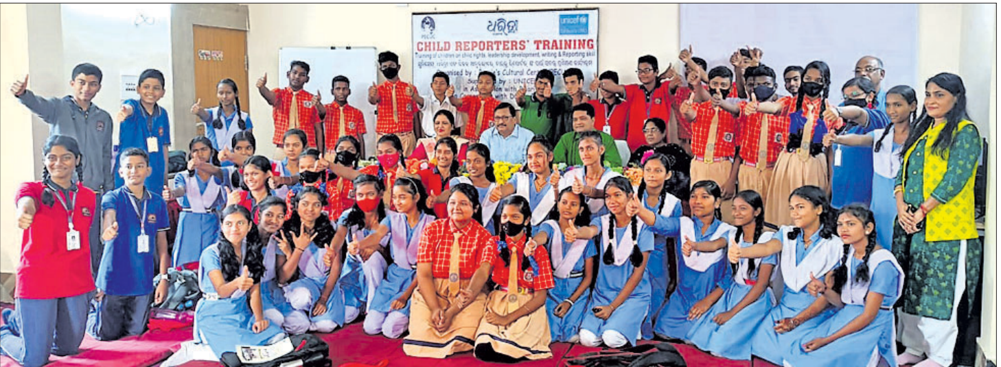
ଦେବଗଡ଼ରେ ଶିଶୁ ସାମ୍ବାଦିକଙ୍କ କର୍ମଶାଳାରେ ଯୋଗଦେଇଥିବା ଛାତ୍ରଛାତ୍ରୀ।

ଦେବଗଡ଼ରେ ଶିଶୁ ସାମ୍ବାଦିକଙ୍କ ତିନିଦିନିଆ କର୍ମଶାଳା ଶୁକ୍ରବାର ଶୁଭାରମ୍ଭ ହୋଇଯାଇଛି। କର୍ମଶାଳାରେ ଦେବଗଡ଼ ଓ ଆଖପାଖ ଅଞ୍ଚଳର ବିଭିନ୍ନ ବିଦ୍ୟାଳୟରୁ ୫୦ ଛାତ୍ରଛାତ୍ରୀ ଯୋଗଦେଇଥିଲେ।