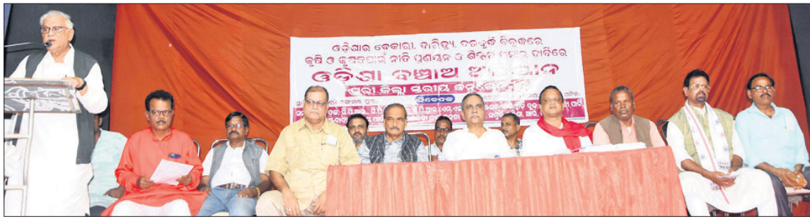
ଓଡ଼ିଶା ବଞ୍ଚା ଅଭିଯାନର ପୁରୀ ଜିଲ୍ଲାସ୍ତରୀୟ କନଭେନସନରେ ଯୋଗଦେଇଥିବା ବିଭିନ୍ନ ଦଳର କର୍ମକର୍ମୀ ।