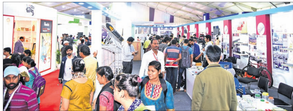
ମେକ୍ ଇନ୍ ଓଡ଼ିଶା କନ୍ଫ୍ରେନ୍ସ ମିଶନ ଶକ୍ତି ଏବଂ ସ୍ମାର୍ଟଅପ୍ ସ୍ଫଳରେ ଭିଡ଼ ।