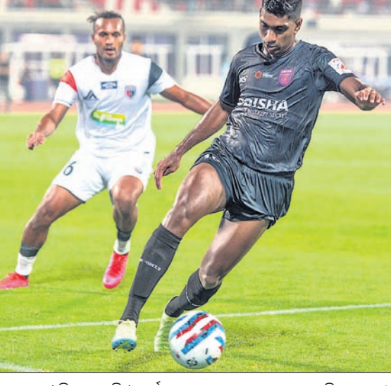
ଶୁକ୍ରବାର ଓଡ଼ିଶା ଏଫସି ଓ ନର୍ଥଲଣ୍ଡ ସ୍କୋଟଲ୍ୟାଣ୍ଡ ମଧ୍ୟରେ ଅନୁଷ୍ଠିତ ମ୍ୟାଚ।

ଭୁବନେଶ୍ୱର, ୨୧୧୨, (ସ୍ପୋର୍ଟ୍ସ ଡେସ୍କ) କଳିଙ୍ଗ ସ୍ଥଳରେ ଓଡ଼ିଶା ଏଫସି(ଏଫସି) ନିଜର ବିଜୟ ଧାରା ବଜାୟ ରଖିଛି।