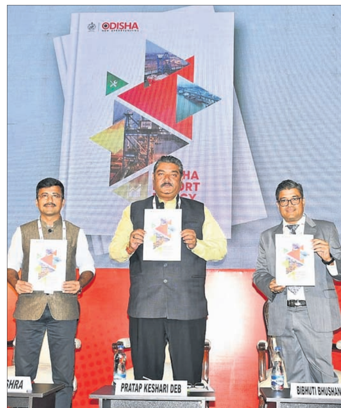
ଓଡ଼ିଶା ଏକ୍ସପୋର୍ଟ ପଲିସି-୨୦୨୨କୁ ଉନ୍ମୋଚନ କରାଯାଇଛି ।