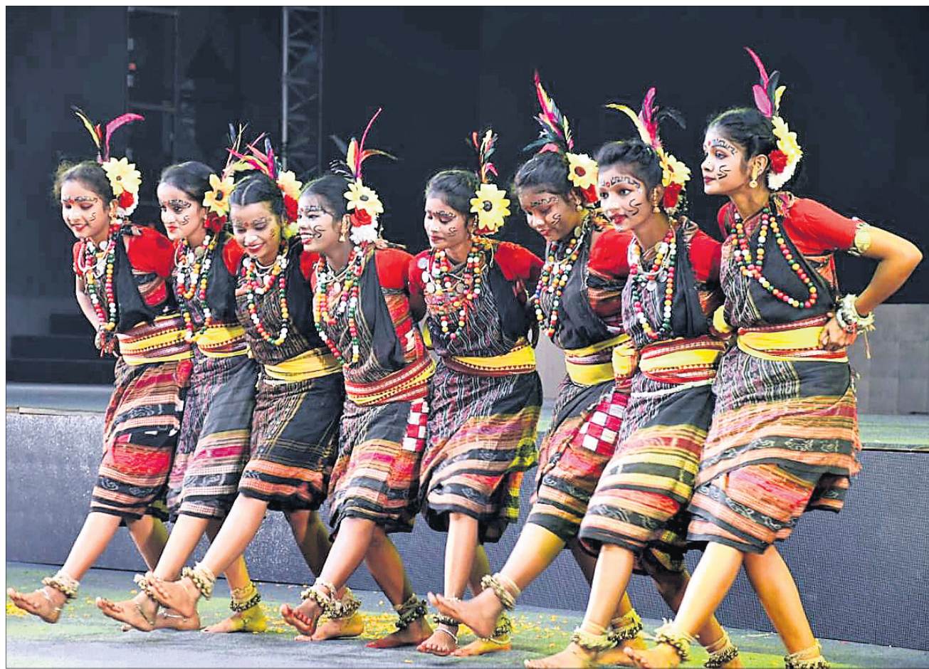
ମେକ୍ ଇନ୍ ଓଡ଼ିଶା କନ୍ଫ୍ରେନ୍ସର ଶୁକ୍ରବାର ପରିବେଷିତ ସମ୍ବଲପୁରୀ ନୃତ୍ୟ ।