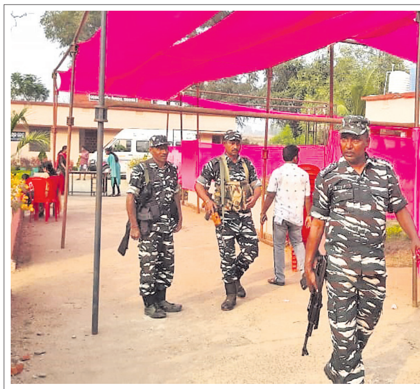
ପଦ୍ମପୁର ଉପନିର୍ବାଚନ ପରିପ୍ରେକ୍ଷାରେ ବରଗଡ଼ ଜିଲ୍ଲା ପାଇକମାଳ ପ୍ରାଥମିକ ବିଦ୍ୟାଳୟରେ ହୋଇଥିବା ପିକ୍ ଚୁଥିରେ ରବିବାର ନେତ୍ରୀମାନଙ୍କୁ ସୁରକ୍ଷା ବଳ ପଠାଯାଇଛି।

ସୁପ୍ରିମକୋର୍ଟରେ ଚ୍ୟାଲେଞ୍ଜ କରିଥିଲେ। ସର୍ବୋଚ୍ଚ ଅଦାଲତରେ ପିଟିଶନ ଶୁଣାଣି ପୂର୍ବରୁ ଦଳରେ ଗୋଷ୍ଠୀ ବିବାଦ ପୁଣିଥରେ ତୀବ୍ର ହୋଇଥିବା ସ୍ପଷ୍ଟ ହୋଇଛି।