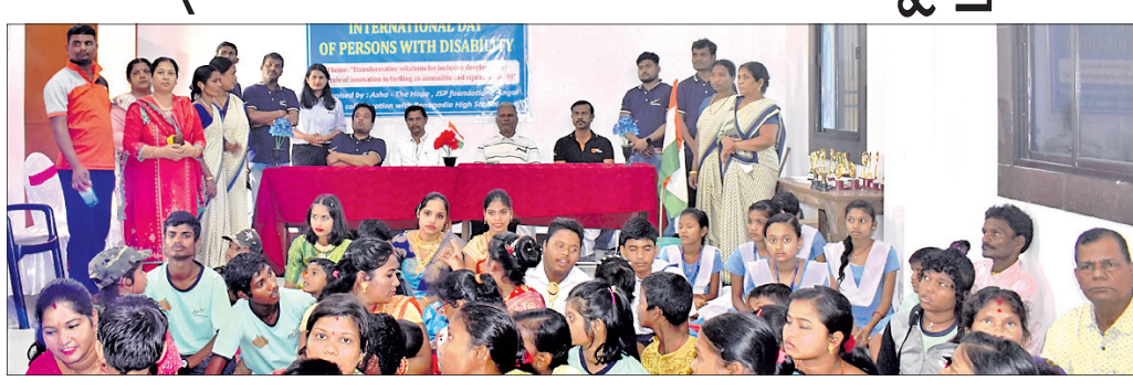
ଅନୁଗୋଳ ଅପିସ, ୪୧୧୨