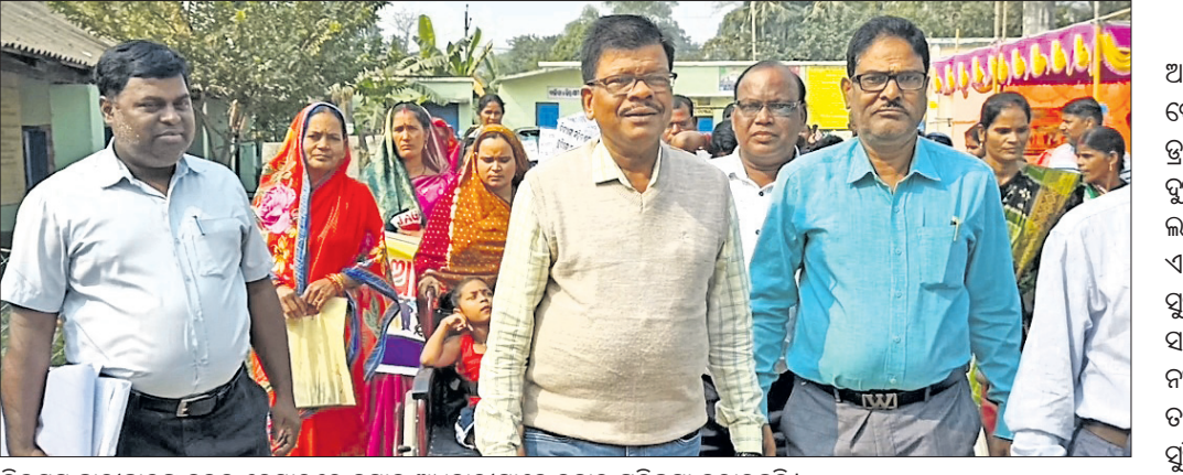
ଭିକ୍ଷମ ଛାତ୍ରଛାତ୍ରୀଙ୍କୁ ହୁଇଲ ଚେୟାରରେ ବସାଇ ଅଧିକାରୀମାନେ ବଜାର ପରିକ୍ରମା କରାଇଛନ୍ତି।