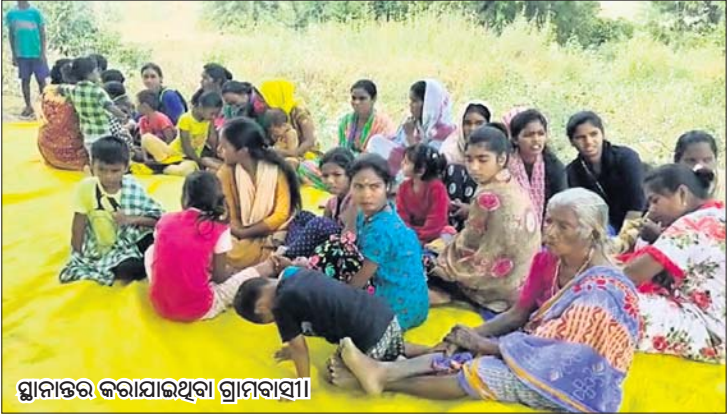
ସ୍ଥାନାନ୍ତର କରାଯାଇଥିବା ଗ୍ରାମବାସୀ।

କଳାହାଣ୍ଡି ଜିଲ୍ଲା ଭବାନୀପାଟଣା-ରାୟପୁର ୧୬୩ ୯ କାର୍ଯ୍ୟ ରାଜପଥର ପାଖରେ ଘଟଣା ଘଟିଥିବା ସମ୍ଭାବନା ରହିଛି। ଘଟଣାରେ ଘଟଣାସ୍ଥଳରେ ଘଟଣା ଘଟିଥିବା ସମ୍ଭାବନା ରହିଛି। ଘଟଣାରେ ଘଟଣାସ୍ଥଳରେ ଘଟଣା ଘଟିଥିବା ସମ୍ଭାବନା ରହିଛି।