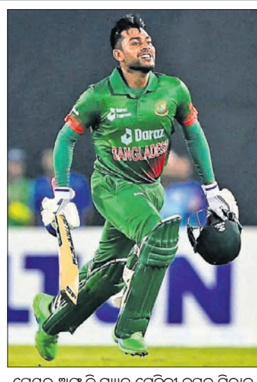
ଫ୍ଲୋୟର ଅର୍ଥ ଦି ମ୍ୟାଚ ମେହିଦୀ ହସନ ମିରାଜ ୪ ଉଲ୍ଟିମେଟ୍ ହରାଇଥିଲା। ତେବେ ଲୋକେଶ ରାହୁଲ ୬୩ ରନର ଦୃଢ଼ ଇନିଂସ ଖେଳିବାରୁ ଭାରତ ୧୮୬ ରନରେ ପହଞ୍ଚିଥିଲା। ୭୦ ବଲର ଇନିଂସରେ ସେ ୫ ଟୋକା ଓ ୪ ଛକା ମାରିଥିଲେ। ବାଲାଦେଶ ପକ୍ଷରୁ ଶାକିବ ୩୬ ରନରେ ୫ ଓ ଇବାଦତ ୪୭ ରନରେ ୪ ଉଲ୍ଟିମେଟ୍ ନେଇଥିଲେ।

ମାରପୁର, ୪୧୨ ବାଲାଦେଶ ବିପକ୍ଷ ଦିନିକିଆ ସିରିଜ୍‌ର ପ୍ରଥମ ମ୍ୟାଚରେ ପରାଜିତ ହୋଇଛି ଭାରତ। ଦଶମ ଉଲ୍ଟିମେଟ୍‌ରେ ମେହିଦୀ ହସନ ମିରାଜ ଓ ମୁସ୍ତାଫିଜୁର ରେହମାନ ୫୧ ରନ ଯୋଡିବା କାରଣରୁ ବାଲାଦେଶ ଏହି ଲୋ ଷୋର୍ଟ୍ ମ୍ୟାଚକୁ ୧ ଉଲ୍ଟିମେଟ୍‌ରେ ଜିତିବା ସହିତ ୧-୦ରେ ଆଗୁଆ ରହିଛି। ଟପ୍ ହାରି ପ୍ରଥମେ ବ୍ୟାଟିଂ କରିଥିବା ଭାରତ ୪୧.୨ ଓଭରରେ ୧୮୬ ରନରେ ଅଲଆଉଟ୍ ହୋଇଥିଲା। ଲୋକେଶ ରାହୁଲ ୬୩ ରନର ଇନିଂସ ଖେଳିଥିବା ବେଳେ ଶାକିବ ଅଲ୍ ହସନ ୫ ଓ ଇବାଦତ ହୋସେନ ୪ ଉଲ୍ଟିମେଟ୍ ନେଇ ଭାରତର ବିପର୍ଯ୍ୟୟ ଘଟାଇଥିଲେ। ଜବାବରେ ବାଲାଦେଶ ୧୩୬ ରନରେ ୯ ଉଲ୍ଟିମେଟ୍‌ରେ ସଫଳତା ପଡିଥିବା ବେଳେ ମେହିଦୀ (୩୮) ଓ ମୁସ୍ତାଫିଜୁର (୧୦) ଦଳକୁ ବିଜୟୀ କରିଥିଲେ। ଟପ୍ ହାରି ବ୍ୟାଟିଂ କରିଥିବା ଭାରତ ପକ୍ଷରୁ ଫୁଲ୍ ଓପନର ରୋହିତ ଶର୍ମା (୨୭) ଓ ଶିଖର ଧାଢ଼ନ (୭) ବଡ଼ ସ୍କୋର କରିବାରେ ବିଫଳ ହୋଇଥିଲେ। ବିରାଟ କୋହଲି (୯) ଓ ଶ୍ରେୟାସ ଆୟର (୨୪) ମଧ୍ୟ ସହଜରେ ଆଉଟ୍ ହେବା କାରଣରୁ ଭାରତ ୯୨ ରନରେ