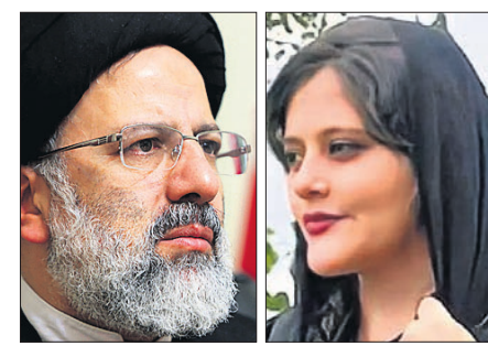
ଇକ୍ରାହିମ ରଇସି ମହସା ଅମିନି

ତେହରାନ, ୪।୧୨ ଦୀର୍ଘ ଅଢ଼େଇ ମାସର ଆନ୍ଦୋଳନ ପରେ ଶେଷରେ ମୁଣ୍ଡ ନୁଆଁଇଛନ୍ତି ଇରାନର ଇକ୍ରାହିମ ରଇସି ସରକାର । ଧର୍ମାତ୍ମ ବ୍ୟାପାରରେ ହସ୍ତକ୍ଷେପ କରୁଥିବା ମୋରାଲିଟି ପୋଲିସ୍ ହାତରେ ମହସା ଅମିନିଙ୍କ ମୃତ୍ୟୁ ପରେ ଦେଶରେ ମୁଣ୍ଡ ଚେକିଥିବା ହିଜାବ ବିରୋଧୀ ଆନ୍ଦୋଳନର ଅନେକ ରାଷ୍ଟ୍ରକୁ ବ୍ୟାପିବା ପରେ ତେହରାନ ଉପରେ ଅନ୍ତର୍ଜାତୀୟ ଚାପ ବଢ଼ିବାରେ ଲାଗିଛି । ଏହାକୁ ଦୃଷ୍ଟିରେ ରଖି ରକ୍ଷି ସରକାରଙ୍କ ସରକାର ରବିବାର ମୋରାଲିଟି ପୋଲିସ୍କୁ ଉଚ୍ଛେଦ କରିବା ସହ ମହିଳାଙ୍କ ଡ୍ରେସ୍ କୋଡ୍ ସମୀକ୍ଷା କରିବା ନେଇ ଘୋଷଣା କରିଛନ୍ତି ।