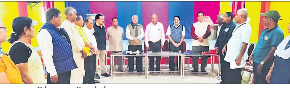
ଜିଲ୍ଲା ଲେଖକ ସଂସଦ ନିର୍ବାଚନରେ ଉପସ୍ଥିତ କର୍ମକର୍ତ୍ତାମାନେ।