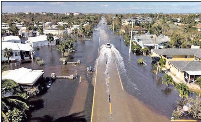
ହୋଇଛି। ଚଳିତବର୍ଷ ବିପର୍ଯ୍ୟୟକଳିତ କ୍ଷତି ସର୍ବାଧିକ ଥିବା ଦେଶ ହେଉଛି ଗତବର୍ଷ ଶକ୍ତିଶାଳୀ ରାଷ୍ଟ୍ର ଆମେରିକା ଚଳିତବର୍ଷ ୧୧୫ ବିଲିୟନ୍ ଡଲାରର କ୍ଷତି ଘଟିଛି। ଏଥିମଧ୍ୟରୁ ମନୁଷ୍ୟକୁଟ ବିପର୍ଯ୍ୟୟ କାରଣରୁ ୨୮ ବିଲିୟନ୍ ଡଲାର କ୍ଷତି ହୋଇଛି।

ବିଶ୍ୱରେ ମନୁଷ୍ୟକୁଟ ଏବଂ ପ୍ରାକୃତିକ ବିପର୍ଯ୍ୟୟ ମାତ୍ରା କ୍ରମାଗତ ବଢ଼ିବାରେ ଲାଗିଛି। ଏହା ଫଳରେ ବହୁ ଧନ କାବନ ନଷ୍ଟ ହେବା ସହିତ ବୈଶ୍ୱିକ ଅର୍ଥନୀତି ମଧ୍ୟ ପ୍ରଭାବିତ ହୋଇଛି। ସୁଇଜରଲ୍ୟାଣ୍ଡର ରିକ୍ତମୁକ୍ତ ଲାଏଓ 'ସୁଇଜ୍ ରେ' ପକ୍ଷରୁ ପ୍ରକାଶିତ ରିପୋର୍ଟ ଅନୁସାରେ, ଚଳିତବର୍ଷ ବୈଶ୍ୱିକ ଅର୍ଥନୀତିକୁ ୨୨୮ ବିଲିୟନ୍ ଡଲାର କ୍ଷତି ସହିବାକୁ ପଡ଼ିଛି। ବାତ୍ୟା ବ୍ୟତୀତ ଯୁଦ୍ଧୋପରେ ଖୁବ୍ ସମ୍ପର୍କିତ, ଅଷ୍ଟ୍ରେଲିଆ ଏବଂ ସାଉଦି ଆରାବିଆରେ ବନ୍ୟା, ଫ୍ରାନ୍ସରେ ପ୍ରବଳ ଭୂକମ୍ପ ଆଦି ପ୍ରକଳ ବର୍ଷା ଯୋଗୁ ବିଶ୍ୱର ସବୁଠାରୁ ଶକ୍ତିଶାଳୀ ରାଷ୍ଟ୍ର ଆମେରିକା ଚଳିତବର୍ଷ ୧୧୫ ବିଲିୟନ୍ ଡଲାରର କ୍ଷତି ଘଟିଛି। ଏଥିମଧ୍ୟରୁ ମନୁଷ୍ୟକୁଟ ବିପର୍ଯ୍ୟୟ କାରଣରୁ ୨୮ ବିଲିୟନ୍ ଡଲାର କ୍ଷତି ହୋଇଛି। ଚଳିତବର୍ଷ ବିପର୍ଯ୍ୟୟକଳିତ କ୍ଷତି ସର୍ବାଧିକ ଥିବା ଦେଶ ହେଉଛି ଗତବର୍ଷ ଶକ୍ତିଶାଳୀ ରାଷ୍ଟ୍ର ଆମେରିକା ଚଳିତବର୍ଷ ୧୧୫ ବିଲିୟନ୍ ଡଲାରର କ୍ଷତି ଘଟିଛି। ଏଥିମଧ୍ୟରୁ ମନୁଷ୍ୟକୁଟ ବିପର୍ଯ୍ୟୟ କାରଣରୁ ୨୮ ବିଲିୟନ୍ ଡଲାର କ୍ଷତି ହୋଇଛି। ଚଳିତବର୍ଷ ବିପର୍ଯ୍ୟୟକଳିତ କ୍ଷତି ସର୍ବାଧିକ ଥିବା ଦେଶ ହେଉଛି ଗତବର୍ଷ ଶକ୍ତିଶାଳୀ ରାଷ୍ଟ୍ର ଆମେରିକା ଚଳିତବର୍ଷ ୧୧୫ ବିଲିୟନ୍ ଡଲାରର କ୍ଷତି ଘଟିଛି। ଏଥିମଧ୍ୟରୁ ମନୁଷ୍ୟକୁଟ ବିପର୍ଯ୍ୟୟ କାରଣରୁ ୨୮ ବିଲିୟନ୍ ଡଲାର କ୍ଷତି ହୋଇଛି।