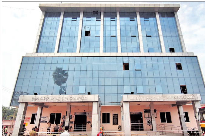
ପ୍ରଥମେ ପଞ୍ଜୀକରଣ ପରେ ଯାଡ଼ିରେ ହିଁ ଡାକ୍ତର କେଲ ଘଣ୍ଟାର ପ୍ରତୀକ୍ଷା। ଆଉ ଶେଷରେ ଯନ୍ତ୍ରଣା ଜଟିଳ ଶରୀର ସହ ହତାଶରେ ଫେରୁବାକୁ ପଡ଼ୁଛି ଅନେକ ରୋଗୀକୁ।