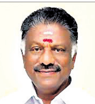
ଓ. ପିନାରସେଲଭାମ୍ ତେଲୁଗା, ୪ ଡିସେମ୍ବର