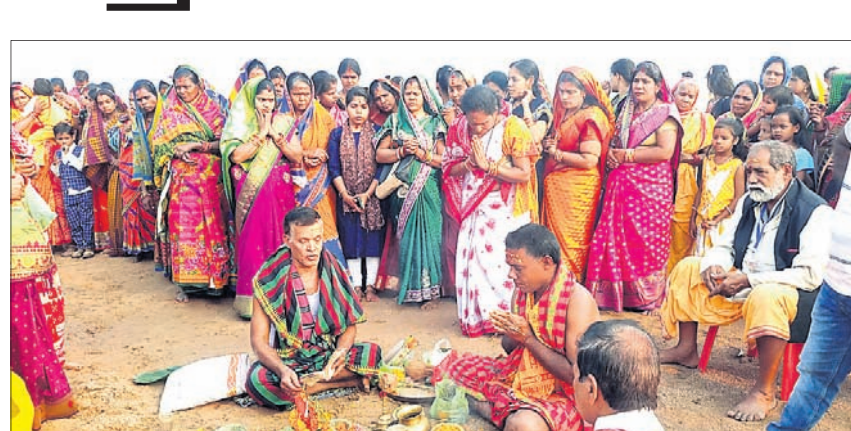
ବ୍ରାହ୍ମଣୀ ତଟରେ ବନ୍ଦାପନା ଓ ପୂଜାର୍ଚ୍ଚନା।