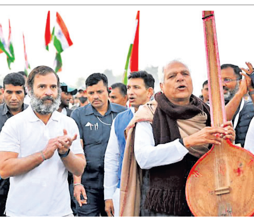
ରାହୁଲ ଗାନ୍ଧୀଙ୍କ ନେତୃତ୍ୱରେ କଂଗ୍ରେସର ଭାରତ ଯୋତା ଯାତ୍ରା ରବିବାର ସନ୍ଧ୍ୟାରେ ରାଜସ୍ଥାନରେ ପ୍ରବେଶ କରିଛି।