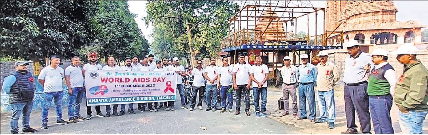
ସେଣ୍ଟ୍ରାଲ ଖର୍ଚ୍ଚଶାସ୍ତ୍ର କଲୋନାସ୍ଥିତ ଜଗନ୍ନାଥ ମନ୍ଦିର ସମ୍ମୁଖସ୍ଥ ବାହାରିଥିବା ଶୋଭାଯାତ୍ରାରେ ସାମିଲ ସଦସ୍ୟମାନେ।