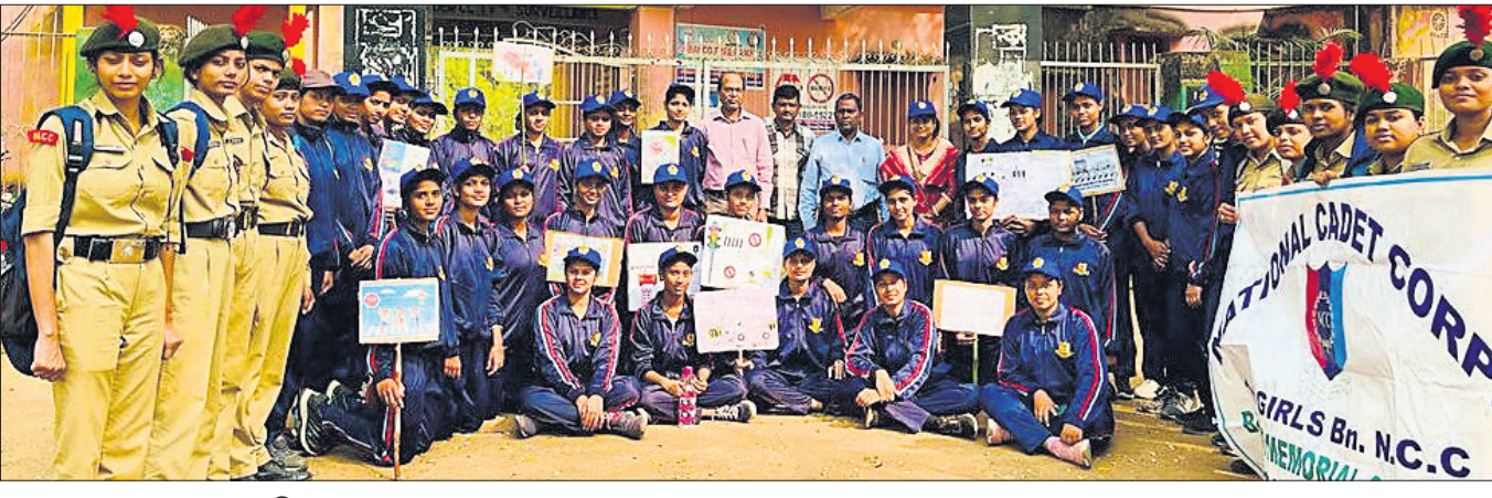
ସଚେତନତା ଶୋଭାଯାତ୍ରାରେ ସାମିଲ ଛାତ୍ରଛାତ୍ରୀମାନେ।

ରହିଛି। କମ୍ପ୍ୟୁଟର ଶିକ୍ଷାଦାନ ସହିତ ବ୍ରେଲି ଲେଟର ଶିକ୍ଷା, ଟେଲିଭିଜନ ମାଧ୍ୟମରେ ଶିକ୍ଷା ଓ ଭୌତିକ ଚିକିତ୍ସା ପରି ଅନେକ ପ୍ରକାରର ସୁବିଧା ଯୋଗାଇ ଦିଆଯାଇଛି। ଅଭିଭାବକମାନଙ୍କୁ ମଧ୍ୟ ସଚେତନ କରାଯିବାର ବ୍ୟବସ୍ଥା ରହିଛି। କାର୍ଯ୍ୟକ୍ରମରେ ସମସ୍ତ ବିଭାଗୀୟ ଅଧିକାରୀ ଓ ଭିକ୍ଷମ ଛାତ୍ରଛାତ୍ରୀ, ଅଭିଭାବକ ଯୋଗ ଦେଇଥିଲେ।