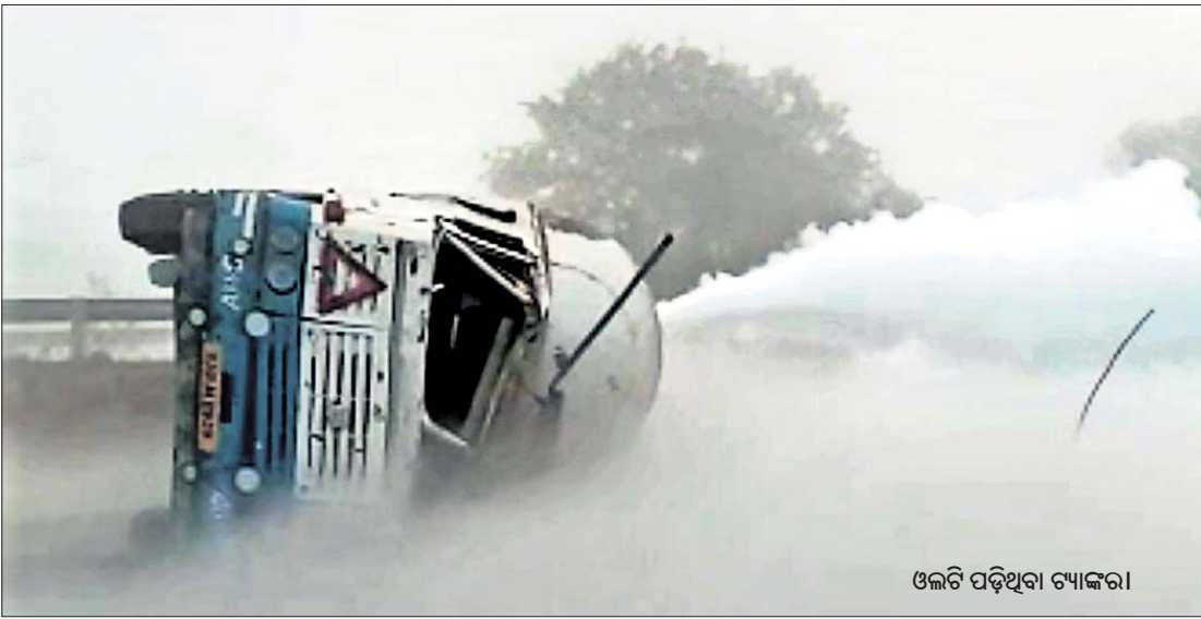
ଓଲଟି ପଡ଼ିଥିବା ଟ୍ୟାଙ୍କର।

କଳାହାଣ୍ଡି ଜିଲ୍ଲା ଭବାନୀପାଟଣା-ରାୟପୁର ୧୬୩ ୯ କାର୍ଯ୍ୟ ରାଜପଥର ପାଖରେ ଘଟଣା ଘଟିଥିବା ସମ୍ଭାବନା ରହିଛି। ଘଟଣାରେ ଘଟଣାସ୍ଥଳରେ ଘଟଣା ଘଟିଥିବା ସମ୍ଭାବନା ରହିଛି। ଘଟଣାରେ ଘଟଣାସ୍ଥଳରେ ଘଟଣା ଘଟିଥିବା ସମ୍ଭାବନା ରହିଛି।