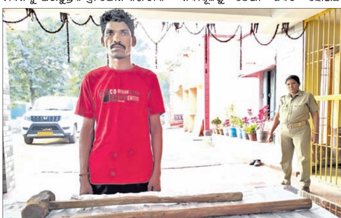
ଗିରଫ ଅଭିଯୁକ୍ତ ଓ ଜବତ ହୋଇଥିବା ହାମର, ଠେଙ୍ଗା।