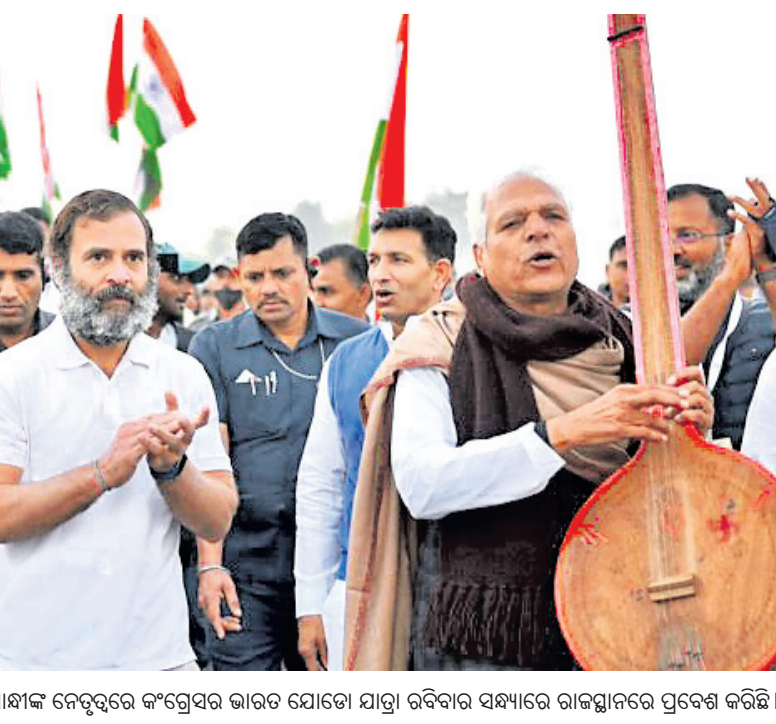
ରାହୁଲ ଗାନ୍ଧୀଙ୍କ ନେତୃତ୍ଵରେ କଂଗ୍ରେସର ଭାରତ ଯୋଡ଼ୋ ଯାତ୍ରା ରବିବାର ସନ୍ଧ୍ୟାରେ ରାଜସ୍ଥାନରେ ପ୍ରବେଶ କରିଛି।