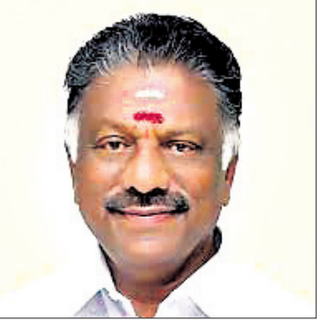
ଓ. ପିନାରସେଲଭାନ ତେଲୁଗୁ, ୪/୧୨