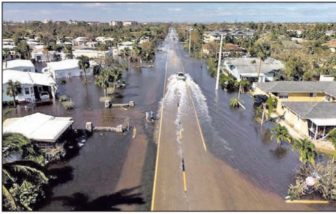
ହୋଇଛି। ଚଳିତବର୍ଷ ବିପର୍ଯ୍ୟୟଜନିତ ଅତି ପ୍ରବଳ ବର୍ଷା ଯୋଗୁ ବିଶ୍ୱର ସବୁଠୁ ଶକ୍ତିଶାଳୀ ରାଷ୍ଟ୍ର ଆମେରିକା ଚଳିତବର୍ଷ ୧୧୪ ବିଲିୟନ୍ ଡଲାରର କ୍ଷତି ଘଟିଛି।

ବିଶ୍ୱରେ ମନୁଷ୍ୟକୃତ ଏବଂ ପ୍ରାକୃତିକ ବିପର୍ଯ୍ୟୟ ମାତ୍ରା କ୍ରମାଗତ ବଢ଼ିବାରେ ଲାଗିଛି। ଏହା ଫଳରେ ବହୁ ଧନ କାହାନ୍ତି ନଷ୍ଟ ହେବା ସହିତ ବୈଶ୍ୱିକ ଅର୍ଥନୀତି ମଧ୍ୟ ପ୍ରଭାବିତ ହୋଇଛି।