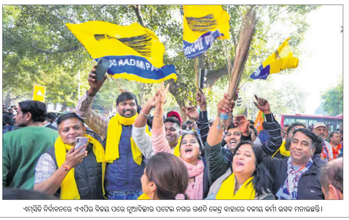
ଏମ୍‌ପିଟି ନିର୍ବାଚନରେ ଏଏପିର ବିଜୟ ପରେ ନୂଆଦିଲ୍ଲୀର ପଡ଼େଲ ନଗର ଗଣତି କେନ୍ଦ୍ର ବାହାରେ ଦଳୀୟ କର୍ମୀ ଉତ୍ସବ ମନାଉଛନ୍ତି।