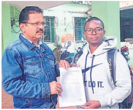
ବିଡ଼ିଓ ଶିକ୍ଷାକ ପାତ୍ର ସହାୟତା ରାଶି ସମ୍ପର୍କିତ ଚିଠି ଇଫୁଙ୍କୁ ପ୍ରଦାନ କରୁଛନ୍ତି।

ଡାକ୍ତରୀ ପାଠପଢ଼ା ପିଁ ଦେବାକୁ ଧାନ କାର୍ଯ୍ୟକ୍ରମ, ଦିନ ମୂଲ୍ୟ ଆଦି ଦେବାକୁ ବି ଲାଗୁଛି। କନ୍ୟାମାନଙ୍କୁ ଲାଭ କରିବା ପାଇଁ ଡାକ୍ତରୀ ପାଠପଢ଼ା ପାଇଁ ଖର୍ଚ୍ଚ ଦେବାକୁ ସରକାରୀ ପକ୍ଷରୁ ଆବେଦନ କରାଯାଇଛି। ଏହି ଡାକ୍ତରୀ ପାଠପଢ଼ା ପାଇଁ ଖର୍ଚ୍ଚ ଦେବାକୁ ସରକାରୀ ପକ୍ଷରୁ ଆବେଦନ କରାଯାଇଛି। ଏହି ଡାକ୍ତରୀ ପାଠପଢ଼ା ପାଇଁ ଖର୍ଚ୍ଚ ଦେବାକୁ ସରକାରୀ ପକ୍ଷରୁ ଆବେଦନ କରାଯାଇଛି।