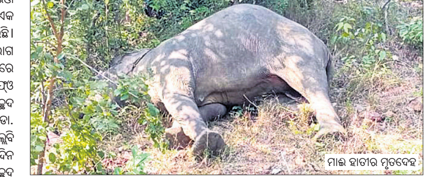
ମାଲି ହାତୀର ମୃତଦେହ

ଏହାସହ ହାତୀର ବୟସ ୨୫ରୁ ୩୦ବର୍ଷ ମିଶ୍ର ଘଟଣାସ୍ଥଳ ପରିଦର୍ଶନ କରି ସମାଧାନ ହେବ ବୋଲି ଡିଏଫ୍‌ଓ ନାମାୟର ସୂଚନା କରିଥିଲେ।