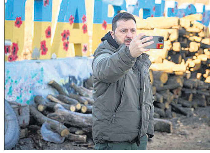
ୟୁକ୍ରେନ୍ ରାଷ୍ଟ୍ରପତି ଭୋଲୋଡିମିର ଜେଲେନ୍ସ୍କି ଡୋନେଟ୍ସ୍କର ସ୍ୱେଡ଼ିଶ ସହରରେ ସୈନ୍ୟଙ୍କୁ ଅଭିନନ୍ଦନ ଜଣାଇବା ପାଇଁ ନିଜ ମୋବାଇଲରେ ଭିଡିଓ ଗ୍ରହଣ କରୁଛନ୍ତି।

ଚଳିତବର୍ଷ ଚାଇନା ମାଗାଜିନ୍ ୟୁକ୍ରେନ୍ ରାଷ୍ଟ୍ରପତି ଭୋଲୋଡିମିର ଜେଲେନ୍ସ୍କିଙ୍କୁ 'ଦ ସ୍ଥିରତ୍ ଅଫ୍ ୟୁକ୍ରେନ୍' ଚାଇନା ପ୍ରଦାନ କରିଛି। ୟୁକ୍ରେନ୍ ଉପରେ ରୁଷିଆର ଆକ୍ରମଣ ପରଠୁ ସେ ଦୃଢ଼ତାର ସହିତ ଏହାର ମୁକାବିଲା କରିଛନ୍ତି। ପ୍ରତ୍ୟେକ ଦିନ ଜେଲେନ୍ସ୍କି ଦେଶବାସୀଙ୍କୁ ସମୋଧାନ କରି ତାଙ୍କ ମନୋବଳ ବଢ଼ାଇବାରେ ଲାଗିଥିବା ଚାଇନା ପୁସ୍ତକ ଉପରେ ଫୋକସ୍ ଦେଇଛନ୍ତି। ଫେବୃୟାରୀ ୨୪ରେ ରୁଷିଆ ପକ୍ଷ ୟୁକ୍ରେନ୍ ଉପରେ ଆକ୍ରମଣ କରିବା ପରଠାରୁ ପ୍ରତ୍ୟେକ ୟୁକ୍ରେନୀୟ ମନରେ ଆଶା ଓ ତରଳ ମିଶ୍ରିତ ଅନୁଭୂତିରେ ଏହାର ମୁକାବିଲା କରିବାରେ ଲାଗିଛନ୍ତି, ଯାହା ଜେଲେନ୍ସ୍କିଙ୍କ ନେତୃତ୍ୱ ପାଇଁ