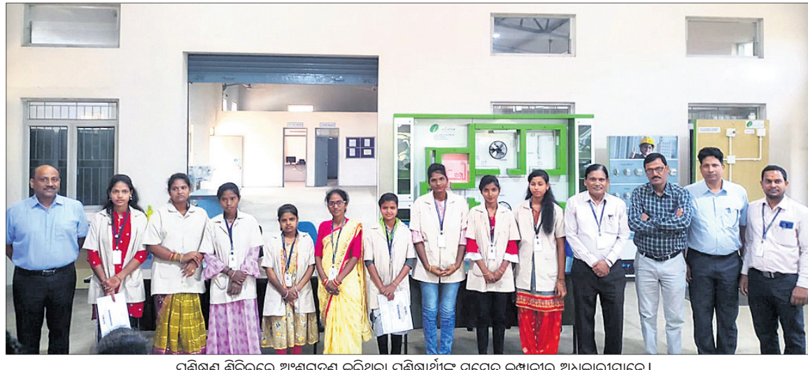
ପ୍ରଶିକ୍ଷଣ ଶିବିରରେ ଅଂଶଗ୍ରହଣ କରିଥିବା ପ୍ରଶିକ୍ଷାଥୀଙ୍କ ସମେତ କମ୍ପାନୀର ଅଧିକାରୀମାନେ।

ଘର କଞ୍ଚାଳ ଭିତରେ ସାମିତ ରହିଯାଇଥିଲା ସେମାନଙ୍କ ଜୀବନ। ଅବସର ସମୟର କିଛି ଠିକଣା ଉପଯୋଗ କରାଯାଏ, ତାହାର କୌଶଳ ଜଣା ନ ଥିଲା। ଫଳରେ ବସି ବସି କଟିଯାଉଥିଲା ସାଧାରଣ ଗ୍ରାମୀଣ ମହିଳାଙ୍କ ଦକ୍ଷତା ବୃଦ୍ଧି କରି ରୋଜଗାରକ୍ଷମ କରାଇବା ଲାଗି ଯେବେଠାରୁ ନବ ଲିମିଟେଡ୍ କମ୍ପାନୀ ପ୍ରୟାସ ଆରମ୍ଭ କଲା, ସେବେଠାରୁ ବଦଳିଯାଇଛି ଅନେକଙ୍କ ଜୀବନଶୈଳୀ। ସିଲେଇ ପ୍ରଶିକ୍ଷଣ ମାଧ୍ୟମରେ ବହୁ ମହିଳା, ଯୁବକ ଖୋଜି ପାଇଛନ୍ତି ରୋଜଗାରର ବାଟ। ଘରର ଦାୟିତ୍ୱ ତୁଲାଇବା ସହ ସେମାନେ ଏବେ ହୋଇପାରିଛନ୍ତି ସ୍ୱାବଲମ୍ବୀ।