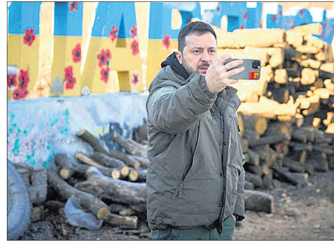
ୟୁକ୍ରେନ୍ ରାଷ୍ଟ୍ରପତି ଭୋଲୋଡିମିର ଜେଲେନ୍ସ୍କି ଡୋନେଟ୍ସ୍କର ସ୍ୱେଚିଆନ୍ସ୍କ ସହରରେ ସୈନ୍ୟଙ୍କୁ ଅଭିନନ୍ଦନ ଜଣାଇବା ପାଇଁ ନିଜ ମୋବାଇଲରେ ଛିଡ଼ି ଗୁଡ଼ି କରୁଛନ୍ତି।

ଚଳିତବର୍ଷ ଚାଇନା ମାଗାଜିନ୍ ୟୁକ୍ରେନ୍ ରାଷ୍ଟ୍ରପତି ଭୋଲୋଡିମିର ଜେଲେନ୍ସ୍କିଙ୍କୁ 'ଦ ସ୍ଥିରତ୍ ଅଫ୍ ୟୁକ୍ରେନ୍' ଚାଇନା ପ୍ରଦାନ କରିଛି। ୟୁକ୍ରେନ୍ ଉପରେ ରୁଷିଆର ଆକ୍ରମଣ ପରଠୁ ସେ ଦୃଢ଼ତାର ସହିତ ଏହାର ମୁକାବିଲା କରିଛନ୍ତି। ପ୍ରତ୍ୟେକ ଦିନ ଜେଲେନ୍ସ୍କି ଦେଶବାସୀଙ୍କୁ ସମୋଧାନ କରି ତାଙ୍କ ମନୋବଳ ବଢ଼ାଇବାରେ ଲାଗିଥିବା ଚାଇନା ପୁସ୍ତକ ଇତିହାସିକ ଡକ୍ଟର ଫେଡ଼େରା ୨୪ରେ ରୁଷିଆ ପକ୍ଷ ୟୁକ୍ରେନ୍ ଉପରେ ଆକ୍ରମଣ କରିବା ପରଠାରୁ ପ୍ରତ୍ୟେକ ୟୁକ୍ରେନୀୟ ମନରେ ଆଶା ଓ ତରଳ ମିଶ୍ରିତ ଅନୁଭୂତିରେ ଏହାର ମୁକାବିଲା କରିବାରେ ଲାଗିଛନ୍ତି, ଯାହା ଜେଲେନ୍ସ୍କିଙ୍କ ନେତୃତ୍ୱ ପାଇଁ