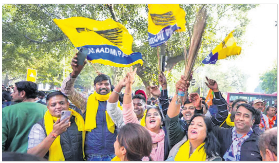
ଏମ୍ପାଏ ନିର୍ବାଚନରେ ଏଏପିର ବିଜୟ ପରେ ନୂଆଦିଲ୍ଲୀର ପଡେଲ ନଗର ଗଣତି କେନ୍ଦ୍ର ବାହାରେ ଦକାୟ କର୍ମୀ ଉତ୍ସବ ମନାଉଛନ୍ତି।