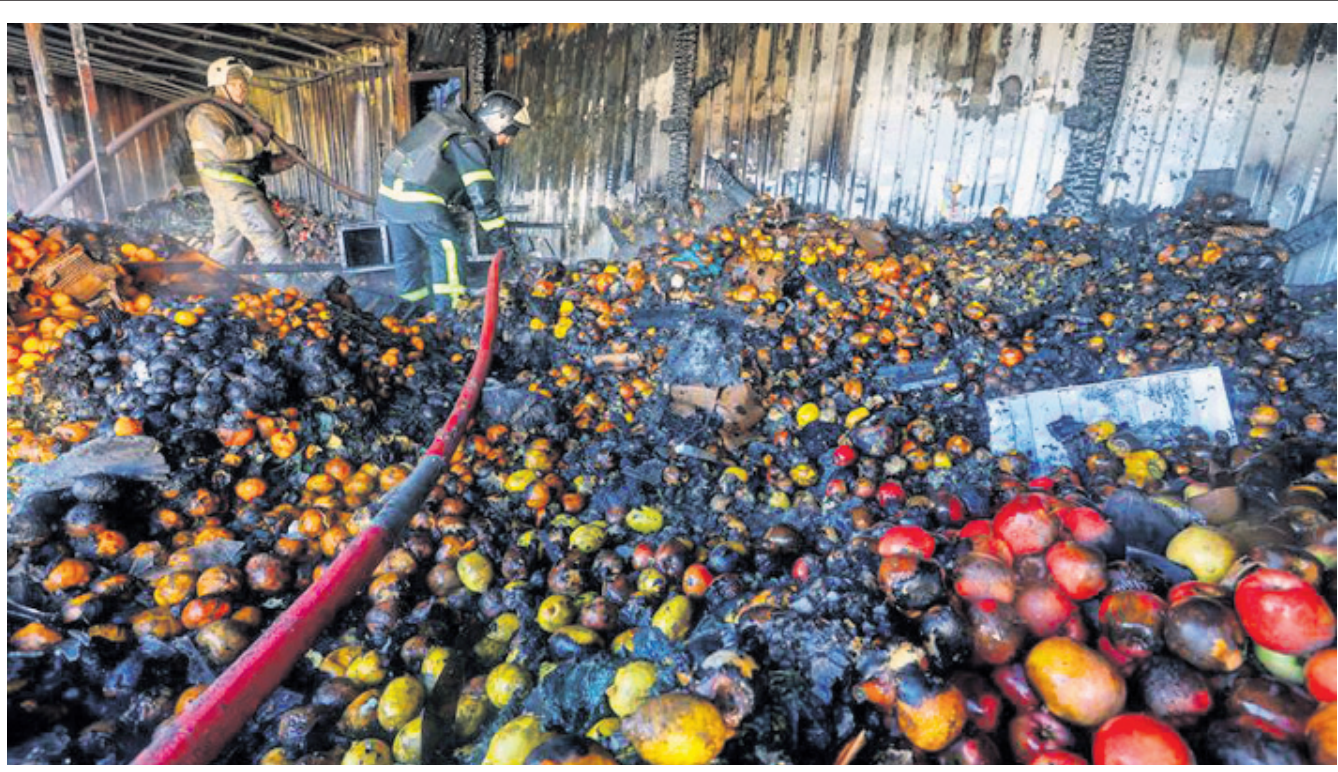
ମଧ୍ୟାହ୍ନ ନିୟନ୍ତ୍ରଣରେ ଥିବା ୟୁକ୍ରେନ୍ ଡୋନେଟ୍ସ୍କର ଏକ ଫଳ ଗୋଦାନ ରୁଷୀୟ ସୈନ୍ୟଙ୍କ ମିଶାଇଲ ମାଡ଼ରେ ଜଳିଯାଇଛି।