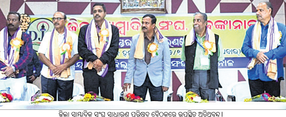
ଜିଲ୍ଲା ସାଧାଦିକ ସଂଘ ସାଧାରଣ ପରିଷଦ ବୈଠକରେ ଉପସ୍ଥିତ ଅତିଥିମାନେ।