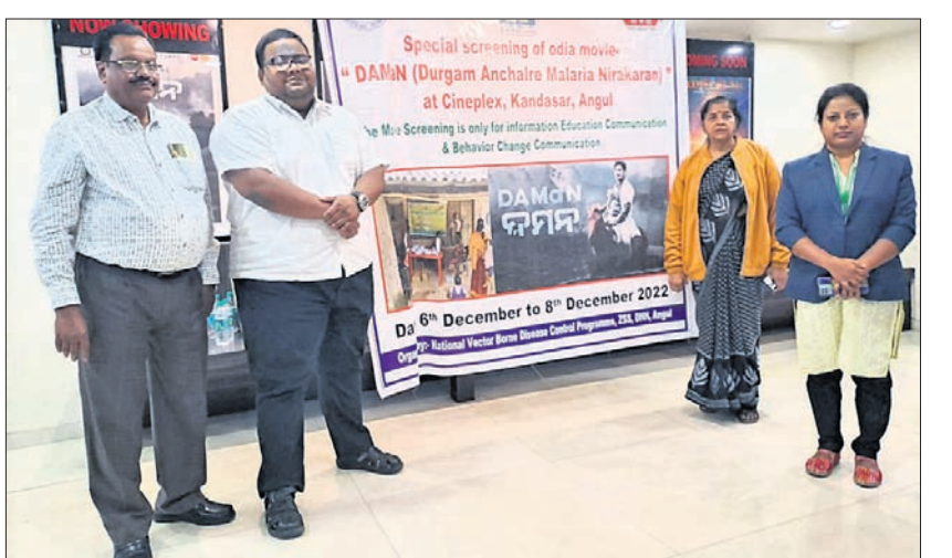
ପ୍ରେକ୍ଷାଳୟରେ ଜିଲ୍ଲାପାଳଙ୍କ ସମେତ ଅନ୍ୟମାନେ।