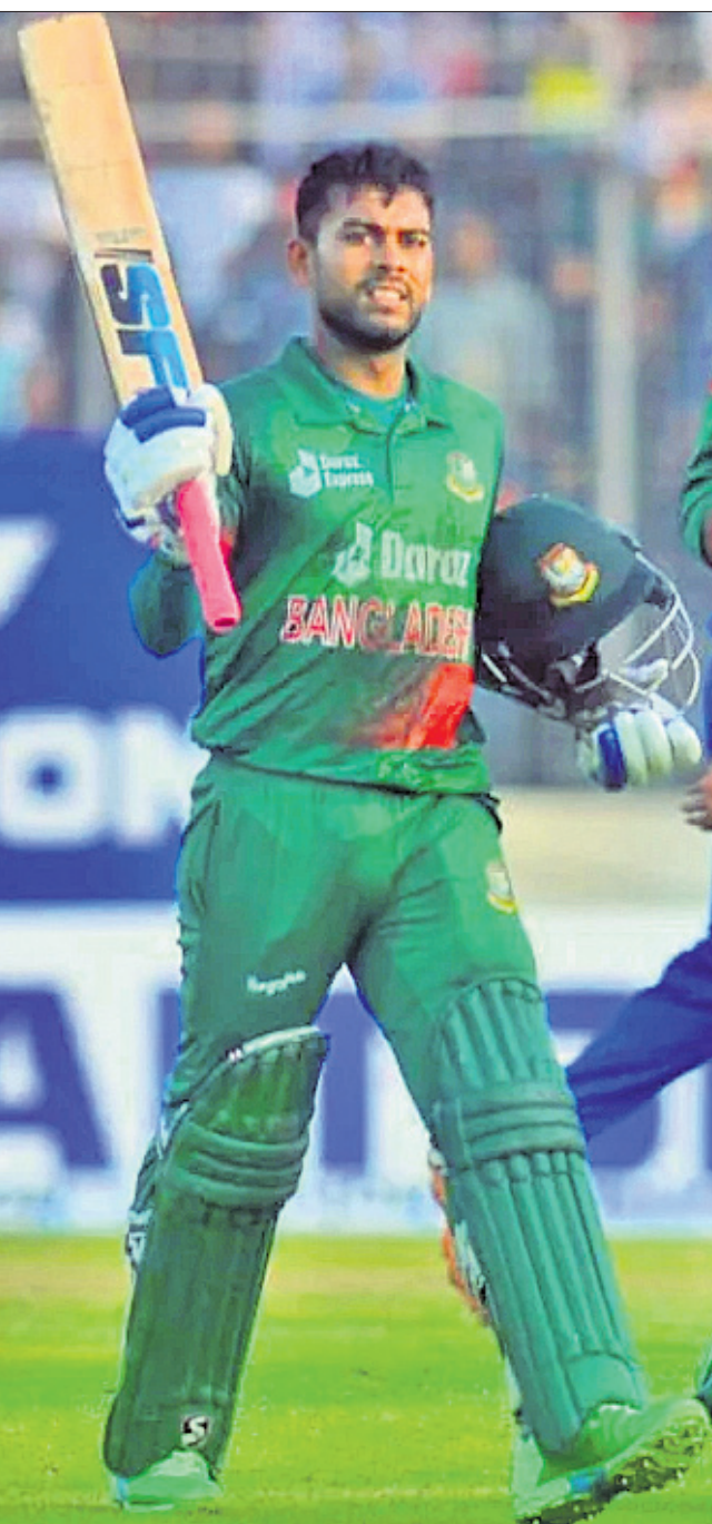
ପ୍ଲେୟର ଅଫ୍ ଦି ମ୍ୟାଚ ମେହିଦ୍ ହାସନ ମିରାଜ।

୮ ରନକରି ପୁରାଇଲିୟନ ଫେରିଥିଲେ। ଖ୍ରୀଷ୍ଟିଆନ ପୁରୁଷ (୧୧) ଓ ଲୋକେଶ ରାଷ୍ଟ୍ରଲୀ (୧୪) ମଧ୍ୟ ଫେଲ୍ ମାରିଥିଲେ। ଶ୍ରେୟସ ଆୟର (୮୨ ରୁନ, ୧୦୨ ବଲ୍, ୬ ଟୋକା, ୩ ଛକା) ଓ ଅକ୍ଷୟ ପଟେଲ (୫୬ ରୁନ, ୫୬ ବଲ୍, ୨ ଟୋକା, ୩ ଛକା)ଙ୍କ ଅର୍ଦ୍ଧଶତକୀୟ ଇନିଂସ ବଳରେ ଭାରତ ଲଢ଼ିଥିଲା। ରନହାର କ୍ରମେ ବୃଦ୍ଧି ପାଇଥିବାବେଳେ ହାଫ୍ ଫିର୍ ରୋହିତ ଶେଷ ଭାଗରେ କ୍ରିକ୍ସୁ ଆସି ଲକ୍ଷ୍ମୀ ବ୍ୟାଟିଂ କରିଥିଲେ ହେଁ ତାହା ବିଜୟ ପାଇଁ ପର୍ଯ୍ୟାପ୍ତ ହୋଇ ନ ଥିଲା। ସେ ୨୮ ବଲ୍ରେ ୫୧ (୩ ଟୋକା, ୫ ଛକା) ରନରେ ଅପରାଜିତ ଥିଲେ। ବ୍ୟାଟିଂରେ ପକ୍ଷ୍ମ ଲବାଦତ ହୋସେନ ମାଟି, ମେହିଦ୍ ହାସନ ମିରାଜ ଓ ଶାଦିବ ଅଲ୍ ହାସନ ୨ଟି ଲେଖାଏ ଏବଂ ପୃଷ୍ଠାଫିଲ୍ଡର ରହମାନ ଓ ମହମ୍ମଦୁଲ୍ଲା ଗୋଟିଏ ଲେଖାଏ ଉଇକେଟ ନେଇଥିଲେ। ଦଳର ଆବଶ୍ୟକତା ଦୃଷ୍ଟିରୁ ରୋହିତ ବ୍ୟାଟିଂ କରିବାକୁ ଆସିଥିଲେ ମଧ୍ୟ ଆହତ ଥିବାରୁ ତୃତୀୟ ଦିନିକିଆ ଏବଂ ଆଗାମୀ ଟେଷ୍ଟ ସିରିଜ ଖେଳିବା ନେଇ ସନ୍ଦେହ ରହିଛି। ତେବେ ତାଙ୍କ ଅକ୍ଟୁବର ହାଡ଼ ଭାଙ୍ଗି ନ ଥିବା ସ୍ପଷ୍ଟ ହୋଇଛି।