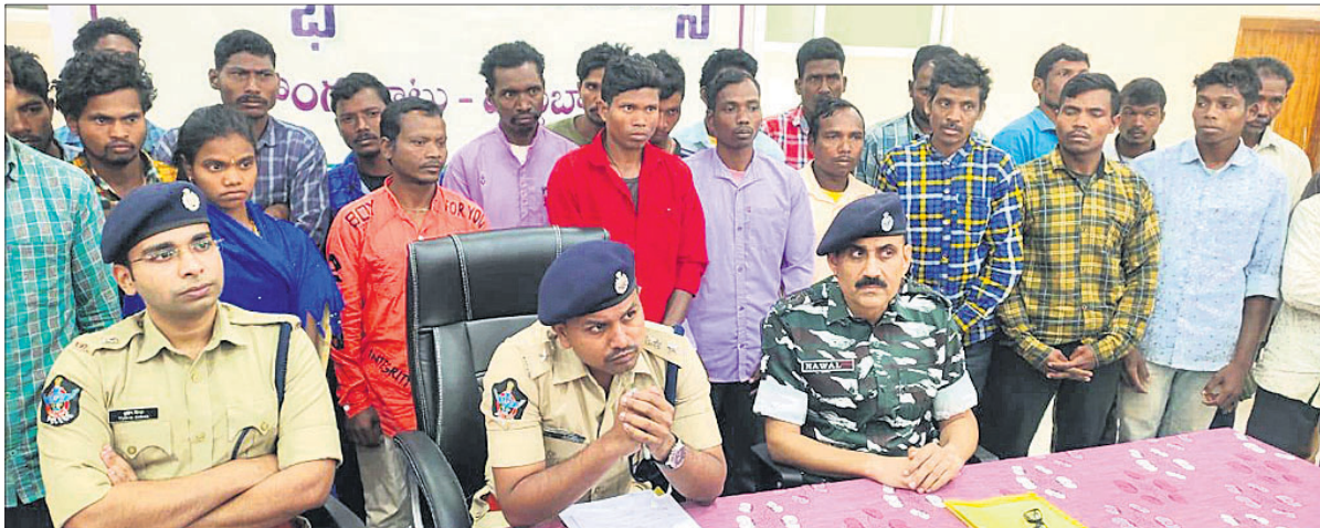
ମାଲକାନଗିରି, ୭.୧୨ (ଡି.ଏନ୍.ଏ.)