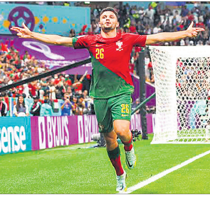
ହ୍ୟାଟ୍ରିକ୍ ଗୋଲ ଦେବାପରେ ପର୍ତ୍ତୁଗାଲର ଗୋନକାଲୋ ରାମୋସ।

ଦୋହା, ୭।୧୨: ମଙ୍ଗଳବାର ରାତିରେ ସୁଇଜରଲ୍ୟାଣ୍ଡ ବିପକ୍ଷ ରାଉଣ୍ଡ ଅଫ୍ ୧୬ ମ୍ୟାଚ ଆରମ୍ଭ ହେବା ପୂର୍ବରୁ ସ୍ଵାର୍ ଖେଳାଳି କ୍ରିଷ୍ଟିଆନୋ ରୋନାଲ୍ଡୋ ଦଳକୁ ବାଦ ପଡ଼ିଛି କି ନା ସେ ନେଇ ଚର୍ଚ୍ଚା ଜୋର ଧରିଥିଲା। ପର୍ତ୍ତୁଗାଲର ଅଲ୍ ଟାଇମ୍ ରେକର୍ଡିଂ ସ୍କୋରର ଉପରେ କ୍ୟାମେରାଗୁଡ଼ିକ ଫୋକସ ରହିଥିଲା। ପୂର୍ବ ମ୍ୟାଚରେ ମ୍ୟାନେଜର ଫର୍ନାଣ୍ଡୋ ସାନ୍ତୋସ ପ୍ରଦର୍ଶନକୁ ନେଇ ଏହି ଖେଳାଳିଙ୍କ ଉପରେ ବିରକ୍ତି ପ୍ରକାଶ କରିଥିଲେ। ସୁଇଜରଲ୍ୟାଣ୍ଡ ବିପକ୍ଷ ମ୍ୟାଚରେ ତାଙ୍କୁ ବିକଳ ଖେଳାଳି ତାଲିକାରେ ସାମିଲ କରାଯାଇଥିଲା। ଏଣୁ ଅସହ୍ୟ ରୋନାଲ୍ଡୋଙ୍କ ଚିତ୍ର ଉତ୍ତୋଳନ କରିବା ଲାଗି ଫୋଟୋଗ୍ରାଫରମାନେ ବେଶ୍ଵୁ ଘେରି ରହିଥିଲେ। ୨୦୦୮ ପରଠାରୁ ଏକ ପ୍ରମୁଖ ଚୁନାବଳରେ ପର୍ତ୍ତୁଗାଲର ସ୍ଵର୍ତ୍ତ୍ଵ ଲଭେଇନରେ ତାଙ୍କୁ ଘ୍ନାନ ନ ମିଳିବା ଏହା ପ୍ରଥମ। ମାତ୍ର ତାଙ୍କ ଘ୍ନାନରେ ବଦଳ ଖେଳାଳି ଭାବେ ସୁଯୋଗ ପାଇଥିବା ୨୧ ବର୍ଷୀୟ ହ୍ୟାଟ୍ରିକ୍ ପରେ ସମଗ୍ର ଦୃଷ୍ଟି ଗୋନକାଲୋ ରାମୋସଙ୍କ ଉପରେ ପଡ଼ିଥିଲା। ତାଙ୍କ ବିଷୟରେ କାଣିବା ପାଇଁ ଆଗ୍ରହ ସୃଷ୍ଟି ହେବା ସ୍ଵାଭାବିକ। ସୁଇଜରଲ୍ୟାଣ୍ଡ ବିପକ୍ଷ ମ୍ୟାଚକୁ ପର୍ତ୍ତୁଗାଲ ୬-୧ ଗୋଲରେ ଜିତିଥିଲା। ୧୯୬୨ରେ ହଜେରାର ଫ୍ଲୋରିଆନ୍ ଆଲବର୍ଟଙ୍କ ପରେ ଏକ ବିଶ୍ଵକପ୍ରେ ହ୍ୟାଟ୍ରିକ୍ ଅର୍ଜନ କରିବାରେ ୨୧ ବର୍ଷ ଓ ୧୬୯ ଦିନ ବୟସର ରାମୋସ ସର୍ବନିମ୍ନ ଖେଳାଳି ହେବାର ଗୌରବ ଅର୍ଜନ କରିଛନ୍ତି। ରୋନାଲ୍ଡୋଙ୍କ ନାମରେ ୮ ବିଶ୍ଵକପ୍ ଗୋଲ ରହିଛି। ପର୍ତ୍ତୁଗାଲର ୬ ନକ୍ସାଧାର ମ୍ୟାଚରେ ସେ କିନ୍ତୁ ଷୋର କରିଯାରି ନାହାନ୍ତି। ରାମୋସ କିନ୍ତୁ ଏହି ପର୍ଯ୍ୟାୟରେ ଇତିମଧ୍ୟରେ ତିନୋଟି ଗୋଲ ଷୋର କରିଯାରିଲେଣି। ଲିଭରନ ପ୍ରଦେଶନାଳୀ ପୂର୍ବକ ଲୁକ୍ ସେନିୟରଙ୍କ ମୂଧୁ ବିଷ୍ଣୁ କରିଆରେ ରାମୋସ ବିକଶିତ ହୋଇଛନ୍ତି।