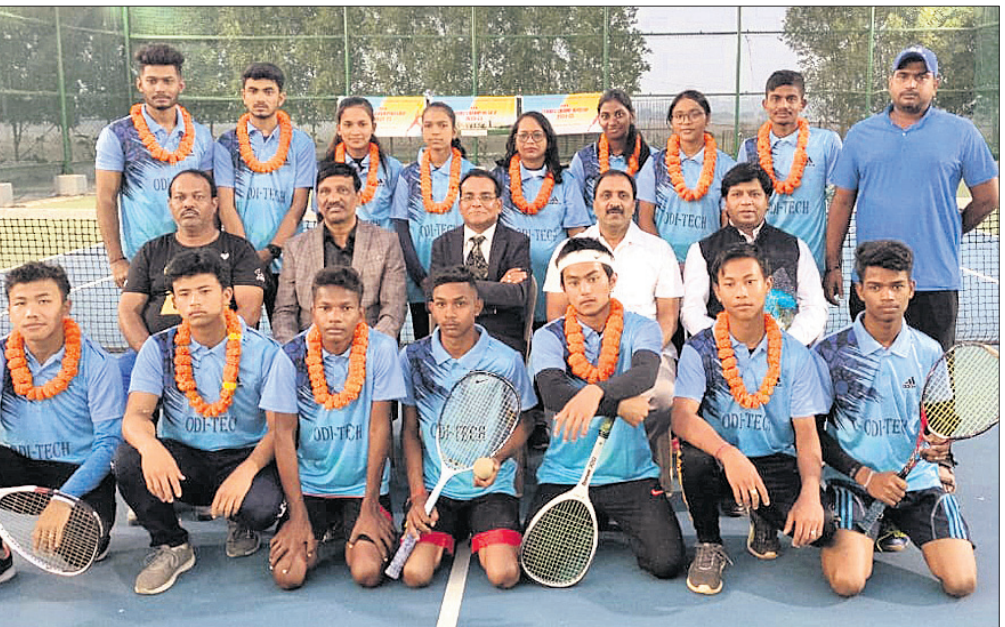
ଲକ୍ଷ୍ନୌ ଯାତ୍ରା କରିବା ପୂର୍ବରୁ ଅତିଥିକ ଗହଣରେ ଓଡ଼ିଶା ଭୂମିର ସଫ୍ଟ ଟେନିସ ଦଳ।