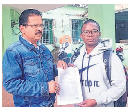
ବିଭାଗ ଶିକ୍ଷାକ୍ରମ ପାଇଁ ସମ୍ପର୍କିତ ଚିଠି ଇଫୁଙ୍କୁ ପ୍ରଦାନ କରୁଛନ୍ତି।

ଡାକ୍ତରୀ ପାଠପଢ଼ା ପିଁ ଦେବାକୁ ଧାନ କାର୍ଯ୍ୟକ୍ରମ, ଦିନ ମୂଲ୍ୟ ଆଦି ଦେଇ ବି ଲାଗୁଛନ୍ତି। କନ୍ୟାମାନଙ୍କୁ ଲାଗୁ କରାଯାଇଥିବା ପ୍ରାଥମିକ ଶିକ୍ଷା ପ୍ରାମାଣ୍ୟ ପ୍ରାମାଣ୍ୟ ଗ୍ରାମୀଣ ଶିକ୍ଷା ଶାଳାରେ ଶିକ୍ଷା ଦେବା ପାଇଁ ଏହି ଡାକ୍ତରୀ ଶିକ୍ଷାକ୍ରମ ହେଲେ ଇଫୁ ମାଲିକ। ତଳିତ ବର୍ଷ ସେ ଦିନକୁ ଧାନ ଲାଗି ନିର୍ଦ୍ଦେଶ ଦେବାକୁ ହେବା ପରେ କୋରାପୁଟ ଶିକ୍ଷା ଲାଗୁ ନାହିଁ କିନ୍ତୁ ଡାକ୍ତରୀ ଶିକ୍ଷା ପାଇଁ ଆବଶ୍ୟକ ଅର୍ଥ ଯୋଗାଡ଼ କରି ସେ ବିଲରେ ଧାନ କାଟିବା ପାଇଁ ଆବଶ୍ୟକ ଅର୍ଥ ଯୋଗାଡ଼ କରି ଅନ୍ୟାନ୍ୟ କାର୍ଯ୍ୟ ଦି କରୁଛନ୍ତି। ଇଫୁ ମାଲିକ ଆର୍ଥିକ ସମସ୍ୟା ଦ୍ଵିଗୁଣିତ ଅବସ୍ଥାରେ ଥିବା ପରେ ରାଜ୍ୟ ସରକାରଙ୍କ ଅନୁମତି କାଠି ଓ ଅନୁମତି କରାଯାଇ ବିଭାଗ ଦ୍ଵାରା