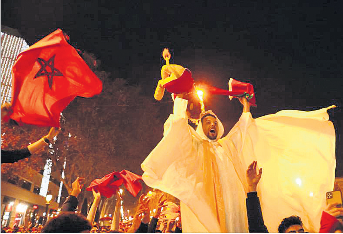
କାଟକରେ ଚାଲିଥିବା ଫିଫା ବିଶ୍ଵକପ୍ରେ ସ୍ଵେନ ବିପକ୍ଷରେ ମରୋକ୍କୀୟ ବିକଳ ପରେ ରାବାର ଓ ସ୍ଵେନ ଲା ରାମୋସ୍ ପ୍ରଶଂସକ ଆନନ୍ଦ ଉତ୍ସବ।