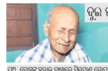
ପୁଅ, ବୋହୂଙ୍କୁ ହରାଇ ଚୁଖରେ ଫିରମାଣ ଗୋପବନ୍ଧୁ।

ଭୁବନେଶ୍ଵର, ୯୧୨(ବୁଧବାର) ମାଧ୍ୟମିକ ଶିକ୍ଷା ପରିଷଦ ପକ୍ଷରୁ ପରିଚାଳିତ ମାଟ୍ରିକ, ମଧ୍ୟମ ଏବଂ ଓପନ ସ୍କୁଲ ସମ୍ମେଳନ-୧ ପରୀକ୍ଷା ଖାତା ମୂଲ୍ୟାୟନ ଶୁକ୍ରବାରଠାରୁ ଆରମ୍ଭ ହୋଇଛି। ରାଜ୍ୟର ୫୬ଟି ପରୀକ୍ଷା କେନ୍ଦ୍ରରେ ୧୨,୨୫୦ଜଣ ଶିକ୍ଷକ ଖାତା ଦେଖାରେ ନିୟୋଜିତ ହୋଇଛନ୍ତି। ମୂଲ୍ୟାୟନ କେନ୍ଦ୍ରରେ ଅନୁପସ୍ଥିତ ଶିକ୍ଷକଙ୍କ ସ୍ଥାନରେ ସ୍ଥାନୀୟ ଯୋଗ୍ୟ ଶିକ୍ଷକମାନଙ୍କୁ ନିୟୋଜିତ କରାଯାଇଥିବା ଜଣାପଡ଼ିଛି। ୧୦ଦିନ ମଧ୍ୟରେ ଖାତାଦେଖା ଶେଷ ହେବ। ପ୍ରତିଦିନ ସକାଳ ୯ଟାରୁ ଅପରାହ୍ନ ୫ଟା ପର୍ଯ୍ୟନ୍ତ ଖାତାଦେଖା ଚାଲିବ। ସୂଚନାଯୋଗ୍ୟ, ରାଜ୍ୟର ୩,୦୨୯ କେନ୍ଦ୍ରରେ ୫ଲକ୍ଷ ୪୦ହଜାର ଛାତ୍ରଛାତ୍ରୀ ପରୀକ୍ଷା ଦେଇଥିଲେ। ଖାତାଦେଖା ସରିବା ପରେ ଆବଶ୍ୟକ ତର୍କମା ପରେ ପରୀକ୍ଷା ଫଳ ବୋର୍ଡ଼ ଖେପାଇବାର ପ୍ରକାଶ କରାଯିବ।