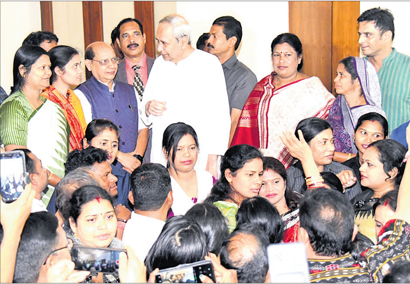
ପଦ୍ମପୁର ନବନିର୍ବାଚିତ ବିଧାୟିକା ବର୍ଷା ସିଂ ବରିହା ଦଳୀୟ ନେତାଙ୍କ ସହ ଶୁକ୍ରବାର ନବୀନ ନିବାସଠାରେ ମୁଖ୍ୟମନ୍ତ୍ରୀ ନବୀନ ପଟ୍ଟନାୟକଙ୍କୁ ସାକ୍ଷାତ କରୁଛନ୍ତି ।