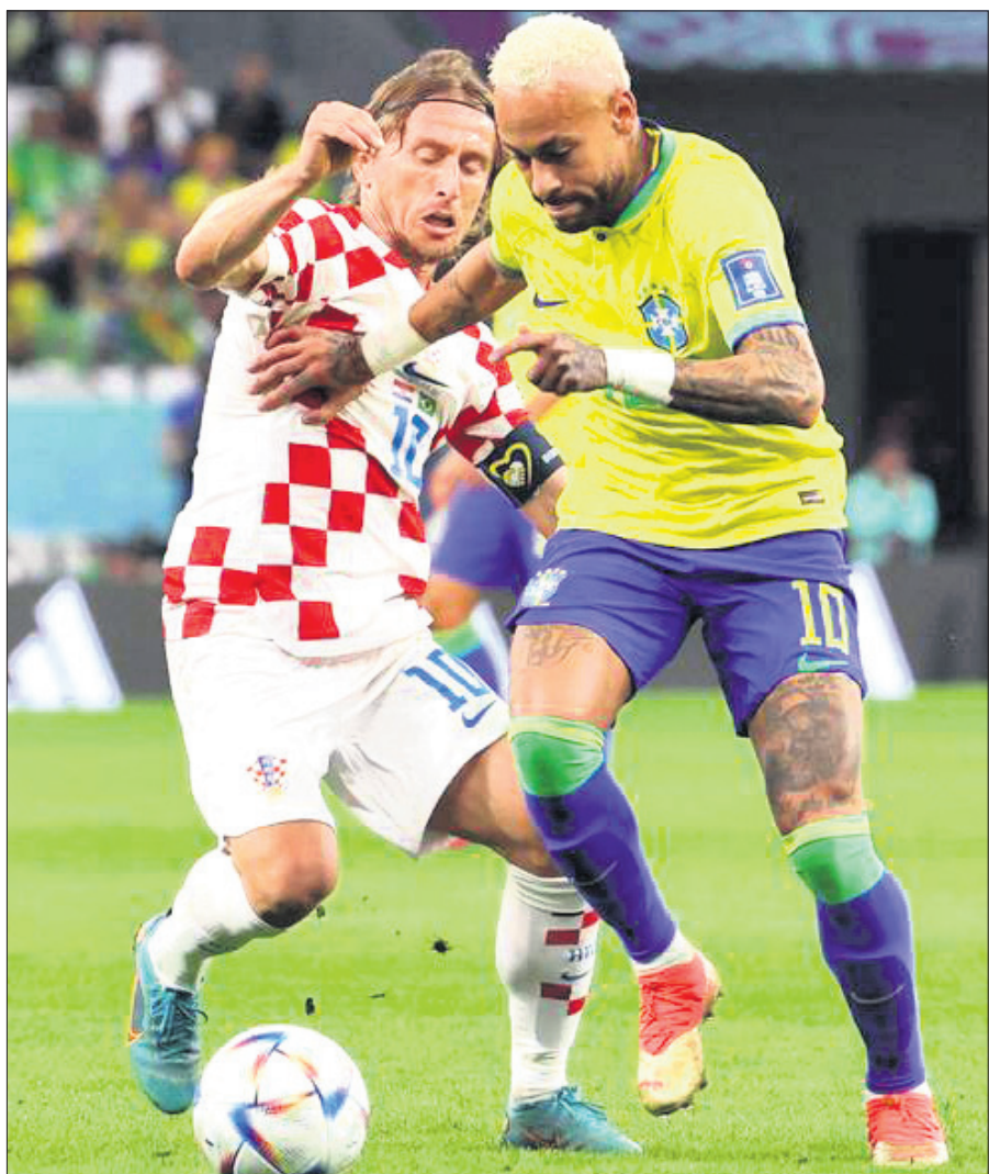
ଏକ୍ସକେଶନ ସିଟି ଷ୍ଟାଡିୟମରେ ଶୁକ୍ରବାର ପିଫା ବିଶ୍ଵକପର କାର୍ତ୍ତବ୍ୟ ଫାଇନାଲରେ ଗ୍ରୋସ୍‌ସିଆର ଲୁକା ମୋଡ୍ରିଚ୍ ଓ ବ୍ରାଜିଲର ନେମାରଙ୍କ ମଧ୍ୟରେ ବଲ୍ ପାଇଁ ସଂଘର୍ଷ।