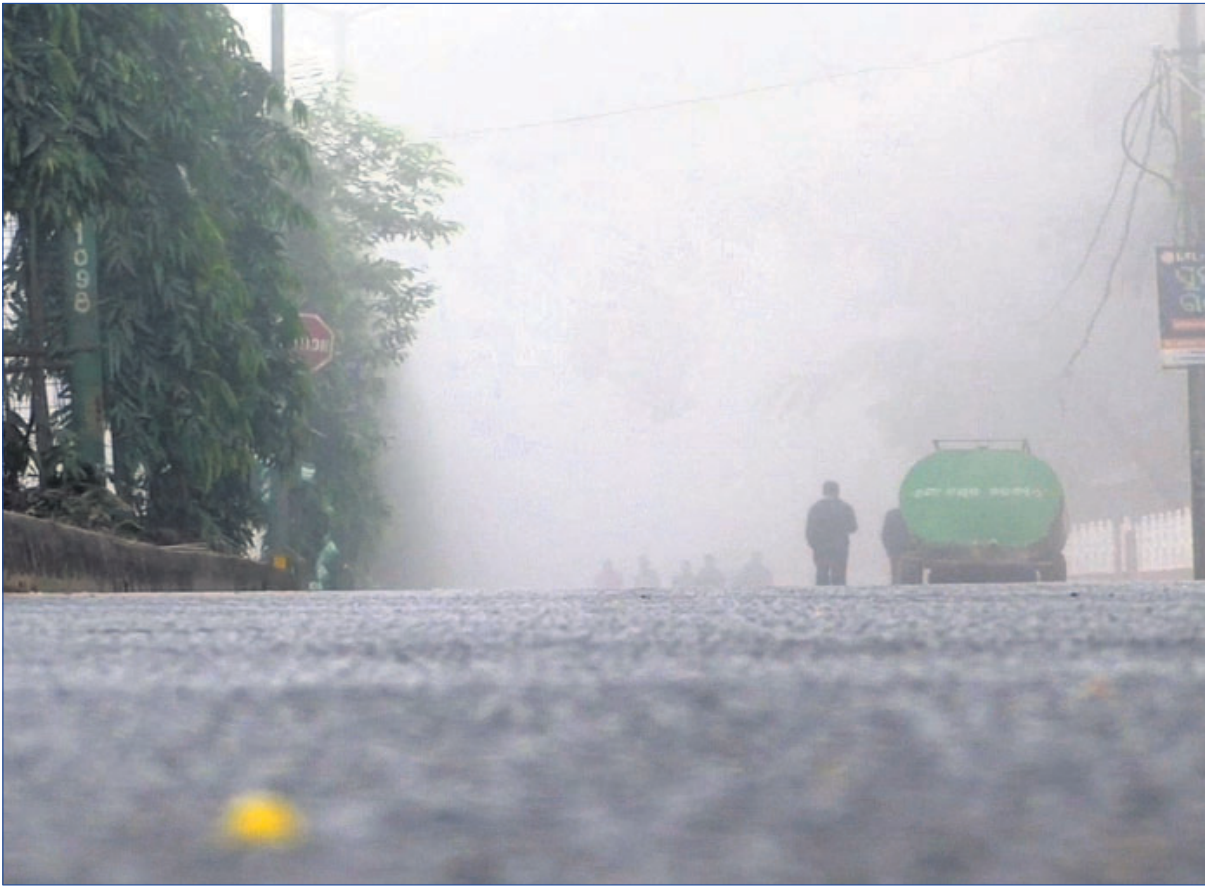
କନ୍ଧମାଳ ଜିଲ୍ଲା ପୁଲବାଣୀରେ ଶୁକ୍ରବାର କୁହୁଡ଼ିରେ ଆହୁରିତ ସକାଳ ।

ଆଜି ଡିସେମ୍ବର ୧୦ ତାରିଖ, ପୌଷ କୃଷ୍ଣ ତୃତୀୟା ଯୁକ୍ତ ତୃତୀୟା, ଶନିବାର, ବିଷ୍ଣୁ ମାନସାଧୁକାର ଦିବସ, ରାଶି ନକ୍ଷତ୍ର-ଆତ୍ମା/ମିଥୁନ, ଦ୍ୱିତୀୟାଦି ଏକୋଦିଶ ଶ୍ରୀକ୍ଷ, ସକାଳ ୧.୦୭:୪୦ ଗଡେ ଘ. ୦୮:୫୬ ମଧ୍ୟ, ଘ. ୧୨:୧୦ ଗଡେ ଘ. ୦୧:୧୦ ମଧ୍ୟ ଶୁକ୍ଳ ଶୁକ୍ଳବେଳା । ସକାଳ ୧.୦୮:୫୬ ଗଡେ ଘ. ୧୦:୧୭ ମଧ୍ୟେ ରାହୁକାଳ ।