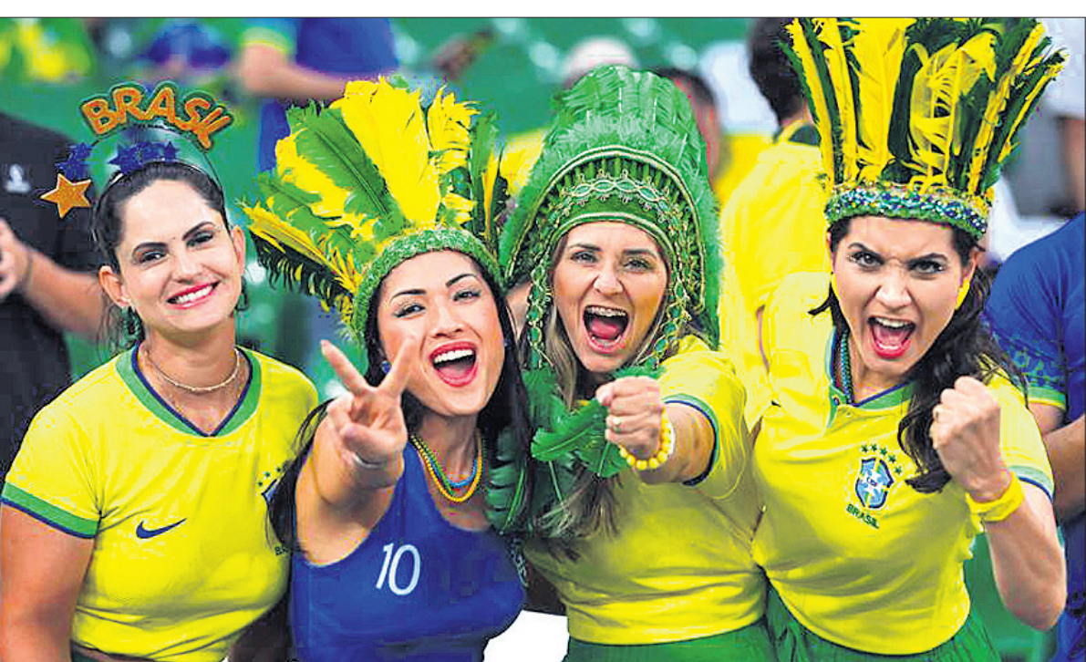
ଗ୍ରୋସ୍‌ସିଆ ବିପକ୍ଷ ପିଫା ବିଶ୍ଵକପ୍ ମ୍ୟାଚ ଉପଭୋଗ କରୁଛନ୍ତି ବ୍ରାଜିଲ ପ୍ରଶଂସକ।

ପରାସ୍ତ କରିଥିଲା। ଅନ୍ୟପକ୍ଷରେ ଇଂଲଣ୍ଡ ଛିଡ଼ି ପ୍ରଦର୍ଶନ ବଜାୟ ରଖି ଇରାନକୁ ୬-୨ ଗୋଲରେ ହରାଇ ଅଭିଯାନ ଆରମ୍ଭ କରିଥିବାବେଳେ ଆମେରିକା ବିପକ୍ଷ ମ୍ୟାଚକୁ ଗୋଲଶୂନ୍ୟ ତ୍ରୁ ରଖିଥିଲା ଏବଂ ଫ୍ରେଙ୍କ୍‌ଲିନ୍ ୩-୦ ଗୋଲରେ ପରାସ୍ତ କରିଥିଲା। ପ୍ରି-କ୍ଵାର୍ଟରରେ ଦଳ ସେନେଗାଲକୁ ୩-୦ ଗୋଲରେ ହରାଇ ଆଗକୁ ବଢ଼ିଥିଲା। ପ୍ରାନ୍ତ ୧୯୯୮ ଓ ୨୦୧୮ରେ ୨ ଥର ଏବଂ ଇଂଲଣ୍ଡ ୧୯୬୬ରେ ୨ ଥର ଚାମ୍ପିୟନ ହୋଇଥିଲା।