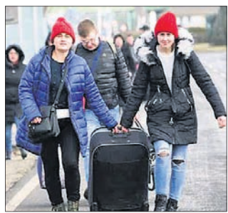
କହିଛନ୍ତି, କିଭିତ୍ତ ଭାରତୀୟ ପୁଠାବାସ ଅଭ୍ୟୁତ୍ପାଦନ ୨୫ରେ ଭୁବନେଶ୍ୱର ଛାତ୍ର ଚାଲିଯିବାକୁ ସମସ୍ତ ଭାରତୀୟଙ୍କ

ଉଦ୍ଦେଶ୍ୟରେ ଆହ୍ୱାନ କରାଯାଇଛି। ସେଠାରେ ମେଡିକାଲ ପଢୁଥିବା ଅଧିକାଂଶ ପିଲା ଯୁଦ୍ଧ ଆରମ୍ଭ ବେଳେ ଭାରତକୁ ଫେରିଆସିଥିବାବେଳେ ଆଉ ୧,୧୦୦ ଛାତ୍ରାଛାତ୍ରୀ ବର୍ତ୍ତମାନ ଯୁଦ୍ଧ ଫେରିନାହାନ୍ତି। ଯୁଦ୍ଧ ଯୋଗୁ ଯେଉଁମାନଙ୍କ ପଢ଼ାରେ ବାଧା ସୃଷ୍ଟି ହୋଇଛି, ସେମାନଙ୍କୁ ସାହାଯ୍ୟ କରିବା ପାଇଁ ଭାରତର ନ୍ୟାଶନାଲ ମେଡିକାଲ କମିଶନ (ଏନ୍‌ଏମସି) ପକ୍ଷରୁ ପଦକ୍ଷେପ ନିଆଯାଇଛି ବୋଲି ଲେଖି ସୂଚନା ଦେଇଛନ୍ତି।