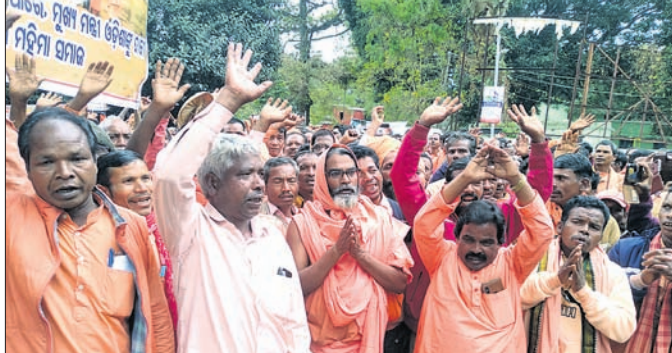
ଅଲେଖ ମହିମା ସମାପନାମାନେ ଅଲେଖ ମହିମା ଉପାସନା ପୀଠର ଭଙ୍ଗାକୁ ବିରୋଧ କରୁଛନ୍ତି ।

ଡୋକ୍ଟରାଳ ଜିଲା ପ୍ରଶାସନ ବେଆଇନ ଭାବେ ଯୋରାହସ୍ତିତ ମହିମା ଗାଦି ସତ୍ୟ ଅଲେଖ ମହିମା ଧର୍ମର ମନ୍ଦିର, ଉପାସନା ପୀଠ ଓ ବିଶ୍ରାମ ରୁଜୁକୁ ଭାଙ୍ଗି ଦେଇଛି । ଏହାର ପ୍ରଭାବ କୋରାପୁଟ ଜିଲା ଉପରେ ପଡ଼ିଛି । ଏହାକୁ ନେଇ ଶୁକ୍ରବାର କୋରାପୁଟ ଜିଲାର ହଜାର ହଜାର ମହିମାଧର୍ମୀ ସମାଧାନ କୋରାପୁଟ ଜିଲାପାଳଙ୍କ କାର୍ଯ୍ୟାଳୟ ଘେରାଉ କରି ବିରୋଧ କରିଛନ୍ତି । ପୁଞ୍ଜ୍ୟମନ୍ତ୍ରୀଙ୍କ ଉଦ୍ଦେଶ୍ୟରେ ଜିଲାପାଳଙ୍କୁ ଦାବିପତ୍ର ଦେଇଛନ୍ତି ।