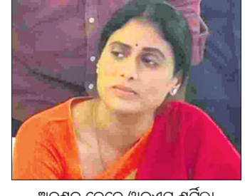
ଅନଶନ ବେଳେ ଖାଇଏସ୍ ଶର୍ମିଳା ହିଂସାକୁ ଉତ୍ସାହାଉଥିବା ଅଭିଯୋଗ ଆଣି ପୋଲିସ୍ ତାଙ୍କୁ ଅଟକ ରଖିଥିଲା । ଶର୍ମିଳା

ହାଇଦ୍ରାବାଦ, ୯।୧୨ ଖାଇଏସ୍‌ଆର୍ ତେଲଙ୍ଗାନା ପାର୍ଟି ଅଧ୍ୟକ୍ଷା ଖାଇଏସ୍ ଶର୍ମିଳାଙ୍କୁ ଶୁକ୍ରବାର ପୋଲିସ୍ ଅଟକ ରଖିବା ପରେ ସେ ଅନଶନରେ ବସିବା ସହ ରାଜ୍ୟରେ ଗଣତନ୍ତ୍ରର ପୁରସ୍କାର ପାଇଁ ଦାବି କରିଛନ୍ତି । ଖାଇଏସ୍ ପୋଲିସ୍ ତାଙ୍କୁ ପଦଯାତ୍ରା ପାଇଁ ଅନୁମତି ନ ଦେବାରୁ ଶର୍ମିଳା ଟ୍ୟାକ୍ ରୁହ ଆନ୍ଦୋଳନ ପ୍ରତିମୂର୍ତ୍ତି ନିକଟରେ ବିରୋଧ ପ୍ରଦର୍ଶନ କରିଥିଲେ । ସେ ଅନଶନ ବେଳେ ଖାଇଏସ୍ ଶର୍ମିଳା ହିଂସାକୁ ଉତ୍ସାହାଉଥିବା ଅଭିଯୋଗ ଆଣି ପୋଲିସ୍ ତାଙ୍କୁ ଅଟକ ରଖିଥିଲା । ଶର୍ମିଳା ଅନଶନରେ ବସିବା ସହ ତାଙ୍କୁ ପଦଯାତ୍ରା ନିମନ୍ତେ ଅନୁମତି ଦେବାକୁ ଦାବି କରିଛନ୍ତି । ତେଲଙ୍ଗାନା ମୁଖ୍ୟମନ୍ତ୍ରୀ କେ. ଚନ୍ଦ୍ରଶେଖର ରାଓ ତାଙ୍କ ପଦଯାତ୍ରାକୁ ବନ୍ଦ କରିବା ଲାଗି ସମସ୍ତ ଉଦ୍ୟମ ଚଳାଇଛନ୍ତି । ତାଙ୍କ ବନ୍ଦକୁ ଗାଳିବିଆନ୍ଦିବା ସହ ଦଳୀୟ କର୍ମୀମାନଙ୍କୁ ମାଡ଼ ମରାଗଲା ବୋଲି ଖାଇଏସ୍‌ଆର୍ ତେଲଙ୍ଗାନା ପାର୍ଟି ନେତ୍ରୀ କହିଛନ୍ତି । ପଦଯାତ୍ରା ଲାଗି ଅବାକଳ ଅନୁମତି ଦେବା ସତ୍ତ୍ୱେ ତାଙ୍କୁ ପୋଲିସ୍ ଛାଡ଼ି ନ ଥିବା ଶର୍ମିଳା କହିଛନ୍ତି ।