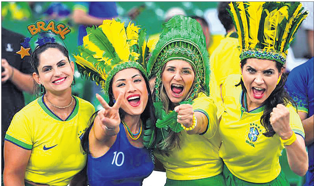
ଗ୍ରୋଏସିଆ ବିପକ୍ଷ ଫିଫା ବିଶ୍ୱକପ ମ୍ୟାଚ ଉପଭୋଗ କରୁଛନ୍ତି ବ୍ରାଜିଲ ପ୍ରଶଂସକ।

ଗ୍ରାମାଞ୍ଚଳରେ ଖେଲୋ ଇଣ୍ଡିଆ ସେଣ୍ଟର ଖୋଲିବା ଲାଗି ହେଉଥିବା ବାବୁକୁ ପୂରଣ କରିବାକୁ ଯାଇ ଆମେ ୧,୦୦୦ ଖେଲୋ ଇଣ୍ଡିଆ ସେଣ୍ଟର କରିବୁ। ଏହି ଭଳି ୭୩୩ଟି ସେଣ୍ଟର ପ୍ରକ୍ରିୟା ଇତିମଧ୍ୟରେ ଆରମ୍ଭ ହୋଇଯାଉଛି ବୋଲି ଜାତୀୟ ଅନୁରାଗ ଉଦ୍ଦେଶ୍ୟ କରିଛନ୍ତି।