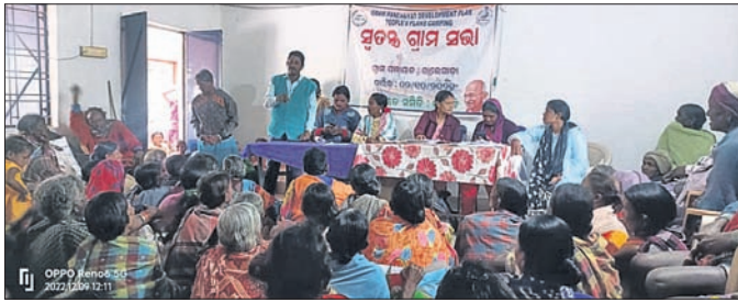
ସ୍ୱତନ୍ତ୍ର ଗ୍ରାମସଭାରେ ଉପସ୍ଥିତ ଥିବା ଅଧିକାରୀ ଓ ଗ୍ରାମବାସୀ ।

ବ୍ଲକ ପ୍ରଶାସନ ନିର୍ଦ୍ଦେଶରେ ପଞ୍ଚାୟତରେ ହେଉଥିବା ସରକାରୀ କାର୍ଯ୍ୟକୁ ମୁକ୍ତିକରେ ବିଭାଗୀୟ ଅଧିକାରୀ ଓ କର୍ମଚାରୀ ଅଣଦେଖା କରିବା ସହ ସରପଞ୍ଚଙ୍କ ଚିଠିକୁ ଗୁରୁତ୍ୱ ନ ଦେବା ନେଇ ଅସନ୍ତୋଷ ପ୍ରକାଶ ପାଇଛି । ଅଧିକାରୀ ଓ କର୍ମଚାରୀମାନେ ଗୁରୁତ୍ୱପୂର୍ଣ୍ଣ ଚିଠିକୁ ଅଣଦେଖା କରି ଜଣେ ନିର୍ଦ୍ଦିଷ୍ଟ ଜନପ୍ରତିନିଧିଙ୍କ ଚିଠିକୁ ଗୁରୁତ୍ୱ ନ ଦେବା ନେଇ ବ୍ଲକ ଉପାଧ୍ୟକ୍ଷ ଅସନ୍ତୋଷ ପ୍ରକାଶ କରିଛନ୍ତି । କୋରାପୁଟ ଜିଲା ପଟାଳି ବ୍ଲକ ଅନ୍ତର୍ଗତ ରାଲୋଗଡ଼ା ପଞ୍ଚାୟତର ସପ୍ତ ଏପରି ଦେଖିବାକୁ ମିଳିଛି । ଖବରରୁ ଜଣାପଡ଼ିଛି, ବିଭିନ୍ନ ସୌଧ୍ୟ ସାଧନ ମିଶ୍ରଙ୍କ ପ୍ରାଥମିକରେ ଉକ୍ତ ପଞ୍ଚାୟତର ସରପଞ୍ଚ