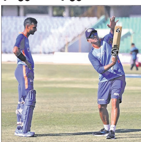
ଶାହାବାଜ ଅହମଦଙ୍କୁ ବ୍ୟାଟିଂ ଚମ୍ପି ଦେଉଛନ୍ତି କୋର୍ ଚାହୁଲ ଡ୍ରାଭିଟ।

ସମୟ ବ୍ୟବଧାନ ଖୁବ୍ କମ୍। ଚଳିତ ସିରିଜ ପାଇଁ ପ୍ରକୃତରେ ୨୦ କ୍ରିକେଟର ଉପଲବ୍ଧ ଥିଲେ। ମାତ୍ର ସମ୍ପୂର୍ଣ୍ଣ ମଧ୍ୟରେ ସବୁ ଏପଟ ସେପଟ ହୋଇଗଲା। ଫାଇନାଲ ଗେମ୍ ପାଇଁ ବର୍ତ୍ତମାନ ୧୪ ଜଣ ଖେଳାଳି ଉପଲବ୍ଧ ହେଉଛନ୍ତି। ତାଙ୍କ ଭିତରୁ ବୃତ୍ତୀୟ ଏକାଦଶ ବାଛିବାକୁ ପଡ଼ିବ। ଭାରତୀୟ ବୋଲି ଆକ୍ରମଣ ବର୍ତ୍ତମାନ ସ୍ପଟ୍ଟ ଅଭିଜ୍ଞତାସମ୍ପନ୍ନ ମନେ ହେଉଥିବାକୁ କୁଲଦୀପ ଯାଦବଙ୍କୁ ଚକୋଗ୍ରାମ୍ ପଠାଯାଇଛି। ଏହି ବାମହାତୀ ଖିନ ବୋଲର ୭୨ ଅନ୍ତର୍ଜାତୀୟ ଦିନିକିଆ ଖେଳି ୧୧୮ ଉଇକେଟ ଅଭିଆର କରିଛନ୍ତି। ବୋଲି ଲାଇଭ୍ ଅପରେ ସେ ହେଉଛନ୍ତି ସବୁଠାରୁ ଅଭିଜ୍ଞ ବୋଲର। ନିୟମିତ ଅଧିନାୟକ ରୋହିତ ଶର୍ମାଙ୍କ ବାମ ବୁକ୍‌ଲୁଲି ହାଡ଼ ଭାଙ୍ଗିଯାଇଥିବାକୁ ସେ ସ୍ୱଦେଶ ପ୍ରତ୍ୟାବର୍ତ୍ତନ କରିଛନ୍ତି। ଉପାୟମାନ