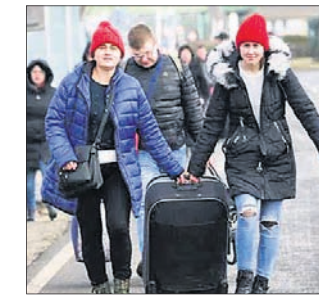
କହିଛନ୍ତି, କିଭଳି ଭାରତୀୟ ଦୂତାବାସ ଅଭ୍ୟୁତ୍ପାଦନ ୨୫ରେ ଭାରତୀୟ ଛାତ୍ର ଚାଲିଯିବାକୁ ସମସ୍ତ ଭାରତୀୟଙ୍କ