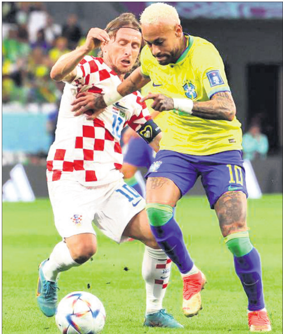
ଏକ୍ସକେଶନ ସିଟି ଷ୍ଟାଡିୟମରେ ଶୁକ୍ରବାର ଫିଫା ବିଶ୍ୱକପର କ୍ୱାର୍ଟର ଫାଇନାଲରେ ଗ୍ରୋଏସିଆର ଲୁକା ମୋଡ୍ରିଚ୍ ଓ ବ୍ରାଜିଲର ନେମାରଙ୍କ ମଧ୍ୟରେ ବଲ୍ ପାଇଁ ସଂଘର୍ଷ।