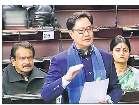
ସୁପ୍ରିମକୋର୍ଟ ରାୟ ଆଧାରରେ ହାଇକୋର୍ଟ ବେଞ୍ଚ ପ୍ରତିଷ୍ଠା ନିଷ୍ପତ୍ତି ନିଆଯାଇଥାଏ। ରାଜ୍ୟ ସରକାର ଆବଶ୍ୟକ ବ୍ୟୟ ଓ ଭିଜିଲିମ୍ପି ସୁବିଧା କରିଥାନ୍ତି। ଏଥିପାଇଁ ରାଜ୍ୟ ସରକାର ହାଇକୋର୍ଟର ମୁଖ୍ୟ ବିଭାଗପତିଙ୍କ ସହ ପରାମର୍ଶ କରି ସବିଶେଷ ପ୍ରସ୍ତାବ ଦାଖଲ କରିବା ଆବଶ୍ୟକ। ଏହି ପ୍ରସ୍ତାବ ଉପରେ ରାଜ୍ୟପାଳଙ୍କ ସ୍ୱୀକୃତି ଦରକାର ହୋଇଥାଏ। ଉଲ୍ଲେଖଯୋଗ୍ୟ, ପଶ୍ଚିମ ଓଡ଼ିଶାର ସମ୍ବଲପୁର ଏବଂ ଦକ୍ଷିଣ ଓଡ଼ିଶାର ବ୍ରହ୍ମପୁରଠାରେ ବେଞ୍ଚ ପ୍ରତିଷ୍ଠା ଲାଗି ସମ୍ପୂର୍ଣ୍ଣ ଅଞ୍ଚଳର ଆଇନଜୀବୀମାନେ ଦାବି କରିଆସୁଛନ୍ତି।