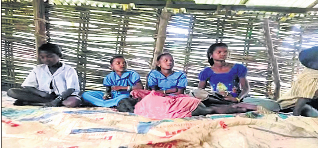
ବାଉଁଶ ବାଡ଼ରେ ନିର୍ମିତ ବିଦ୍ୟାଳୟରେ ଛାତ୍ରଛାତ୍ରୀମାନେ ପାଠ ପଢୁଛନ୍ତି ।

ମାଲକାନଗିରି ଜିଲ୍ଲାରେ ଏପରି ଅନେକ ବିଦ୍ୟାଳୟ ରହିଛି ଯେଉଁଠି ଏପର୍ଯ୍ୟନ୍ତ ପଢ଼ା ଘରଟିଏ ନାହିଁ । ରାଜ୍ୟ ସରକାର ଜିଲ୍ଲାରେ ଶିକ୍ଷା ସହ ଅନେକ କ୍ଷେତ୍ରରେ ପରିବର୍ତ୍ତନ ଆଣୁଥିବା ବେଳେ ପ୍ରଶାସନିକ ଅବହେଳା ଯୋଗୁ ଅନେକ ଗ୍ରାମରେ ମୌଳିକ ସୁବିଧା ଅପହଞ୍ଚିତ ହୋଇ ରହିଛି । ଫଳରେ ଏସାବଦ୍ ଅନେକ ବିଦ୍ୟାଳୟ ନିର୍ମାଣ ପକ୍ଷେ ଗୁଡ଼ ନାହିଁ । ଏପରି ଦେଖିବାକୁ ମିଳିଛି ମାଲକାନଗିରି ଜିଲା କାଳିମୋଳା ବ୍ଲକର କୁଟୁମାନୁ ପଞ୍ଚାୟତର ଆରବଟି ଗ୍ରାମରେ । ଏହି ଗ୍ରାମରେ ବିଭିନ୍ନ ମୌଳିକ ସମସ୍ୟା ଏଯାବତ୍ ସୂଚିତନାହିଁ । ଏଠାରେ ଥିବା ପ୍ରାଥମିକ ବିଦ୍ୟାଳୟର ଅବସ୍ଥା ଅତି ଶୋଚନୀୟ ହୋଇପଡ଼ିଛି । ୪୦ ବର୍ଷରୁ ଉର୍ଦ୍ଧ୍ୱ ସମୟ ଧରି ଏଠାରେ ଥିବା ବିଦ୍ୟାଳୟ ଅବସ୍ଥା ଦେଖିଲେ କେହି ଏହା ଏକ ବିଦ୍ୟାଳୟ ବୋଲି କହିବେ ନାହିଁ । ସାଧାରଣତଃ ବିଦ୍ୟାଳୟ ଗୃହ ଇଟା ଓ ସିମେଣ୍ଟରେ ତିଆରି ହେଉଥିବା ବେଳେ ଏହି ବିଦ୍ୟାଳୟ ତିଆରି ହୋଇଛି ବାଉଁଶ ବାଡ଼ରେ । ତଳେ ଗୋବର ଲିପା ଚଟାଣ ଯାଏ ଉପରେ ପଡ଼ିଛି ଚିଣା । ବିଦ୍ୟାଳୟ ଭିତରେ ପିଲାଙ୍କ ପଢୁଛନ୍ତି କି ନାହିଁ ତାହା ବାହାରୁ ସ୍ପଷ୍ଟ ରୂପେ ଦେଖି ହେଉଛି ।