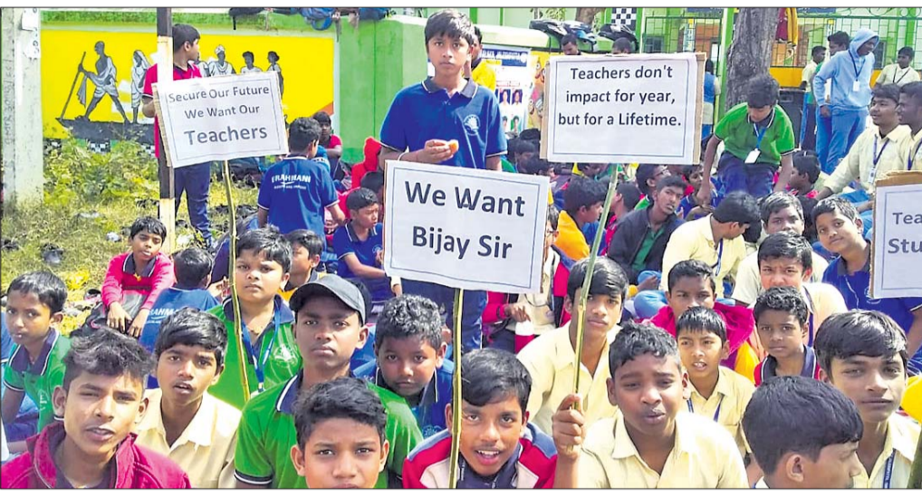
ଛାତ୍ରାଛାତ୍ରୀମାନେ ଧାରଣାରେ ବସିଛନ୍ତି।