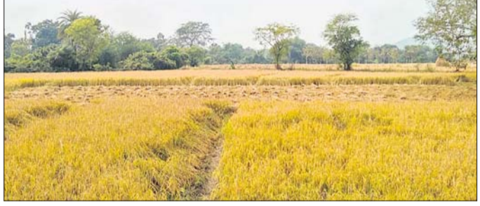
ବର୍ଷା ଯୋଗୁ ଜମିରେ ଧାନ ଗଛ ନଷ୍ଟ ହୋଇଛି।