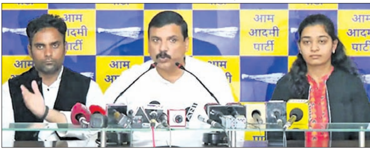
ଖବରଦାତା ସମ୍ମିଳନୀରେ ରାଜ୍ୟ ସଭା ସଦସ୍ୟ ସଞ୍ଜୟ ସିଂ