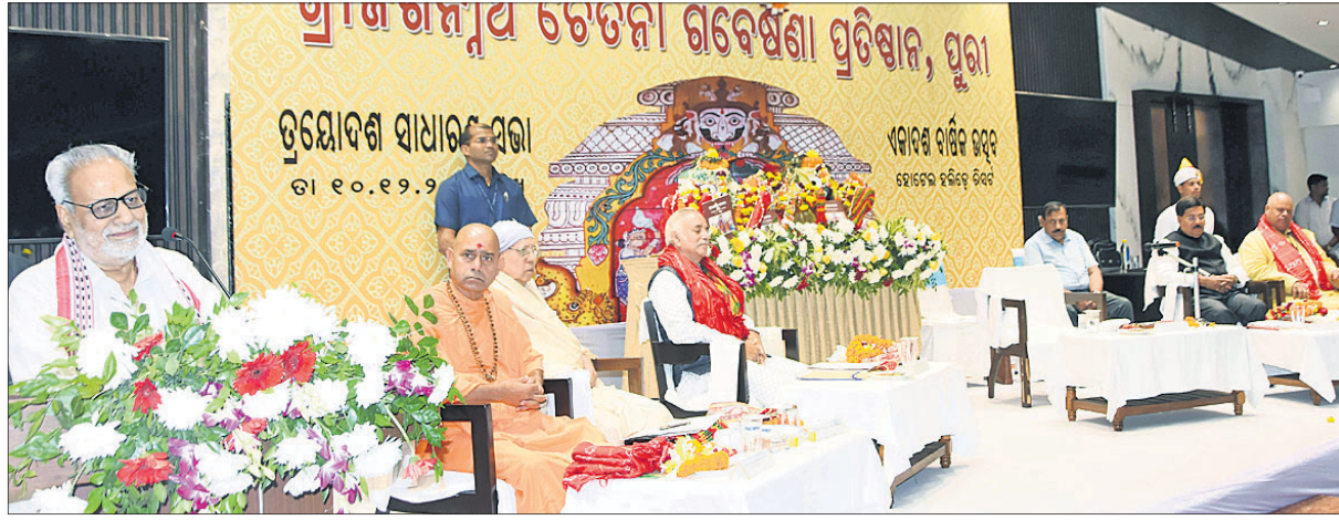
ଉତ୍ସବରେ ରାଜ୍ୟପାଳ ପ୍ରଫେସର ଗଣେଶୀ ଲାଲ ଉଦ୍‌ବୋଧନ ଦେଉଛନ୍ତି । ମଞ୍ଚରେ ଉପସ୍ଥିତ ଅଛନ୍ତି ରାଜପତି ମହାରାଜା ଦିବ୍ୟସିଂହ ଦେବଙ୍କ ସହ ଅନ୍ୟ ଅତିଥି ।