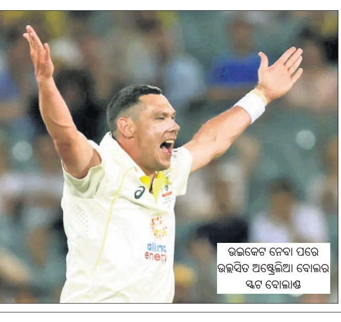
ଉଇକେଟ ନେବା ପରେ ଉଲ୍ଲସିତ ଅଷ୍ଟ୍ରେଲିଆ ବୋଲର ସ୍ଟେ ବୋଲାଣ୍ଡ

ଆଡିଲେଡ, ୧୦୧୨ (ଏପି) ସ୍ଥାନୀୟ ଆଡିଲେଡ଼ ଓଭାଲରେ ଚାଲିଥିବା ଫ୍ରେଷ୍ଟକ୍ସିକ ବିପକ୍ଷ ଦ୍ୱିତୀୟ କ୍ରିକେଟ ଟେଷ୍ଟ ଏବେ ସମ୍ପୂର୍ଣ୍ଣ ଅଷ୍ଟ୍ରେଲିଆ ନିୟନ୍ତ୍ରଣରେ ରହିଛି। ଘରୋଇ ଦଳ ଏହାର ପ୍ରଥମ ଇନିଂସ ୫୧୧/୭ରେ ଘୋଷଣା କରିବା ପରେ ଶନିବାର ପୂର୍ବଦିନ ସମସ୍ୟା ସ୍କୋର ୧୦୨/୪ରୁ ବ୍ୟାଟି ଆରମ୍ଭ କରିଥିଲା ଫ୍ରେଷ୍ଟକ୍ସିକ। ଦଳ ମାତ୍ର ୨ ଘଣ୍ଟା ଖେଳରେ ଏହାର ଅବଶିଷ୍ଟ ୬ ଉଇକେଟ ଦିନିକିଆରେ ୨୧୪ ରନରେ ଅଲଆଉଟ ହୋଇ ଫଲୋଅନର ସମ୍ମୁଖୀନ ହୋଇଥିଲା। କିନ୍ତୁ ଅଷ୍ଟ୍ରେଲିଆ ଫଲୋଅନ ନ ଦେଇ ଏହାର ଦ୍ୱିତୀୟ ଇନିଂସ ଖେଳିବାକୁ ନିଷ୍ପତ୍ତି ନେଇଥିଲା। ଦଳ ୬ ଉଇକେଟ