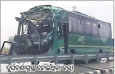
ଦୁର୍ଘଟଣାଗ୍ରସ୍ତ ହୋଇଥିବା ବସ

ମାଲକାନଗିରିରୁ ଭୁବନେଶ୍ୱର ଯାଉଥିବା ଏକ ସରକାରୀ ବସ ଶନିବାର ଭୋର ଦୁର୍ଘଟଣାଗ୍ରସ୍ତ ହୋଇଛି। ଫଳରେ ବସରେ ଥିବା ୧୬ ଯାତ୍ରୀ ଆହତ ହୋଇଛନ୍ତି। ଖବରରୁ ଜଣାପଡ଼ିଛି। ବସଟି ଶନିବାର ମାଲକାନଗିରିରୁ ଭୁବନେଶ୍ୱର ଅଭିମୁଖେ ଯାତ୍ରା ଆରମ୍ଭ କରିଥିଲା। ମାଲକାନଗିରି ସାମାନ୍ୟ ଆଶ୍ରମ ପ୍ରଦେଶର ଶ୍ରୀକାଳୁଳମ ନିକଟରେ ଏହା ଏକ ଟ୍ରକ୍ ସହ ପହଞ୍ଚି ଥିବା ବେଳେ ଦୁର୍ଘଟଣାଗ୍ରସ୍ତ ହୋଇଥିଲା। ଏଥିରେ ଯାତ୍ରୀ ଓ ଡ୍ରାଇଭରଙ୍କ ସମେତ ମୋଟ ୧୬ ଜଣ ଗୁରୁତର ଆହତ ହୋଇଥିବା ଜଣାପଡ଼ିଛି। ଆହତ ଯାତ୍ରୀଙ୍କୁ