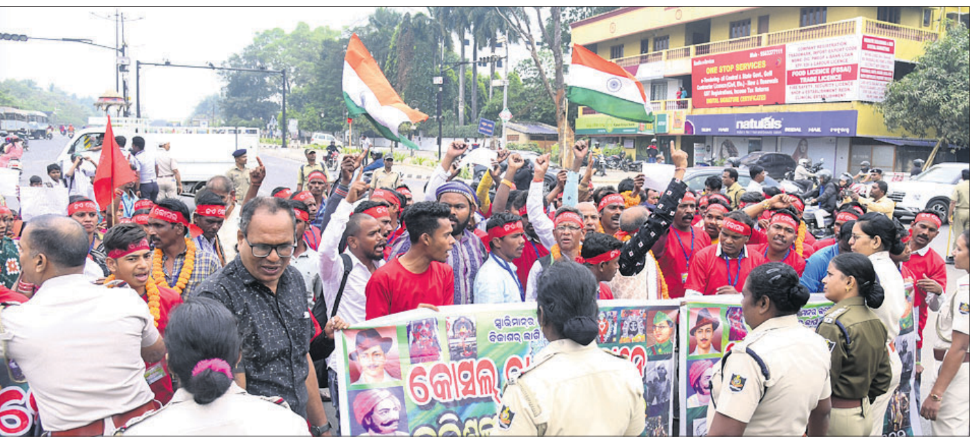
ସ୍ୱଚ୍ଛ କୋଶଳ ରାଜ୍ୟ ଗଠନ ଦାବି ନେଇ କୋଶଳ ରାଜ୍ୟ ମୁଲିମୋର୍ଚ୍ଚା ନେତୃତ୍ୱରେ ହରିଶଙ୍କରରୁ ପଦଯାତ୍ରାରେ ଆସି ଭୁବନେଶ୍ୱରରେ ପହଞ୍ଚିଥିବା କୋଶଳବାଦୀ ଶନିବାର ମୁଖ୍ୟମନ୍ତ୍ରୀଙ୍କୁ ସାକ୍ଷାତ ପାଇଁ ନବୀନ ନିବାସ ଯିବାବେଳେ ଶିଶୁ ଭବନ ଛକରେ ପୋଲିସ୍ ଅଟକାଇଛି ।