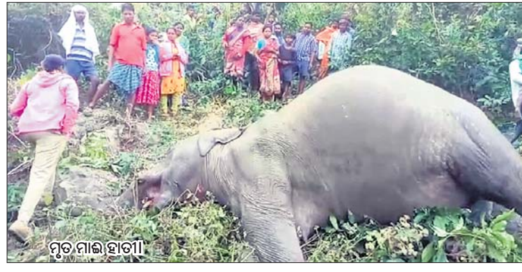
ମୃତ ହାତୀ ଗ୍ରାମବାସୀଙ୍କ ଦୃଷ୍ଟିରେ ରହିଥିଲା।