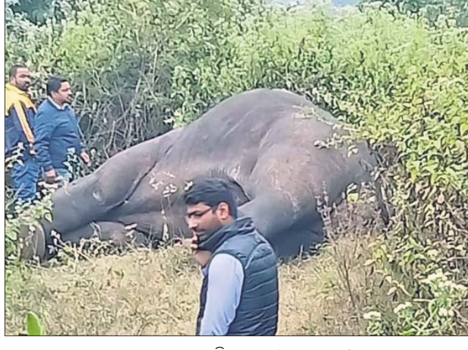
ଜଙ୍ଗଲ ମଧ୍ୟରେ ପଡ଼ିଥିବା ହାତୀର ମୃତଦେହ।