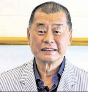
ଗଣତନ୍ତ୍ର ସମ୍ପର୍କବାଦୀଙ୍କ ପୁଅ ବିଏ ଜଗୁଛି ଚାଇନା

ହୁଙ୍କର ଗଣତନ୍ତ୍ର ସମ୍ପର୍କବାଦୀ ମିଡ଼ିଆ ଚାଲକଙ୍କୁ ଜିମିଙ୍କୁ ଶିକାରୀ ଏକ ଘାତୀୟ ଅପରାଧ ୫ ବର୍ଷ ୯ ମାସ ଜେଲ ଦଣ୍ଡ ସହ ୨୫୦,୦୦୦ ହୁଙ୍କ ତଲାର ଜମିନାମା ଆଦେଶ ଦେଇଛନ୍ତି।