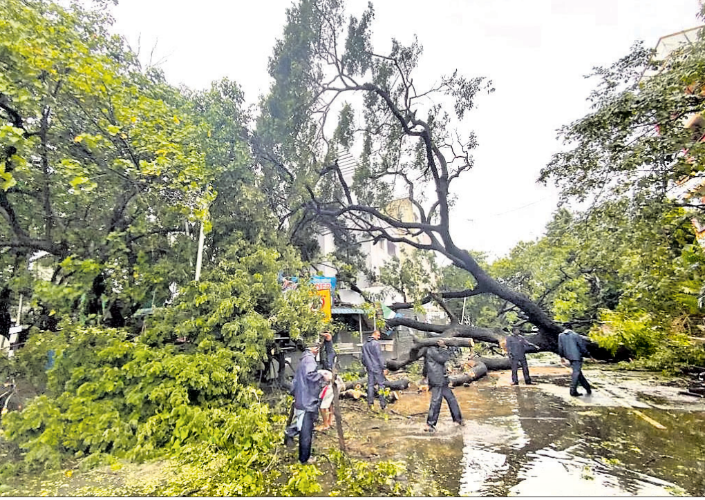
ମାଣ୍ଡୋସ ପ୍ରଭାବରେ ଚେନାଇ କିଲପକରେ ଉପୁଡ଼ି ପଡ଼ିଥିବା ବିଭାଗ ଗଛକୁ ଘ୍ରାମୀୟ ପ୍ରଶାସନ ରାସ୍ତାକୁ ହଟାଇଛି।

ଚେନାଇ, ୧୦୧୨: ବାତ୍ୟା ମାଣ୍ଡୋସ ପ୍ରଭାବରେ ତାମିଲନାଡୁର ବିଭିନ୍ନ ଅଞ୍ଚଳରେ ପ୍ରବଳ ଭାବରେ ମୋଟ ୪ ଜଣଙ୍କ ମୃତ୍ୟୁ ହୋଇଥିବାବେଳେ ଲୋକଙ୍କ ଲକ୍ଷାଧିକ ମୃତ୍ୟୁର ସମ୍ଭାବନା ରହିଛି।