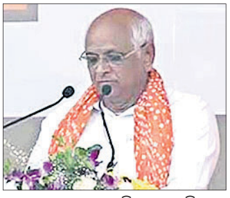
ଭୁବନେଶ୍ଵର, ୧୨ ଡିସେମ୍ବର

ଭୁବନେଶ୍ଵର, ୧୨ ଡିସେମ୍ବର: ଭୂପେନ୍ଦ୍ର ପଟେଲ ଶପଥ ନେଇଛନ୍ତି।