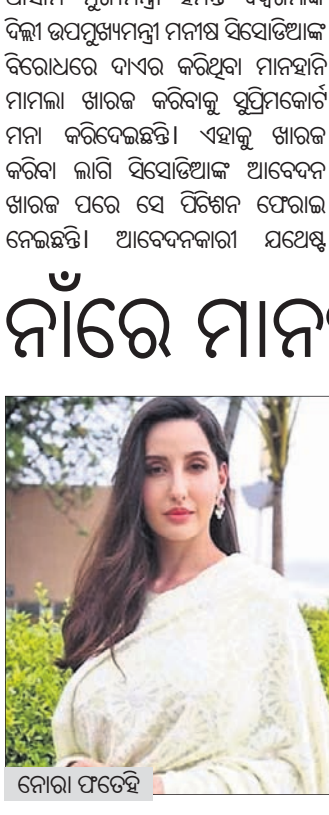
କୋଲକାତା, ୧୨ ଡିସେମ୍ବର