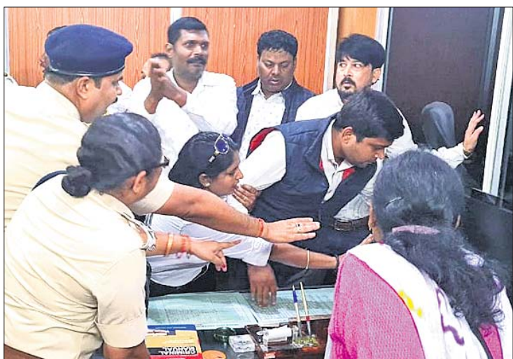
ସମ୍ବଲପୁରଠାରେ ଆନ୍ତରାଜ୍ୟ କେନ୍ଦ୍ରୀୟ କୁଶପୁରୁଷା ଦାହ କରାଯାଇଛି (ବାମ) । ଜିଲ୍ଲା ବୌଦ୍ଧକ କୋର୍ଟ ପରିସରକୁ ଆଇନଜୀବୀମାନେ ଧସେଇ ପଶୁଛନ୍ତି ।

ପଶ୍ଚିମ ଓଡ଼ିଶାରେ ହାଇକୋର୍ଟର ସ୍ୱାୟତ୍ତ ବେଞ୍ଚ ପ୍ରତିଷ୍ଠା ଦାବି ଦିନକୁ ଦିନ ତୀବ୍ର ହେବାରେ ଲାଗିଛି । ଆଇନଜୀବୀଙ୍କ ଆନ୍ଦୋଳନ ନ୍ୟାୟିକ କାର୍ଯ୍ୟଧାରାକୁ ବାଧା ପହଞ୍ଚାଇଥିବାରୁ ସୁପ୍ରିମକୋର୍ଟ ଉଦ୍ଦେଶ୍ୟ ପ୍ରକାଶ କରି ଆସୁଛନ୍ତି । ଏପରି କି ଗତ ନଭେମ୍ବର ୨୮ରେ ଆନ୍ଦୋଳନରତ ଆଇନଜୀବୀଙ୍କ ଲାଇସେନ୍ସ ରଦ୍ଦ କରିବାକୁ ମଧ୍ୟ ନିର୍ଦ୍ଦେଶ ଦେଇଥିଲେ । ଏହା ସତ୍ତ୍ୱେ ଆଇନଜୀବୀମାନେ ନିଜ ଜିଦ୍ଦରେ ଅଟଳ ରହିଥିବାରୁ କୋର୍ଟସି ଆଲୋଚନା ଦୁହେଁ ଆନ୍ଦୋଳନକାରୀଙ୍କୁ ଗିରଫ କରିଯାଇ କୋର୍ଟ କାର୍ଯ୍ୟକୁ ସ୍ୱାଭାବିକ କରାଯାଇ ବୋଲି ସୋମବାର ସର୍ବୋଚ୍ଚ ଅଦାଲତ କଠୋର ଆଭିମୁଖ୍ୟ ଗ୍ରହଣ କରିଛନ୍ତି ।