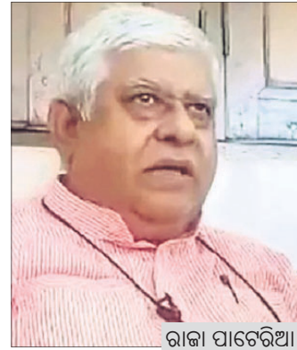
ଭୋପାଳ, ୧୨ ଡିସେମ୍ବର

ମୋଦିଙ୍କୁ ହତ୍ୟା କରିବାକୁ ଆହ୍ମାନ ଦେଇ ବିବାଦରେ କଂଗ୍ରେସ ନେତା