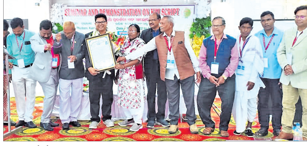
କୁଇଁ ସମାଜ କର୍ମକର୍ତା।