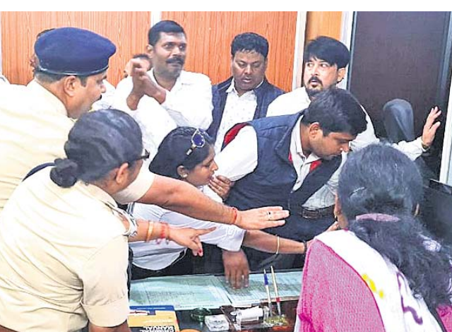
ଜିଲ୍ଲା ବୌଦ୍ଧତା କୋର୍ଟ ପରିସରକୁ ଆଇନଜୀବୀମାନେ ଧସେଇ ପଶୁଛନ୍ତି।

ଏଲ୍ଏସିରେ ଭାରତ-ଚାଇନା ସୈନ୍ୟଙ୍କ ମଧ୍ୟରେ ସଂଘର୍ଷ ଦୁଆବିଲା, ୧୨୧୨