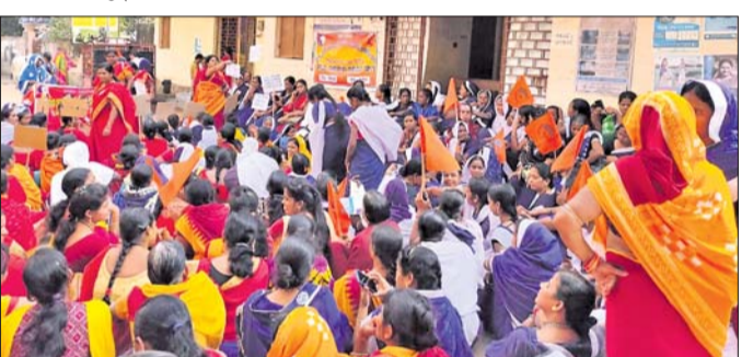
ଅଜ୍ଞାନତା କର୍ମାଳି ଧାରଣା ।