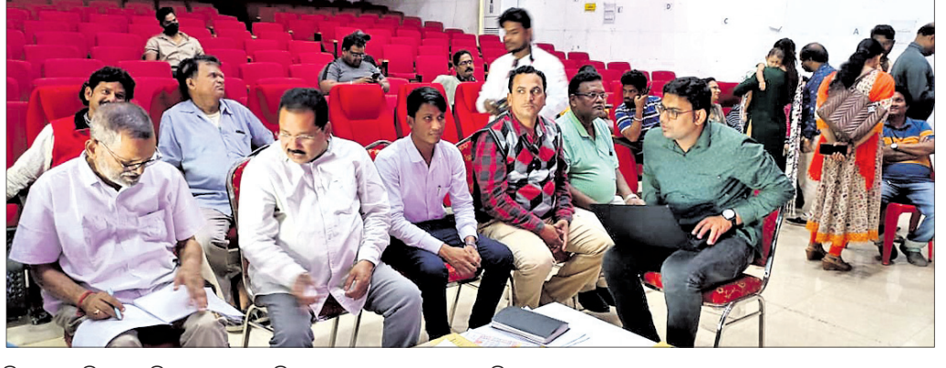
ହିଲପାଟଣାସ୍ଥିତ ସଂସ୍କୃତି ଭବନରେ ଆଞ୍ଚଳିକ କଳାକାର ତୟନ କରାଯାଇଛି।