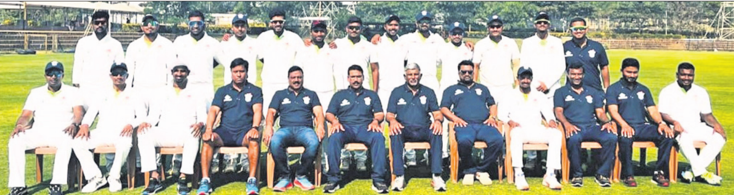
ବରୋଦା ବିପକ୍ଷ ରଣଜୀ ଟ୍ରଫି କ୍ରିକେଟ ମ୍ୟାଚ ପାଇଁ ମନୋନୀତ ଓଡ଼ିଶା ଦଳର ଖେଳାଳିମାନେ ସପୋର୍ଟ ଷ୍ଟୁଡ଼େଣ୍ଟ ସହ।