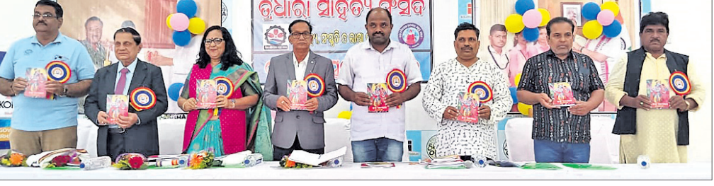
ବୈଠକରେ ଉପସ୍ଥିତ ଅତିଥି ଓ ଅନ୍ୟମାନେ।