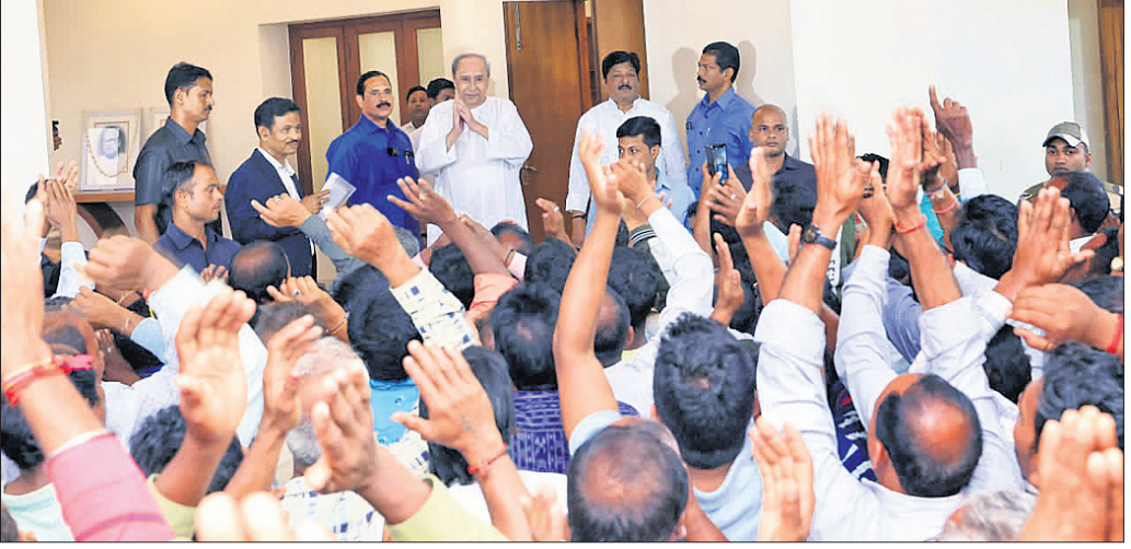
ନବୀନ ନିବାସରେ ଯୋଗ୍ୟର କେନ୍ଦ୍ରପତ୍ର ତୋଳାଳି ଏବଂ ବନ୍ଦାଧିକାରୀଙ୍କୁ ନବୀନ ପଞ୍ଚନାୟକଙ୍କୁ କୃତଜ୍ଞତା ଜଣାଉଛନ୍ତି।