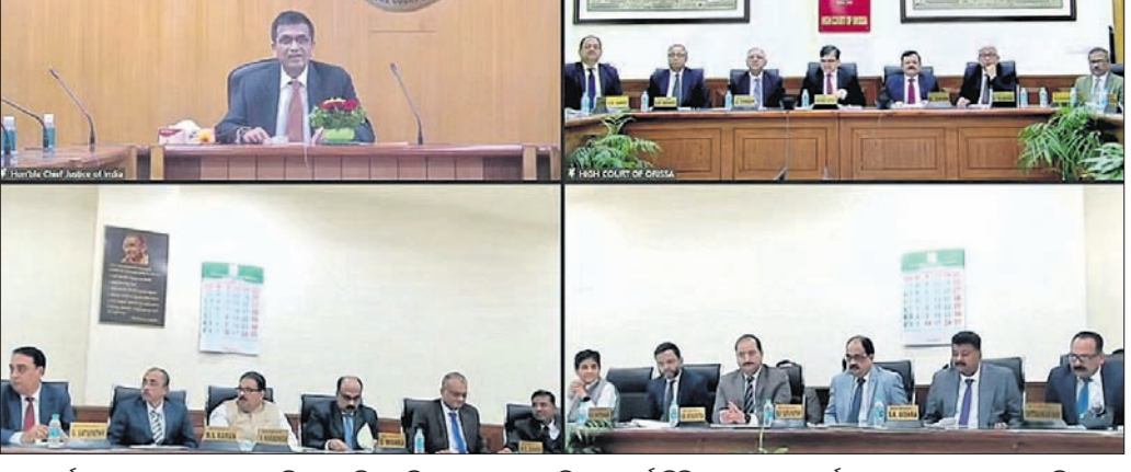
ଭର୍ଚୁଆଲ ମାଧ୍ୟମରେ ପ୍ରଧାନ ବିଚାରପତି ଡ. ଡି. ଡ୍ରା. ଚନ୍ଦ୍ରବୃତ୍ତ ଜିଲା କୋର୍ଟ ଡିଜିଟାଇଜେସନ କାର୍ଯ୍ୟକ୍ରମକୁ ଉଦ୍ଘାଟନ କରୁଛନ୍ତି।