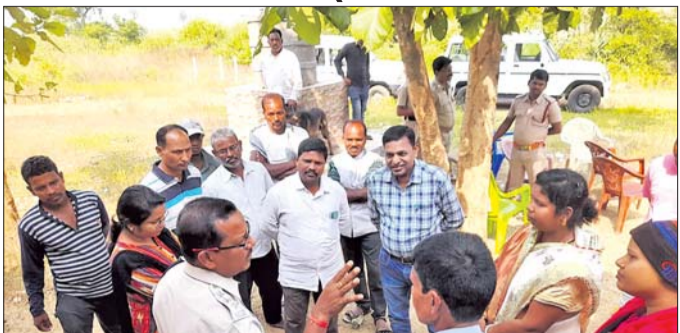
ଡକ୍ତ ଚାଲୁଛି ।