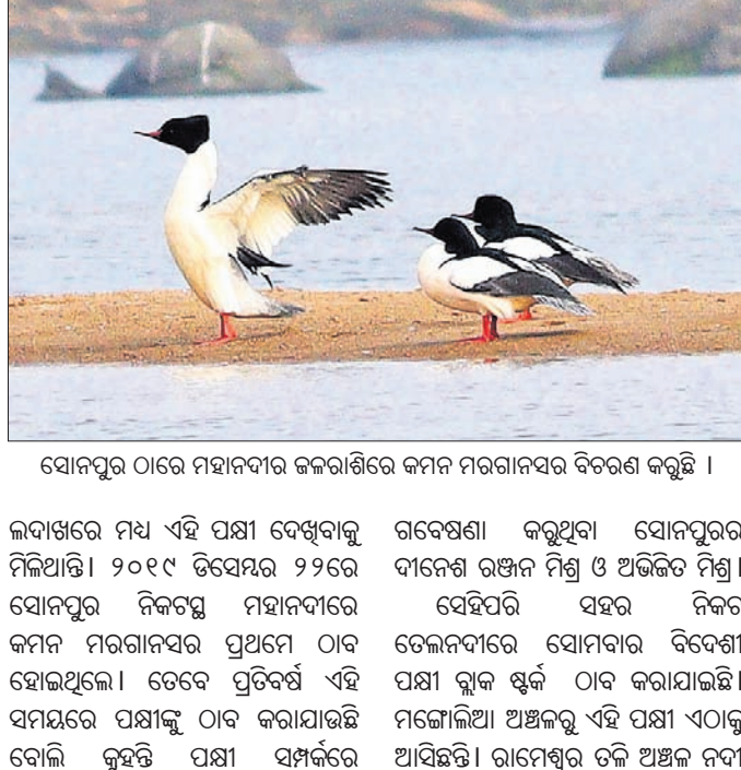
ସୋନପୁର ଠାଏ ମହାନଦୀର କଳରାଶିରେ କମନ ମରଗାନସର ବିରଳ କରୁଛି ।

ବାଲିରେ ବହୁ ସଂଖ୍ୟକ ଗ୍ଳାକ ବୋଲିବ୍ ଚର୍ଣ୍ଣ ନାମକ ବିଦେଶୀ ପକ୍ଷୀ ଦେଖା ଯାଇଛନ୍ତି । ନିମ୍ନକୁ ପରିବେଶ ଓ ଶିକାରୀଙ୍କ ଭୟ ନଥିବାରୁ ମହାନଦୀରେ ବିଦେଶୀଗଡ ପକ୍ଷୀଙ୍କ ସଂଖ୍ୟା ପ୍ରତିବର୍ଷ ବଢିବାରେ ଲାଗିଛି । ଗ୍ଳାକ ବୋଲିବ୍ ଚର୍ଣ୍ଣ ନାମକ ପକ୍ଷୀ ବର୍ତ୍ତମାନ ଇନ୍ଦ୍ରନାଗନାଳ ଯୁନିୟନ ଅଫ କନକଭଣ୍ଡେନ ଅଫ ନେତର ଦ୍ଵାରା ଏକ ବିରଳ ପକ୍ଷୀ ଭାବେ ସ୍ଥାନ ୨୮୪ରୁ ଉର୍ଦ୍ଧ୍ୱ ପ୍ରକାଶିତ ଦେଶୀ ବିଦେଶୀ ପକ୍ଷୀ ଠାଏ ହୋଇଛନ୍ତି । ଏହି ପକ୍ଷୀମାନଙ୍କ ମଧ୍ୟରୁ ୩୦ରୁ ୩୫ ପ୍ରକାରି ବିଦେଶୀ ପକ୍ଷୀ ଅଛି । ବିଦେଶୀଗଡ ପକ୍ଷୀଙ୍କ ଆଗମନକୁ ଦୃଷ୍ଟିରେ ରଖି ଜିଲ୍ଲା ବାର୍ଡ ହଟ୍ଟଗଡ଼ ଭାବେ ଘୋଷଣା କରିବାକୁ ପରିବେଶବିତ୍ମାନେ ଦାବି କରିଛନ୍ତି ।