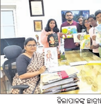
ଜିଲ୍ଲାପାଳଙ୍କୁ ଛାତ୍ରାଛାତ୍ରୀଙ୍କୁ ସାକ୍ଷାତ କରୁଛନ୍ତି।