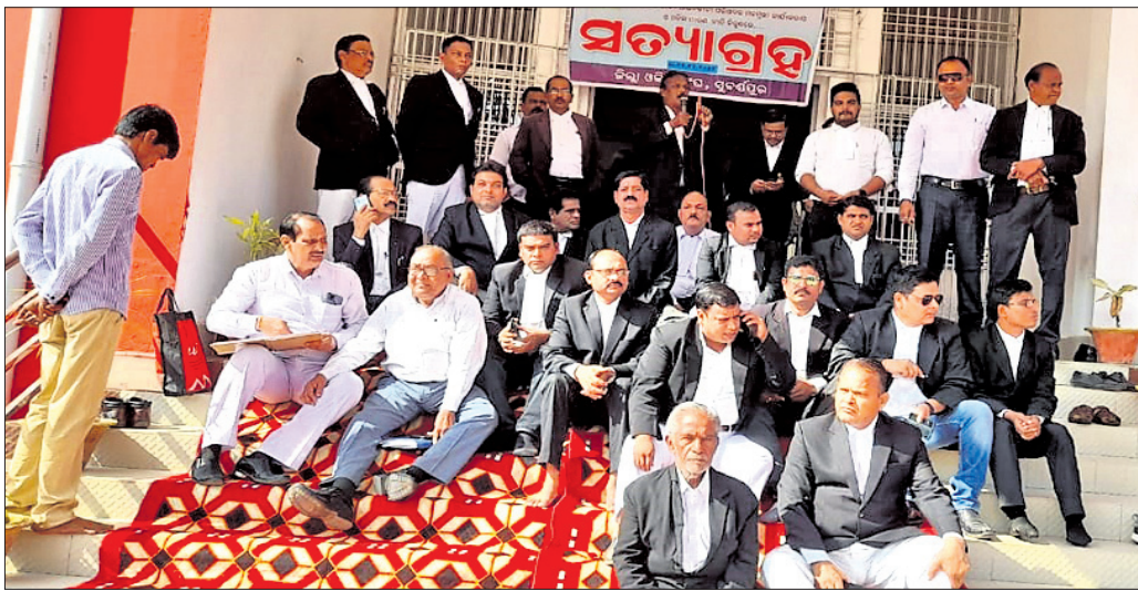
ସୁବର୍ଣ୍ଣପୁର ଜିଲ୍ଲା ଓ ଦୌରା କର୍ଜ୍ୟ କୋର୍ଟ ସମ୍ମୁଖରେ ଓକିଲମାନେ ଧାରଣାରେ ବସିଛନ୍ତି ।

ସୁବର୍ଣ୍ଣପୁର ଜିଲ୍ଲା ଓକିଲ ସଂଘ ପକ୍ଷରୁ ଜିଲ୍ଲା ଓ ଦୌରା କର୍ଜ୍ୟ କୋର୍ଟ ପରିସରରେ ଯୋଗବାର ସତ୍ୟାଗ୍ରହ କରାଯାଇଛି।