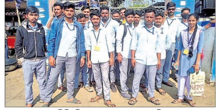
କଳାହାଣ୍ଡି ବିଶ୍ୱ ବିଦ୍ୟାଳୟ ସମ୍ମୁଖରେ ଛାତ୍ରାଛାତ୍ରୀଙ୍କ ବିକ୍ଷୋଭ । ଭବାନୀପାଟଣା, ୧୨।୧୨(ସ.ପ୍ର.)