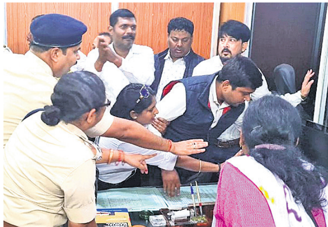
ସମ୍ବଲପୁରରେ ଆନ୍ଦୋଳନେତା କେନେରାଲଙ୍କ କୁଖପୁରଣିକା ଦାହ କରାଯାଇଛି (ବାମ) । ଜିଲ୍ଲା ବୈରାଜକଙ୍କ କୋର୍ଟ ପରିସରକୁ ଆଇନଜୀବୀମାନେ ଧସେଇ ପଶୁଛନ୍ତି ।