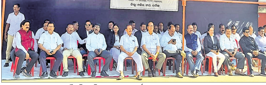
ବୌଦ୍ଧ ଜିଲ୍ଲା ଓକିଲ ସଂଘ ପକ୍ଷରୁ କୋର୍ଟ ଆଗରେ ସତ୍ୟାଗ୍ରହ ଆନ୍ଦୋଳନ ।