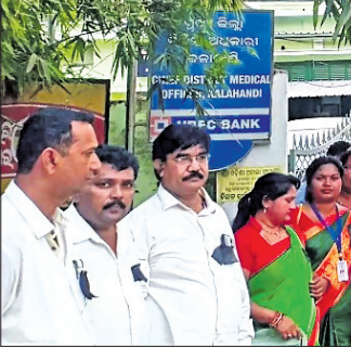
ଭବାନୀପାଟଣାରେ ଦାବିପତ୍ର ଦେବାକୁ ଆସିଥିବା ବହୁମୁଖୀ ସ୍ୱାସ୍ଥ୍ୟକର୍ମୀ/ପରିଦର୍ଶିକା ।

ଭବାନୀପାଟଣା/ନୂଆପଡ଼ା ଅଫିସ, ୧୨।୧୨(ସ.ପ୍ର.) ଓଡ଼ିଶା ପୁରୁଷ ଓ ମହିଳା ବହୁମୁଖୀ ସ୍ୱାସ୍ଥ୍ୟକର୍ମୀ/ପରିଦର୍ଶିକା ମିଳିତ ମହାସଂଘ ପକ୍ଷରୁ ସୋମବାର ୫ଦିନ ଦାବି ନେଇ ଭବାନୀପାଟଣାରେ ଜିଲ୍ଲାପାଳ ଓ ଜିଲ୍ଲା ମୁଖ୍ୟ ଚିକିତ୍ସାଧିକାରୀ (ସିଡିଏମଓ)ଙ୍କୁ ଏକ ଦାବିପତ୍ର ପ୍ରଦାନ କରାଯାଇଛି। ଏଥିରେ ବିଭିନ୍ନ ବିଭାଗ ଅଧୀନ ଥିବା ସମସ୍ତ କର୍ମଚାରୀ ଭଳି ବହୁମୁଖୀ ସ୍ୱାସ୍ଥ୍ୟକର୍ମୀଙ୍କ କ୍ୟାଡର ପୂର୍ଣ୍ଣରୂପେ କରି ବହୁମୁଖୀ ସ୍ୱାସ୍ଥ୍ୟକର୍ମୀମାନଙ୍କ ଚାକିରି କାଳରେ ସର୍ବନିମ୍ନ ୪ଟି ପଦୋତ୍ତର ଦିଆଯିବ,