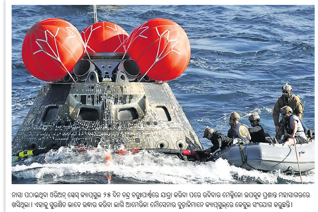
ନାସା ପଠାଇଥିବା ଓଡିଆନ୍ ହେଭି କ୍ୟାପ୍ସୁଲ୍ ୨୫ ଦିନ ଚନ୍ଦ୍ର ଚତୁର୍ଥପାର୍ଶ୍ଵରେ ଯାତ୍ରା କରିବା ପରେ ଉଡିଆନ୍ ମେଡିକାଲ ଉପକ୍ରମ ପ୍ରସାନ୍ତ ମହାସାଗରରେ ଖସିଥିଲା । ଏହାକୁ ପୁରୁଷିତ ଭାବେ ଉଦ୍ଧାର କରିବା ଲାଗି ଆମେରିକା ନୌସେନାର ରୁଡିମାରିନୋ କ୍ୟାପ୍ସୁଲ୍ରେ କେନ୍ଦ୍ରୀୟ ସଂଯୋଗ କରାଯାଇଛି ।

ପୁଚ୍ଚେନ୍ ବର୍ଷ ଶେଷ ଖବରଦାତା ସମ୍ମିଳନୀ କରିବେନି ।