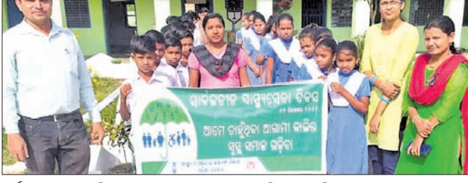
ସାର୍ବଜନୀନ ସ୍ଵାସ୍ଥ୍ୟ ଦିବସ ପାଳନ ଅବସରରେ ବାହାରିଥିବା ରାଲି ।