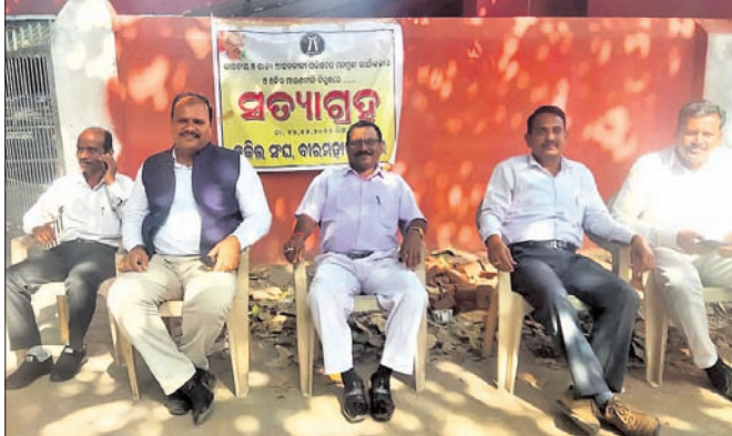
କୋର୍ଟ ସମ୍ମୁଖରେ ଆଇନଜୀବୀମାନେ ।

ପୁସ୍ତକକୋର୍ଟ ଆଇନଜୀବୀଙ୍କ ବିରୋଧରେ ଦେଇଥିବା ରାୟକୁ ପ୍ରତ୍ୟାହାର ଦାବିରେ ରାଜ୍ୟର ବିଭିନ୍ନ ସ୍ଥାନରେ ଆଇନଜୀବୀମାନେ ଆନ୍ଦୋଳନ ଓ ସତ୍ୟାଗ୍ରହ କରିଛନ୍ତି।