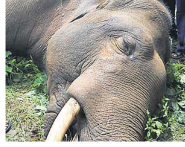
ଭୁବନେଶ୍ୱର, (ବୁଧବାର)/କଟକ ଅଫିସ୍, ୧୩/୧୨