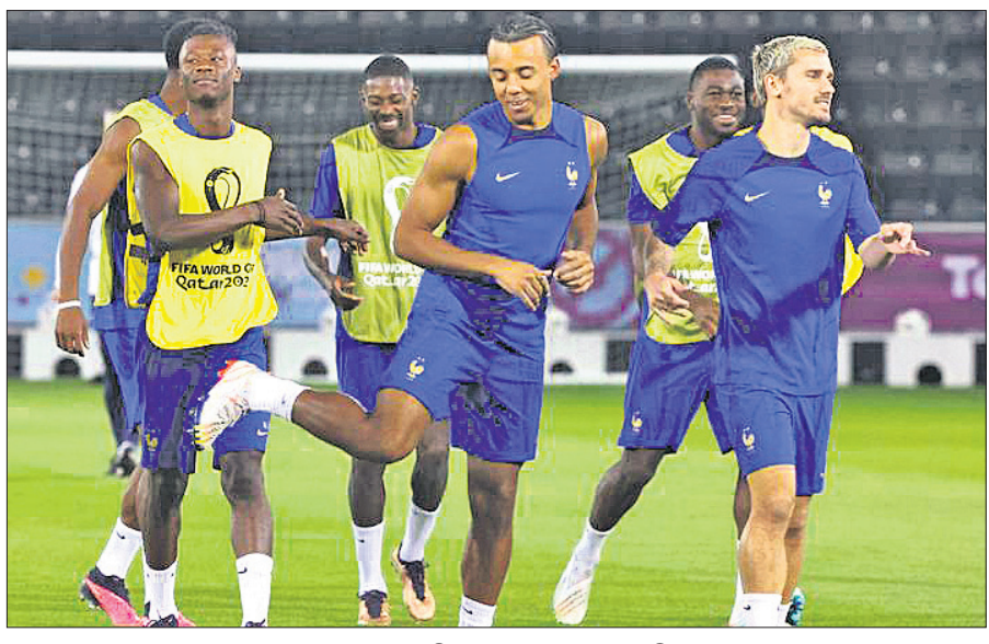
ଅଲ୍ ବାୟଟ୍ ଷ୍ଟାଡିୟମରେ ପ୍ରାନ୍ତ ଦଳର ଟ୍ରେନିଂ।