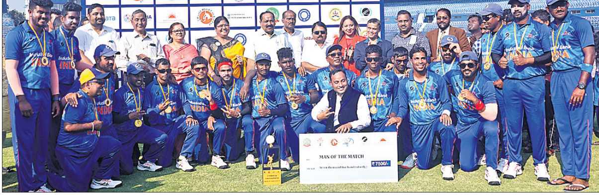
ପୁରସ୍କାର ଗ୍ରହଣ ଉତ୍ସବରେ ଅତିଥିକ ଗଣ୍ଡରେ ଭାରତୀୟ ଦୃଷ୍ଟିବାଧିତ କ୍ରିକେଟ ଦଳ।