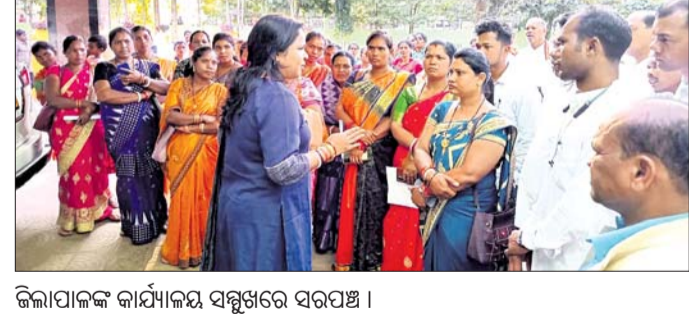
ଜିଲ୍ଲାପାଳଙ୍କ କାର୍ଯ୍ୟାଳୟ ସମ୍ମୁଖରେ ସରପଞ୍ଚ।