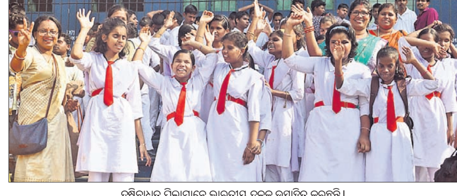
ଦୃଷ୍ଟିବାଧିତ ପିଲାମାନେ ଭାରତୀୟ ଦଳକୁ ଉତ୍ସାହରେ କରୁଛନ୍ତି।