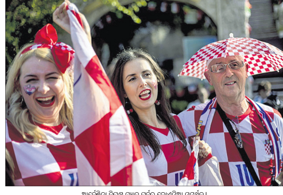
ଆଲେକ୍ସିନ୍ଦ୍ରା ବିପକ୍ଷ ମ୍ୟାଚ ପୂର୍ବରୁ ଟ୍ରୋଫିଆ ସମର୍ଥକ।

ବୋହା, ୧୩୧୨ (ପି.ଟି.) ଚଳିତ ଫିଫା-୨୦୨୨ର କ୍ୱାର୍ଟର ଫାଇନାଲରୁ ଲକ୍ଷ୍ୟ ବିପକ୍ଷ ନେବା ପରେ କୋଚ ତଥା ମ୍ୟାନେଜର ଗାରେଥ୍ ସାଉଥ୍‌ଗେଟ୍‌ଙ୍କ ଭବିଷ୍ୟତକୁ ନେଇ ପ୍ରକାଶ ପାଇଛି ଅନିଶ୍ଚିତତା। ସାଉଥ୍‌ଗେଟ୍‌ଙ୍କ କଣ୍ଠାକୁ ଡିସେମ୍ବର ୨୦୨୪ ଯାଏ ରହିଛି। ତେବେ ପ୍ରାନ୍ତ ନିକଟରୁ ୨-୧ରେ ହାରିବା ପରେ ସେ ଓହରିବା ନେଇ ଆଲୋଚନା ହେଉଛି। ତେବେ ସାଉଥ୍‌ଗେଟ୍‌ କହିଛନ୍ତି, ଦଳର ହିଟ ପାଇଁ ସେ ଆବଶ୍ୟକ ନିଷ୍ପତ୍ତି ନେବେ। କୌଣସି ଚୁନିମେଣ୍ଟ ଶେଷ ହେବା ପରେ ତୁରନ୍ତ ନିଷ୍ପତ୍ତି ନେବା ଅନାବଶ୍ୟକ। ଭାବପ୍ରକାଶ ହୋଇ କୌଣସି ନିଷ୍ପତ୍ତି ନେବା ଠିକ୍ ନୁହେଁ। ପ୍ରଥମେ ଲକ୍ଷ୍ୟ ଫେରିବା ପରେ ବୋର୍ଡ୍ ସହିତ ସେ ଏ ସମ୍ପର୍କରେ ଆଲୋଚନା କରିବେ ବୋଲି ସାଉଥ୍‌ଗେଟ୍‌ କହିଛନ୍ତି। ୨୦୧୬ରେ ସାଉଥ୍‌ଗେଟ୍‌ ଦାୟିତ୍ୱ ଗ୍ରହଣ କରିବା ପରେ ଲକ୍ଷ୍ୟ ଦଳର ପ୍ରଦର୍ଶନ ବେଶ୍ ବଢ଼ିଆ ରହିଛି। ଆଇସ୍‌ଲ୍ୟାଣ୍ଡ ନିକଟରୁ ପରାଜୟ ଓ ସାମ୍ ଆଲର୍ସିୟ ଫିଫିଂ ଷ୍ଟାଣ୍ଡାଲ ସମୟରେ ହିଁ ସେ ଦଳକୁ ସମାପ୍ତ କଲେ। ଏହାପରେ ଦଳ ୨୦୧୮ ରୁଷିଆ ବିଶ୍ୱକପରେ ସେମିଫାଇନାଲରେ ପ୍ରବେଶ କରିଥିବା ବେଳେ ଚଳିତବର୍ଷ ମୁରୋପା ଚାମ୍ପିୟନଶିପରେ ରନର ଅପ୍ ହୋଇଥିଲା। ସାଉଥ୍‌ଗେଟ୍‌ଙ୍କ ରକ୍ଷଣାତ୍ମକ ଖେଳଶୈଳୀ ଉପରେ ପ୍ରଶଂସା ସୃଷ୍ଟି ହେଉଥିଲେ ମଧ୍ୟ ପ୍ରାନ୍ତ ବିପକ୍ଷ ମ୍ୟାଚରେ ଲକ୍ଷ୍ୟ ସମ୍ପୂର୍ଣ୍ଣ ଆକ୍ରମଣାତ୍ମକ ପ୍ରଦର୍ଶନ କରିଥିଲା। ଦଳର ବଲ୍ ପକ୍ଷେ ମ୍ୟାଚ ଆଉ ଗଠନରେ ଶବ୍ଦ ପ୍ରାନ୍ତକୁ ଅଧିକ ଥିଲା। ୮୪ତମ ମିନିଟ୍‌ରେ ହ୍ୟାନ୍ସ କେନ୍‌ସ୍‌ ପେନାଲ୍ଟି କିକ୍ ମିସ୍ ହୋଇ ନ ଥିଲେ ମ୍ୟାଚର ଫଳାଫଳ ଭିନ୍ନ ହୋଇଥାନ୍ତା। ଅନ୍ୟପକ୍ଷରେ ସାଉଥ୍‌ଗେଟ୍‌ଙ୍କ ନେତୃତ୍ୱରେ ଦଳ ବଢ଼ିଆ ପ୍ରଦର୍ଶନ କରୁଛି ବୋଲି କହିଛନ୍ତି ଅଧିନାୟକ ହ୍ୟାନ୍ସ କେନ୍‌ସ୍‌। ପେନାଲ୍ଟି କିକ୍ ମିସ୍ କରିଥିବା ପରାଜୟ ପାଇଁ ନିଜକୁ ଦାୟୀ କରିଛନ୍ତି କେନ୍‌ସ୍‌। ଏହା ସହିତ ଲୁଡ୍ ବେଲିଂହାମ୍, ବୁନାୟୋ ସାକା ଓ ମାର୍କସ୍ ରାଶଫୋର୍ଡ୍‌ଙ୍କ ପରି ଯୁବ ଖେଳାଳିଙ୍କ ଉପସ୍ଥିତିରେ ଦଳ ଅଧିକ ଶକ୍ତିଶାଳୀ ମନେହେଉଛି।