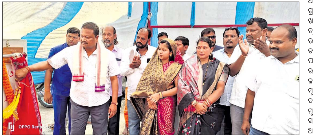
ପାନୀୟ ପ୍ରକଳ୍ପର ଭିତ୍ତିପ୍ରସ୍ତର ସ୍ଥାପନ କରୁଛନ୍ତି ମନ୍ତ୍ରୀ।