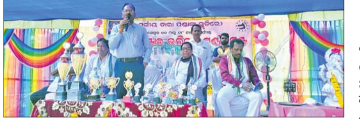
ଖେଳାଳିଙ୍କ ସହ ଅତିଥି।