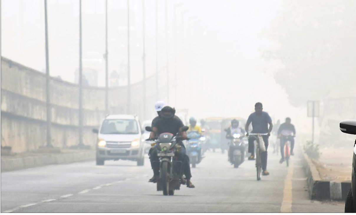
ମଙ୍ଗଳବାର ପୂର୍ବାହ୍ନରେ ଭୁବନେଶ୍ୱରରେ ଘନ କୁହୁଡ଼ିର ଦୃଶ୍ୟ।

ଆଜି ଡିସେମ୍ବର ୧୪ ତାରିଖ, ଜାତୀୟ ଶକ୍ତି ସଂରକ୍ଷଣ ଦିବସ, ପୌଷ କୃଷ୍ଣ ଷଷ୍ଠୀ ରୁଧବାର, ରାଶିନକ୍ଷତ୍ର-ମଘା/ସିଂହ, ଷଷ୍ଠୀର ଏକୋଦଶି ଓ ପାର୍ବଣ ଶ୍ରାବଣ ଅତ୍ୟ ମଘା ନକ୍ଷତ୍ର ବିବାହ ପାଣିଗ୍ରହଣ। ସକାଳ ୧.୦୬.୧୬ମି. ଗତେ ୧.୦୮.୨୬ମି. ମଧ୍ୟେ, ୧.୧୦.୩୬ମି. ଗତେ ୧.୧୧.୪୧ମି. ମଧ୍ୟେ ଶୁକ୍ଳ ଶୁଭବେଳା ଦିବା ୧.୧୧.୪୧ମି. ଗତେ ୧.୦୧.୦୭ମି. ମଧ୍ୟେ ରାତ୍ନ କାଳ।