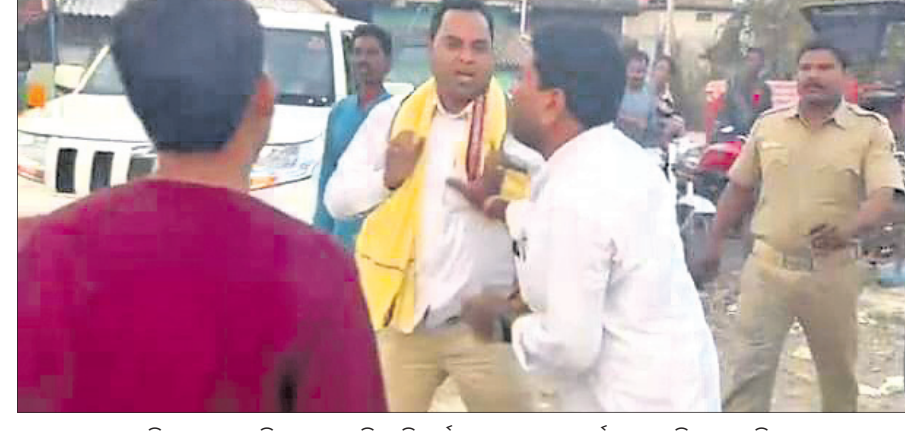
ବିଧାନସଭା ଗଢ଼ିବା ପାଇଁ ସମସ୍ତଙ୍କୁ ନେଇ କର୍ମୀମାନେ ଭାଜପା କର୍ମୀଙ୍କୁ ମାତ୍ର ପାରିଥିବା କହିଛନ୍ତି।

ବିଧାନସଭା ଅଧିବେଶନ, ୧୩।୧୨ ବିଧାନସଭା କିଛି ଦିନ ପୂର୍ବରୁ ନିର୍ବାଚନ ପାଇଁ ପ୍ରସ୍ତୁତ ହେବା ପରେ ବିଧାନସଭା ଗଢ଼ିବା ପାଇଁ ଲୋକସାହିତ୍ୟ ବିଧାନସଭା ଗଢ଼ିବାକୁ ଅଣ୍ଟାମାଡ଼ କରିବା ସହ ଭାଜପା କର୍ମୀଙ୍କୁ ମାତ୍ର ପାରିଥିବା ନେଇ ପୂର୍ବରୁ କହିଥିଲେ। ଏହା ପରେ ବିଧାନସଭା ଗଢ଼ିବା ପାଇଁ ଲୋକସାହିତ୍ୟ ବିଧାନସଭା ଗଢ଼ିବାକୁ ଅଣ୍ଟାମାଡ଼ କରିବା ସହ ଭାଜପା କର୍ମୀଙ୍କୁ ମାତ୍ର ପାରିଥିବା ନେଇ ପୂର୍ବରୁ କହିଥିଲେ। ଏହି ଘଟଣାକୁ ନେଇ ବିଧାନସଭା ମହାଲିଙ୍ଗ ଏକ ଖବରଦାତା ସମ୍ମିଳନୀ ଡାକି ବିଜେଡି କର୍ମୀଙ୍କୁ ରୁଣ୍ଡାଗର୍ଦ୍ଦି, ଅଭିଯୋଗ କରିଛନ୍ତି। ଏହି ସବୁ ଘଟଣାରେ ବିଜେଡି କର୍ମୀ, ନେତା, ମିଲିଟି ଏବଂ ସରକାରୀ ବାହୁଡ଼ାମାନେ ସାମିଲ ଅଛନ୍ତି ବୋଲି ସେ କହିଛନ୍ତି। ଲୋକସାହିତ୍ୟ ବିଧାନସଭା ଗଢ଼ିବା ପାଇଁ ଲୋକସାହିତ୍ୟ ବିଧାନସଭା ଗଢ଼ିବାକୁ ଅଣ୍ଟାମାଡ଼ କରିବା ସହ ଭାଜପା କର୍ମୀଙ୍କୁ ମାତ୍ର ପାରିଥିବା ନେଇ ପୂର୍ବରୁ କହିଥିଲେ।