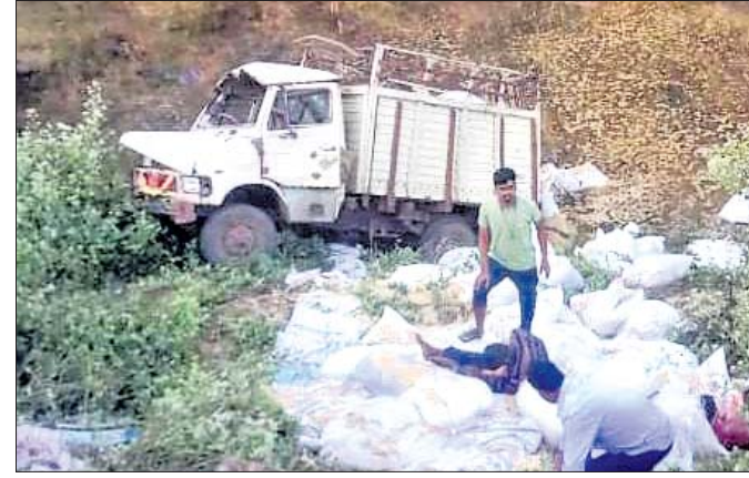
କେନାଲ ଭିତରକୁ ଓଲଟିଥିବା ଧାନ ବୋଝେଇ ଗାଡ଼ି।

କାମବେତା ପଞ୍ଚାୟତ ଅଧିକ ନିକଟରେ ଭାରସାମ୍ୟ ହରାଇ ଏକ କେନାଲ ଭିତରକୁ ଓଲଟି ପଡ଼ିଥିଲା।