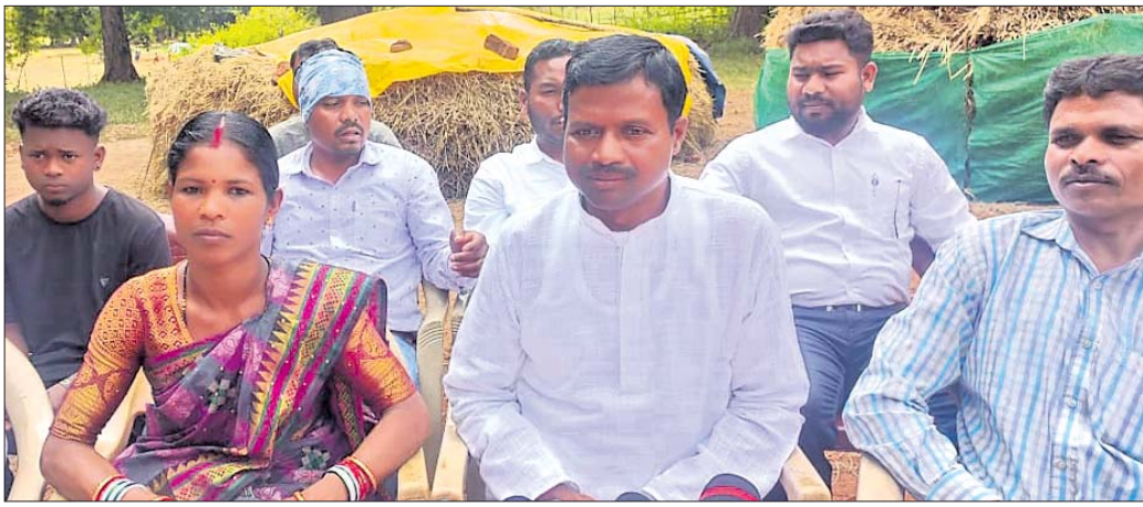
ଖବରଦାତା ସମ୍ମିଳନୀରେ ମାଲି ପର୍ବତ ପୁରୁଷା ସମିତିର କର୍ମକର୍ମୀ।