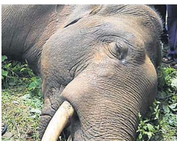
ଭୁବନେଶ୍ୱର, (ବୁଧବାର)/କଟକ ଅଫିସ୍, ୧୩/୧୨