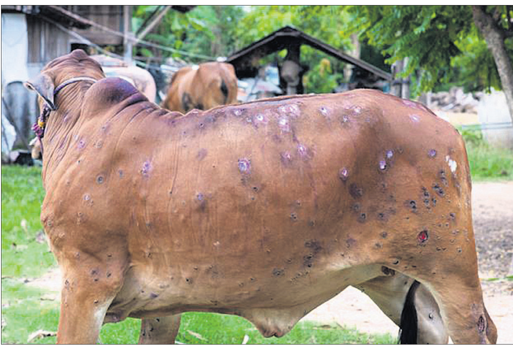
ଲକ୍ଷ୍ମି ଚର୍ମରୋଗର ଲକ୍ଷଣ

ଶରୀରରେ ଶକ୍ତ, କଠିନ, ଗଣ ଧରଣର ଆରୁ ବାହାରେ । ଏତଦ୍‌ବ୍ୟତୀତ ପାଟି, ପାଟି ଭିତର, ଶ୍ୱାସନଳୀ ଆଦିରେ ମଧ୍ୟ କ୍ଷତ ସୃଷ୍ଟି ହୁଏ । ଏହି ଆରୁଗୁଡ଼ିକ ସାଧାରଣତଃ ଦେଖିବାକୁ କଳାରଙ୍ଗର ଏବଂ ଚିପିଲେ ଗଣ ପରି ଲାଗେ । ଛୋଟ ଆରୁଗୁଡ଼ିକ ଧୀରେ ଧୀରେ ବଡ଼ ଆରୁଗୁରେ ପରିଣତ ହେବା ପରେ ପାଟିଯାଇ ଘା' ସୃଷ୍ଟି ହୁଏ ଏବଂ ଚିକିତ୍ସା ନ କଲେ ଏହା ପୋକପା ଘା'ରେ ପରିଣତ ହୁଏ । ଏଥିଯୋଗୁ ଗୋରୁଙ୍କର କ୍ଷୁଧା ଶକ୍ତି କମିଯାଏ ଶରୀର ଦୁର୍ବଳ ଦିଶେ । ଲକ୍ଷ୍ମି ଗ୍ରନ୍ଥୀମାନ ପୁଲିଯାଏ । ଗୋଟିରେ ମଧ୍ୟ ବେଳେବେଳେ ଫୁଲ ପଡ଼େ । ଗର୍ଭିଣୀ ଗାଈଙ୍କର ଗର୍ଭପାତ ହୁଏ । ଗୋରୁ ଚାଲିଲାବେଳେ କଷ୍ଟ ଅନୁଭବ କରନ୍ତି । ସଂକ୍ରମିତ ଗୋରୁର ଯତ୍ନ ନେଲେ ଏହା ୨ ରୁ ୩ ସପ୍ତାହ ମଧ୍ୟରେ ଆରୋଗ୍ୟଲାଭ କରେ । ଏହି ରୋଗର ସଂକ୍ରମଣ ହାର ୧୦ ରୁ ୨୦% ଏବଂ ମୃତ୍ୟୁହାର ହେଉଛି ୧ ରୁ ୫% ।