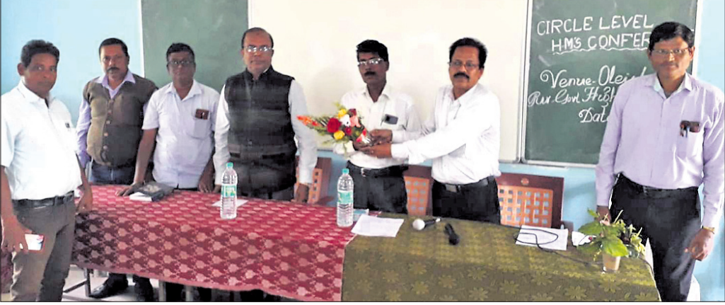
ସର୍କଲସ୍ତରୀୟ ପ୍ରଧାନ ଶିକ୍ଷକ ସମ୍ମିଳନୀରେ ମହାସଭା ଅନୁଷ୍ଠିତ ହୋଇଛି ।

ଯାଜପୁର ଜିଲ୍ଲା ପରିଷଦ ପକ୍ଷରୁ ହୋଟେଲ କର୍ମଚାରୀଙ୍କୁ ଅପହରଣ କରାଯାଇଛି ।