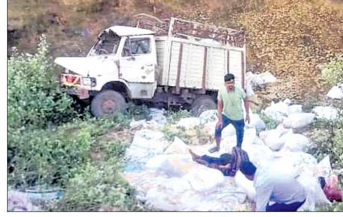
କେନାଲ ଭିତରକୁ ଖସିପଡ଼ିଥିବା ଧାନ ବୋଝେଇ ଗାଡ଼ି।

ମାଲକାନଗିରି ଜିଲ୍ଲା କୋରୁକୋଣ୍ଡା ବ୍ଲକ୍ କାମବେତା ପଞ୍ଚାୟତ ଚିମିଟାପାଲି ଗ୍ରାମ ନିକଟରେ ଏକ ଧାନ ବୋଝେଇ ଗାଡ଼ି ମଙ୍ଗଳବାର ଦୁର୍ଘଟଣାଗ୍ରସ୍ତ ହୋଇଛି।