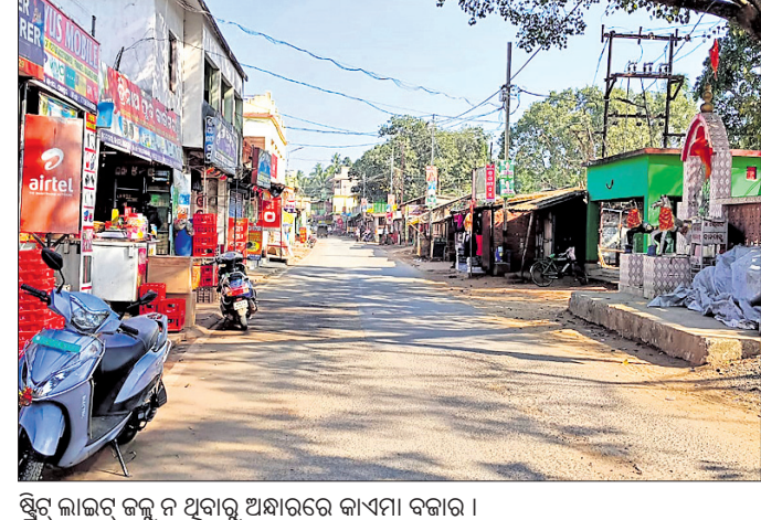
ଅକ୍ଷୟକାଳରେ କାଏମା ବଜାର ଗଢାଯାଇଛି ।

ଯାଜପୁର ଜିଲ୍ଲା ପରିଷଦ ପକ୍ଷରୁ ଅକ୍ଷୟକାଳରେ କାଏମା ବଜାର ଗଢାଯାଇଛି ।