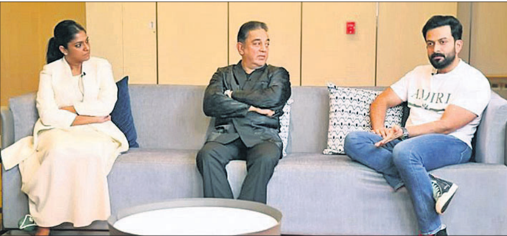
ଭୁବନେଶ୍ୱର, ୧୩/୧୨ (ବୁଧବାର)

ଓଡ଼ିଆ ଚଳଚ୍ଚିତ୍ରକୁ ନେଇ ଜାତୀୟ ସ୍ତରରେ ଆଲୋଚନା ଆରମ୍ଭ ହୋଇଛି। ଏହାର ଏକ ଭିତ୍ତି ମଞ୍ଜୁରୀ ପାଇଁ ଆଲୋଚନା ହେଉଛି।