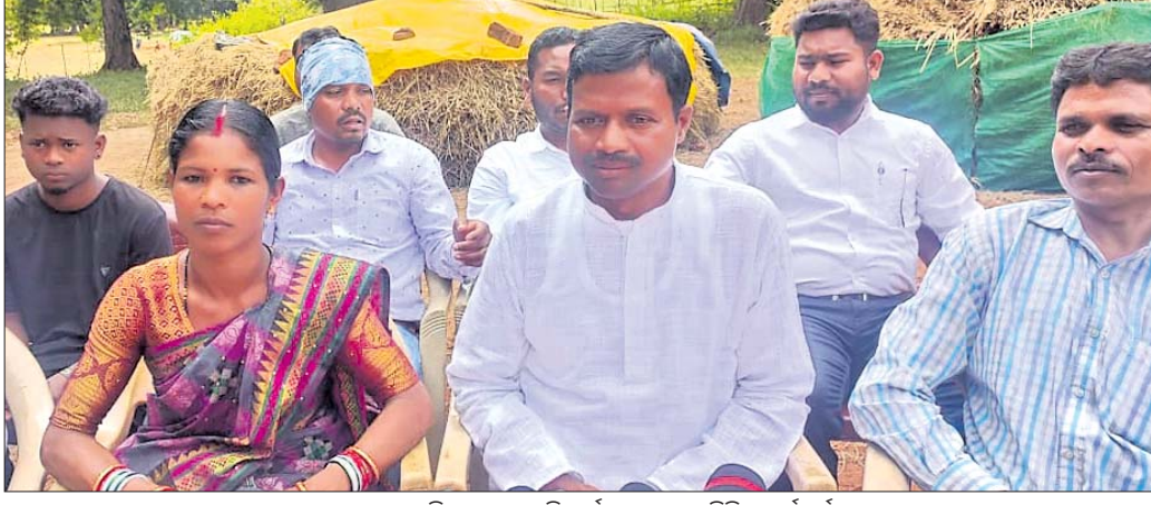
ଖବରଦାତା ସମ୍ମିଳନୀରେ ମାଲି ପର୍ବତ ପୁରୁଷା ସମିତିର କର୍ମକର୍ମୀ।

ବରଷା ଲାଗି ଉତ୍ତର ଧାନ ଅନ୍ତର୍ଗତ ଖେତପାଇଁ (ବୁଢ଼ିଲା) ଛାଡ଼ି ଜିଲ୍ଲା ମୁଖ୍ୟ ଚିକିତ୍ସାଳୟ ନିକଟରେ ଯୋଗଦାନ ଦିଲ୍ଲୀରେ ରାତିରେ ଏକ ହତ୍ୟାକାଣ୍ଡ ଘଟିଛି।