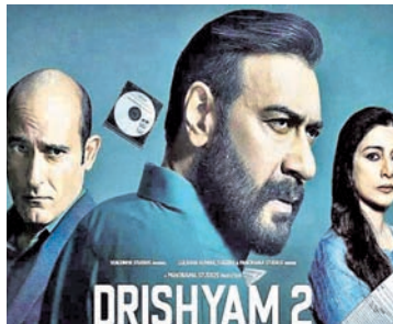
ଅବାବେଳେ ବିତୀୟରେ ରହିଛି ଦ କମ୍ପାର ପାଇଁ । ଫିଲ୍ମରେ ସାଉଥ ଫିଲ୍ମ ଅଭିନେତ୍ରୀ