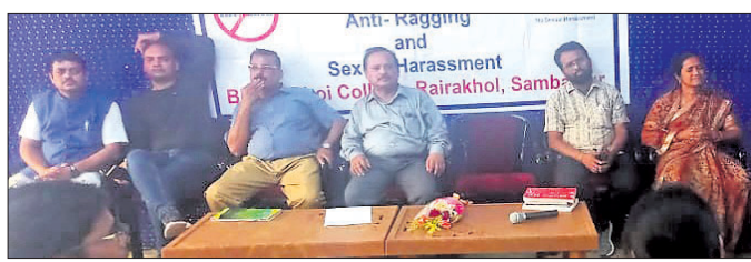
କାର୍ଯ୍ୟକ୍ରମରେ ଯୋଗଦେଇଥିବା ଅତିଥିମାନେ।