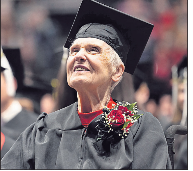
କହିଛନ୍ତି, ଆଜି ଯେତେବେଳେ ସମସ୍ତେ 'କାହିଁକି' ବୋଲି ପ୍ରଶ୍ନ କରିବା ଶିକ୍ଷା ସମ୍ପୂର୍ଣ୍ଣ କରିବା କଥା ପ୍ରକାଶ ପରିବର୍ତ୍ତେ 'କାହିଁକି ନୁହେଁ' କହିଥିଲେ । କରିଥିଲେ, ସେତେବେଳେ ପରିବାରର ଶିକ୍ଷାର କେବେ ଶେଷ ନ ଥାଏ ।

ଓଡ଼ିଶାରେ ସହ ସମ୍ପର୍କକୁ ଚାକର ୬ ପିଲା ଜନ୍ମ ହୋଇଥିଲେ । ପିଲାଙ୍କ ଲାଳନପାଳନ ଓ ଘର କଥା ବୁଝାବୁଝି ଭିତରେ ସେ ଆଉ ପାଠ ପଢ଼ିବାକୁ ସମୟ ପାଇ ନ ଥିଲେ । ଅଧୁରା ପାଠ ସମ୍ପୂର୍ଣ୍ଣ କରିବା ପାଇଁ ପରିବାର ଲୋକେ ବୁଝାଇବା ପରେ ୨୦୧୯ରେ ସେ ପୁଣି ପଢ଼ିବାକୁ ଆଗ୍ରହ ପ୍ରକାଶ କଲେ । ସାଇତି ରଖିଥିବା ପୁରୁଣା ଷ୍ଟୁଡେଣ୍ଟ ଆଇଡି କାର୍ଡ ଧରି ସେ ପୁନର୍ବାର ନର୍ଦନ ଜାଲିୟତ୍ସ ୟୁନିଭର୍ସିଟିରେ ପାଠପଢ଼ା ଆରମ୍ଭ କରିଥିଲେ । ସାତେ ୩ ବର୍ଷର ଅଧ୍ୟୟନ ବେଳେ ସେ ନିକଟସ୍ଥ ଏକ ଚର୍ଚ୍ଚିତ ଡିଏମ୍ ଫିଲ୍ମକୁ ଭେଟିଥିଲେ । ଦୁଇଟି ମଧ୍ୟରେ ବନ୍ଧୁତା ଶେଷରେ ପ୍ରେମର ରୂପ ନେଇଥିଲା । ୧୯୫୫ରେ ହୁସୈ ବିବାହ ବନ୍ଧନରେ ବାସି ହୋଇଥିଲେ । ପରବର୍ତ୍ତୀ ସମୟରେ ଫିଲ୍ମରେ ମୁଖ୍ୟ ଭୂମିକାରେ କାମ କରିବା ପରେ ଉଚ୍ଚ ଡିପାର୍ଟମେଣ୍ଟକୁ ବିବାହ କରିଥିଲେ । ବିତୀୟ ସ୍ୱାମୀଙ୍କ