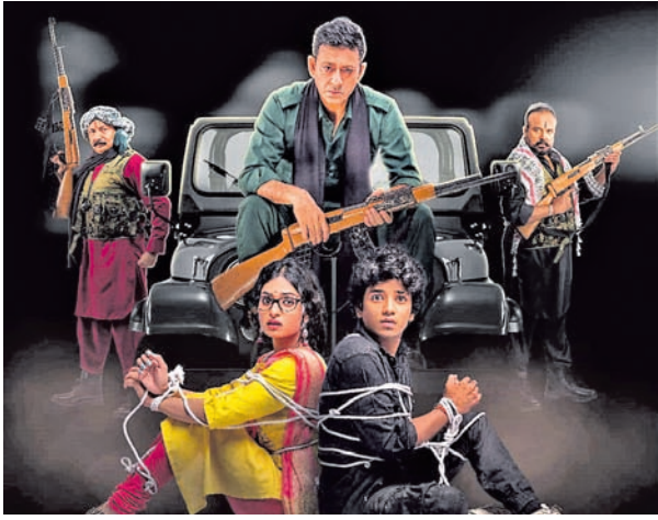
'ତୋର ମୋର କଟି' ଫିଲ୍ମର ଏକ ଦୃଶ୍ୟ

ଝିଲକ ମୋକ୍ଷ ପିଲାଙ୍କ ବ୍ୟାନ୍ଦରରେ ନିର୍ଦ୍ଦେଶିତ ତୃତୀୟ ଚଳଚ୍ଚିତ୍ର 'ତୋର ମୋର କଟି' ଆସନ୍ତା ଜାନୁଆରୀରେ ମୁକ୍ତିଲାଭ କରିବ ବୋଲି ପ୍ରଯୋଜନା ସଂସ୍ଥା ପକ୍ଷରୁ ସୂଚନା ଦିଆଯାଇଛି।