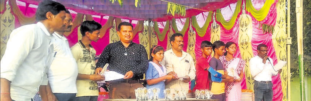
ସାହେବା ଉଚ୍ଚବିଦ୍ୟାଳୟରେ ଅତିଥିମାନେ କୃତୀ ପ୍ରତିଯୋଗୀଙ୍କୁ ପୁରସ୍କୃତ କରୁଛନ୍ତି।