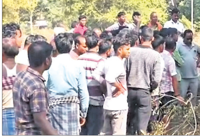
ଯୁବକଙ୍କ ମୃତଦେହକୁ ଗ୍ରାମବାସୀ ଘେରି ରହିଛନ୍ତି।

ଝାରସୁଗୁଡ଼ା ଜିଲ୍ଲା ରେଙ୍ଗାଲି ଥାନା ଚାଣ୍ଡିପାଲି ଗ୍ରାମ ନିକଟ କ୍ଷେତରୁ ରୂପବାର ପୋଲିସ୍ ଜଣେ ଯୁବକଙ୍କ ଶତଦିକ୍ଷିତ ମୃତଦେହ ଜବତ କରିଛି।