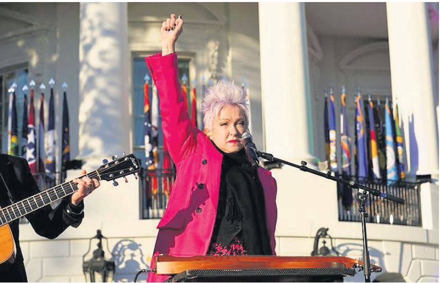
ବୈଦିକ ରେକର୍ଡ଼ ଫର ଦି ମ୍ୟାରେକ୍ ଆକ୍ସର ସାକ୍ଷର କରିବା ପରେ ଫାଇଟ୍ ଲେଡ଼ିଜ୍ ବାଲଡେନ୍, ହାଉସ୍ ସ୍ପିକର ନାହିଁ ପେଲୋସି, ଉପରାଷ୍ଟ୍ରପତି କମଲା ହାରିସ ଓ ଅନ୍ୟମାନଙ୍କ ସହ ଆମେରିକା ରାଷ୍ଟ୍ରପତି ଜୋ ବାଇଡେନ୍ । ସମଲିଙ୍ଗୀ ବିବାହ ବିଲ୍ ଆଇନରେ ପରିଣତ ହେବା ପରେ ହାଇଡ଼ ସ୍ପାଉସ୍ ସାଥୀ ଲନରେ ଆୟୋଜିତ ସିଙ୍ଗିଙ୍ଗ୍ ସେରେମନିରେ ଆମେରିକାୟ ମ୍ୟୁଜିସିଆନ୍ ସିଦ୍ଧି ଲାଉପେଡ଼ ଦର୍ଶକମାନଙ୍କୁ ସାମ୍ବୋଧ୍ୟ କରୁଛନ୍ତି ।