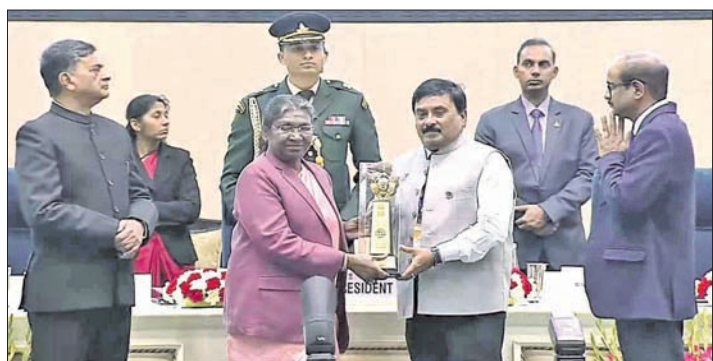
ରାଷ୍ଟ୍ରପତିଙ୍କ ଦ୍ୱାରା ରାଉରକେଲା ଜିଲ୍ଲା କାରଖାନା ପୁରସ୍କୃତ