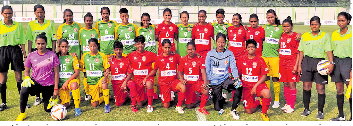
ଓଡ଼ିଶା ଓମେନ୍ସ ଲିଗରେ ରୁଧିବାର କ୍ୟାପିଟାଲ ଗ୍ରାଉଣ୍ଡରେ ମ୍ୟାଚ ପୂର୍ବରୁ ଲକ୍ଷ୍ମକୋଷ୍ଠ, ରେଲଫେ ଓ ଓଡ଼ିଶା ପୋଲିସ୍ ଦଳର ଖେଳାଳିମାନେ ରେଫରିଙ୍କ ସହ।