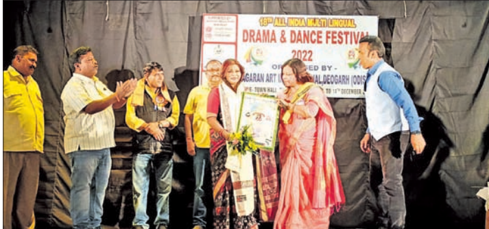
ଦେବଗଡ଼ ଜିଲ୍ଲାର ଅଗ୍ରଣୀ ସାଂସ୍କୃତିକ ଅନୁଷ୍ଠାନ ଜାଗରଣ ଆର୍ଟ ଇଣ୍ଟରନ୍ୟାଶନାଲ ପକ୍ଷରୁ...