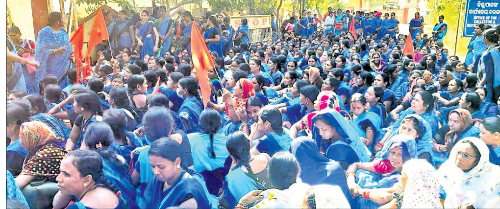
ବରଗଡ଼ ଜିଲ୍ଲାପାଳ ଅଧିକାରୀ ଆଗରେ ଆଶାକର୍ମୀଙ୍କ ଧାରଣା।

ଆଶାକର୍ମୀଙ୍କ ପ୍ରତି ସରକାରୀ ଅଣବେଶ୍ୟା ମନୋଭାବ ପୋଷଣ କରୁଥିବା ଅଭିଯୋଗ ହୋଇଛି। ଏଭଳି ଅଭିଯୋଗ ନେଇ ରୁଧିରା ଭାରତୀୟ ମଜଦୁର ସଂଘ ସହକର୍ଷିତ ଓଡ଼ିଶା ରାଜ୍ୟ ଆଶାକର୍ମୀ ସଂଘ ବରଗଡ଼ ଜିଲ୍ଲା ଶାଖା ପକ୍ଷରୁ ଜିଲ୍ଲାପାଳ ଅଧିକାରୀ ଆଗରେ ବିକ୍ଷୋଭ ପ୍ରଦର୍ଶନ କରାଯାଇଥିଲା। ଏହା ସହିତ ଆଶାକର୍ମୀମାନେ ଜିଲ୍ଲାପାଳ ଅଧିକାରୀ ଆଗରେ ଧାରଣା ଦେଇଥିଲେ।