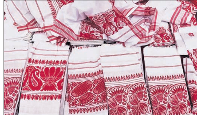
ରାଜ୍ୟବାସୀଙ୍କ ପାଇଁ ଏହା ଗର୍ବର କଥା ବୋଲି ସେ ପ୍ରକାଶ କରିଛନ୍ତି । ଏଥିସହ ଗାମୋଟା ତିଆରି କରୁଥିବା ଲକ୍ଷାଧିକ କର୍ମୀଙ୍କୁ ଉତ୍ସାହିତ କରିବ ।

ଆସାମର ଗାମୋଟାକୁ ଭୌଗୋଳିକ ସାଙ୍କେତିକ (ଜିଆଇ) ମାନ୍ୟତା ମିଳିଛି । ଆସାମର ସଂସ୍କୃତିକୁ ଦର୍ଶାଉଥିବା ଗାମୋଟାକୁ କେନ୍ଦ୍ର ସରକାରଙ୍କ ତରଫରୁ ଏହି ମାନ୍ୟତା ପ୍ରଦାନ କରାଯାଇଛି । ମଙ୍ଗଳବାର କେନ୍ଦ୍ରୀୟ ଅର୍ଥନୀତି ଏବଂ ଶିଳ୍ପ ମନ୍ତ୍ରୀ ପାୟୁଷ ଗୋଏଲ ଚୁଲଚରରେ ପୋଷ୍ଟ ଶେୟାର କରି ଏହି ସୂଚନା ଦେଇଛନ୍ତି । ଉତ୍ତର-ପୂର୍ବୀୟ ଲୋକଙ୍କ ପାଇଁ ଏହା ଖୁସି ମନାଇବାର ପୁସ୍ତକ ବୋଲି ସେ କହିଛନ୍ତି । ଏ ନେଇ ଆସାମ ମୁଖ୍ୟମନ୍ତ୍ରୀ ହେମନ୍ତ ବିଷ୍ଣୁ ଶର୍ମା