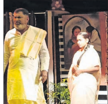
ପୂର୍ଣ୍ଣିମା ଜାଗରଣ ସମ୍ମାନ