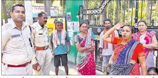
ସଫେଇ କର୍ମଚାରୀମାନେ ପୌର କାର୍ଯ୍ୟାଳୟରେ ତାଲା ପକାଇ ବିକ୍ଷୋଭ ପ୍ରଦର୍ଶନ କରୁଛନ୍ତି।

ବରଗଡ଼ ପୌର ପରିଷଦ ଅଧୀନରେ କାର୍ଯ୍ୟରେ ସଫେଇ କର୍ମଚାରୀଙ୍କୁ ନିୟମିତ ଦରମା ମିଳୁନାହିଁ। ଏହାକୁ ନେଇ ସଫେଇ କର୍ମଚାରୀଙ୍କ ମଧ୍ୟରେ ଅସନ୍ତୋଷ ପ୍ରକାଶ ପାଇଛି। ରୁଧିରା ସଫେଇ କର୍ମଚାରୀମାନେ ପୁଖ୍ୟ ଫାଟକରେ ତାଲା ପକାଇ ପୌର କାର୍ଯ୍ୟାଳୟକୁ ଅଟକ କରି ଦେଇଥିଲେ।