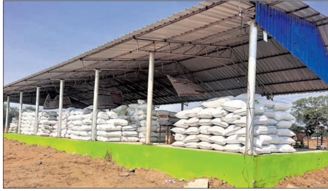
ସତୀଭଗା ମଞ୍ଚରେ ଗଦା ହୋଇ ରହିଥିବା ଧାନ।

ବରଗଡ଼ ଜିଲ୍ଲା ପଦ୍ମପୁର ଉପଖଣ୍ଡରେ ନଭେମ୍ବର ୨୧ତାରିଖରେ ମଞ୍ଚ ଖୋଲିଥିଲା। ଆଖା କରାଯାଉଥିଲା ଖରମ୍ ଧାନ କିଣାଦିକା ସୁରୁଖୁରୁରେ ହେବ। ଚାଷୀ ହରଭାଣ ହେବେନାହିଁ।