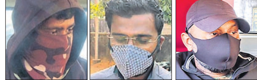
ଗିରଫ ୩ ବନ କର୍ମଚାରୀ।