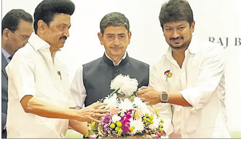
ତାମିଲନାଡୁ ରାଜ୍ୟପାଳ ଆର୍.ଏନ୍. ରବିଙ୍କ ସହ ପୂର୍ଣ୍ଣମନ୍ତ୍ରୀ ଏନ୍.କେ. ଷ୍ଟାଲିନ୍ ଏବଂ ଉପରାଷ୍ଟ୍ରମନ୍ତ୍ରୀ ଷ୍ଟାଲିନ୍ ।

କଂଗ୍ରେସ ପକ୍ଷରୁ ଗାଳିଥିବା ଭାରତ ଯୋଡ଼ା ଯାତ୍ରାରେ ନେତା ରାହୁଲ ଗାନ୍ଧୀଙ୍କ ସହ ଜଣେ ପ୍ରମୁଖ ସଭା ସଭାରେ ଭାଗ ନେଇଛନ୍ତି । ଏହି କ୍ରମରେ ରାଜ୍ୟର ସଭାକୁ ଭାରତୀୟ ଗଣତନ୍ତ୍ର ଦଳ (ଆର୍.ଏ.ଆଇ.)ର ପୂର୍ବତନ ଗଭର୍ଣର ଡ. ରଘୁରାମ ରାଜନ 'ଭାରତ ଯୋଡ଼ା ଯାତ୍ରା'ରେ ନିଜ ରାହୁଲଙ୍କ ସହିତ ପଦଯାତ୍ରା କରିଛନ୍ତି । ରାଜ୍ୟର ସଭାକୁ ନାଥୋପୁରରେ ପଦଯାତ୍ରା