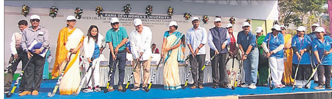
ଉଚ୍ଚଶିକ୍ଷା ମନ୍ତ୍ରୀ ରୋହିତ ପୂଜାରୀ, କ୍ରୀଡ଼ା ମନ୍ତ୍ରୀ ରୁଷାରକାନ୍ତି ବେହେରା ଓ ଅନ୍ୟମାନେ ହଳି ଷ୍ଟିକ୍ ଧରି ପ୍ରତିଯୋଗିତାକୁ ଉଦ୍‌ଘାଟନ କରୁଛନ୍ତି।