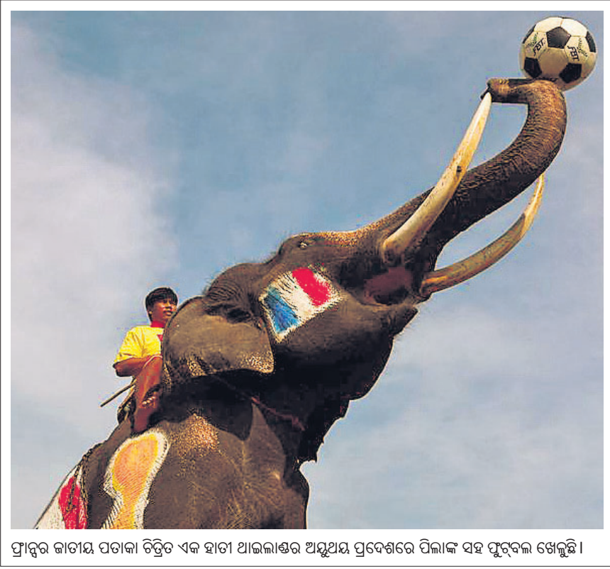
ଫ୍ରାନ୍ସର କାଗମ ପତାକା ବିକ୍ରିତ ଏକ ହାତୀ ଆଇଲ୍ୟାଣ୍ଡର ଅନୁପମ ପ୍ରଦେଶରେ ପିଲାଙ୍କ ସହ ପୁରସ୍କାର ଖେଳୁଛି ।

ପଞ୍ଚାରିସ ରେକର୍ଡ କଲା ନାସାର ପର୍ଯ୍ୟବରାଣ ରୋଭର୍ ୨୦୨୧ ଫେବୃଆରୀରୁ ପର୍ଯ୍ୟବରଣ ରୋଭର୍ କାର୍ଯ୍ୟକ୍ଷମ ଥିବା ସତ୍ତ୍ୱେ କେବେ କୌଣସି ଶବ୍ଦ ରେକର୍ଡ କରିପାରି ନ ଥିଲା । ୨୦୨୧ ସେପ୍ଟେମ୍ବର ୨୭ରେ ଆକସ୍ମିକ ଭାବେ ୧୧୮ ମିଟର ଉଚ୍ଚତା ବିଶିଷ୍ଟ ଏକ ଧୂଳିଝଡ଼ ଏହା ଉପର ଦେଇ ଗତି କରିଥିଲା । ଏଥିର ରୋଭର୍‌ର ସୁପରକ୍ୟାମ୍ ଧୂଳି ଝଡ଼ର 'ଚକ୍ ଚକ୍ ଚକ୍' ଶବ୍ଦକୁ ସାଉଁଟି ସାଇତି ରଖିଛି । ଧୂଳି ଝଡ଼ର ଉଚ୍ଚତା ଓ ବ୍ୟବହାର ସମ୍ପର୍କରେ ଅଧ୍ୟୟନ ପାଇଁ ଆବଶ୍ୟକ କଣିକାର ସଂଖ୍ୟା ଗଣନାରେ ଗବେଷକମାନଙ୍କ କାମରେ ଏହା ଆସିବ ।