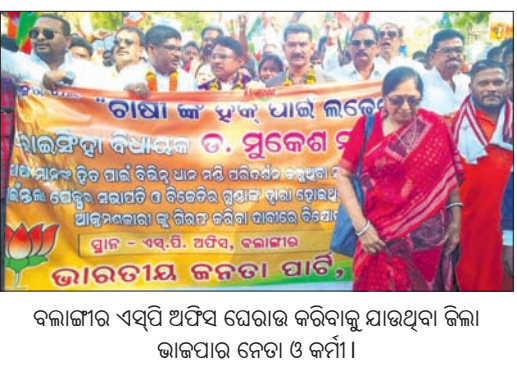
ବଲାଙ୍ଗୀର ଏସ୍ପି ଅର୍ପିସ ଘେରାଇ କରିବାକୁ ଯାଉଥିବା ଜିଲ୍ଲା ଭାଜପା ନେତା ଓ କର୍ମୀ ।