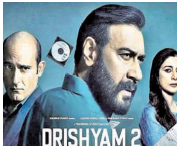
ଅବାବେଳେ ଦ୍ୱିତୀୟରେ ରହିଛି ଦ କଣ୍ଠୀର ପାଠକୁ । ଫିଲ୍ମରେ ସାଉଥ ଫିଲ୍ମ ଅଭିନେତ୍ରୀ

ଅକ୍ଷୟ ଦେବଗନ ଓ ତରୁଙ୍କ ଦ୍ୱାରା ଅଭିନୀତ 'ଦୃଶ୍ୟମ୍ ୨' ବିଶ୍ୱବ୍ୟାପୀ ୩୦୦ କୋଟି ଟଙ୍କାର ବ୍ୟବସାୟ କରିଛି । ତେବେ ବଲିଉଡର ଚଳିତ ବର୍ଷର ହିଟ୍ ଫିଲ୍ମ ତାଲିକାରେ ଏହି ଚଳଚ୍ଚିତ୍ର ସାମିଲ ହୋଇଛି । ୨୦୧୫ରେ ରିଲିଜ୍ ହୋଇଥିବା ଦୃଶ୍ୟମ୍ ସିକ୍ୱେଲ୍ ହେଉଛି ଦୃଶ୍ୟମ୍ ୨ । ତେବେ ପୁରସ୍କୃତ ଫିଲ୍ମ ସୂଚୀରେ ଏହା ତୃତୀୟ ସ୍ଥାନ ଅଧିକାର କରିଛି । ପ୍ରଥମରେ ବ୍ରହ୍ମାସ୍ତ୍ର