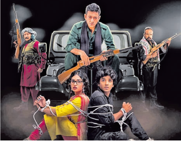
'ତୋର ମୋର କଟି' ଫିଲ୍ମର ଏକ ଦୃଶ୍ୟ