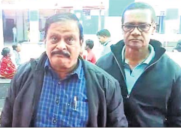
ଜିଲ୍ଲା ଓକିଲ ସଂସଦ ସଭାପତିଙ୍କୁ କୋର୍ଟରୁ ଆଳ କରାଯାଇଛି।

ଅନ୍ୟପକ୍ଷେ ପୂର୍ଣ୍ଣିମାକୋର୍ଟ ନିର୍ଦ୍ଦେଶକୁ ଆଳ କରି ଜିଲ୍ଲା ପୋଲିସର ଏଭଳି କାର୍ଯ୍ୟାନୁଷ୍ଠାନକୁ ନେଇ ସାଧାରଣରେ ଅସନ୍ତୋଷ ପ୍ରକାଶ ପାଇଛି। ପୋଲିସ ବିଚାରପତିମାନଙ୍କୁ ସୁରକ୍ଷା ଦେବାରେ ବିଫଳ ହେଲା। ହେଲେ ନିଜ ସମ୍ମାନ ରକ୍ଷା ପାଇଁ ଏବେ ଗିରଫ କରିଚାଲିଛି ବୋଲି ଲୋକେ ଅଭିଯୋଗ କରୁଛନ୍ତି।