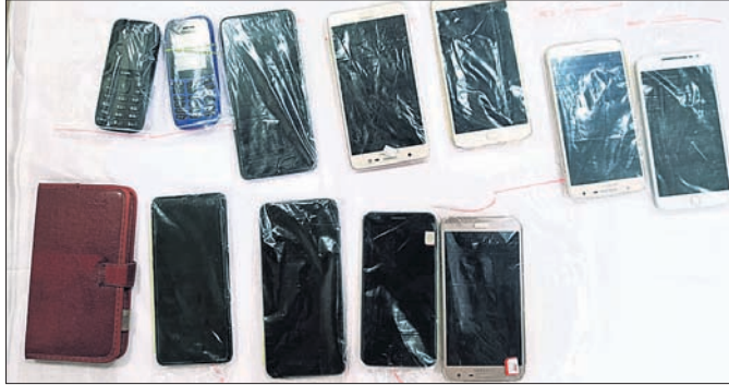
ଜବତ ମୋବାଇଲ ଫୋନ୍।

ଭାରତ ଆସୁଥିବା ଜଣାଇଥିଲେ। ଠିକ୍ ପରଦିନ ମହିଳା ଜଣକ ଏକ ଫୋନ୍ କଲ୍ ପାଇଥିଲେ। ଅପରପକ୍ଷରୁ ଜଣେ ମହିଳା ନୂଆଦିଲ୍ଲୀ ବିମାନବନ୍ଦର କଣ୍ଠସ୍ପର୍ଶ ଫଲୋ କରିବା ସହ ଇନ୍‌ଷ୍ଟାଗ୍ରାମ ମେସେଜିଂରେ ଚାଟ୍ କରିଥିଲେ। ସେ ତାଙ୍କୁ କହିଥିଲେ, ଆପଣଙ୍କର ଜଣେ ସମ୍ପର୍କୀୟ ଆସିଛନ୍ତି ଆପଣଙ୍କୁ ଭେଟିବାକୁ। ସେ ସାଙ୍ଗରେ ୧୦ ହଜାର ଯୁରୋ ପୁନା ଆଣିଛନ୍ତି, ଯାହାକି ବେଆଇନ। ତେଣୁ ତାଙ୍କୁ ଅଟକାଯାଇଛି। ତାଙ୍କୁ ଛାଡ଼ିବା ପାଇଁ ଅର୍ଥ ଜମା କରିବାକୁ ମହିଳା ସେଗୁଡ଼ିକ ନୂଆଦିଲ୍ଲୀର ବିଭିନ୍ନ ସ୍ଥାନରୁ ଚାକ୍ ବନ୍ଧୁଙ୍କୁ ପୁଚ୍ଛନାକରି ପାଇଁ ବିଭିନ୍ନ ପର୍ଯ୍ୟାୟରେ ଭିନ୍ନ ଭିନ୍ନ ଆକାଉଣ୍ଟରେ ଅର୍ଥ ଜମା କରିଥିଲେ। ହେଲେ ଦିନକୁ ଦିନ ଅପରପକ୍ଷରୁ ଅର୍ଥ ଜମା କରିବାର ଦାବି ବଢ଼ି ଚାଲିଥିଲା। ଏଥର ସେ ଠକାମିର ଶିକାର ହୋଇଥିବା ମହିଳା ବୁଝିଥିଲେ। ଏନେଇ ସେ କ୍ରାଇମ୍‌ସ୍‌ଟ୍ରାଷ୍ଟ ଆନାରେ ଗତ ନଭେମ୍ବର ୧୧ରେ ଅଭିଯୋଗ କରିବା ପରେ ଏକ ମାମଲା(ନଂ.୧୬/୨୨) ରୁଜୁ ହୋଇ ତଦନ୍ତ କରାଯାଇଥିଲା। ଏଥିରେ ଆଉ କାହାର ସମ୍ପୃକ୍ତ ରହିଛି, ଆକାଉଣ୍ଟ ଦେଖି ଉତ୍ତର-ପୂର୍ବାଞ୍ଚଳ ଲୋକଙ୍କର ହୋଇଥିବାବେଳେ