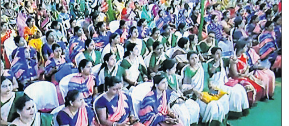
ମୁଖ୍ୟମନ୍ତ୍ରୀ ନବୀନ ପଟ୍ଟନାୟକ ଭୁବନେଶ୍ୱର ଭିତ୍ତିପ୍ରସ୍ତର କରୁଥିବା ସମୟରେ ମୁଖ୍ୟମନ୍ତ୍ରୀଙ୍କୁ ଭେଟିବା ପାଇଁ ଉପସ୍ଥିତ ମହିଳା। ସମାବେଶରେ ଉପସ୍ଥିତ ମହିଳା।