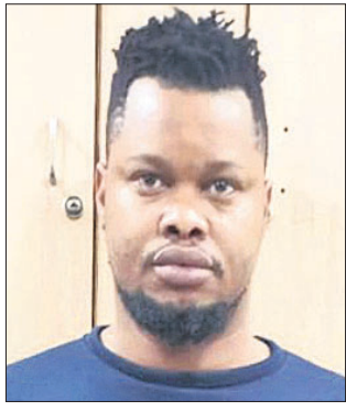
ପାତ୍ରିକ ରିଜୋରୋମ ଓରାଜାକା

ଓ ପାନ୍ କାର୍ଡ ଜବତ କରାଯାଇଛି। ପୂର୍ବରୁ ଅନୁସାରେ, କଟକର ମହିଳା ଜଣକ ଇନ୍‌ଷ୍ଟାଗ୍ରାମ ମାଧ୍ୟମରେ ସମ୍ପୃକ୍ତ ଅଭିଯୁକ୍ତଙ୍କ ବନ୍ଧୁ ପାଲଟିଥିଲେ। ଇନ୍‌ଷ୍ଟାଗ୍ରାମରେ ଅଭିଯୁକ୍ତ ନିଜକୁ ନେଦରଲ୍ୟାଣ୍ଡର ଜଣେ ଗାଇନାକୋଲୋଜିଷ୍ଟ ଭାବେ ପରିଚୟ ଦେଇ ତାଙ୍କ ନିକଟରେ ହେବାକୁ ପ୍ରୟାସ କରିଥିଲେ। ମହିଳା ଜଣକ ମଧ୍ୟ ତାଙ୍କୁ ଫଲୋ କରିବା ସହ ଇନ୍‌ଷ୍ଟାଗ୍ରାମ ମେସେଜିଂରେ ଚାଟ୍ କରିଥିଲେ। ସମୟ କ୍ରମେ ମହିଳା ଜଣକ ଅଭିଯୁକ୍ତ ଯୁବକଙ୍କୁ ନିଜ ସ୍ନାହୁଆପ୍ ନମ୍ବର ଦେଇଥିଲେ। ସ୍ନାହୁଆପ୍‌ରେ ପରସ୍ପର ମଧ୍ୟରେ ଚାଟ୍ ଚାଲିବାର ୫ ଦିନ ପରେ ଅଭିଯୁକ୍ତ ଜଣକ ମହିଳାଙ୍କୁ ବେଶା କରିବା ନିମନ୍ତେ