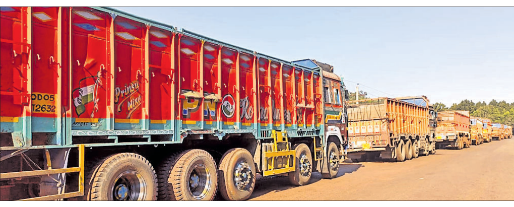
ରାସ୍ତାରେ ଅଟକି ରହିଥିବା ଖଣିକ ବୋହେଇ ଗାଡ଼ି।

କେନ୍ଦୁଝର ଜିଲ୍ଲାର ଅର୍ଥନୈତିକ ଗୁରୁତ୍ଵ ବହନ କରୁଥିବା ସଦର ବ୍ଲକ୍ ପଲ୍ଲୀଗଠନାୟକ ଯୋଡ଼ା ବ୍ଲକ୍ ବାମେନାବା ସଂଯୋଗ ରାସ୍ତାର ବିପର୍ଯ୍ୟୟ ଅବସ୍ଥା ଓ ଧୂଳିଧୂଆଁ ପ୍ରଦୂଷଣ ପ୍ରତିବାଦରେ ଜନ ଆନ୍ଦୋଳନ ଆରମ୍ଭ ହୋଇଛି। ସଦର ବ୍ଲକ୍ କଣ୍ଠରାପଣି ପଞ୍ଚାୟତବାସୀ ବୁଧବାର ଉଚ୍ଚ ରାସ୍ତାକୁ ଅବରୋଧ କରିଛନ୍ତି।