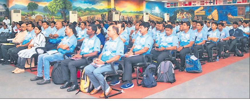
ଜାତୀୟ ବ୍ୟାଡ଼ମିଣ୍ଟନ କମ୍ପ୍ଲେକ୍ସରେ ଭାଗ ନେଇଥିବା ବୈଷୟିକ ଅଧିକାରୀମାନେ।