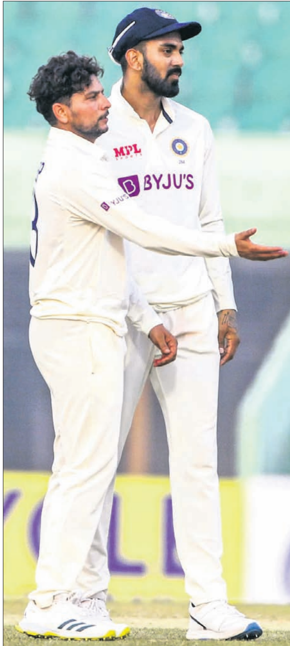
ଲୋକେଶ ରାହୁଲଙ୍କ ସହ କୁଲଦୀପ ଯାଦବ।

ଦୁଇ ପେସର ମହମ୍ମଦ ସିରାଜ ଓ ଉମେଶ ଯାଦବଙ୍କ ଘାତକ ବୋଲି କାରଣରୁ ବାଲାଦେଶ ୫୬ ରନରେ ୪ ଉଇକେଟ ହରାଇଥିଲା। ତେବେ କୁଲଦୀପ ଯାଦବ ଘାତକ ବୋଲି କରିବା ସହିତ ବାଲାଦେଶର ମଧ୍ୟକ୍ରମ ବ୍ୟାଟ୍ ବିପର୍ଯ୍ୟୟ ଘଟାଇଥିଲେ। ପ୍ରଥମ ଓଭରରେ ସେ ଶାକିବ ଅଲ ହସନଙ୍କୁ ଆଉଟ କରିଥିଲେ। ପରେ ଚପ୍ ଷ୍ଟୋରର ମୁଖ୍ୟକର ରହିନ୍ ୨୮ ରନ୍ କରି କୁଲଦୀପଙ୍କ ଦ୍ୱିତୀୟ ଶିକାର ହୋଇଥିଲେ। ମ୍ୟାଚର ୩୫ ତମ ଓଭରରେ କୁଲଦୀପ ଚୁଲ୍ଲ ହସନ(୧୬) ଓ ଚାଲକୁଲି ଇସଲାମ(୦)ଙ୍କୁ ଆଉଟ କରିଥିଲେ। ବାଲାଦେଶ ଅଲଆଉଟ ହେବା ନେଇ ଅନୁମାନ କରାଯାଉଥିବା ବେଳେ ମେହିଦୀ ହସନ ମିରାଜ ୧୬ ଓ ଏବାଦତ ହୋସେନ୍ ୧୩ ନବମ ଉଇକେଟରେ ୩୧ ରନ ଯୋଡ଼ିଥିଲେ। କୁଲଦୀପ ୩୩ ରନରେ ୪ ଉଇକେଟ ନେଇଥିବା ବେଳେ ମହମ୍ମଦ ସିରାଜ ୧୪ ରନରେ ୩ ଉଇକେଟ ନେଇଥିଲେ।