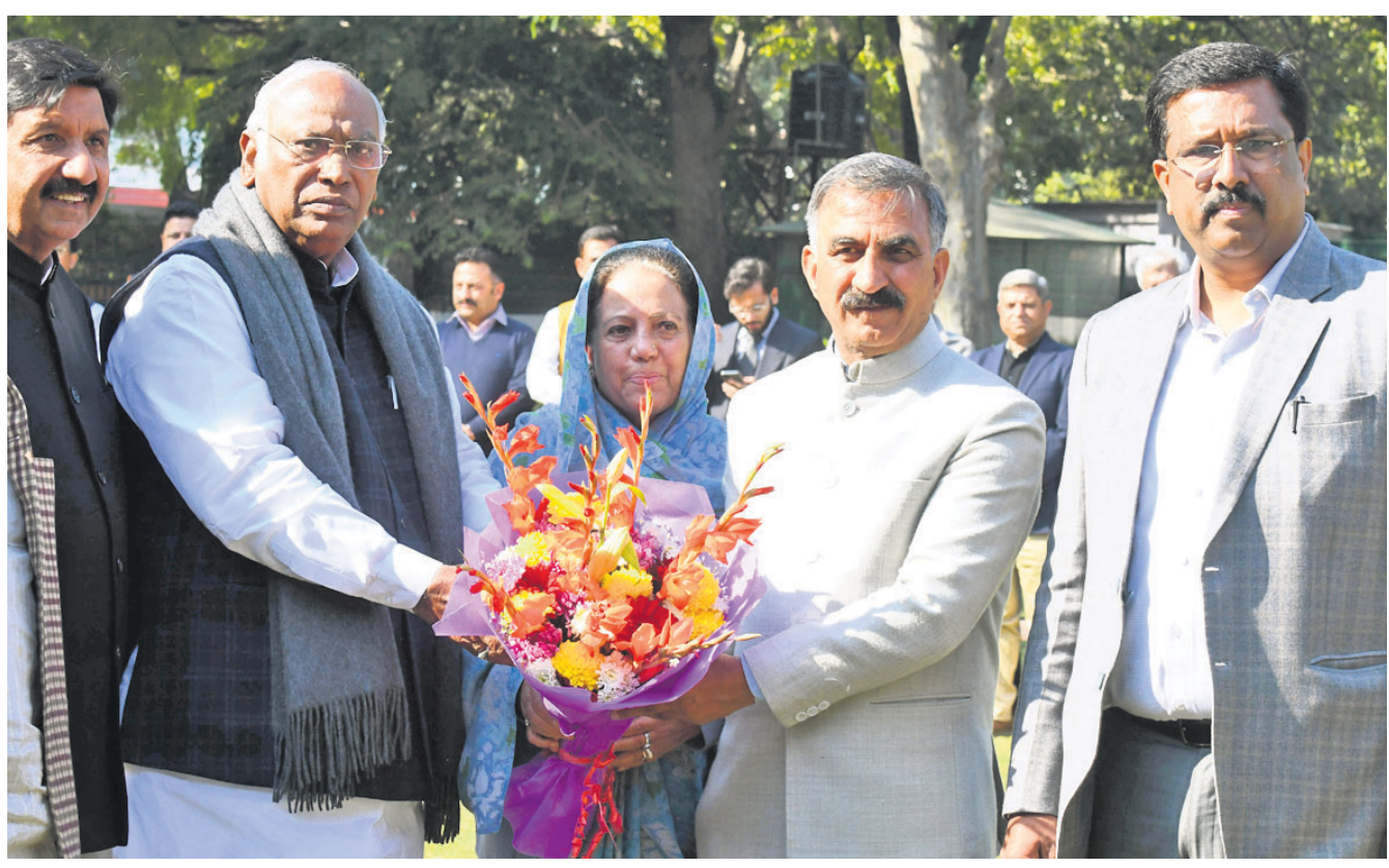
ନୂଆଦିଲ୍ଲୀରେ କଂଗ୍ରେସ ଅଧ୍ୟକ୍ଷ ମଲ୍ଲିକାର୍ଜୁନ ଖାର୍ବେଙ୍କୁ ସ୍ମରଣାର୍ଥକ ହିମାଚଳ ପ୍ରଦେଶର ନୂଆ ମୁଖ୍ୟମନ୍ତ୍ରୀ ସୁଖବିନ୍ଦର ସିଂ ସୁଖୁ ଓ ରାଜ୍ୟ କଂଗ୍ରେସ ସଭାପତି ପ୍ରତିଭା ସିଂ ସାକ୍ଷାତ କରୁଛନ୍ତି ।