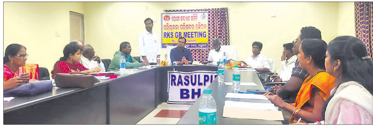
ବୈଠକରେ ଉପସ୍ଥିତ ବିଧାୟକ, ବିତିଓକ ସମେତ ଅନ୍ୟମାନେ ।