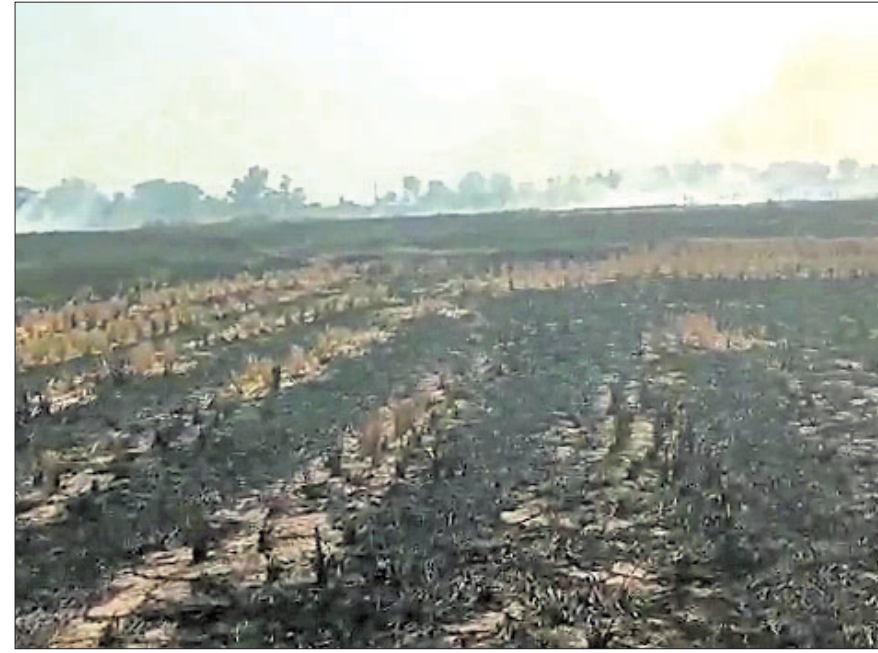
ଜଳି ଯାଇଥିବା ଧାନ ଫସଲ।