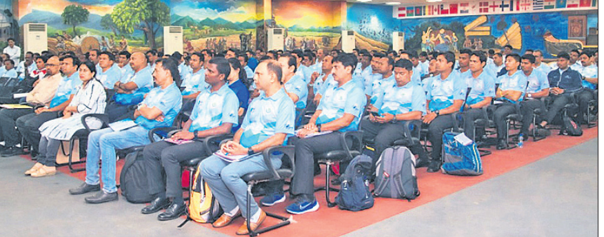
ଜାତୀୟ ବ୍ୟାଡ଼ମିଣ୍ଟନ କନ଼କ୍ଲେଭରେ ଭାଗ ନେଇଥିବା ଟେକ୍ନିକାଲ ଅଫିସିଆଲମାନେ।

ଭୁବନେଶ୍ୱର, ୧୫.୧୨ (ଗ୍ରୀଡ଼ା ପ୍ରତିନିଧି) ଭାରତୀୟ ବ୍ୟାଡ଼ମିଣ୍ଟନ ଇତିହାସରେ ପ୍ରଥମଥର ପାଇଁ ନ୍ୟାଶନାଲ ଟେକ୍ନିକାଲ ଅଫିସିଆଲ୍ କନ଼କ୍ଲେଭ କିଂ ପରିସରରେ ଚୁରୁବାର ଆରମ୍ଭ ହୋଇଛି। ରାଜ୍ୟ କ୍ରୀଡ଼ା ଓ ଯୁବସେବା ବିଭାଗ ସହଯୋଗରେ ବ୍ୟାଡ଼ମିଣ୍ଟନ ଆସୋସିଏସନ ଅଫ ଇଣ୍ଡିଆ ଓ ଓଡ଼ିଶା ରାଜ୍ୟ ବ୍ୟାଡ଼ମିଣ୍ଟନ ଆସୋସିଏସନ ଆୟୋଜିତ ଏହା ଆୟୋଜନ ହେଉଛି। କନ଼କ୍ଲେଭରେ ସାରା ଭାରତରୁ ଗ୍ରେଡ୍-୧ ଓ ଗ୍ରେଡ୍-୨ ପ୍ରସାର ୩୨୦ ଅଫିସିଆଲ୍ ଯୋଗ ଦେଇଛନ୍ତି। ଏହି କନ଼କ୍ଲେଭ