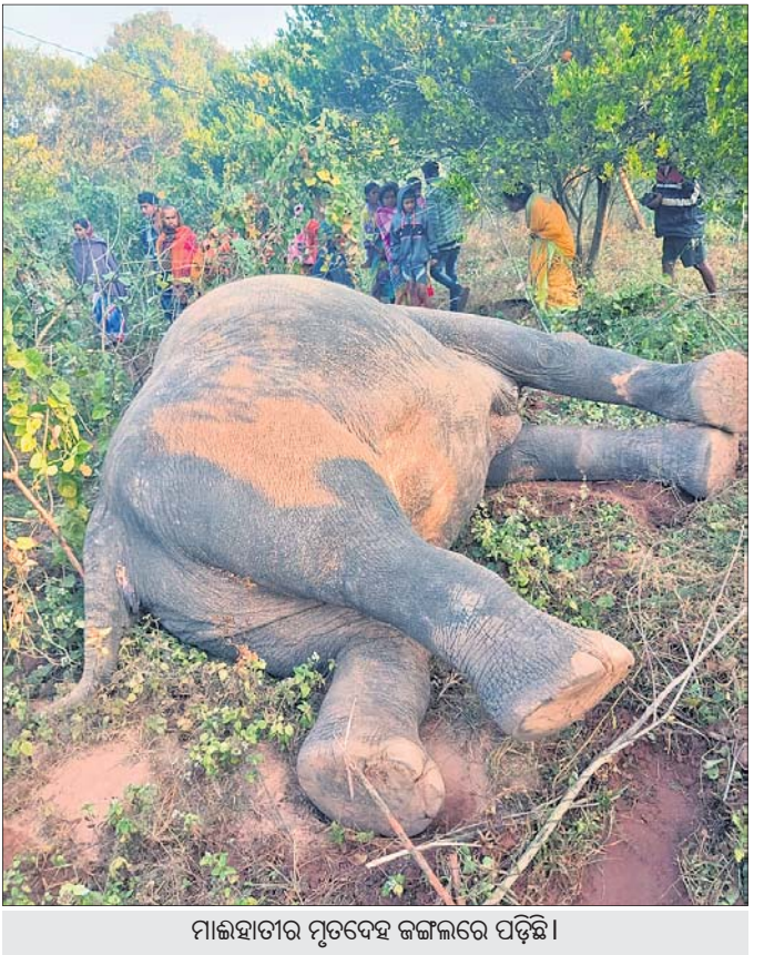
ମାଲହାତୀର ମୃତଦେହ ଜଙ୍ଗଲରେ ପଡ଼ିଛି।