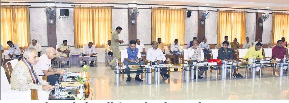
ପୁରୀ ଭଦ୍ରନିବାସରେ ଅନୁଷ୍ଠିତ ପରିଚାଳନା କମିଟି ବୈଠକରେ ଉପସ୍ଥିତ ଗଜପତି ମହାରାଜ, ଶ୍ରୀମନ୍ଦିର ପୁଞ୍ଜ ପ୍ରଶାସକ ଓ ଅନ୍ୟମାନେ।