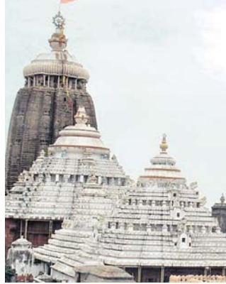
ପୁରୀ ଅଫିସ୍, ୧୫.୧୨