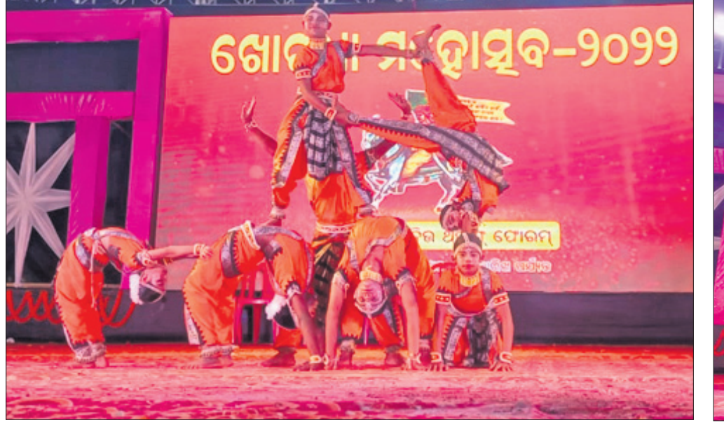
ଖୋର୍ଦ୍ଧା : ହାବେଲି ପଡ଼ିଆରେ ଅନୁଷ୍ଠିତ ଖୋର୍ଦ୍ଧା ମହୋତ୍ସବର ଦ୍ୱିତୀୟ ସନ୍ଧ୍ୟାରେ କଳାକାରଙ୍କ ଦ୍ୱାରା ପରିବେଷିତ ନୃତ୍ୟ।