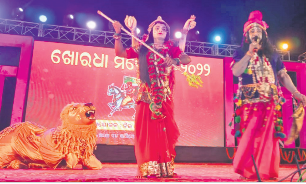
ନୃତ୍ୟ ମାଧ୍ୟମରେ କଳାକାରମାନେ ବନ୍ୟଜନ୍ତୁ ସୁରକ୍ଷାର ବାର୍ତ୍ତା ଦେଉଛନ୍ତି।