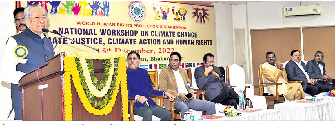
କର୍ମଶାଳାରେ ଆନ୍ତର୍ଜାତୀୟ ରାଜ୍ୟପାଳ ବିଶ୍ୱଭୂଷଣ ହରିଚନ୍ଦନ ଉଦ୍‌ଘାଟନ ଦେଉଛନ୍ତି ।