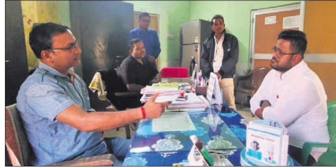
ପିପିଲିର ପ୍ରାଣୀ ଚିକିତ୍ସା ଅଧିକାରୀଙ୍କ ସହ ବିଧାୟକ ରୁଦ୍ରପ୍ରତାପ ମହାରଥୀ ଆଲୋଚନା କରୁଛନ୍ତି ।

ବିଭିନ୍ନ ପଞ୍ଚାୟତରେ ଜନସଚେତନତା ବୃଦ୍ଧି କରିବାକୁ ବିଧାୟକ ପରାମର୍ଶ ଦେଇଥିଲେ। ଏଥିରେ ପିପିଲି ଏନ୍‌ଏସି କାର୍ଯ୍ୟକ୍ରମ କରିବାକୁ ବିଧାୟକ ପରାମର୍ଶ ଦେଇଥିଲେ।