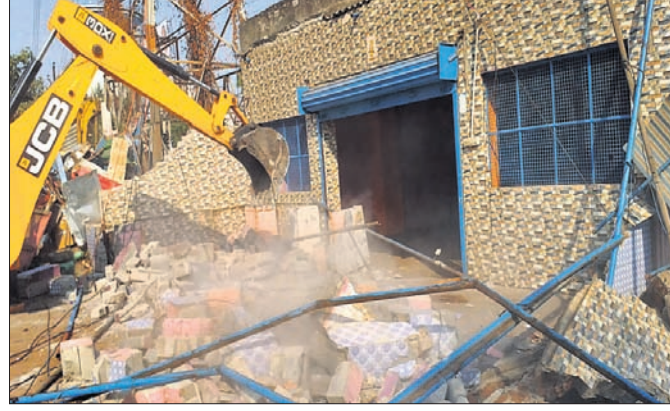
ବାସବାସୀ ରାଷ୍ଟ୍ର ମଠ ରାଷ୍ଟ୍ରରେ ଥିବା ବେଆଇନ ଦୋକାନଗୁଡ଼ିକୁ ଉଚ୍ଛେଦ କରାଯାଇଛି ।

ରାଷ୍ଟ୍ର ପାର୍ଶ୍ୱକୁ ଜବରଦଖଲ ଉଚ୍ଛେଦ ଚାଲିଛି ।