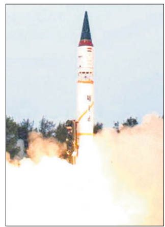
ବାଲେଶ୍ୱର ଅଫିସ୍, ୧୫।୧୨

ପ୍ରତିରକ୍ଷା ଅନୁସନ୍ଧାନ ଏବଂ ବିକାଶ ସଙ୍ଗଠନ (ଡିଆର୍ଡିଓ) ପକ୍ଷରୁ ଗୁରୁବାର ସନ୍ଧ୍ୟା ୫ଟା ୫୦ ମିନିଟ୍ରେ ଧ୍ୟାନରାସ୍ତିତ ଅବସ୍ଥାରେ କଳାପ ଦ୍ୱୀପରୁ ଆକାଶଦେଶ୍ୟା ବାଲିଷ୍ଟିକ ମିଶାଇଲ୍ ଅଗ୍ନି-୫ର ବ୍ୟବହାରିକ ପରୀକ୍ଷଣ କରାଯାଇଛି। ଏହି ପରୀକ୍ଷଣ ସଫଳ ହୋଇଥିବା ତିଆରିତ ପକ୍ଷରୁ କୁହାଯାଇଛି। ତିଆରିତ ଓ ଦ୍ୱାରା ପ୍ରସ୍ତୁତ ଏହି ମିଶାଇଲ୍ ଏକା ସଙ୍ଗରେ ଅନେକ ଯୁଦ୍ଧାସ୍ତ୍ର ନେବାରେ ସମର୍ଥ। ଏହାର ଲକ୍ଷ୍ୟଭେଦ କ୍ଷମତା ୫୫୦ କି.ମି.ରୁ କିଲୋମିଟର ଥିବାବେଳେ ୧୫୦୦ କି.ଗ୍ରା. ଆଣବିକ ଯୁଦ୍ଧାସ୍ତ୍ର ବହନ କରିବାର କ୍ଷମତା ରହିଛି। ଏହାର ଲମ୍ବ ୧୬.୫ ମିଟର ଏବଂ ଓଜନ ୫୦ ହଜାର କି.ଗ୍ରା. ଅଗ୍ନି-୫ ଏକାଧାରରେ ଅନେକ ଟାର୍ଗେଟ୍ କୁ ଲକ୍ଷ୍ୟଭେଦ କରିବା ସହ ଯଥା ପ୍ରତି ୨୯ ହଜାର ୪୦୧ କି.ମି. ବେଗରେ ଯାଇପାରିବ।