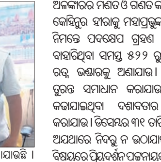
ଗଜପତି ମହାରାଜଙ୍କ ଉଦ୍ଦେଶ୍ୟରେ ଦାବିପତ୍ର ଦିଆଯାଇଛି ।