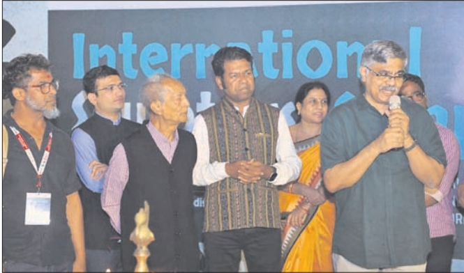
କାର୍ଯ୍ୟକ୍ରମ ଉଦ୍‌ଘାଟନ ଅବସରରେ ଉପସ୍ଥିତ ଅତିଥିମାନେ ।