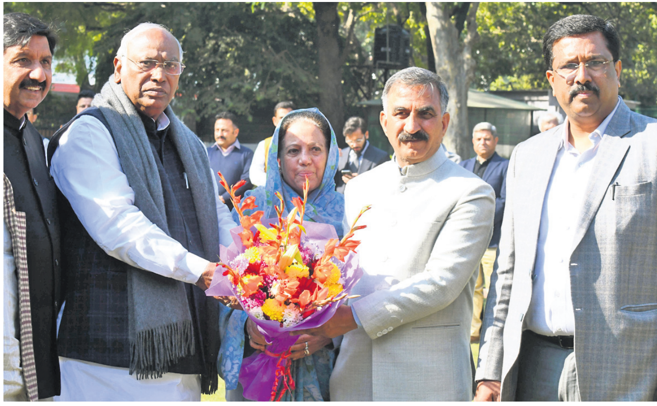
ନୂଆଦିଲ୍ଲୀରେ କଂଗ୍ରେସ ଅଧ୍ୟକ୍ଷ ମଲ୍ଲିକାର୍ଜୁନ ଖାର୍ବେଙ୍କୁ ସ୍ମରଣାର ହିମାଚଳ ପ୍ରଦେଶର ନୂଆ ମୁଖ୍ୟମନ୍ତ୍ରୀ ସୁଖବିନ୍ଦର ସିଂ ସୁଖୁ ଓ ରାଜ୍ୟ କଂଗ୍ରେସ ସଭାପତି ପ୍ରତିଭା ସିଂ ସାକ୍ଷାତ କରୁଛନ୍ତି ।