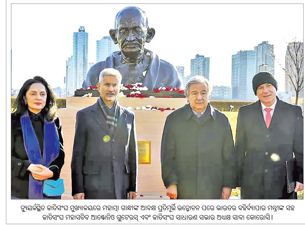
ସ୍ୱୟମ୍‌ସେବା କାରିଷ୍ୟ ଗୁମ୍ଫାକପ୍ପରେ ମହାତ୍ମା ଗାନ୍ଧୀଙ୍କ ଆବଶ୍ୟକ ପ୍ରତିମୂର୍ତ୍ତି ଉଦ୍ଘାଟନ ପରେ ଭାରତର ବହିଷ୍କାର ମନ୍ତ୍ରୀଙ୍କ ସହ କାରିଷ୍ୟ ମହାସଚିବ ଆଶୋକିଂ ଓ ଗୁଡ଼େସ୍ ଏବଂ କାରିଷ୍ୟ ସାଧାରଣ ସଭାର ଅଧ୍ୟକ୍ଷ ସାବା କୋରୋସି।