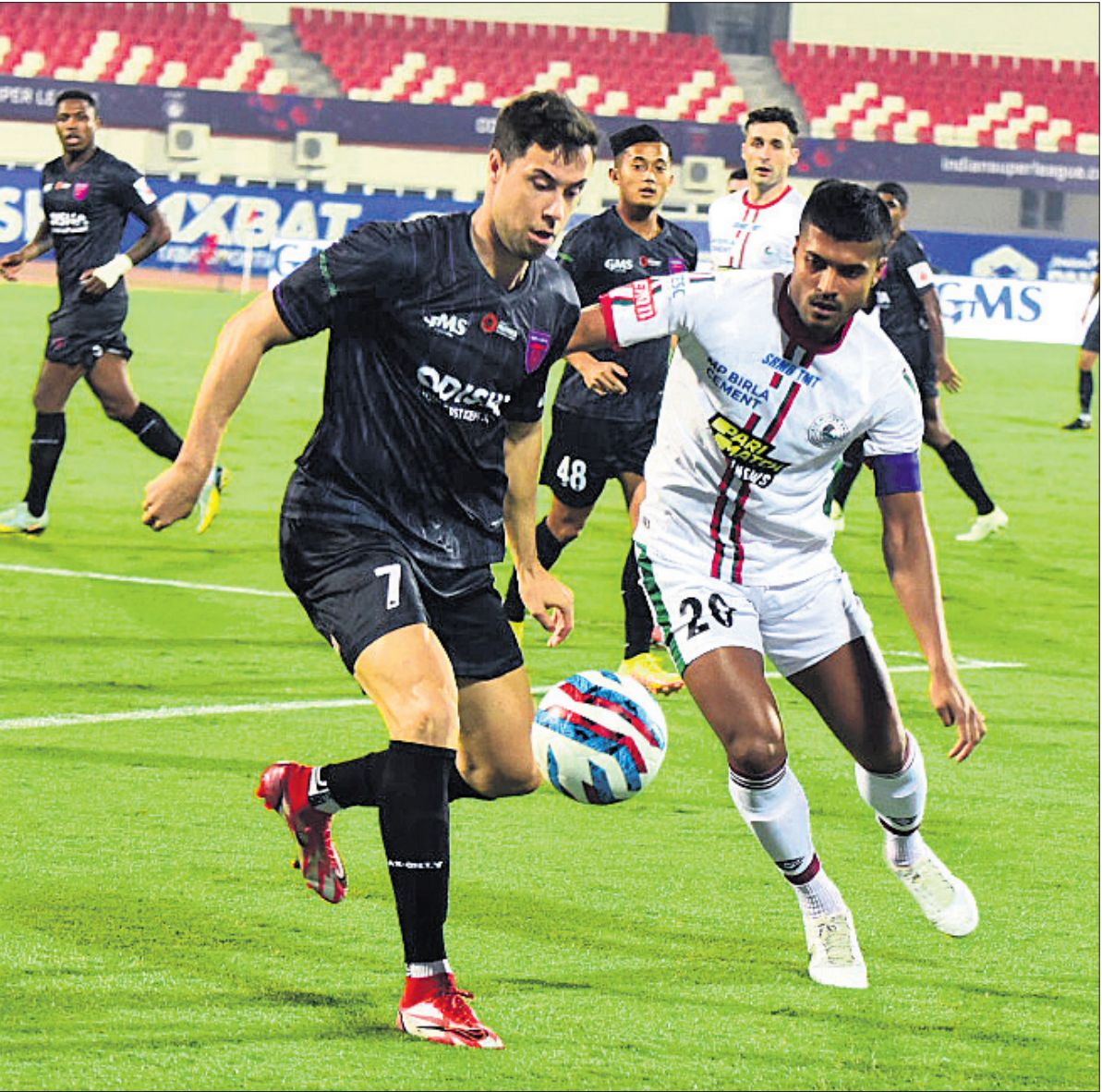
ଭୁବନେଶ୍ୱରର କଳିଙ୍ଗ ଷ୍ଟାଡ଼ିୟମରେ ଗୁରୁବାର ଓଡ଼ିଶା ଏଫ୍ସି ଓ ଏଟିସି ମୋହନବାଗାନ ମଧ୍ୟରେ ଅନୁଷ୍ଠିତ ଇଣ୍ଡିଆନ ସୁପରଲିଗ୍ ମ୍ୟାଚ ।