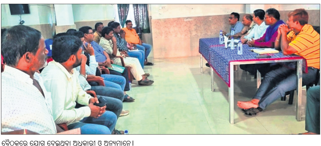
ଦୈନିକରେ ଯୋଗ ଦେଇଥିବା ଅଧିକାରୀ ଓ ଅନ୍ୟମାନେ।