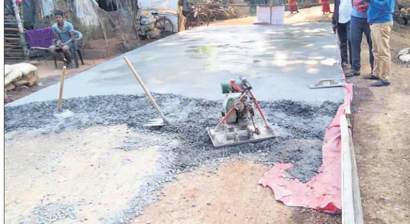
କଟାସ ବ୍ଲକର ଗଢ଼ିଶାଗୋଦାଠାରୁ ଜଳିଆ ବନ୍ଧର ପର୍ଯ୍ୟନ୍ତ ଦୟାନଦୀ ବନ୍ଧ କାମ ଚାଲିଛି ।

ନାଲି ମୋରମ ଛିଣ୍ଡା ଯାଉଛି। ଚିମ୍ପୁ ଉପରେ ୮ ଇଞ୍ଚର ତଳେ ପକାଇବାକୁ ବ୍ୟବସ୍ଥା ଥିବା ଏବଂ ତଳେ ପକାଇବାକୁ ସୁଦ୍ଧେ ରଖିବା ପାଇଁ କଂକ୍ରିଟ୍ ବନ୍ଧ ହେବାକୁ ଥିବାବେଳେ ଉଚ୍ଚ ଠିକାଦାର ବନ୍ଧର ଦାବୀ ପାଟି ଖୋଲି ବନ୍ଧ ଥିଆର କରୁଛନ୍ତି। ଫଳରେ ଥରକ ବନ୍ଧରେ ଦୁଇପାର୍ଶ୍ୱ ମାଟି ଯୋଡ଼ାଯାଇ ତଳେ ମାଟି ଯିବାର ସମ୍ଭାବନା ରହିଛି। ଯେଉଁ ୮ଈଞ୍ଚ ତଳେ କରାଯିବା ବଦଳରେ ମାତ୍ର ୬ଈଞ୍ଚ ତଳେ କରାଯାଉଛି। ତଳେ ମଧ୍ୟରେ ଲୁହାରତ୍ତ ଦେବାର ବ୍ୟବସ୍ଥା ନ ଥିବାରୁ ବନ୍ଧା ସମୟରେ ତଳେ କୁଡ଼ିକ ମାଟି ଯିବାର ଖଞ୍ଜ ଖଞ୍ଜ ହୋଇଯିବାର ସମ୍ଭାବନା ରହିଛି। ତଳେ କେବେଳେ ମାଟି ଚିମ୍ପୁ, ୨ପେଟି ବାଲି, ଗୋଟିଏ ପେଟି ସିମେଣ୍ଟ ଦିଆଯାଉଥିବାରୁ ତାହା ଚିରସ୍ଥାୟୀ ନୁହେଁ ବୋଲି ଗଢ଼ିଶାଗୋଦା ଗ୍ରାମବାସୀ ଜିଲ୍ଲାପାଳଙ୍କ ନିକଟରେ ଅଭିଯୋଗ କରିଛନ୍ତି। ନଦୀବନ୍ଧ ତଳେ ଦୁଇପାର୍ଶ୍ୱ ଗୁଣ୍ଡା ପାଇଁ କଂକ୍ରିଟ୍ ଖାଲ ନିର୍ମାଣ କରାଯିବ। ସହିତ ତଳେ ମଧ୍ୟରେ ଲୁହାରତ୍ତ ଦେବା ପାଇଁ ଗ୍ରାମବାସୀ ଦାବିକରିଛନ୍ତି। ଏ ସମ୍ପର୍କରେ ଜଳସେଚନ ବିଭାଗ ସହକାରୀ ସମ୍ପାଦକ ବେହେରାଙ୍କୁ ପଚାରିବାରୁ, ସେ କୌଣସି ସମ୍ଭାବନା ଉପରେ ବିଭାଗର ଦୃଷ୍ଟିରେ ନ ଥିଲେ।