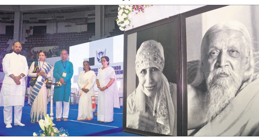
ସର୍ବଭାରତୀୟ ମହିଳା ପାଠକ୍ରମ ସମ୍ମିଳନୀ ଉଦ୍ଘାଟନ ଅବସରରେ ଉପସ୍ଥିତ ଅତିଥିବୃନ୍ଦ।