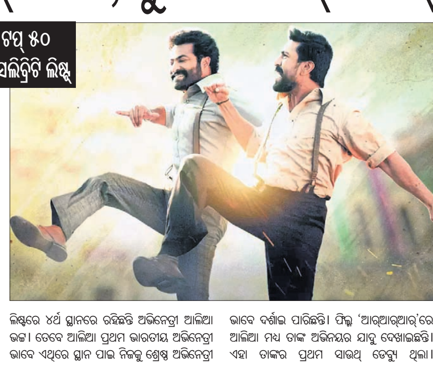
ୟୁକେର ଚପ୍ ୫୦ ଏସିଆନ୍ ସେଲିବ୍ରିଟି ଲିଷ୍ଟ

ଫୁଲ: ଚଳିତବର୍ଷ ଚପ୍ ୫୦ ଏସିଆନ୍ ସେଲିବ୍ରିଟି ଲିଷ୍ଟର ଚପ୍‌ରେ ସାଉଥ୍ ଅଭିନେତା ରାମଚରଣ ଏବଂ ଜୁନିୟର ଏନ୍‌ଟିଆର୍ ତାଙ୍କ ସ୍ଥାନ ପକ୍ଷା କରିଛନ୍ତି। ନିର୍ଦ୍ଦେଶକ ଏସ୍‌ଏସ୍ ରାଜମୌଳିକ ଦ୍ୱାରା ପ୍ରସ୍ତୁତ ଫିଲ୍ମ 'ଆରୁଆରୁଆର୍'ରେ ଏହି ଦୁଇ ସାଉଥ୍ ଅଭିନେତାଙ୍କ ଅଭିନୟରେ ଦର୍ଶକ ବିମୋହିତ ହୋଇପଡ଼ିଥିଲେ। ଫିଲ୍ମଟି ୫ଟି ଭାଷାରେ ମାର୍କରେ ରିଲିଜ୍ ହୋଇଥିବାବେଳେ ବିଦେଶରେ ଏହା ଧମାଳ କରିଥିଲା। ରାମଚରଣ ଏବଂ ଜୁନିୟର ଏନ୍‌ଟିଆର୍ ଅନ୍ତର୍ଜାତୀୟ ରେକର୍ଡକୁ ଭାଙ୍ଗିବା ସହ ୨ଟି ଗୋଲ୍ଡେନ୍ ଗ୍ଲୋବ୍ ୨୦୨୩ ପାଇଁ ଫିଲ୍ମ ଆରୁଆରୁଆର୍ ନୋମିନେଟ୍ ହୋଇଛି। ବେଷ୍ଟ ବିଦେଶୀ ଭାଷାମୁକ୍ତ ଫିଲ୍ମ, ବେଷ୍ଟ ଗୀତ ଚେଲ୍ସୁରୁରେ ନାଟୁ ନାଟୁ ଏବଂ ବେଷ୍ଟ ଭିଲ୍ମ ଆଲ ଇଫେକ୍ଟ୍ ପାଇଁ ଫିଲ୍ମ 'ଆରୁଆରୁଆର୍' ୨୮ତମ ଆନ୍ତର୍ଜାତୀୟ କ୍ରିଟିକ୍ ଚପ୍ ପାଇଁ ନୋମିନେଟ୍ ହୋଇଛି। ଏହି ଚପ୍ ଲିଷ୍ଟରେ ପାକିସ୍ତାନ ଅଭିନେତା ଫାଖର୍ ଖାନ୍ ୨ୟ ସ୍ଥାନରେ ରହିଥିବାବେଳେ ବିଦେଶୀ-ଭାରତୀୟ ଅଭିନେତା ସାଇମନ୍ ଆସ୍କେଲ ୩ୟ ସ୍ଥାନରେ ରହିଛନ୍ତି। ଏହି ଚପ୍