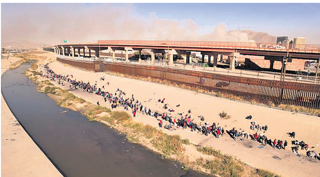
ମେକ୍ସିକୋର ଦୁରାଙ୍ଗୋ ପ୍ରଦେଶରେ ଅପହୃତ ପ୍ରବାସୀମାନଙ୍କୁ ସେନା ମୁକ୍ତ କରିବା ପରେ ସେମାନେ ଭିଡ଼ି ବ୍ରାଭୋ ନଦୀ ଦେଇ ସୀମା ଅତିକ୍ରମ କରୁଥିଲେ। କିନ୍ତୁ ସୀମାରେ ଆମେରିକା ପାଟ୍ରୋଲିଂ ଏକେଣ୍ଡମାନେ ପ୍ରହରା ଦେଉଥିବାରୁ ସେମାନେ ଫେରିଯାଇଛନ୍ତି।