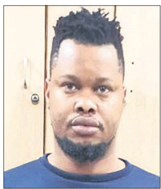
ପାଟିଲ୍ ଚିତ୍ତୋରୋମ ଓରାଜାକା

କଲୋନୀରେ ରହୁଥିଲେ। ତାଙ୍କଠାରୁ ୧୨ଟି ଡେବିଡ୍ କାର୍ଡ, ୧୨ ମୋବାଇଲ୍ ଫୋନ୍, ୨୨ ବ୍ୟାଙ୍କ ପାସ୍‌ବୁକ୍, ୧୦ ବ୍ୟାଙ୍କ ଟେକ୍ ବୁକ୍, ଯୁପିଆଇ/ଆଇଏମ୍‌ପିଏସ୍ ଆର୍ଡ୍‌ଫ୍