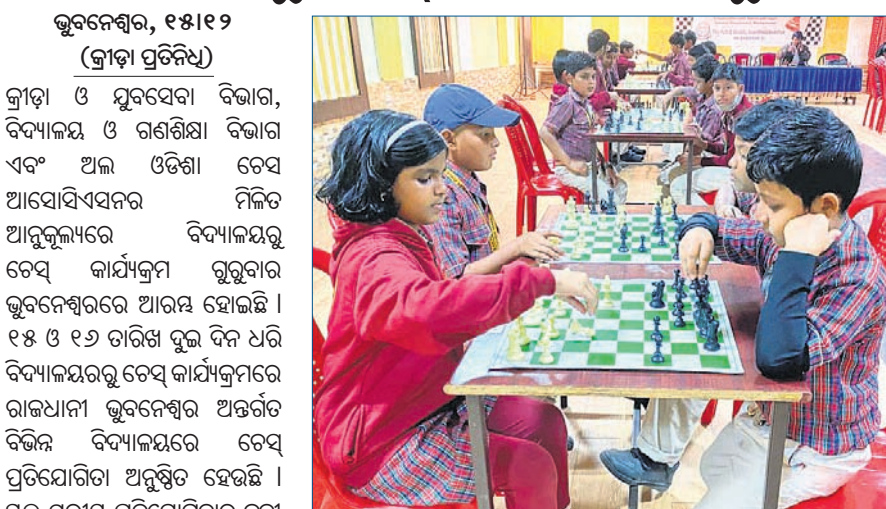
ସ୍କୁଲରେ ପିଲାମାନେ ଚେଷ୍ଟା ଖେଳୁଛନ୍ତି ।

କ୍ରୀଡ଼ା ଓ ଯୁବସେବା ବିଭାଗ, ବିଦ୍ୟାଳୟ ଓ ଗଣଶିକ୍ଷା ବିଭାଗ ଏବଂ ଅଲ ଓଡ଼ିଶା ଚେଷ୍ଟା ଆୟୋଜନରେ ବିଦ୍ୟାଳୟରୁ ଚେଷ୍ଟା କାର୍ଯ୍ୟକ୍ରମ ଗୁରୁବାର ଭୁବନେଶ୍ୱରରେ ଆରମ୍ଭ ହୋଇଛି । ୧୫ ଓ ୧୬ ତାରିଖ ଦୁଇ ଦିନ ଧରି ବିଦ୍ୟାଳୟରୁ ଚେଷ୍ଟା କାର୍ଯ୍ୟକ୍ରମରେ ରାଜଧାନୀ ଭୁବନେଶ୍ୱର ଅନ୍ତର୍ଗତ ବିଭିନ୍ନ ବିଦ୍ୟାଳୟରେ ଚେଷ୍ଟା ପ୍ରତିଯୋଗିତା ଅନୁଷ୍ଠିତ ହେଉଛି । ସ୍କୁଲ ପ୍ରମାଣ ପ୍ରତିଯୋଗିତାକୁ କୃତୀ ପ୍ରତିଯୋଗୀ ଚୟନ କରାଯାଇ ଆଗାମୀ ଦିନରେ ଭୁବନେଶ୍ୱର ଓପନ ଚେଷ୍ଟା ଅନୁଷ୍ଠିତ ହେବ । ପ୍ରକାଶ ଯୋଗ୍ୟ ଯେ, ରାଜ୍ୟ ସରକାର ବିଭିନ୍ନ କ୍ରୀଡ଼ାକୁ ପ୍ରୋତ୍ସାହନ ଦେଇ ଆସୁଛନ୍ତି । ହକି, ଫୁଟବଲ, କ୍ରିକେଟ, ବ୍ୟାଡମିଣ୍ଟନ, ସତରଂଗ ପରି ବୌଦ୍ଧିକ ଖେଳ ଚେଷ୍ଟା ପ୍ରତି ପିଲାଙ୍କ ଆଗ୍ରହ ବଢ଼ିଛି । ଏହି ପରିପ୍ରେକ୍ଷାରେ ଚେଷ୍ଟା ଖେଳକୁ ଅଧିକ ପରିବ୍ୟାପ୍ତ କରିବା ଉଦ୍ଦେଶ୍ୟରେ ବିଦ୍ୟାଳୟ ପ୍ରଭୃତି