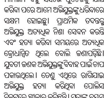
ପୁରୀ ଅଫିସ୍, ୧୫.୧୨

ଶ୍ରୀମନ୍ଦିରରେ ମୋବାଇଲ ଫୋନ୍‌କୁ ନେଇ ଦୀର୍ଘଦିନ ଧରି ଲାଗିରହିଥିବା ବିବାଦ ଉପରେ ପୂର୍ଣ୍ଣସ୍ୱେଚ୍ଛା ପଡ଼ିଛି। ଏଣିକି କେହି ବି ଶ୍ରୀମନ୍ଦିର ଭିତରକୁ ମୋବାଇଲ ଫୋନ୍ ନେଇପାରିବେ ନାହିଁ। ପୂର୍ବରୁ ଶ୍ରୀମନ୍ଦିର ପ୍ରବେଶ ବେଳେ ଭକ୍ତଙ୍କୁ ଉପରେ ମୋବାଇଲ ନେବାକୁ କଟକଣା ଲଗାଯାଇଥିବା ବେଳେ ଆସନ୍ତା କାର୍ତ୍ତିକୀ ୧୦ରୁ ଶ୍ରୀମନ୍ଦିରକୁ କୌଣସି ସେବାୟତ କିମ୍ବା ପୋଲିସ୍, ଅଧିକାରୀ ଶ୍ରୀମନ୍ଦିରକୁ ମୋବାଇଲ ନେଇପାରିବେ ନାହିଁ। ଶ୍ରୀମନ୍ଦିର