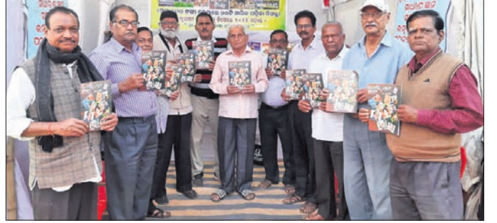
ପତ୍ରିକା ଉନ୍ମୋଚନ ଅବସରରେ ଉପସ୍ଥିତ ଅତିଥିମାନେ।