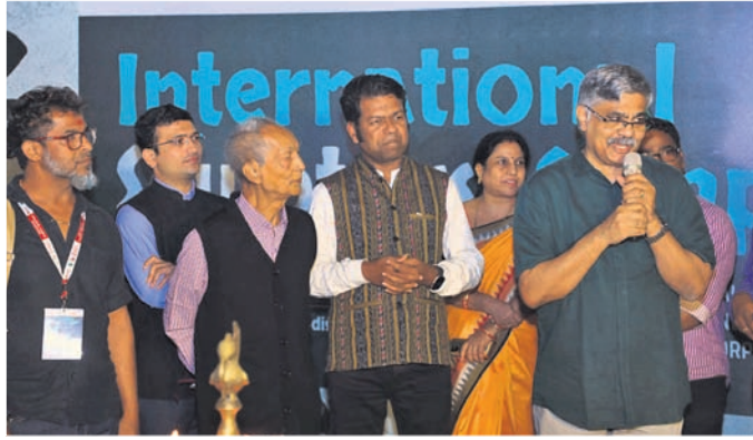
କାର୍ଯ୍ୟକ୍ରମ ଉଦ୍‌ଘାଟନ ଅବସରରେ ଉପସ୍ଥିତ ଅତିଥିମାନେ ।